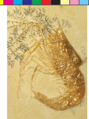
Antrimpos sp. Jurásico Superior. Colección de paleontología sistemática de invertebrados. Vitrina 228