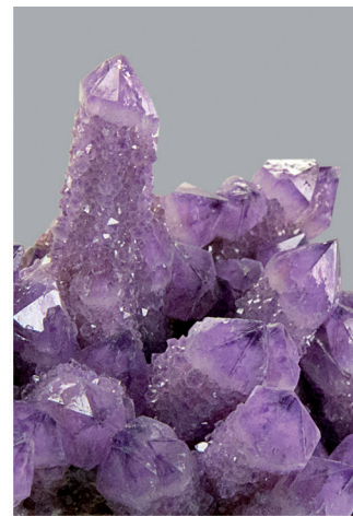
Cuarzo (amatista). Colección de sistemática mineral. Vitrina 19