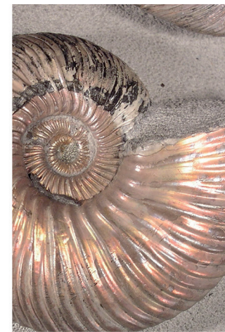
Quenstedticeras sp. Jurásico Superior. Colección de fósiles extranjeros. Vitrina 74