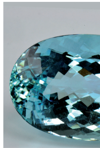
Berilo azul (aguamarina). Colección de gemas. Vitrina 283