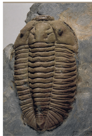
Prionocheilus mendax . Ordovícico Medio. Colección de paleontología sistemática de invertebrados. Vitrina 229