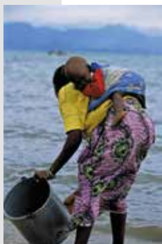
Cogiendo agua. Nikopola, Malawi

El día 22 de marzo. Día Mundial del Agua. El Día Mundial del Agua se celebra anualmente el 22 de marzo, por iniciativa de las Naciones Unidas, como un medio de llamar la atención sobre la importancia del agua dulce y la defensa de la gestión sostenible de los recursos de agua dulce.