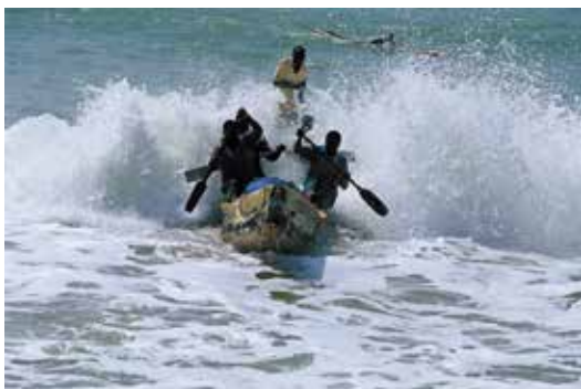
Con gran habilidad consiguen llegar a la orilla. Abdografo, Togo