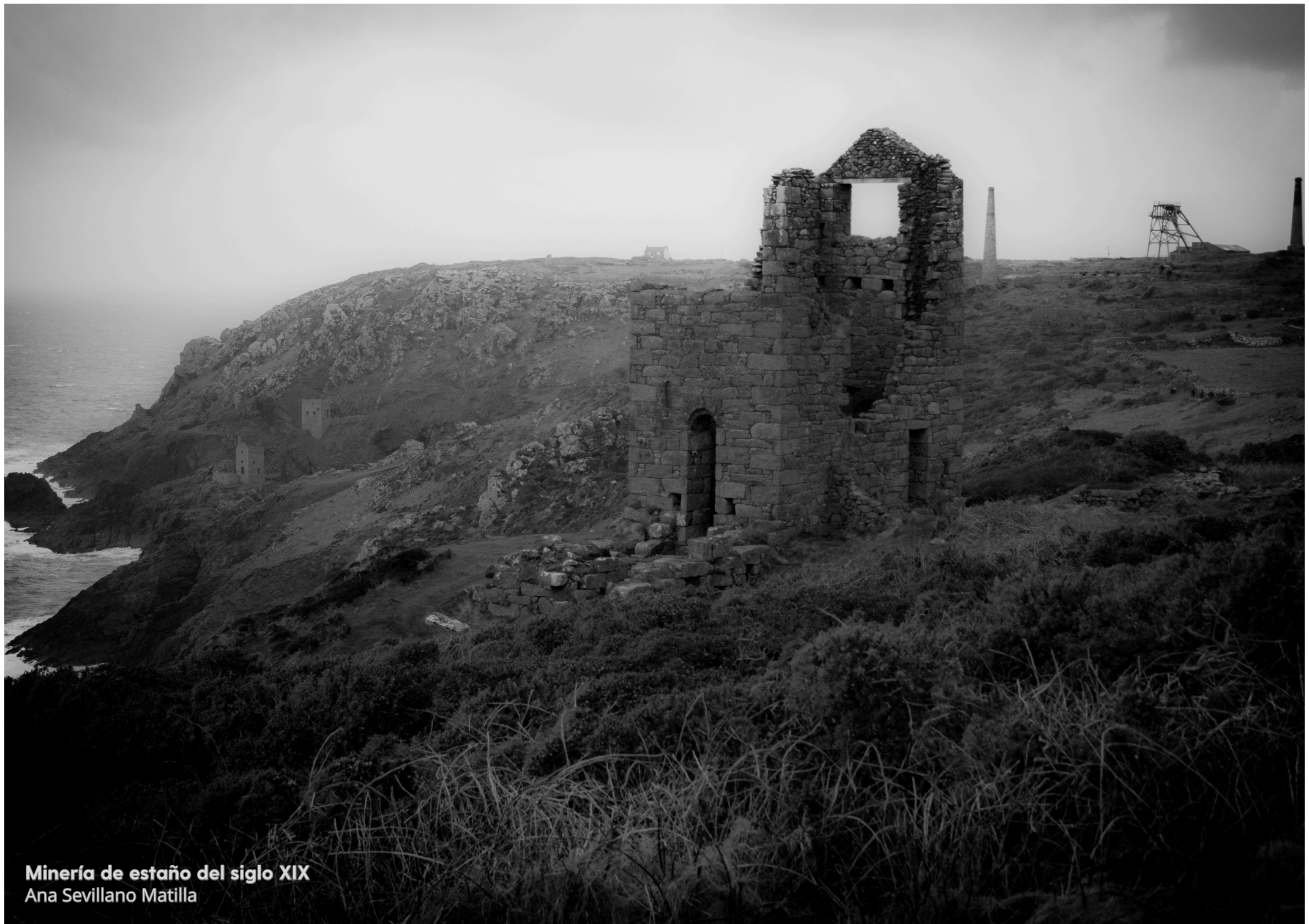
Minería de estaño del siglo XIX Ana Sevillano Matilla