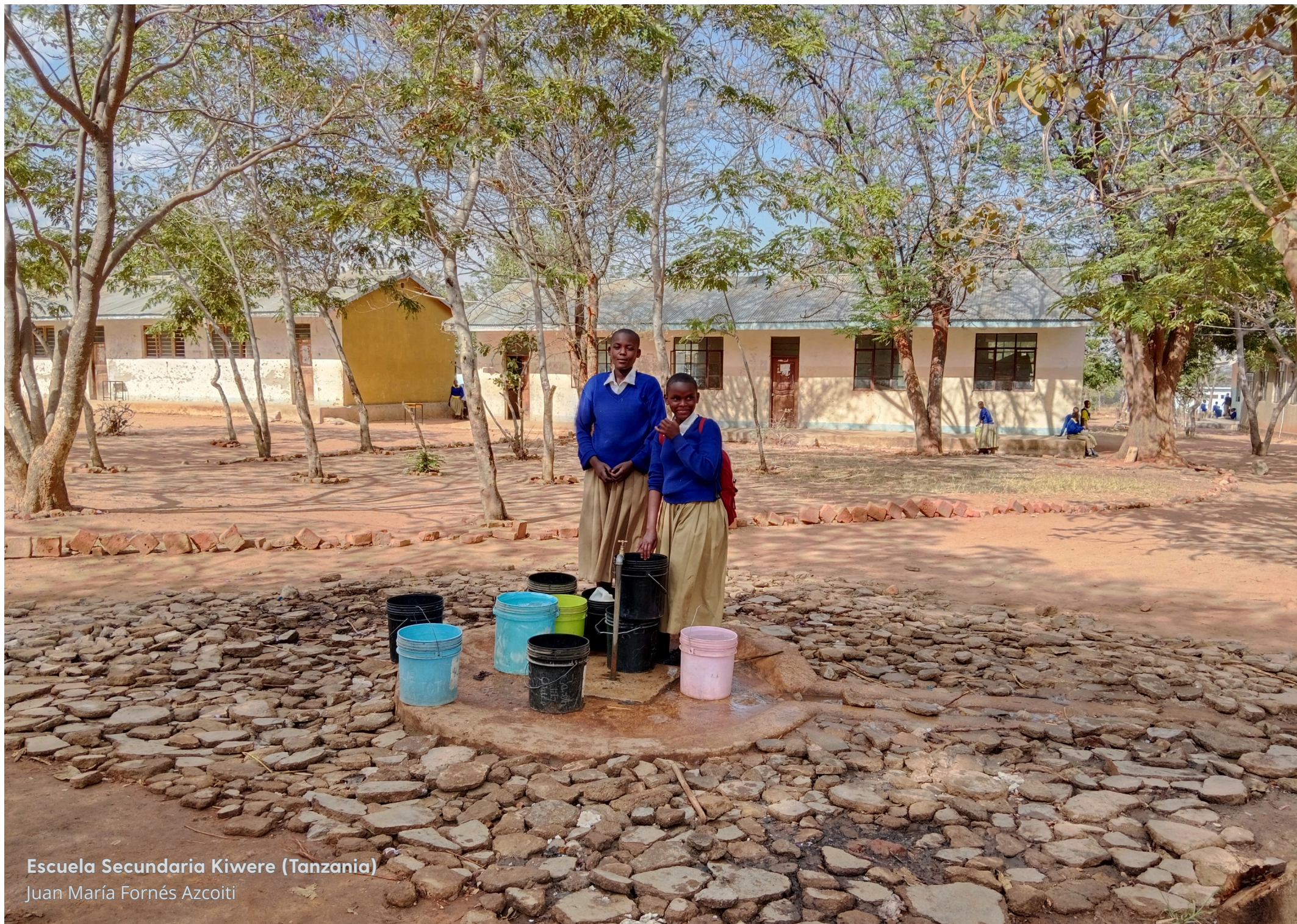
Escuela Secundaria Kiwere (Tanzania)