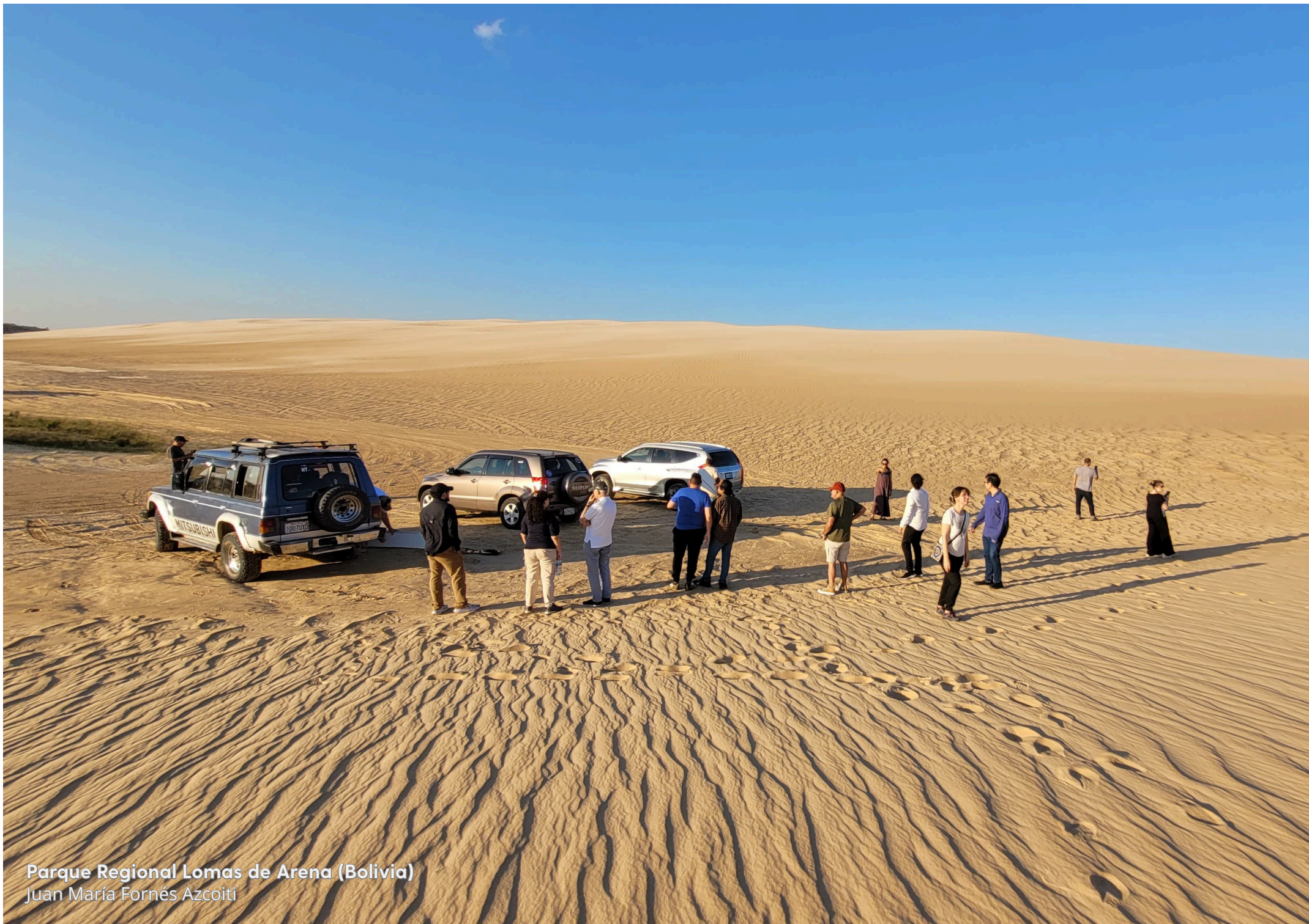
Parque Regional Lomas de Arena (Bolivia) Juan María Fornés Azcoiti