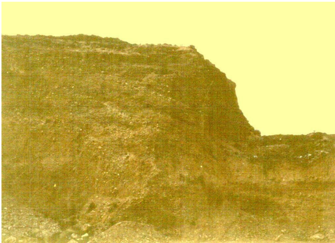
Niveles de grava de la terraza buzando hacia el oeste. Nótese la mayor horizontalidad de los niveles superiores.