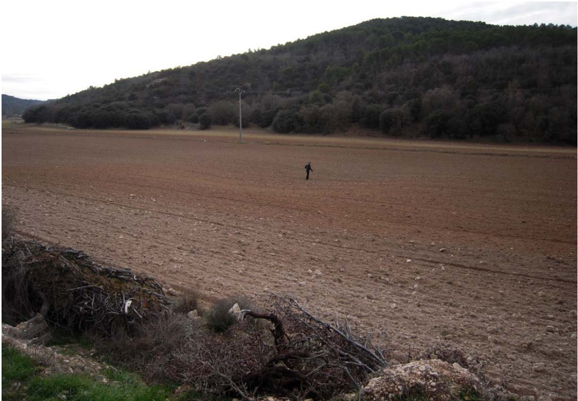
Figura o Foto 13: Otra dolina menos evidentes aguas arriba de la zona en cuestión. El Sr. que sirve de escala está situado en la zona más deprimida de la misma.