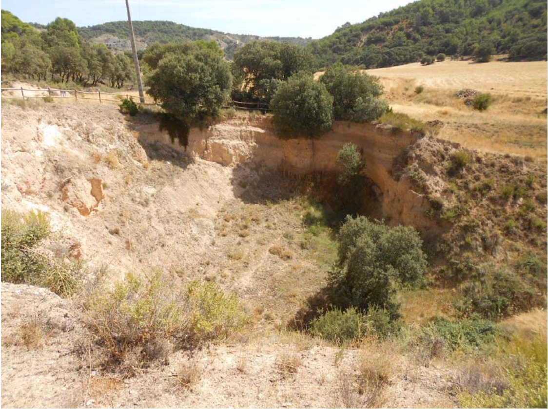
Figura o Foto 3: Vista general de la Sima de Hueva.