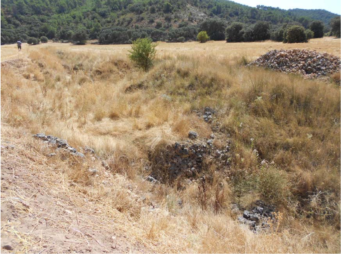
Figura o Foto 12: Cauce de la zona anterior.