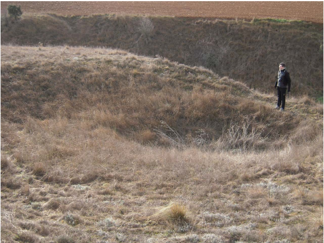
Figura o Foto 9: Otra dolina en la misma delimitación del LIG.