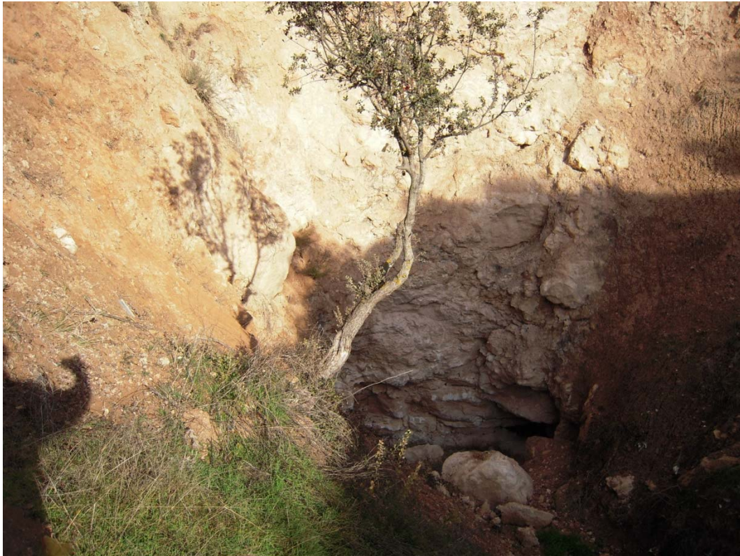
Figura o Foto 6: Sumidero.