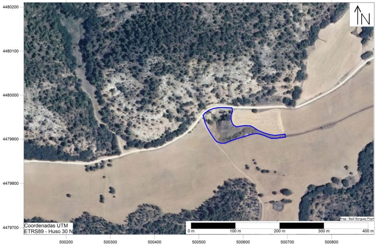
Figura o Foto 2: Ortofoto de detalle del LIG Sima de Hueva.

Ortofoto. Vuelo de 2014 «PNOA cedido por © Instituto Geográfico Nacional de España»