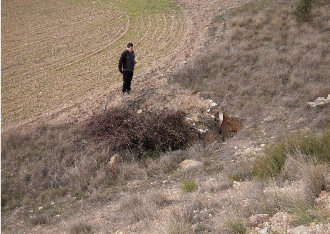
Figura o Foto 14: Otra dolina aguas arriba de la zona en cuestión.