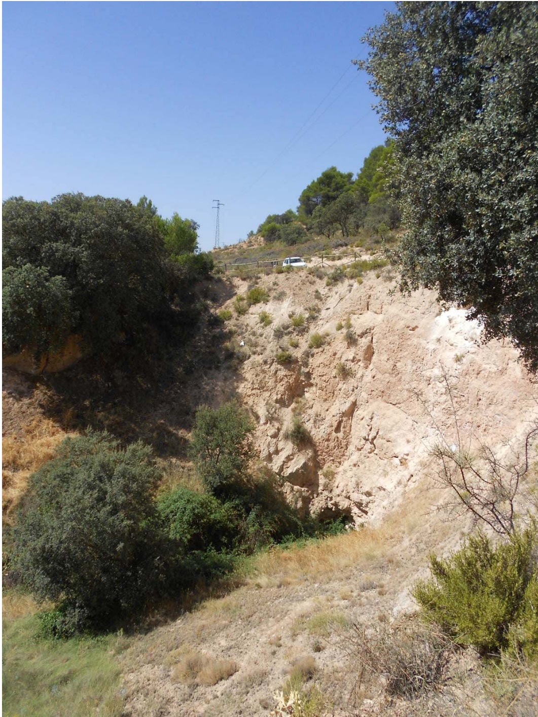
Figura o Foto 5: Vista de la Sima de Hueva desde el Este.