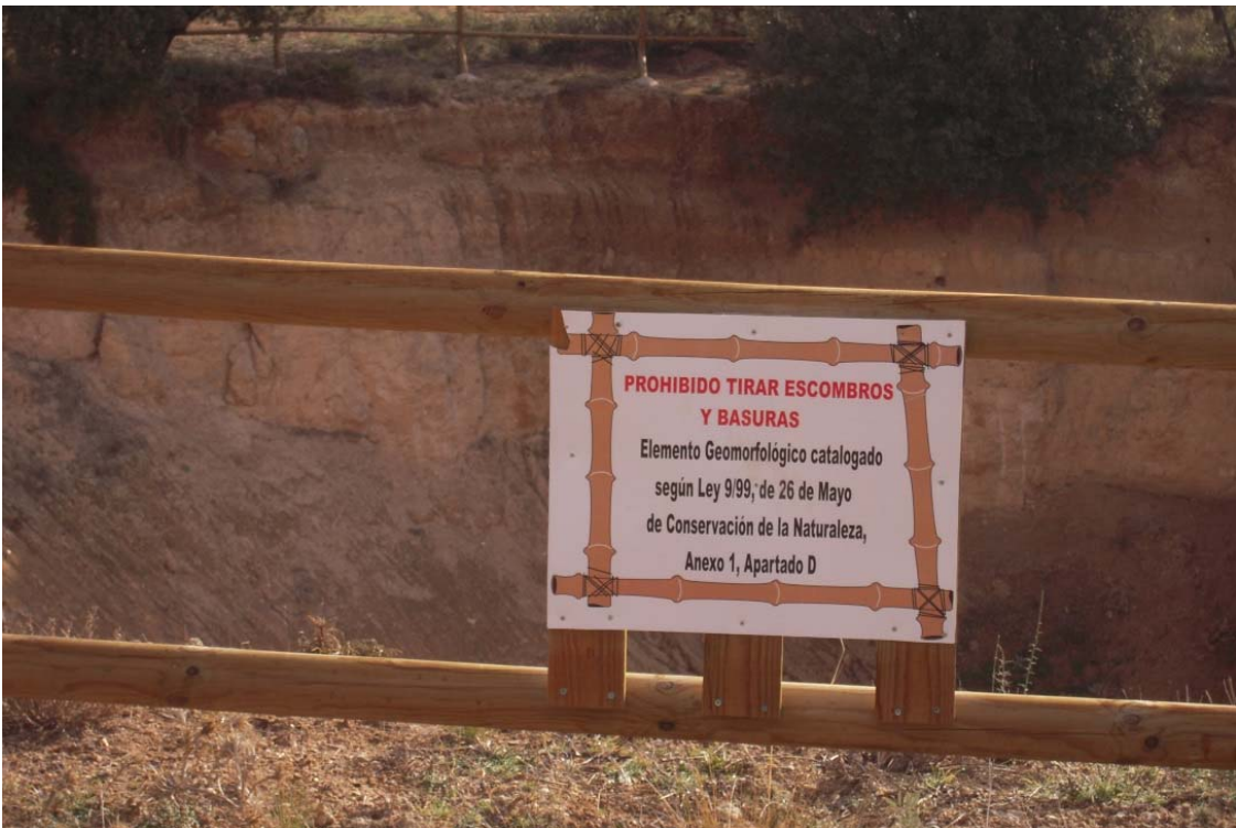
Figura o Foto 15: Elemento identificado y catalogado.