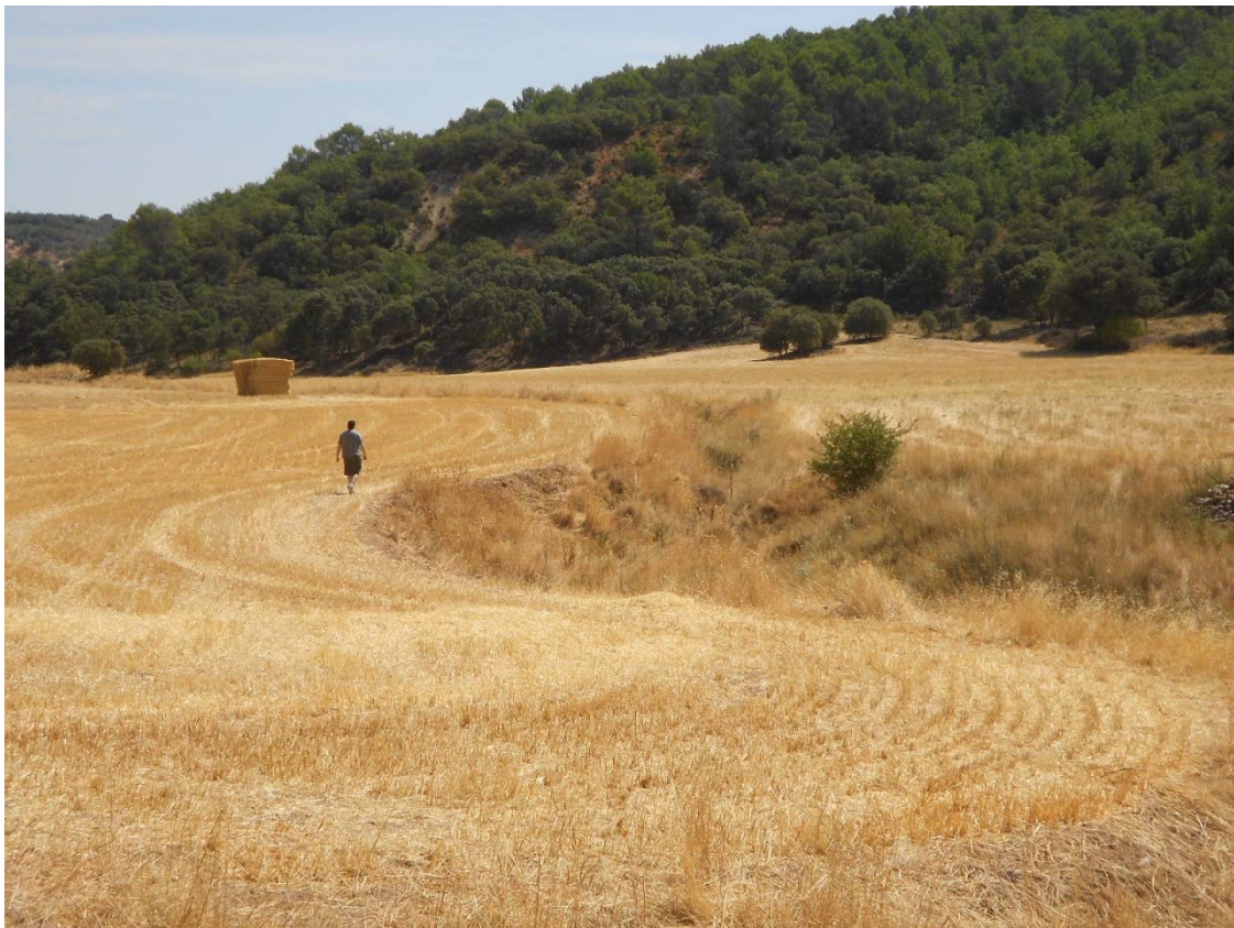
Figura o Foto 11: Zona de afectación por erosión remontante causada por el cambio del nivel de base que ha generado la dolina.