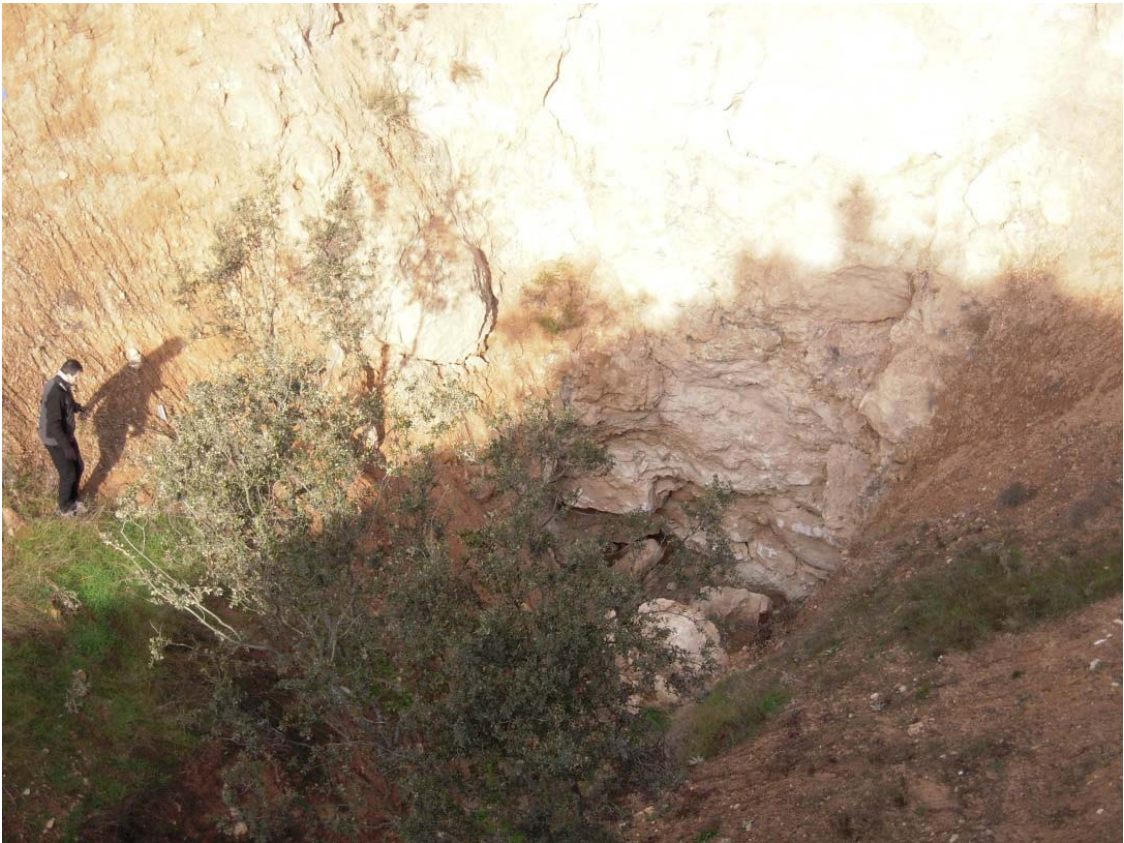
Figura o Foto 4: Fondo de la sima.