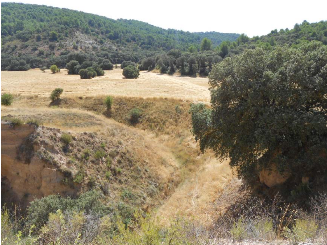
Figura o Foto 7: Meandro del arroyo para “caer” a la Sima de Hueva. Se trata de su codo de captura.