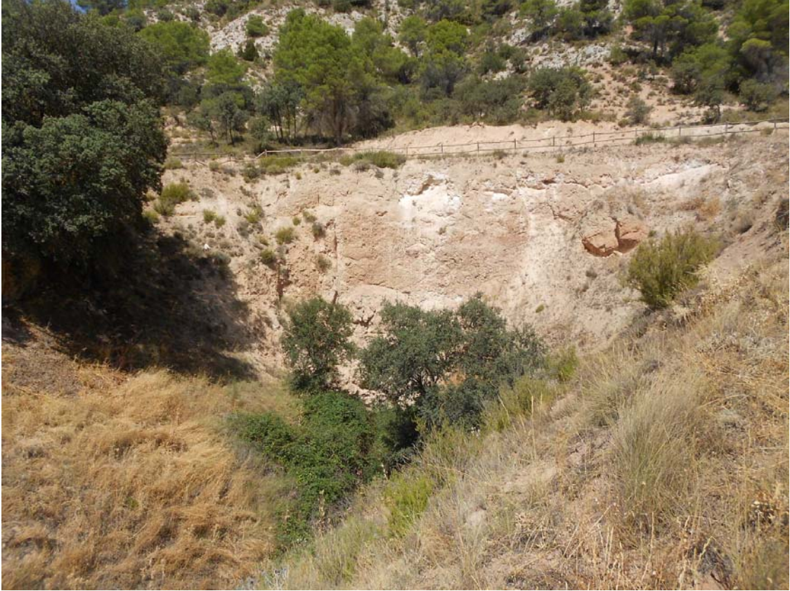
Figura o Foto 8: Otra vista de la Sima de Hueva desde el Sur.