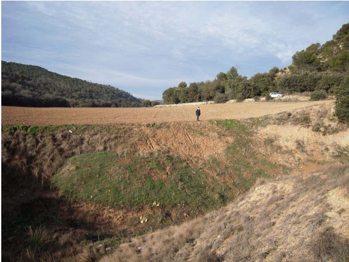
Figura o Foto 10: Vista desde el Este en sentido “aguas abajo” previo a la captura por la sima.