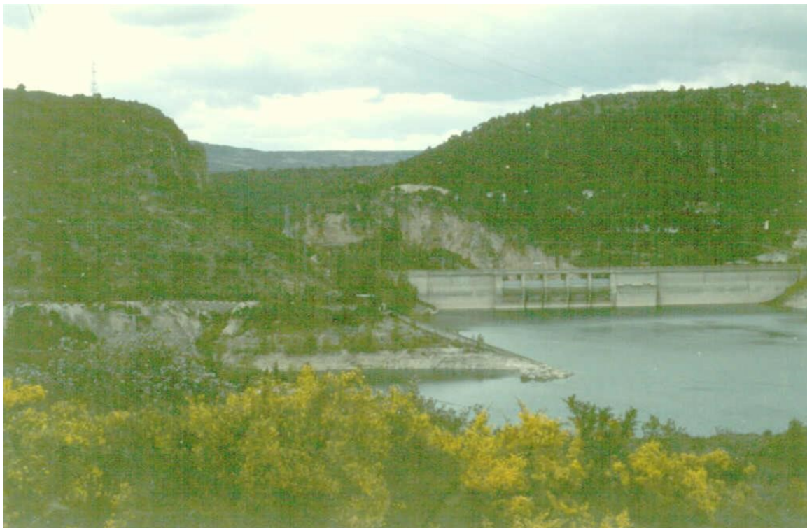
Panorámica del anticlinal cretácico de Entrepeñas.