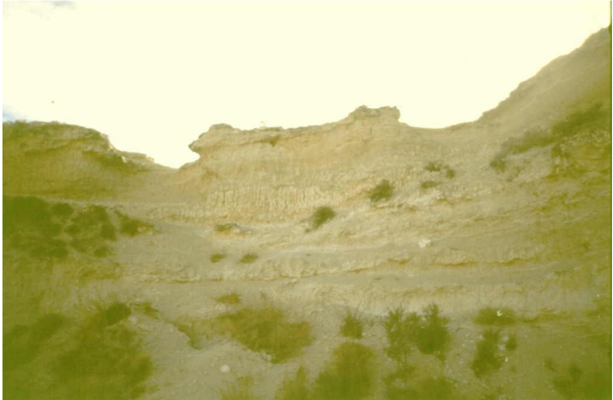
Panorámica de las secuencias características asociadas a paleosuelos.