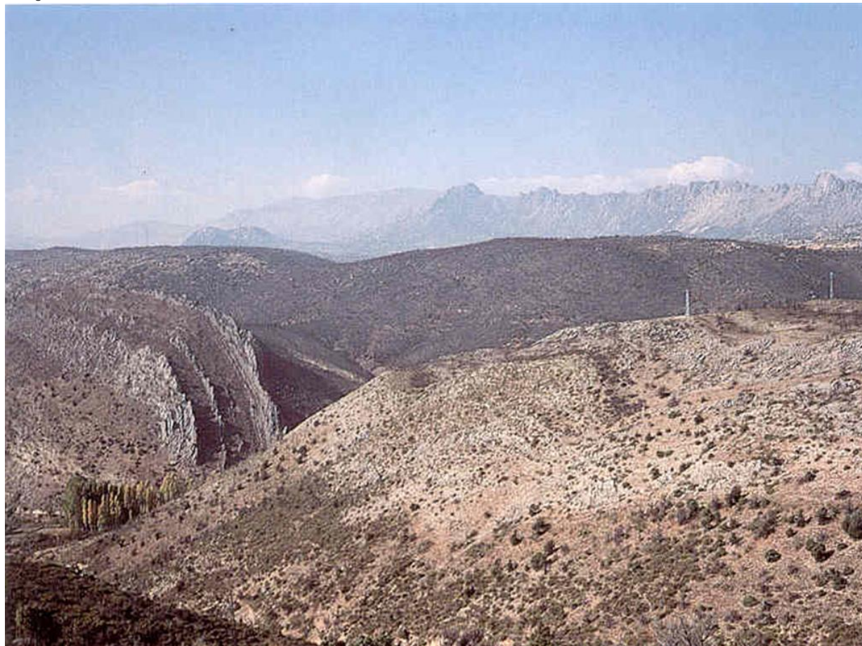
Discordancia Ordovícico (pizarras y cuarcitas) y Cretácico.