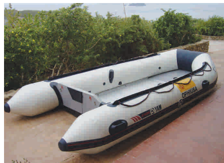
Embarcaciones "Nixe" y "Ophiusa".