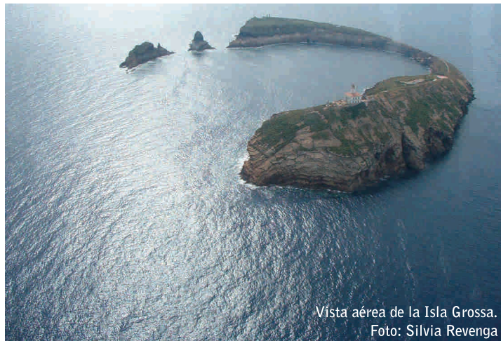
Vista aérea de la Isla Grossa.

Las ZUR rodean los grupos de islotes de L'Illa Grossa, La Ferrera y La Foradada, en estas zonas se permite, con autorización del MAPA, el buceo con escafandra autónoma y muestreos científicos. Queda prohibido el fondeo, la pesca submarina, cualquier tipo de pesca y la extracción de flora, fauna, objetos o rocas.