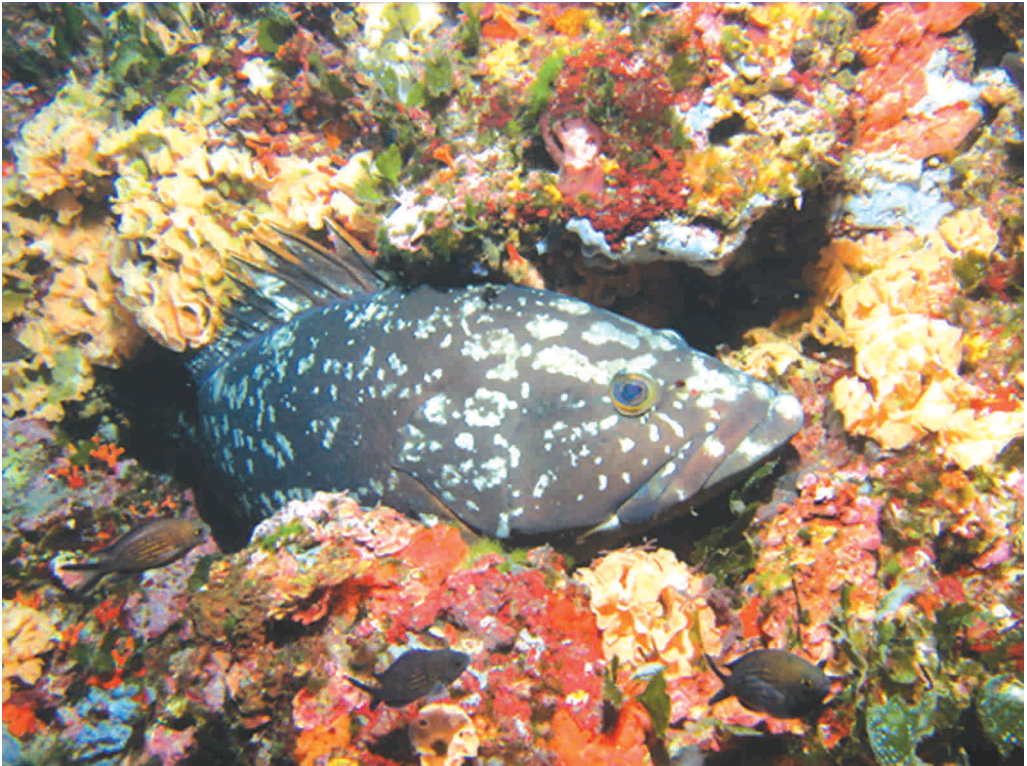
El mero ( Epinephelus marginatus ) es muy abundante en Columbretes desde la creación de la reserva.

Cada vez más se reafirma la importancia de la reserva marina de las Islas Columbretes como observatorio científico marino. La información que ofrece la reserva marina se obtiene a partir del programa de seguimientos llevado a cabo por el personal de la reserva, del que se resaltan el estudio y seguimiento de las mortandades masivas de invertebrados y los estudios de dinámica poblacional y crecimiento de Pinna nobilis ; y a través de las campañas llevadas a cabo por IEO, CSIC, IEL y Universidades.