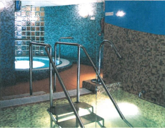
Piscinas del Balneario

Actualmente es uno de los más conocidos de la provincia de Ciudad Real y de España, tiene un moderno balneario y reformado hace poco tiempo. Es aconsejable ir a verlos no solo por los baños si no por su riqueza en yacimientos de pintura esquemática, como Peña Escrita y La Batanera, también por su gastronomía y sobre todo por la caza.