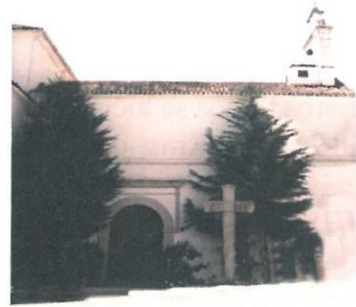
Iglesia de Nra de los Baños

“... en el cual se bañan muchas personas que vienen a ellos de diversas partes enfermos tullidos y lisiados y llevan mejoría en sus enfermedades por lo cual concurren a los dichos baños, y vienen en romería a dicha iglesia y el calor de la dicha agua es de su natural...”