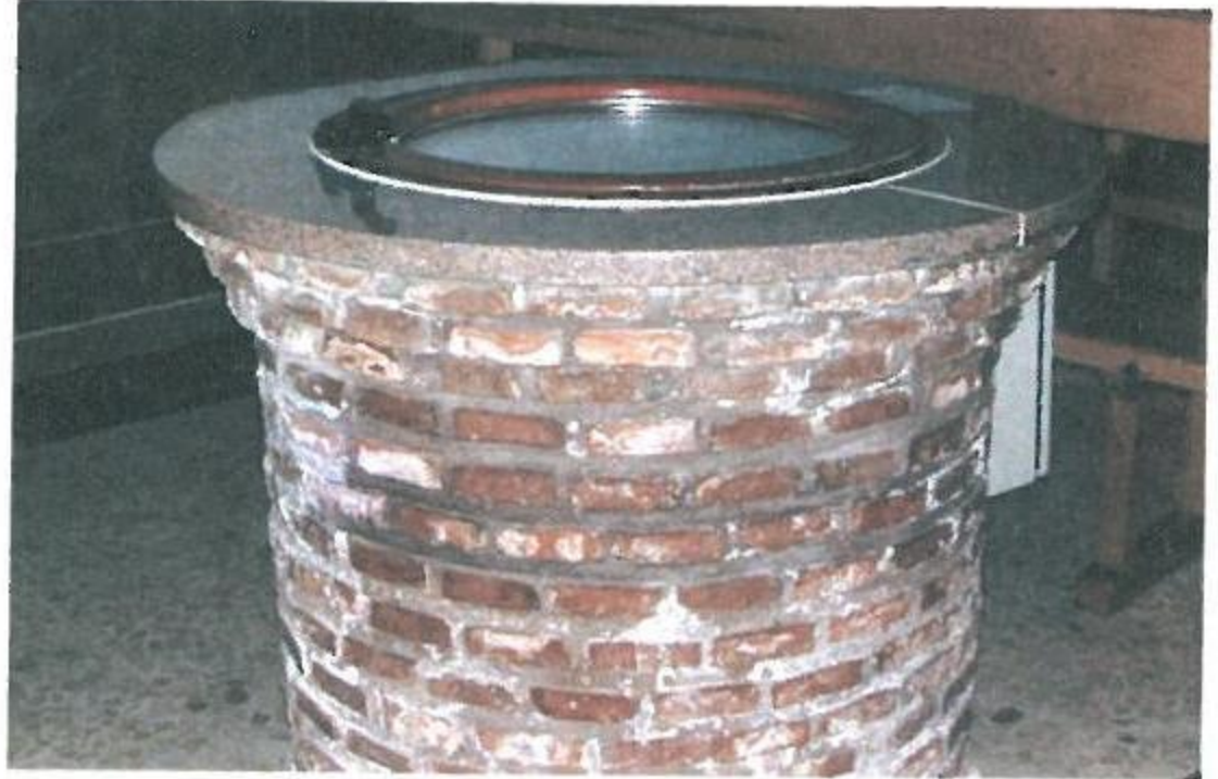
Lugar de nacimiento de las aguas termales

Este venero emerge en el deposito situado debajo del altar mayor de la iglesia, desde aquí se traslada al balneario, su temperatura oscila entre 34° y 36° grados.