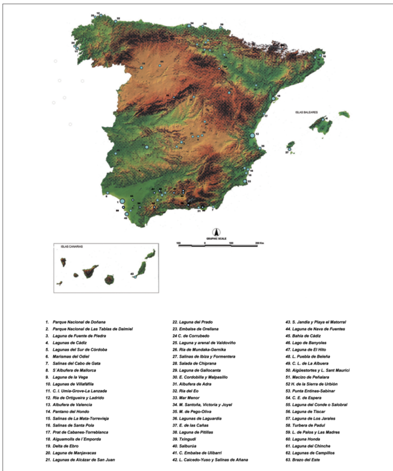
Figura 2. Humedales españoles incluidos en la Convención Ramsar (febrero 2006) Figure 2. Spanish wetlands included in the Ramsar Convention (February 2006)

Durán Valsero, J. J. et al. , 2009. Propuesta de clasificación genético-geológica de... Boletín Geológico y Minero , 120 (3): 335-346