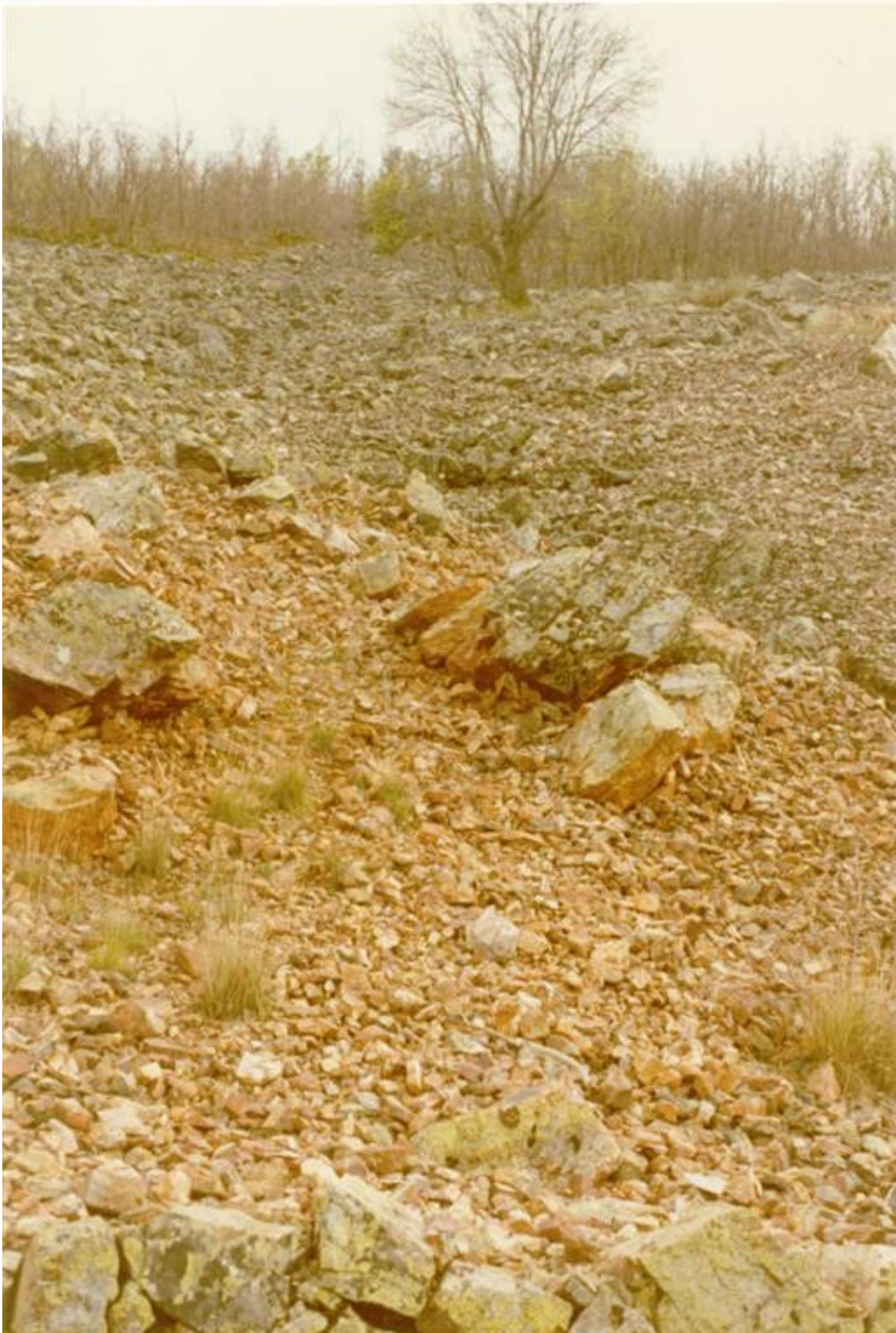
Detalle de depósito del Canchal de la ladera NW. de Corral de Cantos. Nótese la heterometría de los cantos de cuarcita armoricana, colonizados por líquenes y musgo en su superficie.