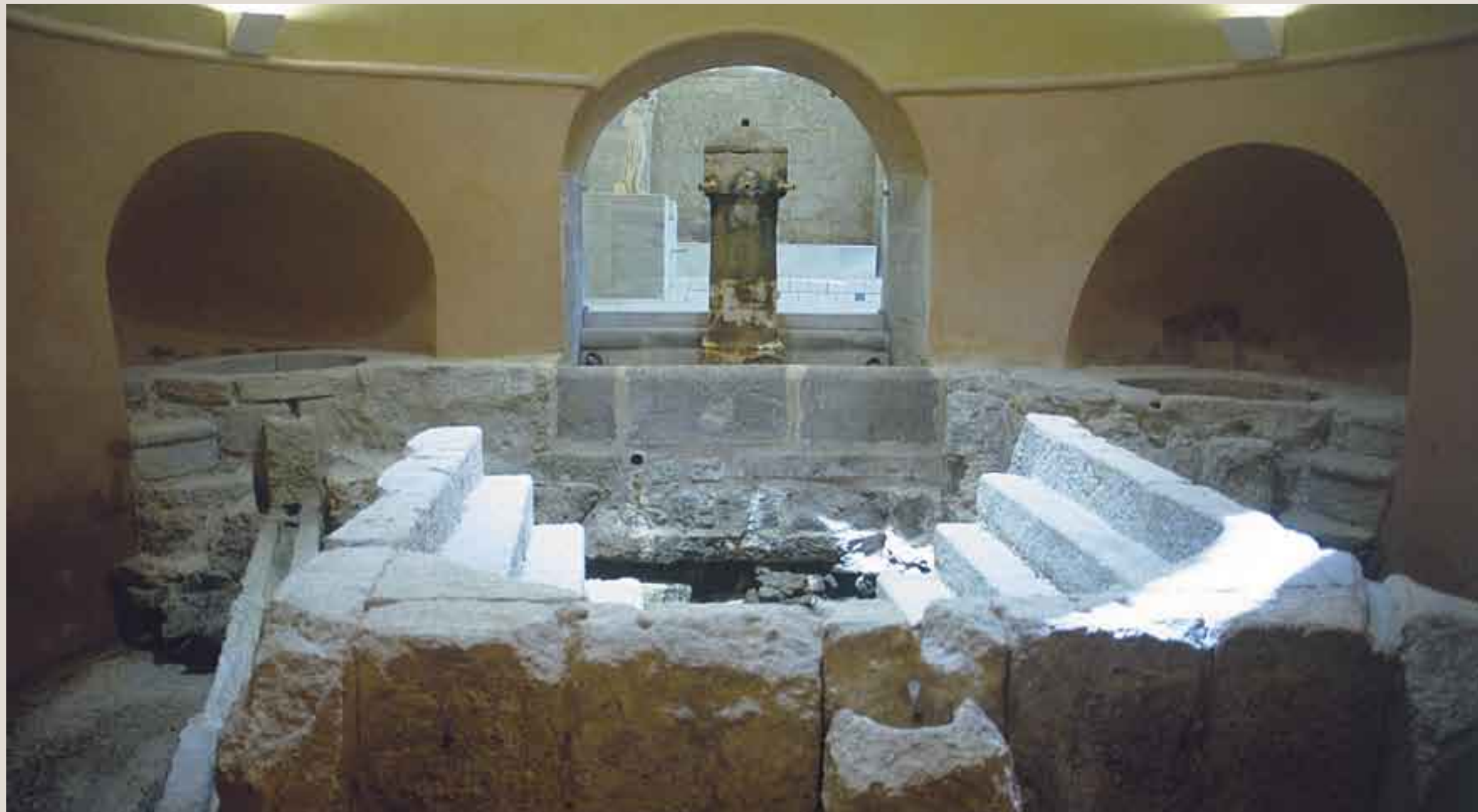
Antiguas termas romanas.

de vapor y agua, inhaladores, masajes y termas romanas. El Balneario de Baños de Montemayor fue declarado por la Junta de Extremadura Bien de Interés Cultural, con la categoría de Monumento. Asimismo las termas se ubican en un marco de gran relevancia natural conformado por la vertiente meridional de la Sierra de Gredos, que cuenta con enclaves de importancia ecológico-paisajística como son el magnífico Castañar de Hervás, la Sierra del Calvitero, el Puerto de Honduras y el Valle del Jerte y del Ambroz, entre otros.