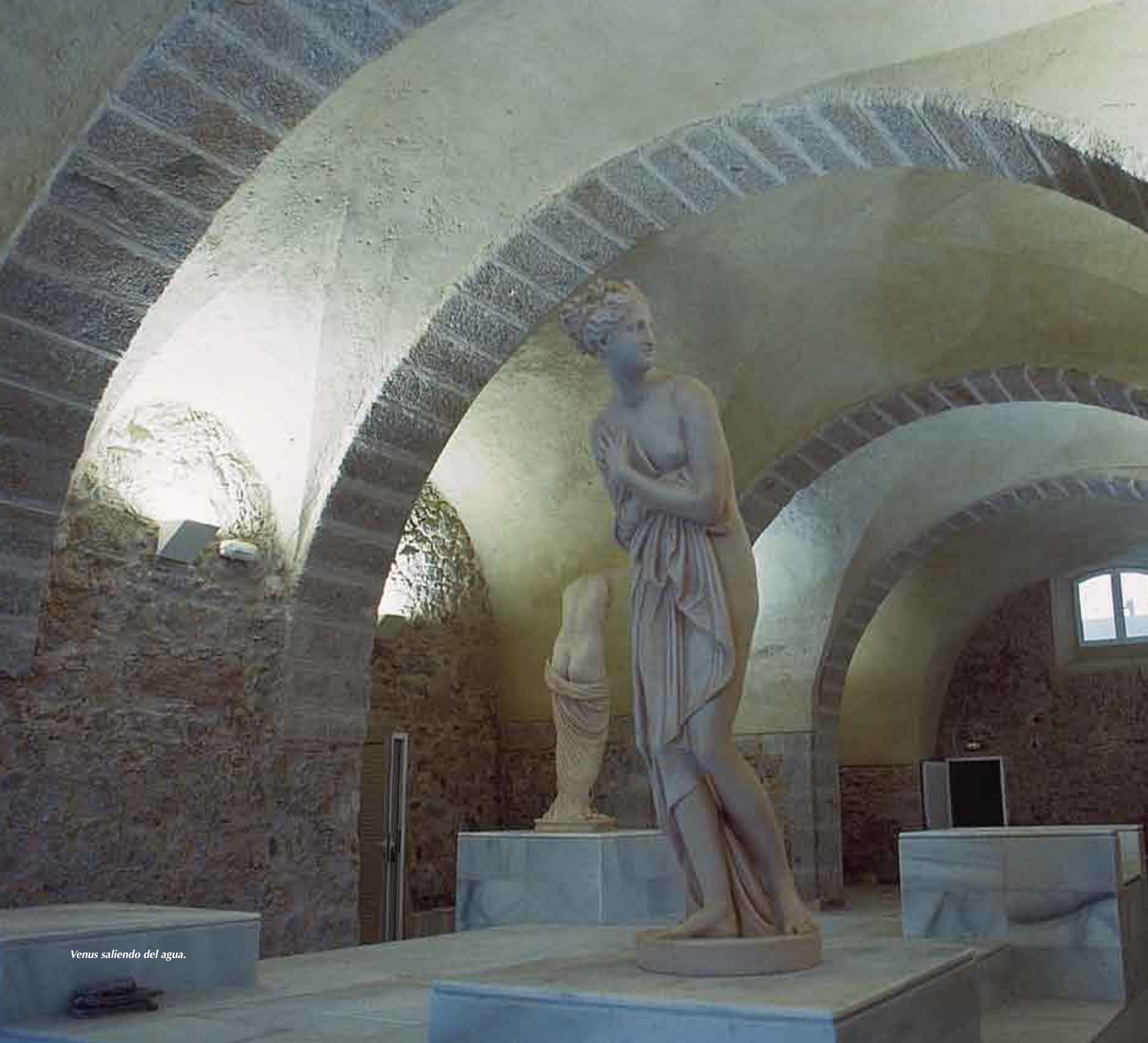
Venus saliendo del agua.