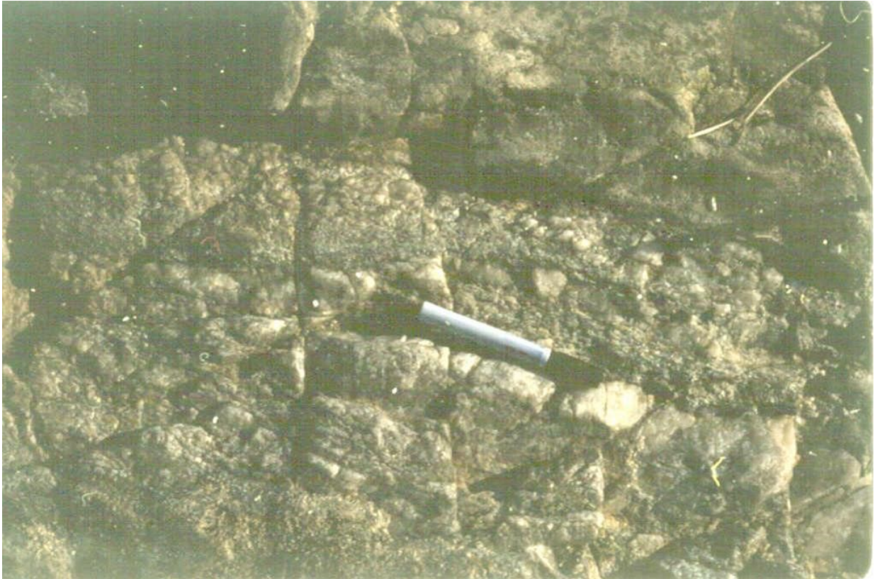
Detalle de las venas de cuarzo formando pseudosuperficies perpendiculares a la So.