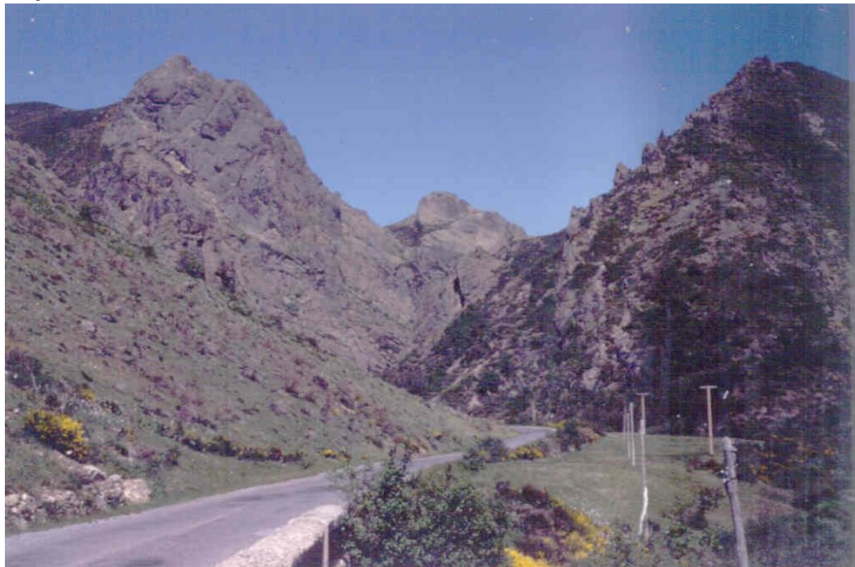
Desfiladero de Llánaves de la Reina junto a Portilla de la Reina.