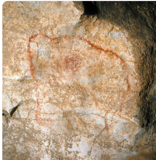
Mamut [R.B.] ▲