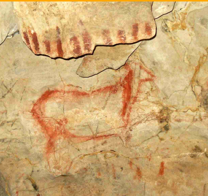
▲ Cierva [S.R.]