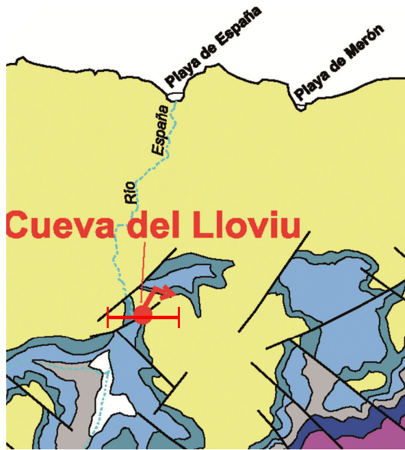
Mapa geológico del entorno de la cueva del Lloviu