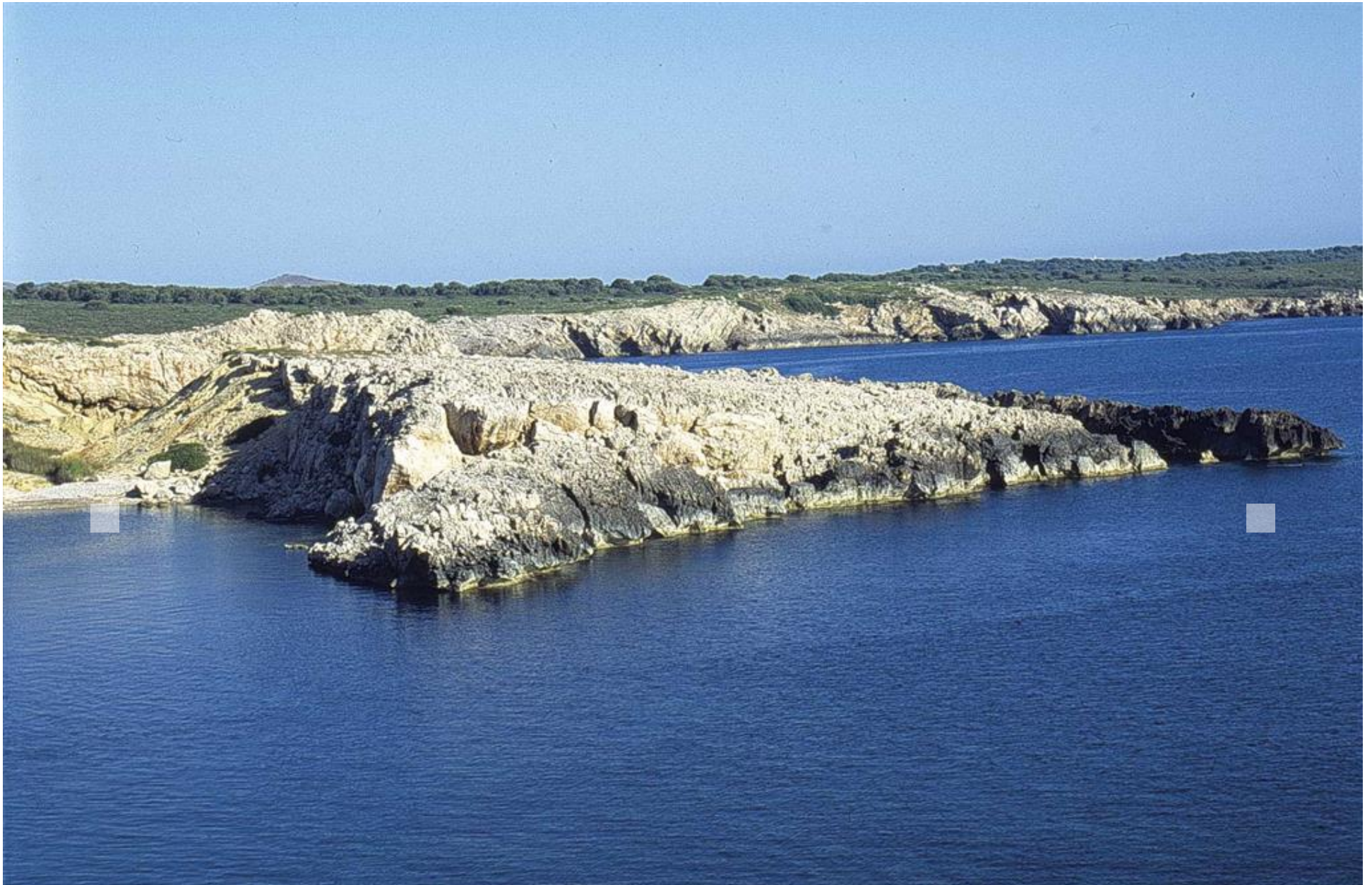
Vista general de la costa acantilada del Macar de la Llosa