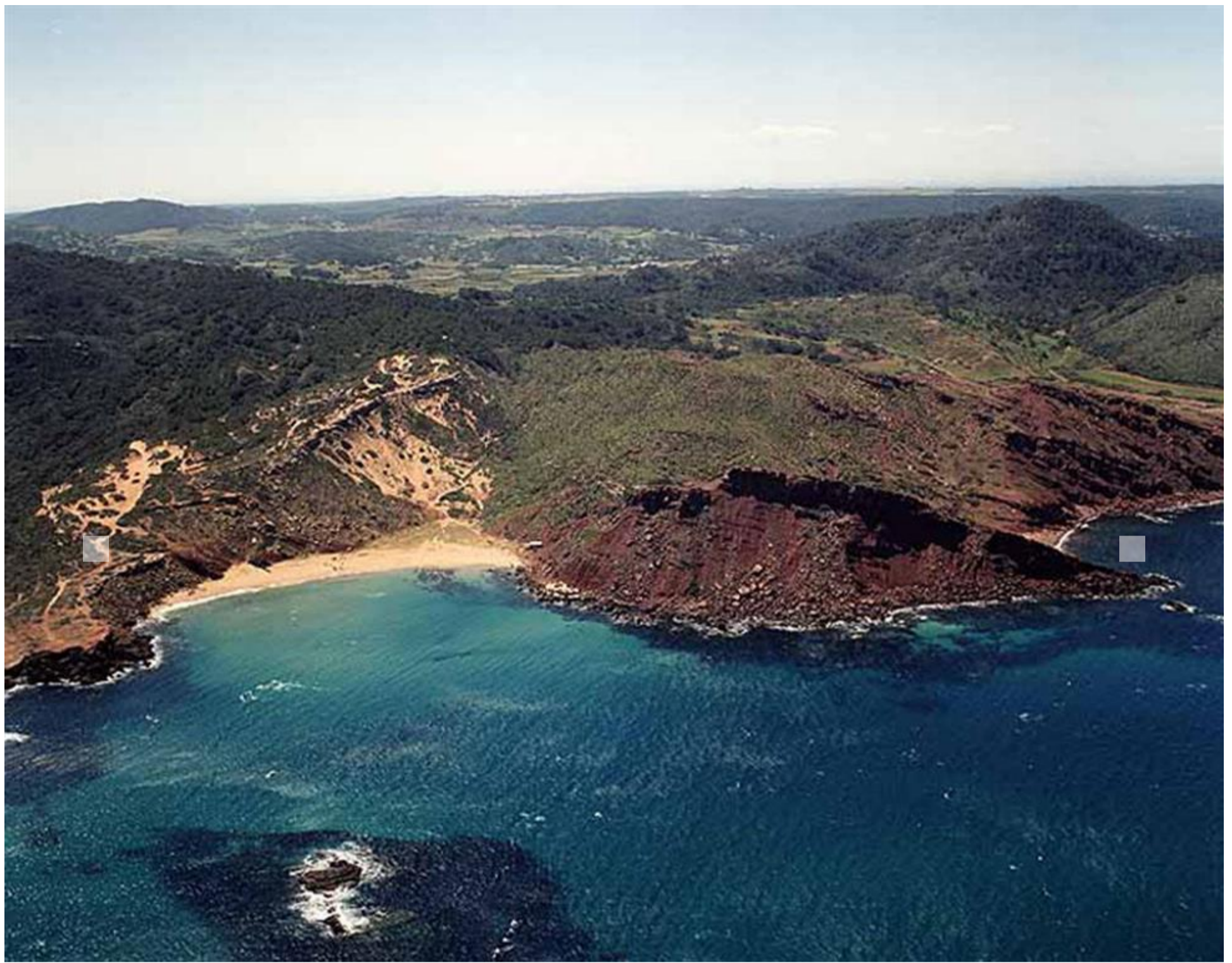
Vista aérea de cala Pilar. Se aprecian los depósitos rojos del Pérmico