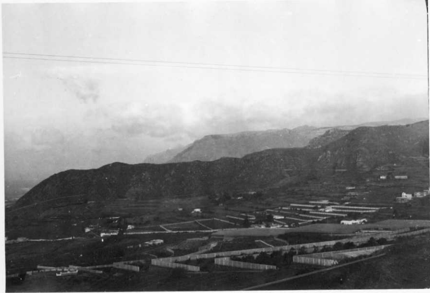
39-38-AD-CG-602.- Serie I. Picacho de Los Lázaros, único relieve importante en esta Hoja.