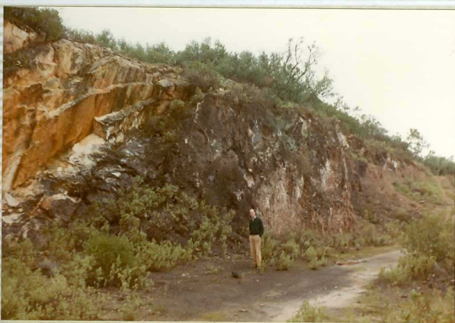
16-41-IB-AS-9515.- Nivel mineralizado similar al anterior al Norte de Jauja.