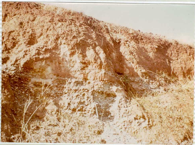
16-41-IB-AS-9506.- Depósitos de la terraza inferior del Genil entre Jauja y Badolatosa. Sobre ella existe un perfil edáfico con horizontes B ca y B t .