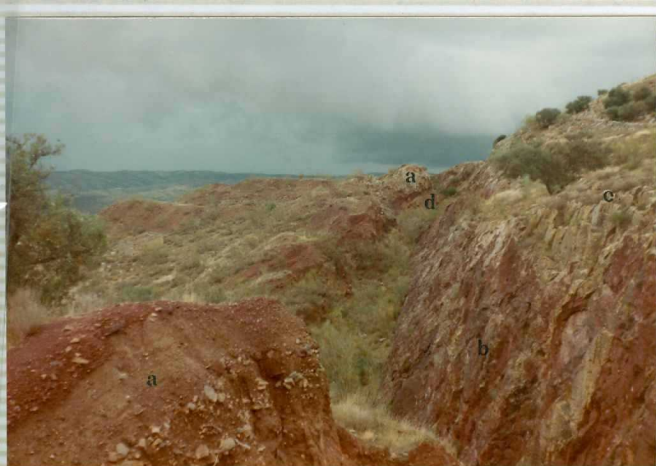
16-41-IB-AS-9514.- Vista general del coluvión anterior (a). A la derecha los niveles detríticos - mineralizados (b) triásicos apoyados sobre bancos de calizas (c). A techo de la mineralización margas en facies Keuper (d).