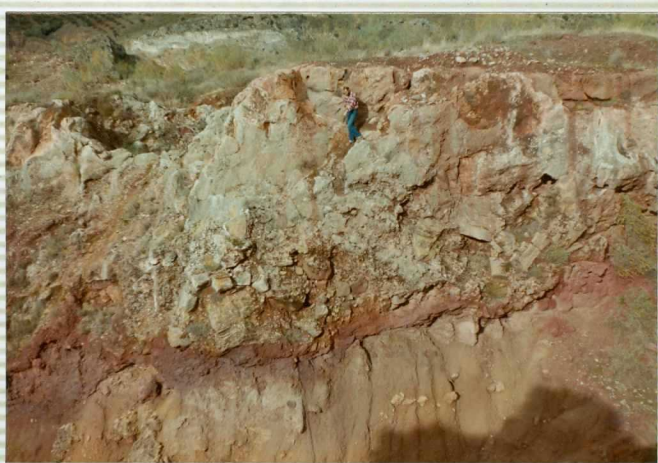
16-41-IB-AS-9513.- Brechas de bloques de calizas de facies muschelkalk pertenecientes a un colu---vi 3 on cuaternario fuertemente cementados por carbo n atos con concentraci 3 on de hierro en su base.