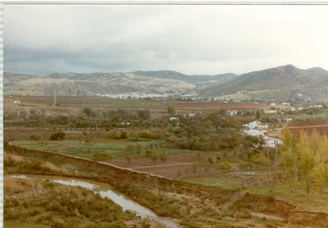
16-41-IB-AS-9510.- Vista general del valle del rio Genil a su paso por Jauja. Al Fondo el contacto -- terciario-triásico.