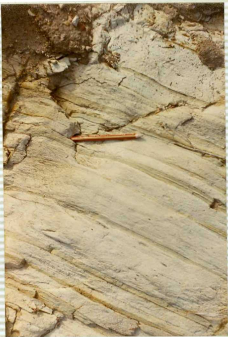
16-41- IB-AS-9509.- Afloramiento arenisco muy laminado relacionado con "meronitas" en Benamejé.