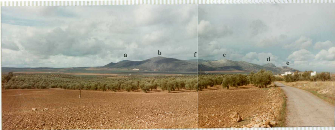
16-41-IB-AS-9505.- La Sierra de Estepa. De izquierda a derecha: los vértices Cruz (a), Pleites (b), El Aguila (c) El Hacho (d) El Puntal (e) y Becerrero (Hoja de Osuna) (f).