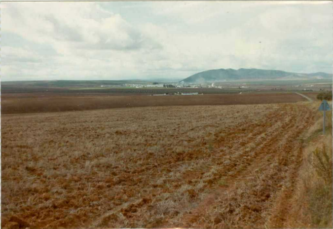
16-41-IB-AS-9502.- Panorámica del angulo SO de la Hoja. Al fondo, a la derecha la Sierra de los Caballos, a la izquierda el Tortoniense con la superficie culminante villafranquiense (¿).