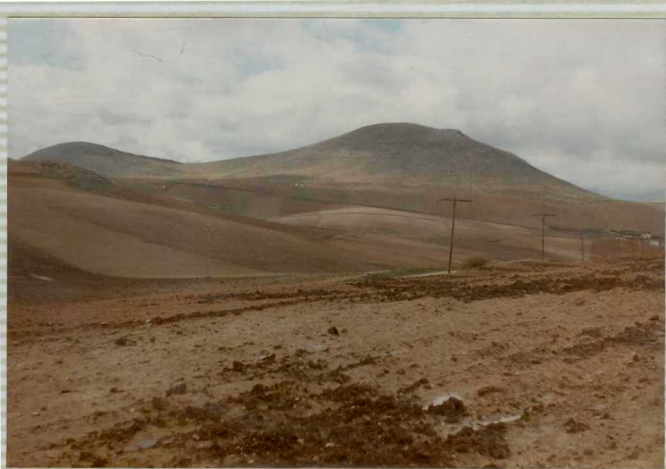
16-41-IB-AS-9501.- Aspecto de la sierra dolomítica de la Camorra que destaca de la masa de afloramientos triásicos. Entre estos últimos, emerge una loma de margocalizas del Cretácico Superior-Eoceno.