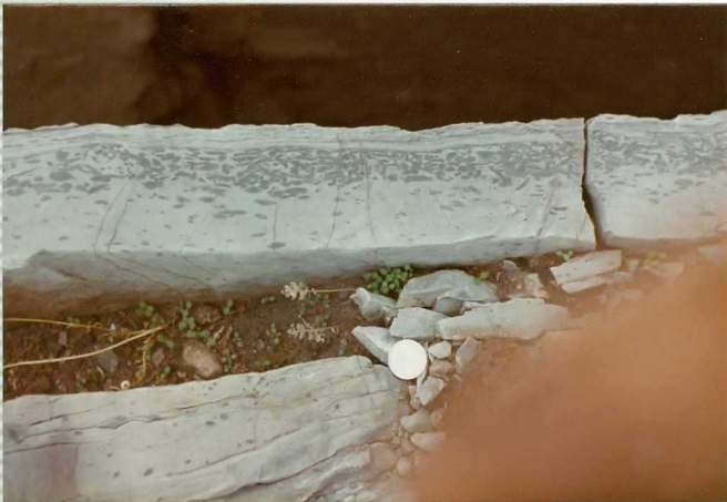
16-41-IB-AS-9511.- Banco de calizas con intraclas- tos en facies muschelkalk . Posibles secuencias - de somerización.