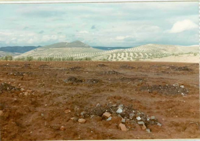
16-41-IB-AS-9503.- El cerro Manchas con los afloramientos cretácico-terciarios del Norte de Alameda. Al fondo el Trías.