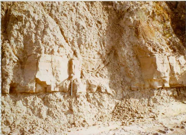
16-41-IB-AS-9507.- Afloramiento de banco turbidítico en el terciarios de Jauja.