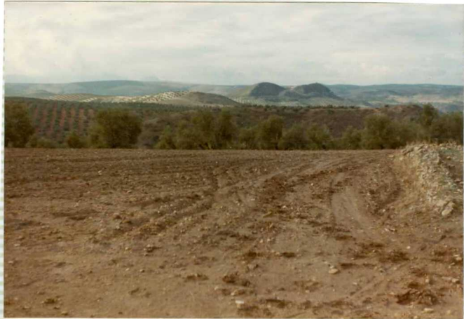
16-41-IB-AS-9504.- Otra perspectiva del vértice Manchas constituido por calizas de Microcodium . La línea del horizonte está constituida por Tortonien se nivelado a su vez por la alta superficie plio--cuaternaria.