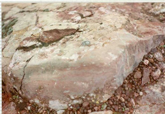
16-41-IB-AS-9512.- Niveles algares en calizas del trías.