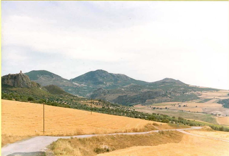
9194 Vista general del complejo tectosedimentario Oligo-Aquitaniense. Unidad 35.