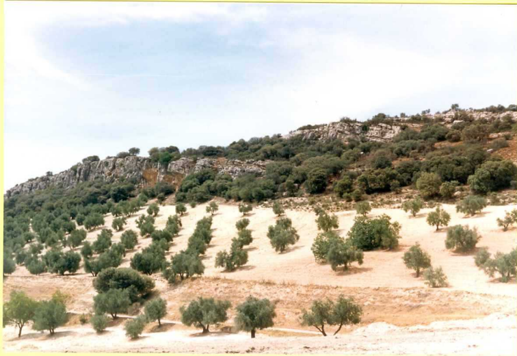
9200 Biocalcarenitas. Unidad 42. Tortoniense superior de la Cartuja de los Morales.