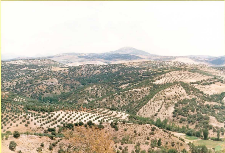
9179 Vista general del Jurásico del Río de Las Juntas. Los afloramientos más oscuros corresponden al vulcanismo básico.