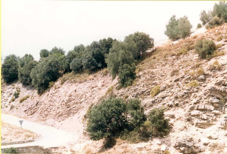
9185 Vista general de las Unidades 26 y 27 del Malm en la carretera de Benalua de las Villas de Colomera.