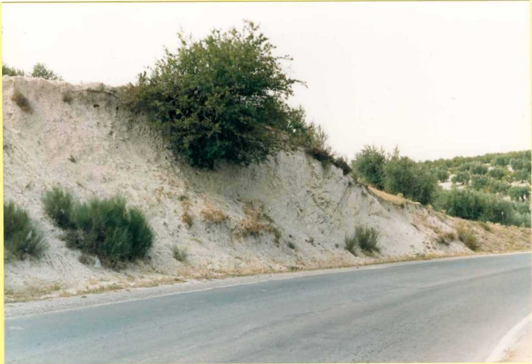
9198 Margas blancas (Unidad 39). Puerto López. Burdigaliense sup-Langhiense.