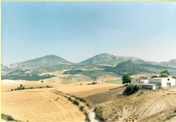
9209 Frente de la Unidad de Parpanda-Moclín.