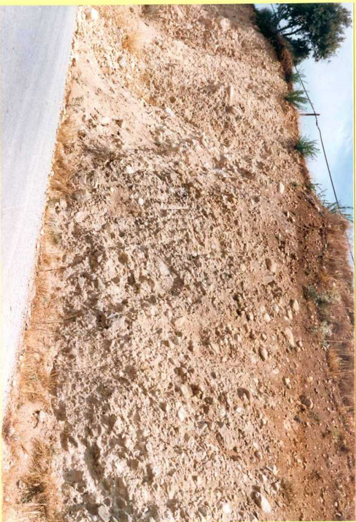
9203 Conglomerados pliocenos de la Unidad 48. Carretera de Compitejar a Montillana.