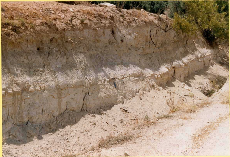
9202 Margas blancas. (Unidad 44). Turolense sup-Plioceno sup. Pista de Benalua de las Villas a Montillana.