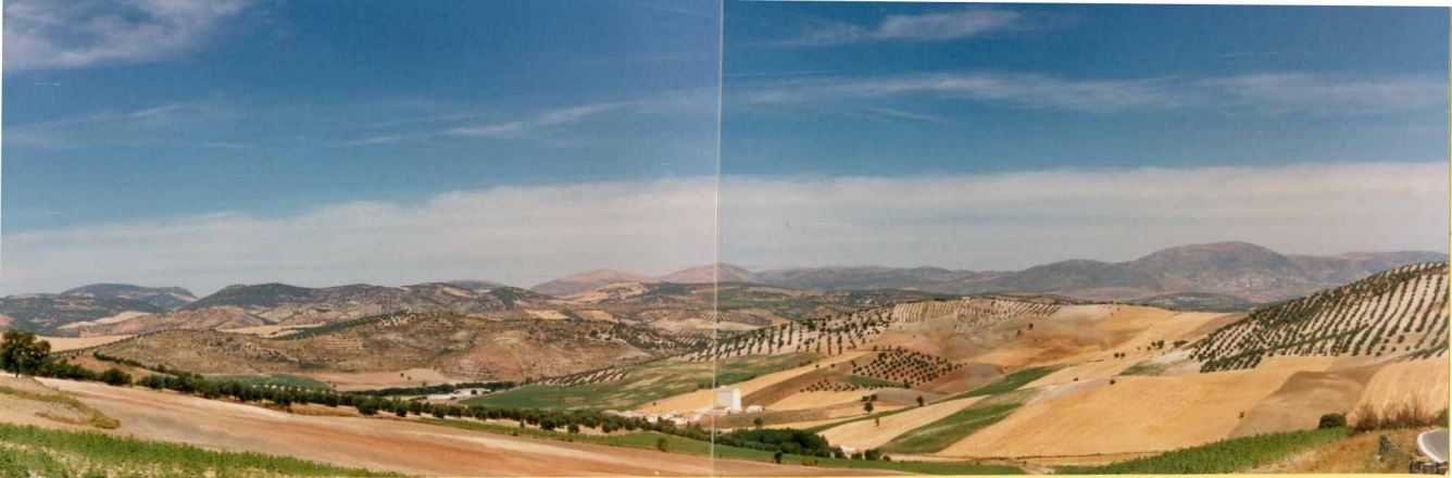
9213 Vista general desde el Puerto de Onitar de las Sierras septentrionales. De izquierda a derecha: Trigo, Montillana y Alta Coloma.