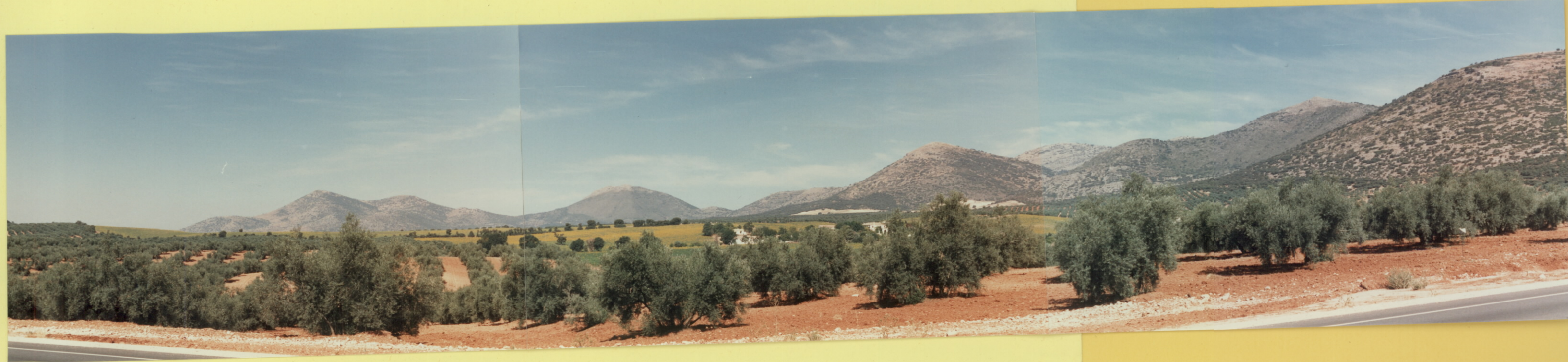
9211 Vista general de las Sierras meridionales. (Sector del Pozuelo - El Frage) en su límite con la Depresión de Granada.