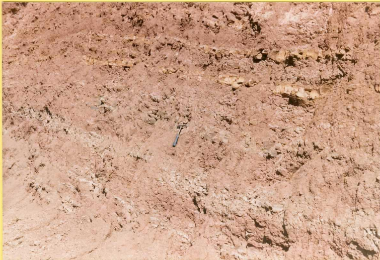
9184 Detalle de la misma unidad al norte de la Hoja en las proximidades de Mon tillana.