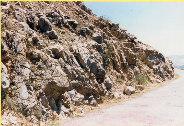
9174 Calizas margosas y margas grises. Unidad 21. Carretera de Frailes a Valde pe ñas de Jaén.