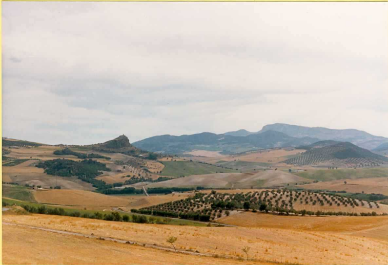
9193 Aspecto general y frecuente de los afloramientos del Cretácico superior ("capas rojas") y Paleogeno. Unidades 33 y 34.