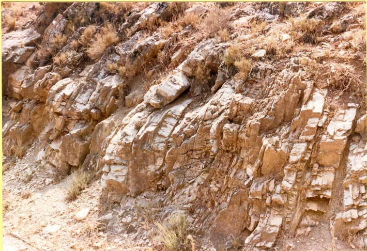
9187 Detalle de la unidad anterior.