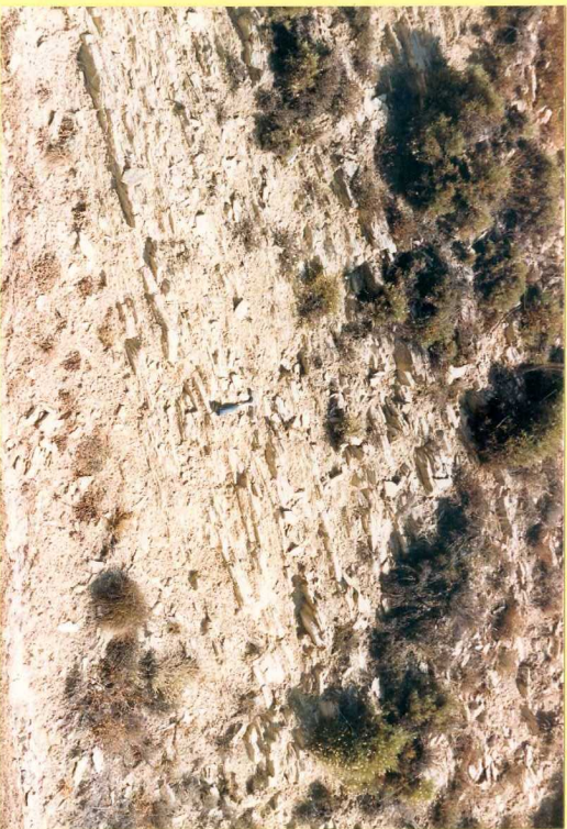
9175 Calizas margosas y margas beige. Unidad 15. Puerto del Zegri. Toarciense.