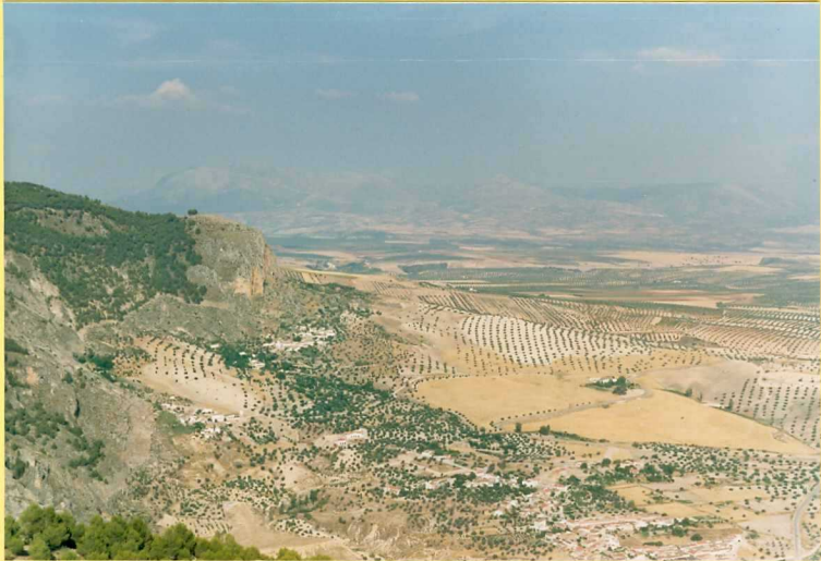
9204 Vista general del borde norte de la Depresión de Granada desde Moclín. Al fondo Sierra Harana.