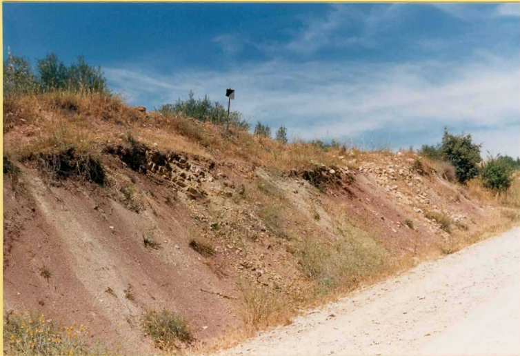
9183 Aspecto frecuente de las margas rojas radiolaríticas. Unidad 24 en el Cor_tijo Saladillo (Arroyo Salado).