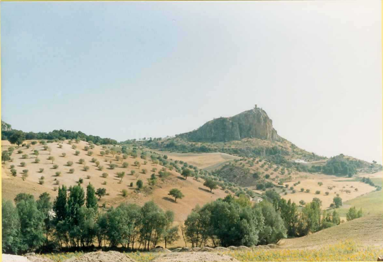
9195 Olistolito jurásico de la Unidad 35. Biocalcarenitas (Unidad 40) y Margas blancas.