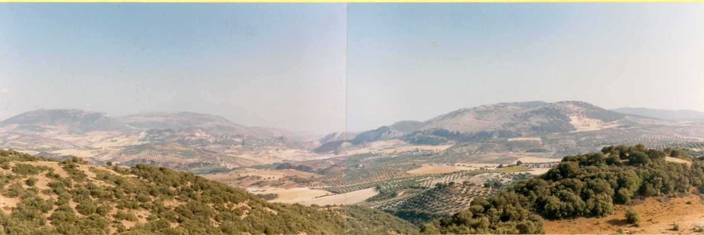
9212 Vista general de la Sierra del Zegri (Subbético medio) y Colomera y (Unidad de Parapanda-Moclín)