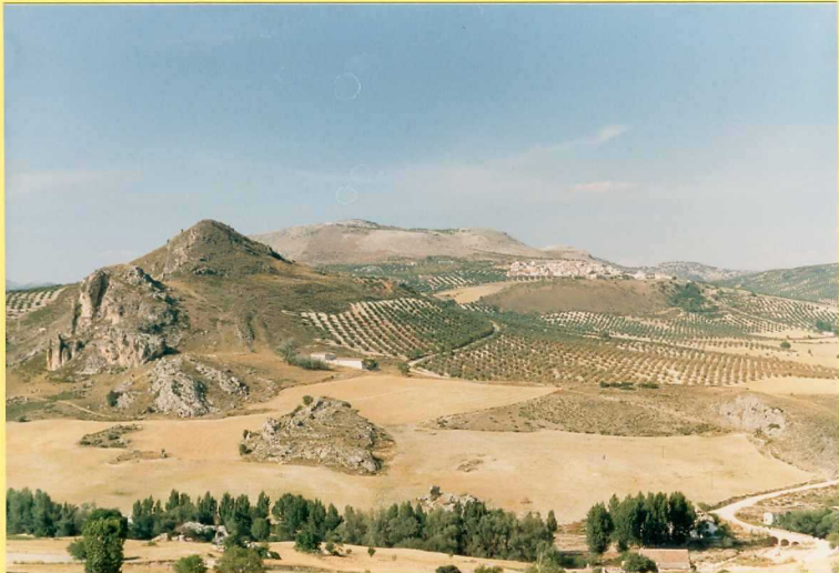
9196 (Unidad 41) del Burdigliense sup-Langhiense disconrdantes sobre Olistolitos de la Unidad 35. Sinclinal de Tozar.