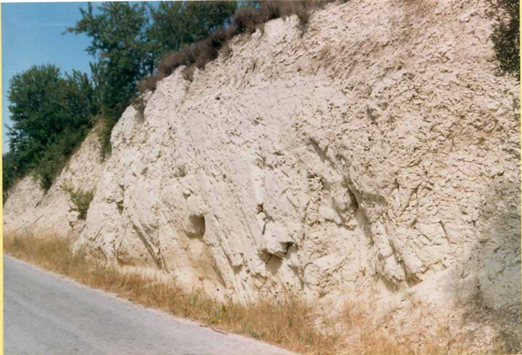
9199 Margas blancas. (Unidad 41) Tortonienne de las proximidades de Dehesas Viejas.