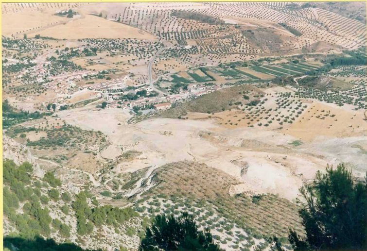
9208 Vista general del deslizamiento de Olivares desde el límite meridional de la Hoja en las cercanías de Moclín.