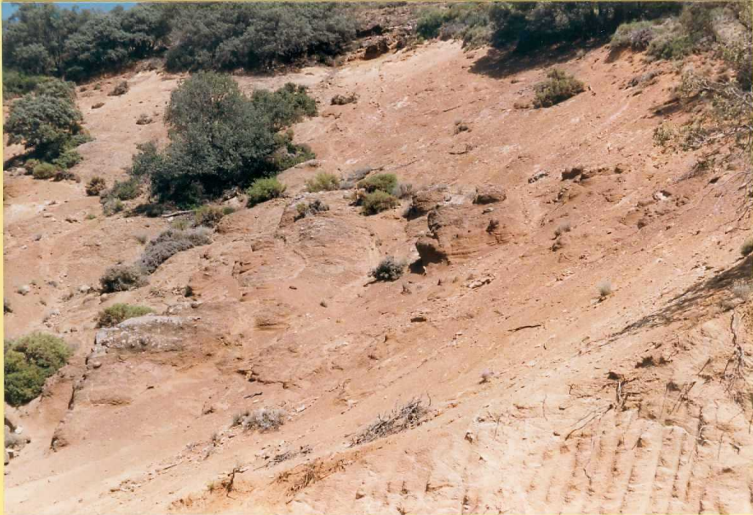
9181 Rocas volcánicas básicas con alto grado de alteración. Unidad 19 en las proximidades del Cortijo del Hachazo.