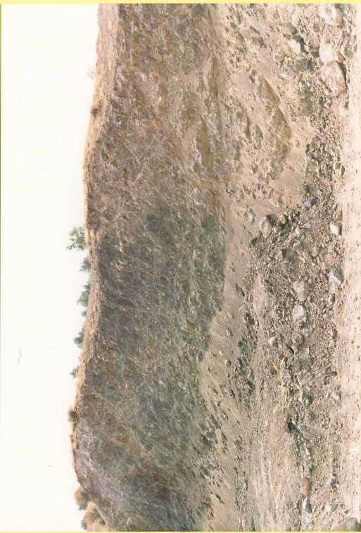
9182 Pillow-lavas en el Sinclinal del Cortijo de las Monjas.