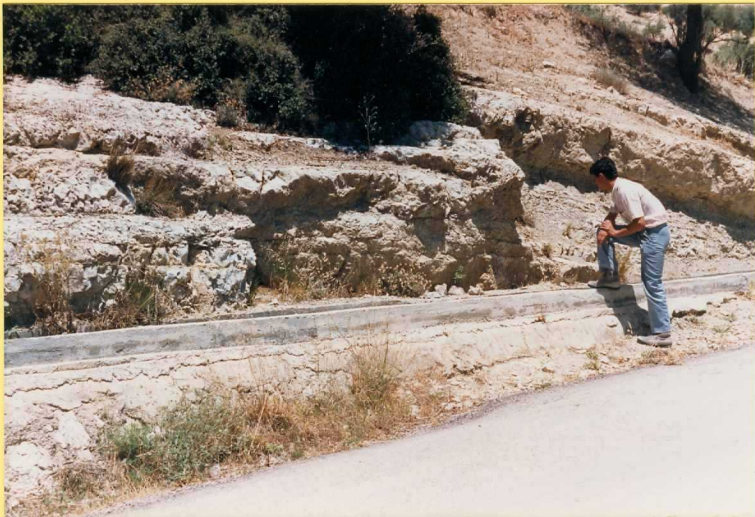
9192 Calizas margosas y margas blancas en el sinclinal del Cortijo de los Rosales en las proximidades y al norte de Frailes.