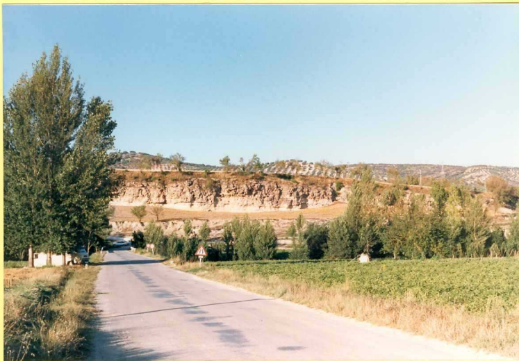
9207 Tobas y travertinos (Unidad 53) en Ribera Alta al sur de Frailes.