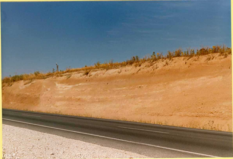
9205 Lutitas rojas Unidad 43. Plioceno sup-Cuaternario (Villafranquiense). C arretera nacional Jaén-Granada Km. 406.