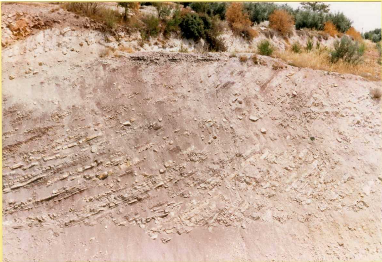
9188 Margocalizas silíceas nodulosas y margas rojas. Unidad 27. Carretera Jaén-Granada en las proximidades de Dehesas-Viejas.