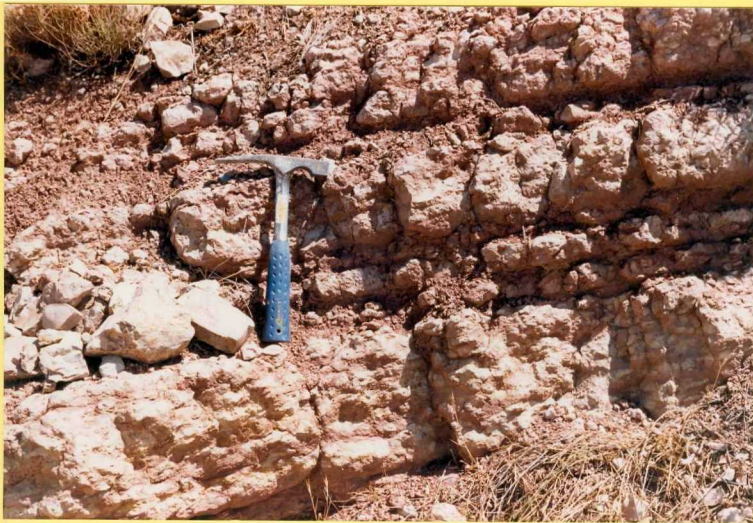
9178 Detalle del "Ammonítico rosso" en los afloramientos del Cortijo del Saladillo.