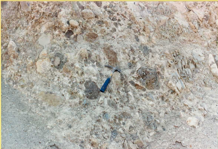
9189 Conglomerados y brechas poligénicas. Unidad 32. Cretácico basal y con carácter erosivo del Sinclinal del Cortijo de las Monjas.