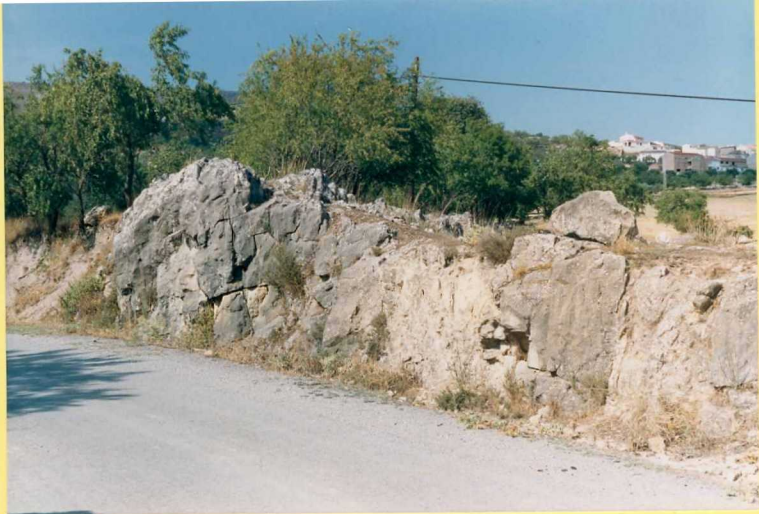
9197 Biocalcarenitas subverticales (Unidad 40) en Tozar. Budigaliense sup-Lan_ghiense.