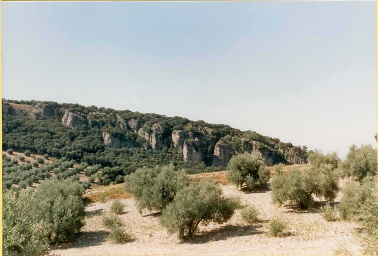
9201 Conglomerados con acrección lateral (Unidad 43). Turolense sup. Cortijo de Burrufete Bajo.