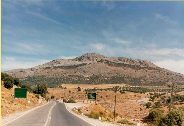
9210 Cabalgamiento de las calizas del Lías inf-medio sobre las margas del Dome_riense sup-Toarciense inf. Subbético medio.