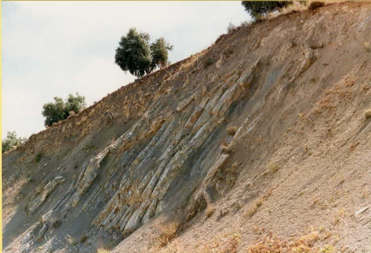
9190 Margocalizas y margas. Unidad 30. Puerto de Onitar. Carretera Jaén-Granada Km. 390.