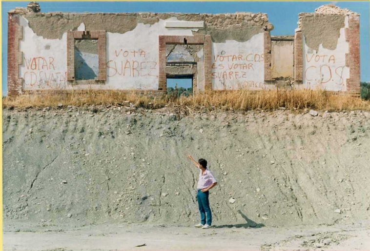
9191 Margas verdes del Cenomamiense. Unidad 31. Carretera. Puerto López-Alcalá la Real.