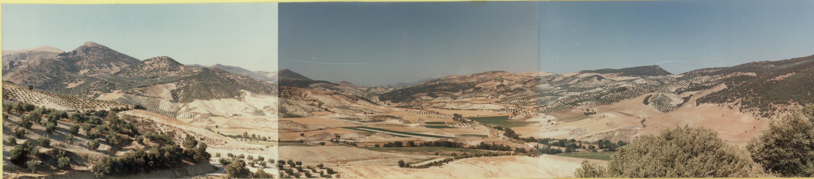
9215 Vista general del Sinclinal del Cortijo de las Monjas.