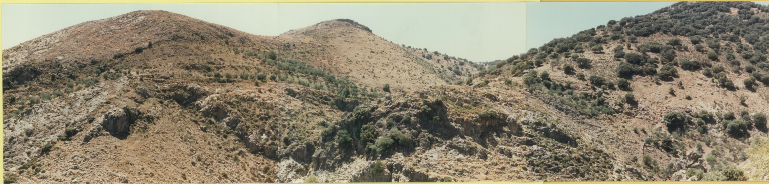
9214 Ventana tectónica al norte de Frailes. Carretera a Valdepeñas de Jaén.