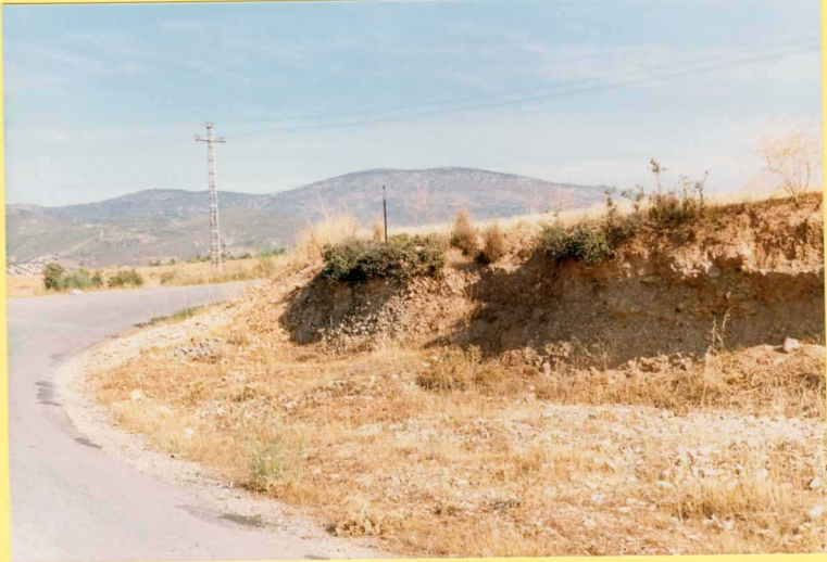
9206 Conglomerados con encostramientos carbonatados. Unidad 51 al sur de la Sierra del Pozuelo en la carretera de Colomera al Pantano de Cubillas.