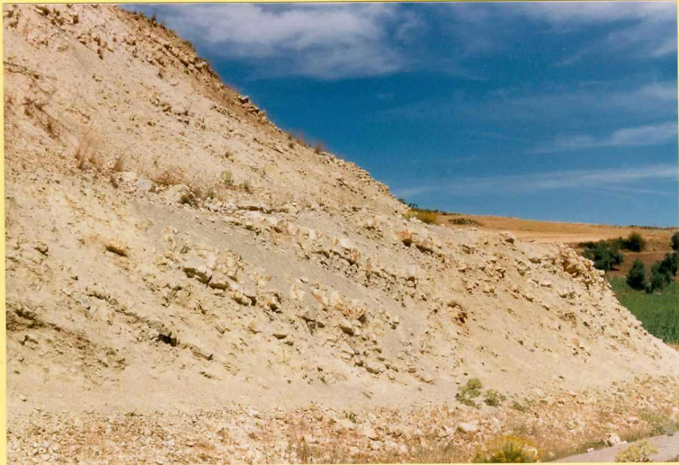
9176 Calizas margosas y margas beige. Unidad 15. Carretera nacional N-323 Km. 393 entre el Puerto de Onitar y Zegri.