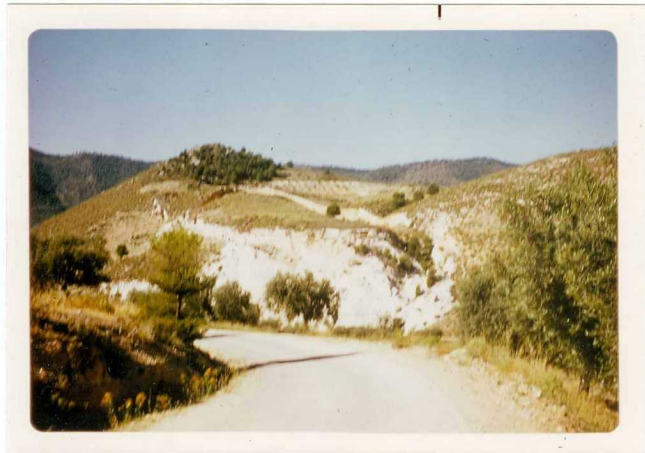
24-33-YC-PC-651.- Derrumbamiento actual de un gran bloque formado por las calizas y limos de ( T_{1-2}^B ) Mioceno-Plioceno.