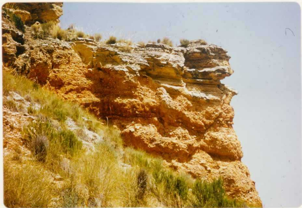
24-33-YC-PC-646.- Vista de los materiales detríticos inferiores y calcareníticos superiores en el Mioceno ( T_1Ba y T_1Bb-Bc ).