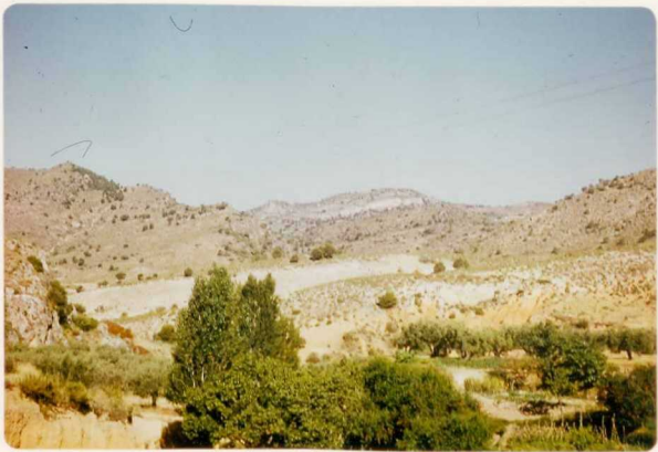
24-33-YC-PC-649.- Aspecto general desde la carretera de Hajar, hacia el Cretácico Superior (al fondo y en el centro) rodeado de Dogger (a los lados).