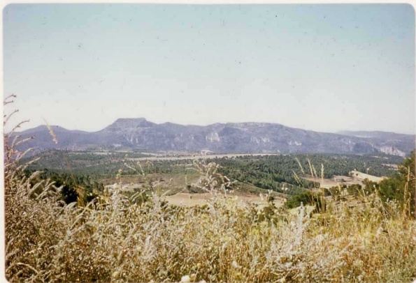
24-33-YC-PC-655.- Vista panorámica de la alineación de molasas miocenas situadas en el borde SO del río Mundo.