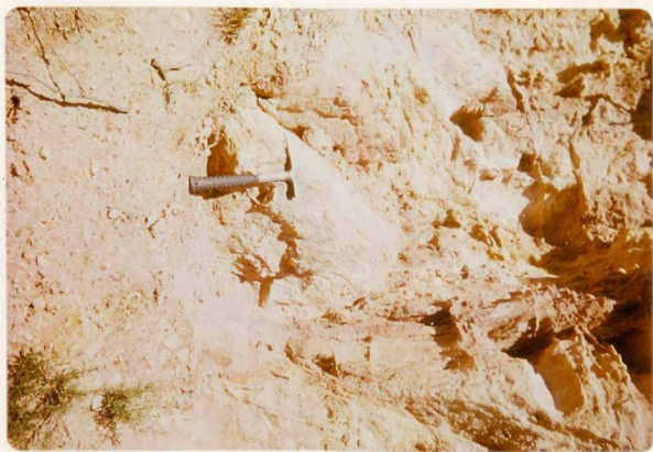
24-33-YC-PC-663.- Xilopalo en materiales de facies Utrillas ( C_{16-21} ).