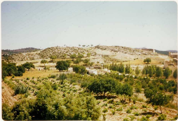
24-33-YC-PC-662.- Vista de la serie del Cenomanense-Turonense = = (C 21-22 ), en El Villarejo.