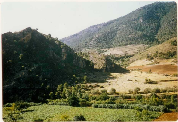
24-33-YC-PC-652.- Vista de la serie Cretácica en Híjar, con intercalaciones recifales, y sobre la misma discordantemente está situado el Mioceno Medio ( T_1 Bb-Bc).