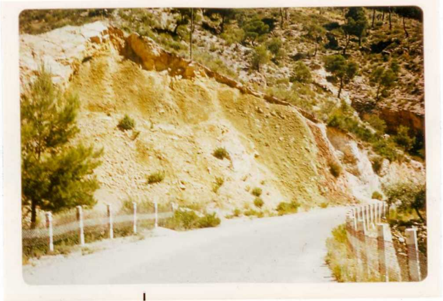
24-33-YC-PC-658.- Vista de las margas del Lías Medio-Superior J_1^3 = en el anticlinal de la carretera Ayna-Royo-Odría.