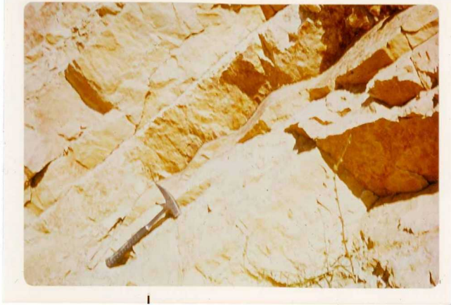
24-33-YC-PC-659.- Ripple-Marks, en las dolomías arcillosas del Lías Medio en la misma localidad.