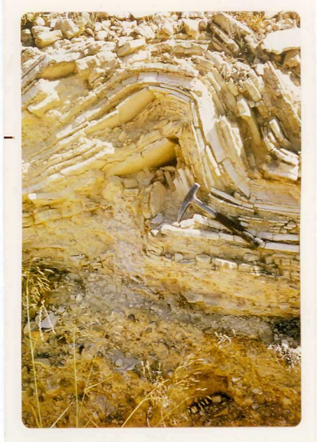
24-33-YC-PC-654.- Pliegue sinsedimentario de deslizamiento, en la= unidad T_{1-2}^B .