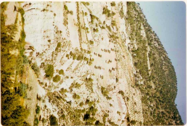
24-33-YC-PC-656.- Materiales triá sicos y liásicos, en Potiche.