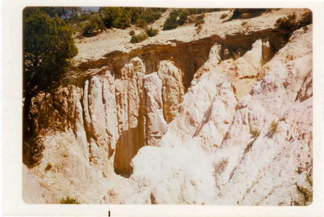
24-33-YC-PC-664.- Vista de las facies Utrillas ( C_{16-21} ) sobre las= cuales hay depósitos pliocenos ( T_2^B ) encontrados en las cercanías del Cortijo de la Casa Quebrada.