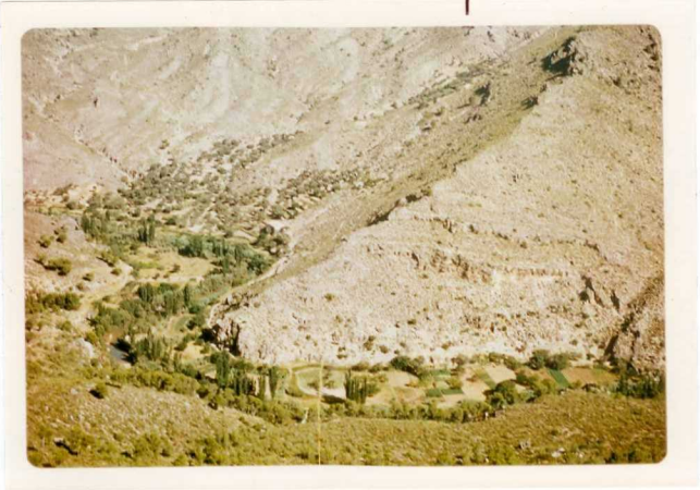
24-33-YC-PC-648.- Vista de los materiales del Jurásico de las proximidades de Lietor, en el río Mundo, unidades = J_1^{2-4} y J_2 .