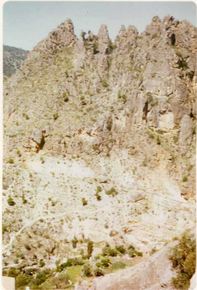
24-33-YC-PC-660.- Aspecto de los materiales del Lías ( J_1^{2-4} ) y == Dogger ( J_2 ) en Ayna.