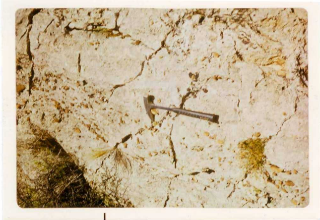
24-33-YC-PC-653.- Aspecto de los materiales conglomeráticos de la unidad T 1 Bb-Bc, Mioceno Medio-Superior.