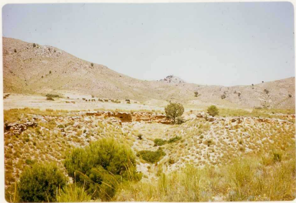
24-33-YC-PC-647.- Depósitos pliocenos al SE de Lietor en el río == Mundo, unidad T 2 B .