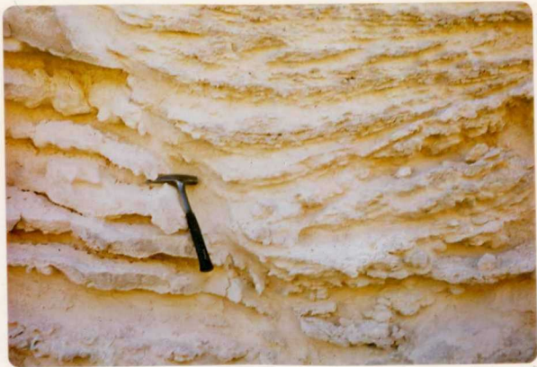
24-33-YC-PC-650.- Fractura sinsedimentaria en los materiales de la unidad ( T_B 1-2 ) Plioceno-Mioceno.