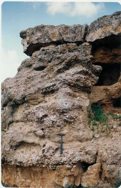
FOTO 19.- Facies Almendralejo (Mioceno). Depósitos de canal con secuencias granodecrecientes. A muro depósito de llanura de inundación.