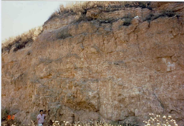
FOTO 21.- Aspecto de la Facies Badajoz (Mioceno) en el corte de la Albuera.