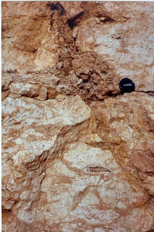
FOTO 13.- Rizocreaciones, brechificación y rellenos estalactíticos en los materiales del Tramo Basal (Mioceno).