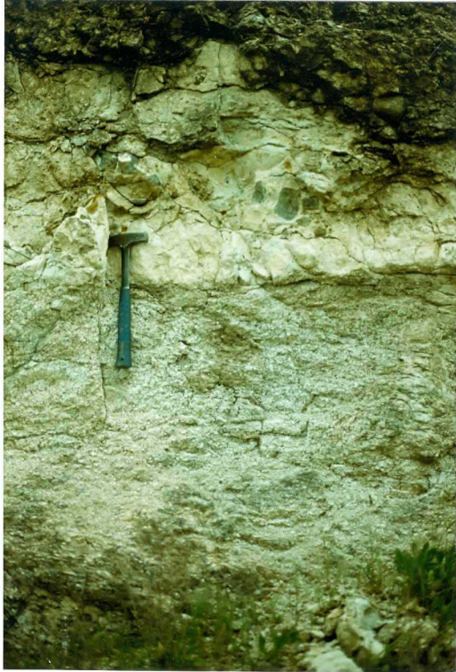
FOTO 11.- Detalle de la discordancia entre el tramo Basal (Mioceno) y el granito de Entrin.