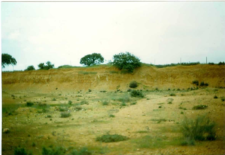
FOTO 28.- Corte de la terraza primera (T1) del río Guadiana en una pequeña cante ra para la explotación de Zahorras.