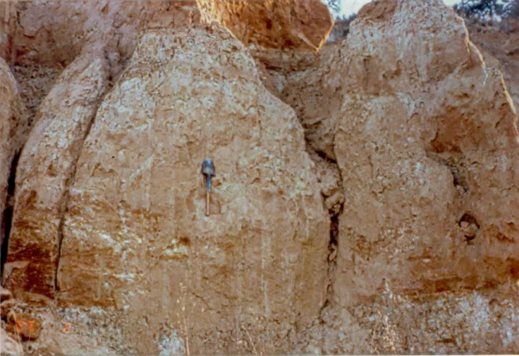
FOTO 25.- Secuencias granodetriticas en la Facies Badajoz (Mioceno).