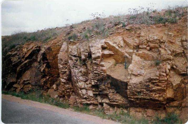
FOTO 2.- S de fractura y S de flujo milonítico en el ortoneis de Aceuchal.