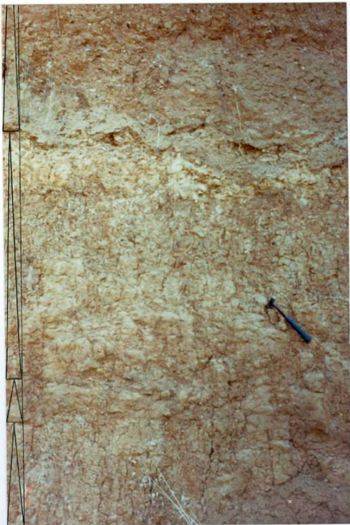
FOTO 8.- Detalle de la foto anterior. Superposición de secuencias granodecrecientes y horizontes edáficos en la Facies Lobón (Mioceno).