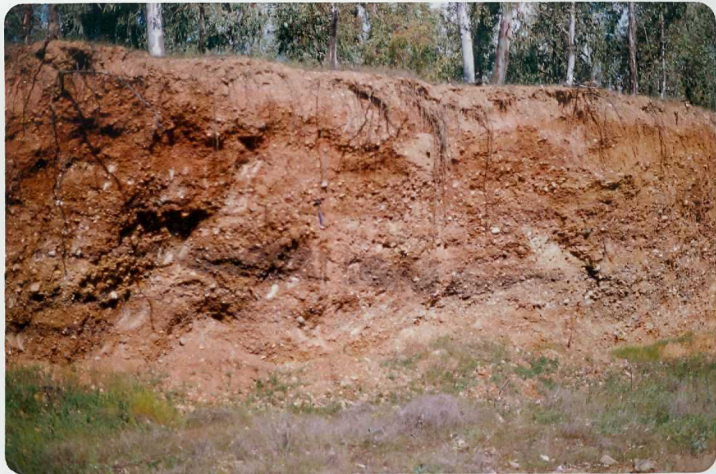
FOTO 27.- Aspecto de la terraza antigua del río Guadajira (T2 del sistema de terrazas del río Guadiana).