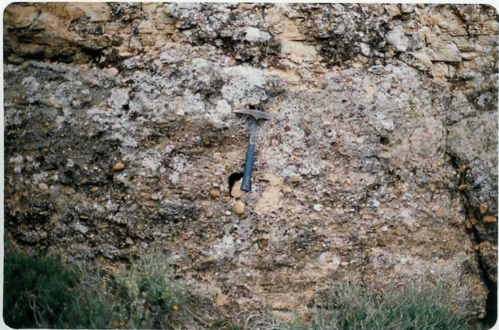
FOTO 16.- Facies Almendralejo (Mioceno). Detalle de un canal. A techo barra areno sa .