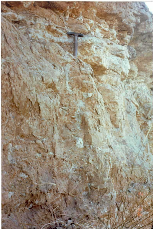
FOTO 23.- Facies Badajoz (Mioceno). Detalle de una secuencia gr nudecreciente.