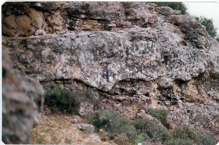
FOTO 14.- Facies Almendralejo (Mioceno). Aspecto típico de un canal. A techo y muro barras arenosas con estratificación cruzada.