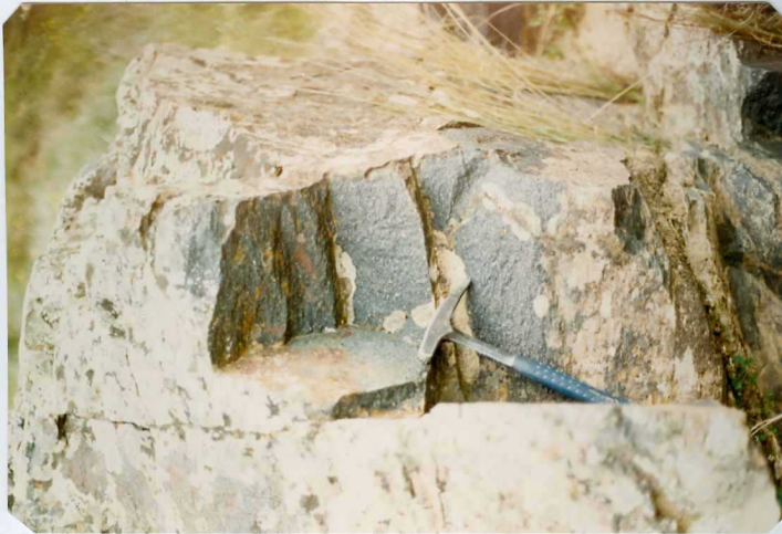
FOTO 1.- DOMINIO DE VALENCIA DE LAS TORRES-CERRO MURIANO. Detalle de los neises biotíticos y/o anfibólicos (Proterozoico).