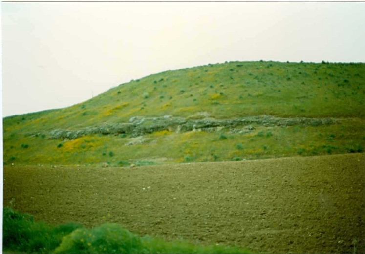
FOTO 24.- Resalte morfológico de los depósitos canalizados de la Facies Badajoz (Mioceno) en la Albuera.