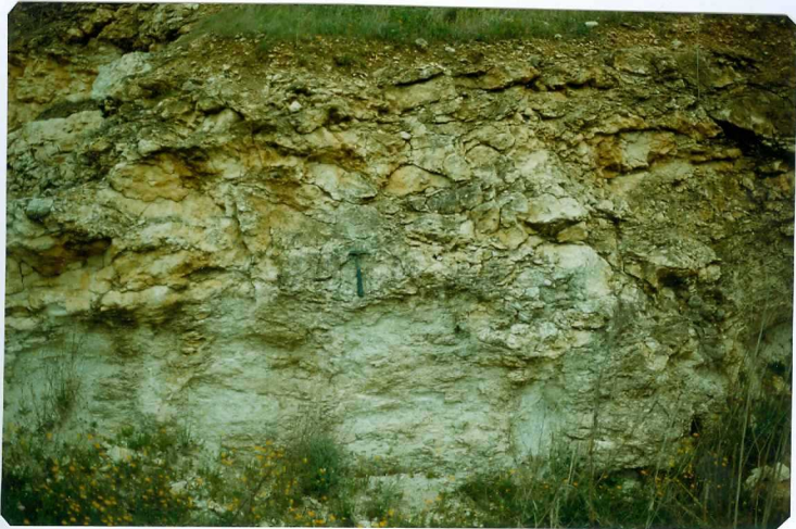
FOTO 10.- Contacto discordante del Tramo Basal (Mioceno) sobre el granito de Entrin.