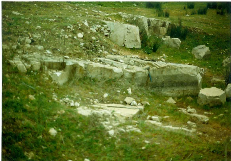
FOTO 5.- Afloramiento del granito de Entrin.