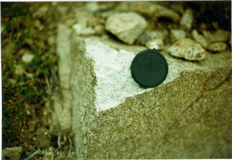
FOTO 6.- Detalle del granito de Entrin.