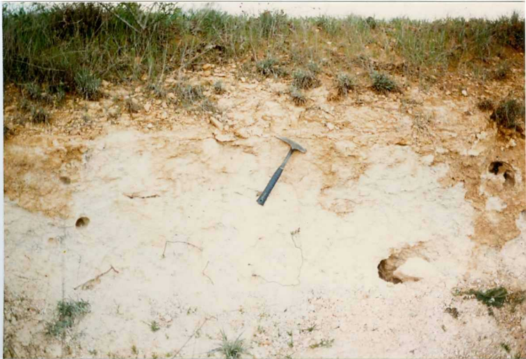
FOTO 26.- Carbonatos lacustres (Mioceno). A techo nivel de carbonatos laminados, a muro carbonatos pulverulentos.