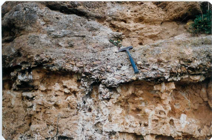
FOTO 18.- Facies Almendralejo (Mioceno). Lag de cantos cuarcíticos sobre sedimentos de llanura de inundación.