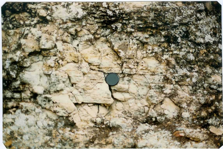
FOTO 17.- Facies Almendralejo (Mioceno). Estratificación cruzada debida al crecimiento de barras (braid-bars).