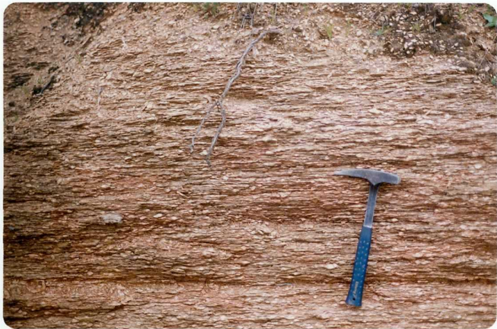
FOTO 3.- S de flujo milonítico en el ortoneis de Aceuchal.