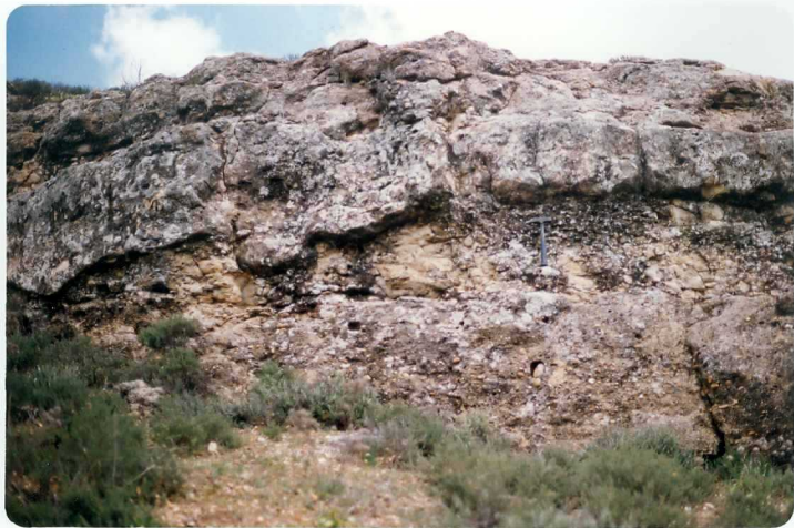
FOTO 15.- Facies Almendralejo (Mioceno). Barra arenosa entre dos canales.