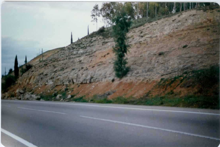
FOTO 9.- Contacto discordante de la Facies Almendralejo sobre la Facies Lobón (Mioceno) en el km. 373,5 de la N-V (Lobón, Hoja de Montijo).