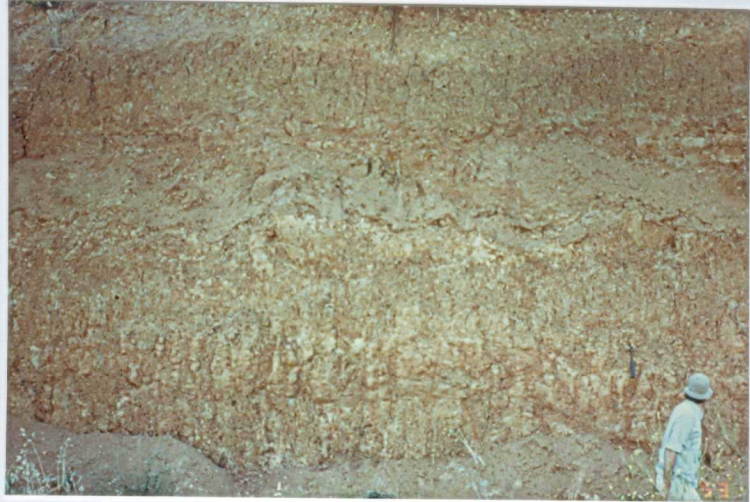
FOTO 7.- Aspecto de las arcillas de la Facies Lobón (Mioceno) en el escarpe del río Guadajira al N de Solana de los Barros.