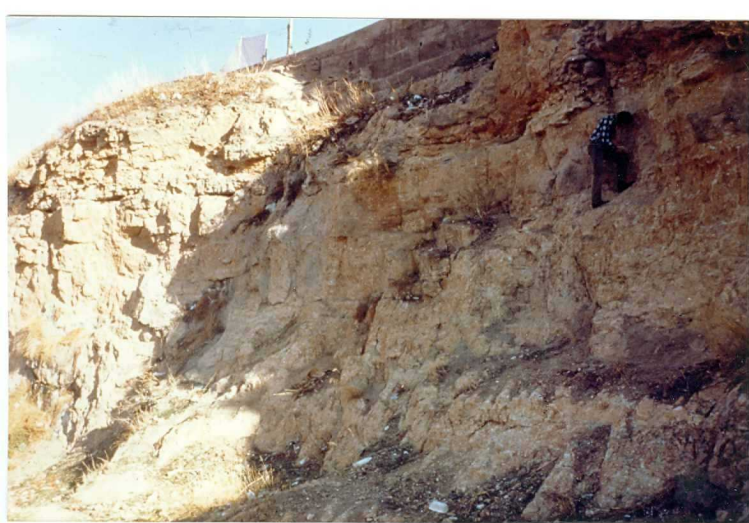
FOTO 22.- Aspecto de la Facies Badajoz (Mioceno) en el corte de la Albuera.