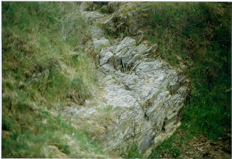
FOTO 1.- DOMINIO DE ARROYOMOLINOS. UNIDAD DE CUMBRES. Aspecto de las pizarras y grauvascas de la Alternancia de Cumbres (Cámbrico Inferior).