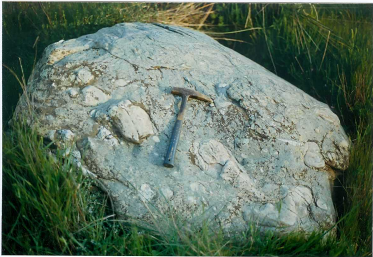
FOTO 18.- DOMINIO DE ARROYOMOLINOS. UNIDAD DE CUMBRES. Detalle de los conglomerados a muro de los esquistos de Barrancos (Tremadoc-Llanvir).