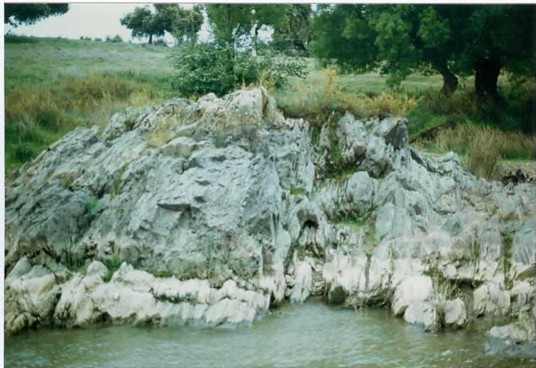
FOTO 5.- DOMINIO DE ARROYOMOLINOS. UNIDAD DE CUMBRES. Tobas y lavas de la serie volcano-sedimentaria (Cámbrico Medio-Superior).