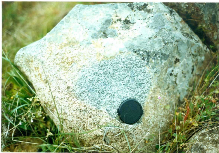
FOTO 22.- Detalle de la microdiorita.