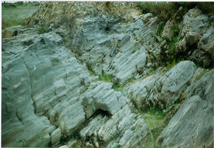
FOTO 6.- DOMINIO DE ARROYOMOLINOS. UNIDAD DE CUMBRES. Serie volcanosedimentaria (Cámbrico Medio-Superior). Detalle de la foto anterior.