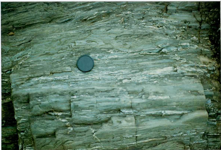
FOTO 7.- DOMINIO DE ARROYOMOLINOS. UNIDAD DE CUMBRES. Lavas de composición básica. Serie volcanosedimentaria (Cámbrico Medio-Superior).