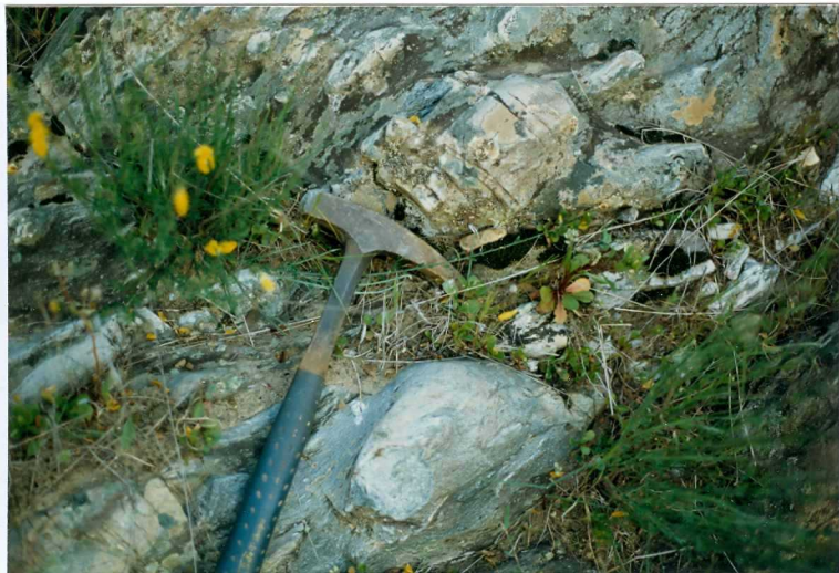
FOTO 17.- DOMINIO DE ARROYOMOLINOS. UNIDAD DE CUMBRES. Detalle de los conglomerados a muro de los esquistos de Barrancos (Tremadoc-Llanvir).