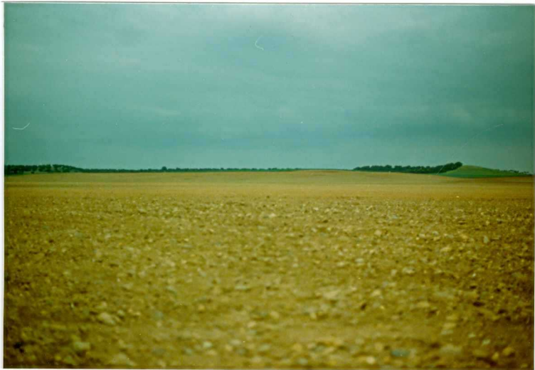
FOTO 24.- Glasis de derrame de la terraza alta (I-1) del Guadiana.