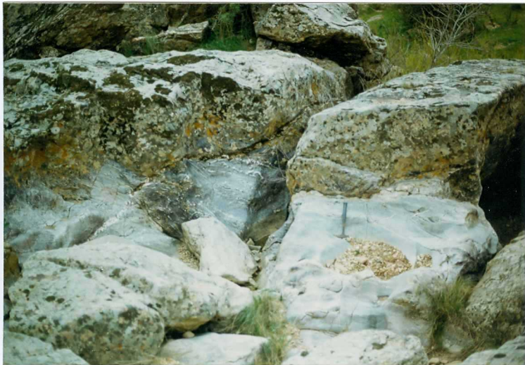
FOTO 4.- DOMINIO DE ARROYOMOLINOS. UNIDAD DE CUMBRES. Detalle de las volcanitas ácidas in tercaladas a techo de la Alternancia de Cumbres (Cámbrico Inferior).