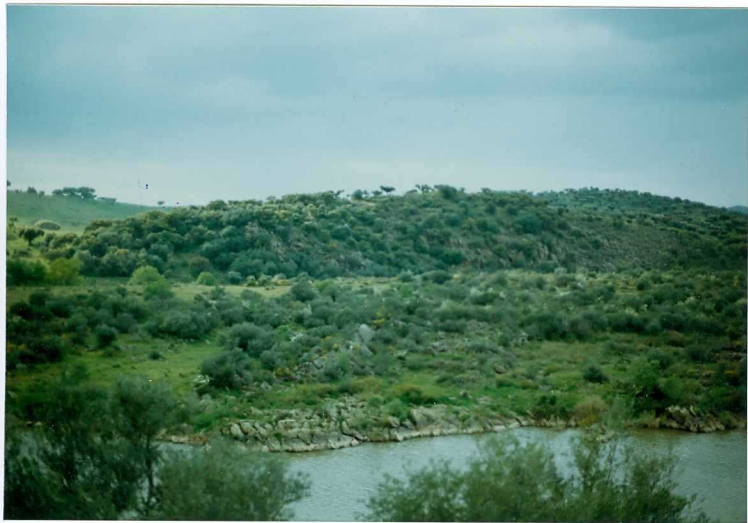
FOTO 8.- DOMINIO DE ARROYOMOLINOS. UNIDAD DE CUMBRES. Resalte geomorfológico de una barra cuarcítica intercalada en la serie volcanosedimentario del Cámbrico Medio-Superior en la margen portuguesa del Río Guadiana.