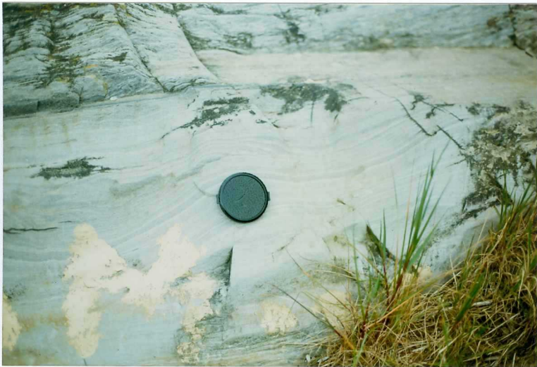
FOTO 20.- DOMINIO DE ARROYOMOLINOS. UNIDAD DE CUMBRES. Detalle de la So en los esquistos de Barrancos (Tremadoc-Llanvir).