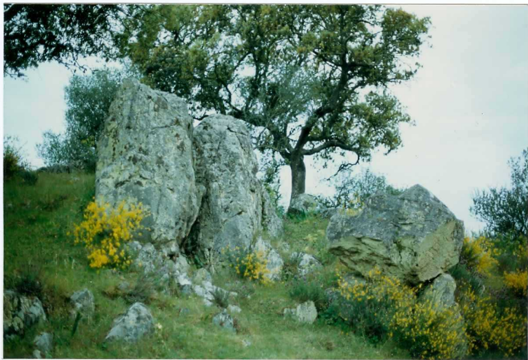
FOTO 10.- DOMINIO DE ARROYOMOLINOS. UNIDAD DE CUMBRES. Niveles de cuarcita feldespática a muro de la serie volcanosedimentaria del Cámbrico Medio-Superior.