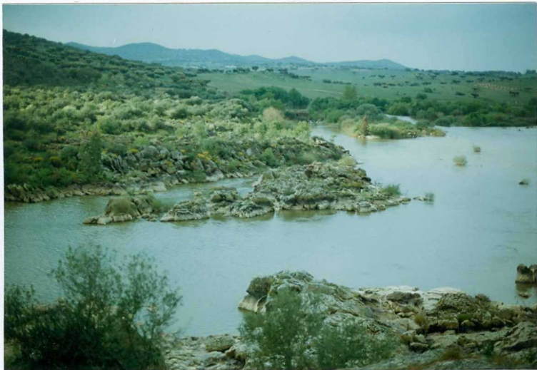
FOTO 3.- DOMINIO DE ARROYOMOLINOS. UNIDAD DE CUMBRES. Afloramientos de volcanitas ácidas intercaladas a techo de la Alternancia de Cumbres (Cámbrico Inferior).