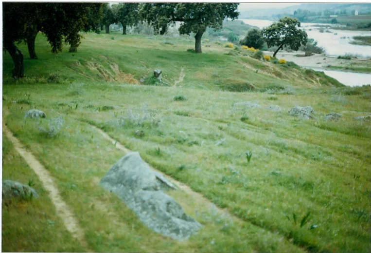
FOTO 21.- Asomos de microdioritas.