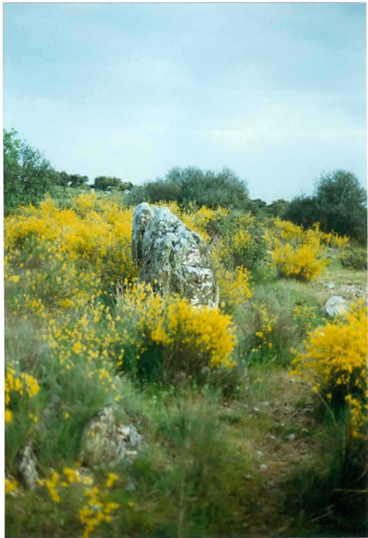
FOTO 16.- DOMINIO DE ARROYOMOLINOS. UNIDAD DE CUMBRES. Nivel de conglomerados a muro de los esquistos de Barrancos (Tremadoc-Llanvir).