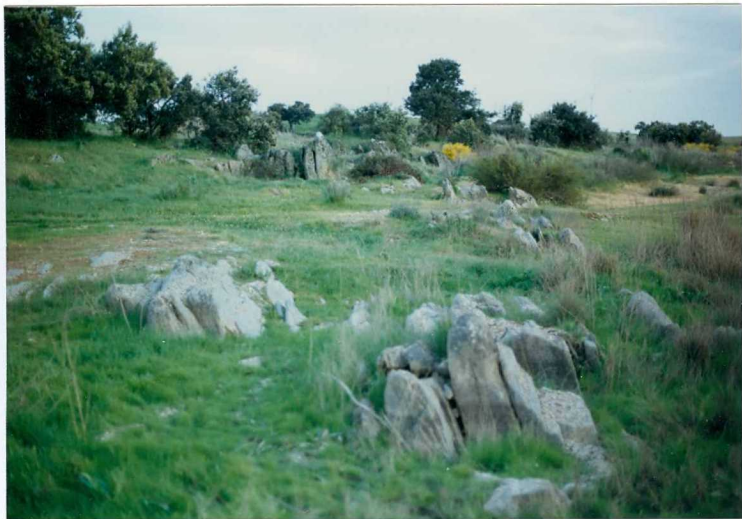
FOTO 13.- DOMINIO DE ARROYOMOLINOS. UNIDAD DE CUMBRES. Aspecto de las metarenitas de color gris-verdoso del Cámbrico Medio-Superior (Fatuquedo).