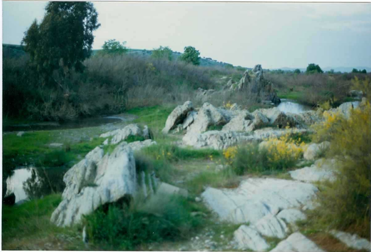
FOTO 14.- DOMINIO DE ARROYOMOLINOS. UNIDAD DE CUMBRES. Metarenitas del Cámbrico Me dio-Superior (Fatuquedo).