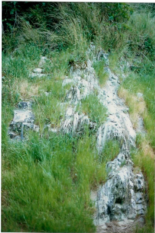
FOTO 19.- DOMINIO DE ARROYOMOLINOS. UNIDAD DE CUMBRES. Esquistos verdosos satinados (esquistos de Barrancos). Bajo el martillo uno de los niveles cuarcíticos que marcan la discordancia de estos materiales sobre Fatuquedo en el sector N de la Hoja.