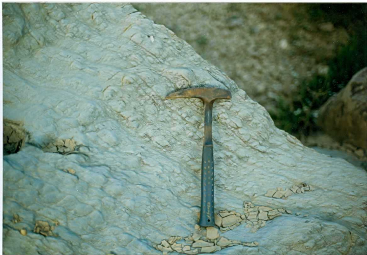
FOTO 15.- DOMINIO DE ARROYOMOLINOS. UNIDAD DE CUMBRES. Detalle de la So en las metarenitas del Cámbrico Medio-Superior. (Fatuquedo).