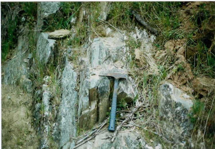
FOTO 2.- DOMINIO DE ARROYOMOLINOS. UNIDAD DE CUMBRES. Detalle de las pizarras y grauvascas de la Alternancia de Cumbre (Cámbrico Inferior).