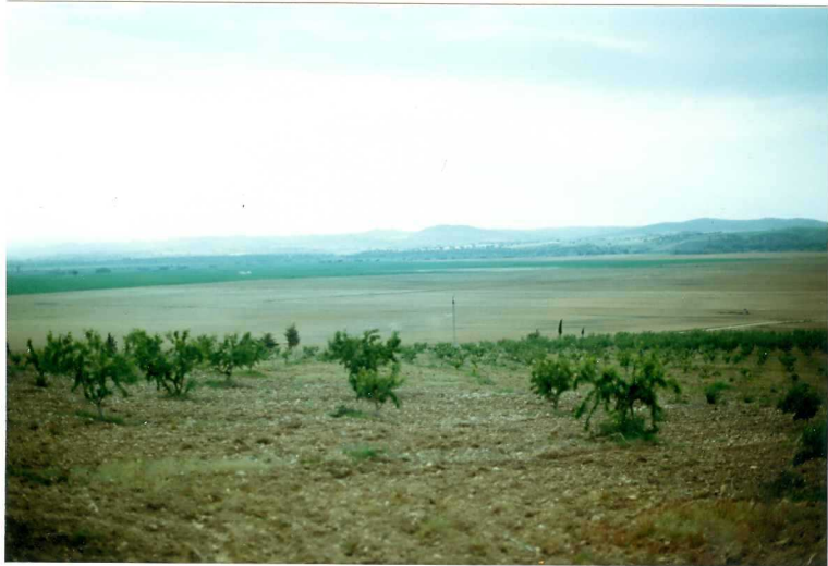
FOIO 23.- Vista panorámica de la terraza baja (I-3) del Guadiana.