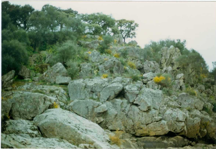
FOTO 9.- DOMINIO DE ARROYOMOLINOS. UNIDAD DE CUMBRES. Aspecto de una barra cuarcítica in tercalada en la serie volcanosedimentaria del Cámbrico Medio-Superior.