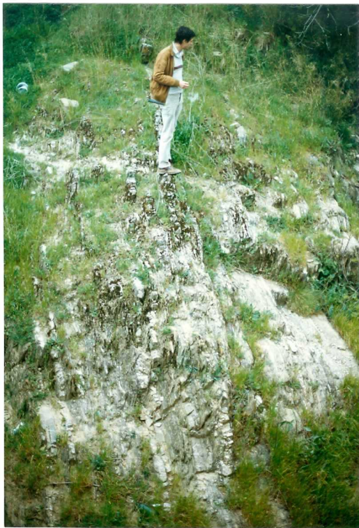
FOTO 12.- DOMINIO DE ARROYOMOLINOS. UNIDAD DE CUMBRES. Afloramiento de esquistos y metarenitas con blastos de estauroлита y/o andalucita (Cámbrico Medio-Superior).