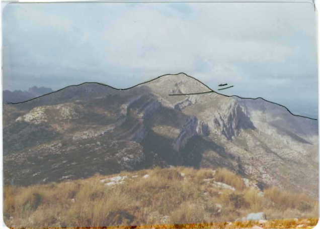
Foto nº5 (MZ 256) Sierra Corbera, falda Norte, en el meridiano de Favareta. Terrenos corridos del Senonense inferior sobre el Senonense superior.