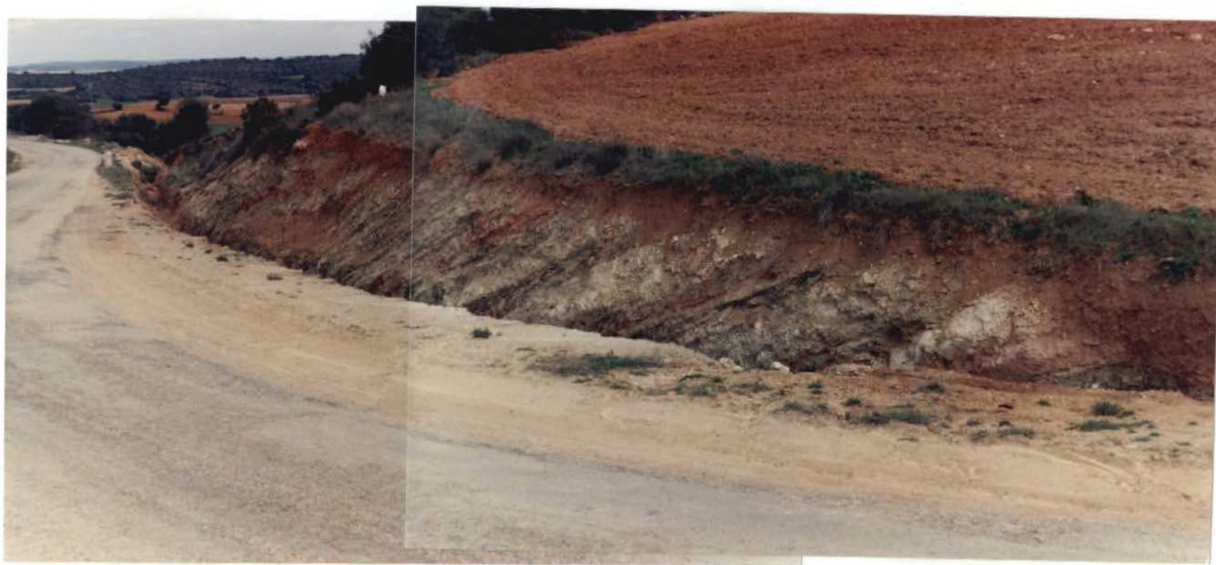
FOTO 22-27-AD-AG-9305 F.- Serie arcillo-margosa del Cretácico inferior en Facies Weald. Carretera de Los Hinogosos a Osa de la Vega. Km. 4