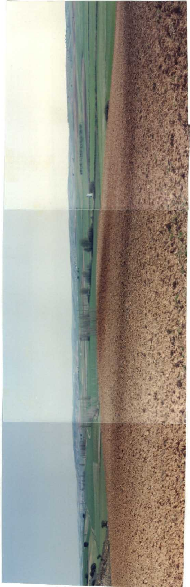
FOTO 22-27-AD-AG-9322 F.- Vista panorámica del Valle del río Záncara en la Hoja de Belmonte.