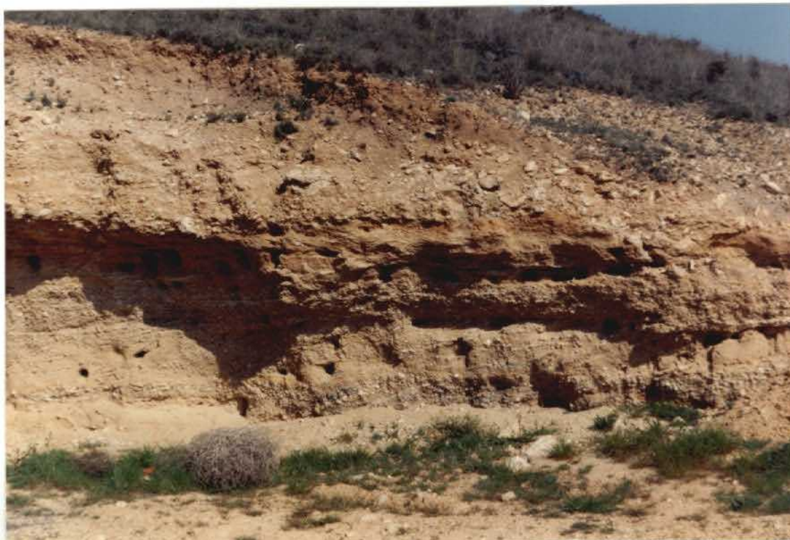
FOTO 22-27-AD-AG-9323 F.- Depósitos de terrazas en la margen derecha del río Záncara.