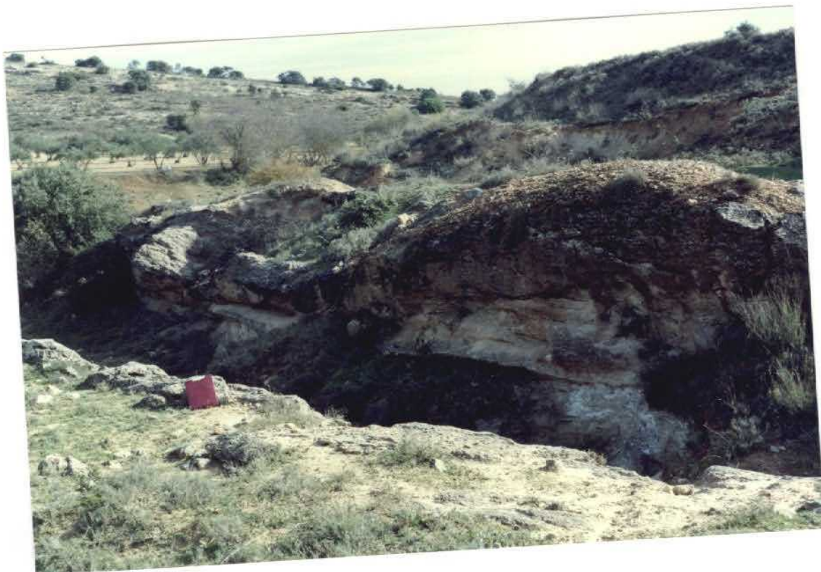
FOTO 22-27-AD-AG-9306 F.- Formación "Arenas de Utrillas". Canales de areniscas arcóscicas en el lugar conocido como Casas de Colmenar de Lillo, a unos 2 Km al SW de Los Hinojosos.