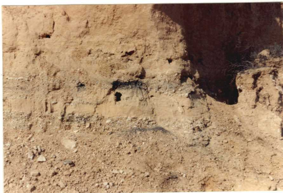
FOTO 22-27-AD-AG-9324 F.- Detalle de la foto anterior.