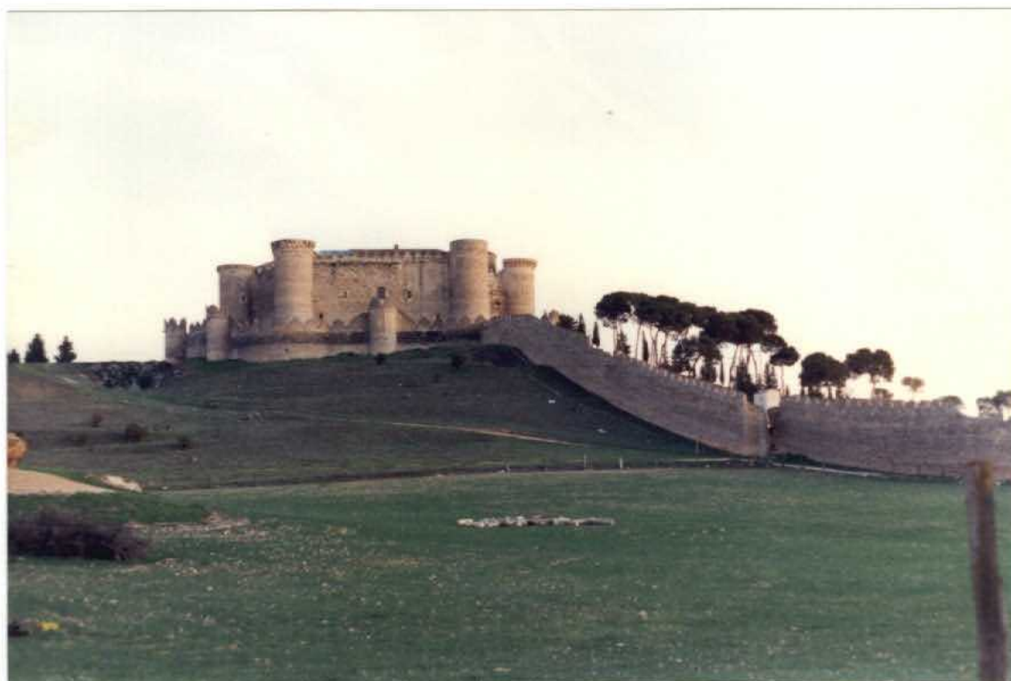
FOTO 22-27-AD-AG-9300F.- Vista septentrional del Castillo de Belmonte y la muralla que circunda la población