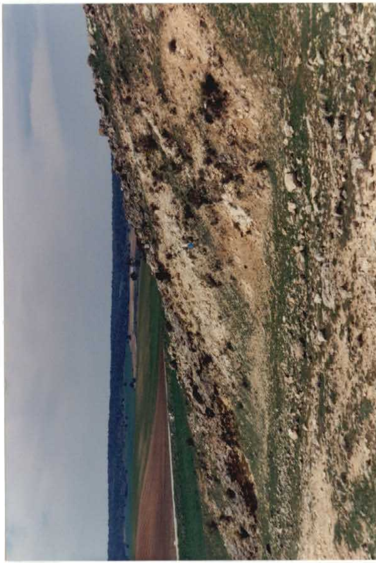
FOTO 22-27-AD-AG-9315 F.- Idénticos depósitos a los anteriores en el mismo lugar.