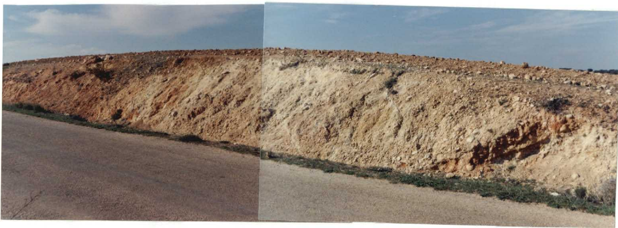
FOTO 22-27-AD-AG-9316 F.- "Unidad Detrítica Inferior" en la carretera de Rada de Haro a Carrascosa de Haro, Km. 13,500. Conglomerados calcáreos y cuarcíticos, areniscas y arcillas. Flanco occidental de una estructura sinclinal con dirección N-S.