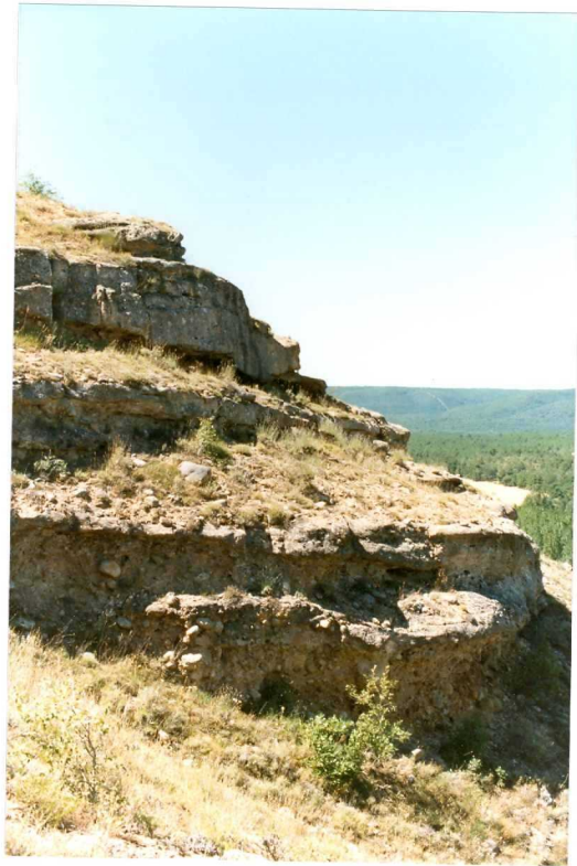
F. 1055.- Conglomerados y areniscas de la u.c. 7.