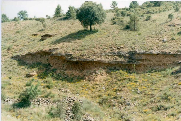
23-15-IT-AG-01 F.- Serie de Velacha. Conglomerados y areniscas de unidad cartográfica 7.

*SIN UBICACIÓN EN PLANO DE SITUACIÓN DE MUESTRAS, NI HAY FICHAS MCC1.