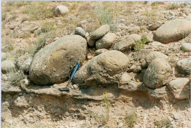
23-15-IT-AG-04 F.- Molino de Velacha. Imbricación de cantos y bolos. Unidad cartográfica 7.

*SIN UBICACIÓN EN EL PLANO DE SITUACIÓN DE MUESTRAS. NI HAY FICHAS MCC1