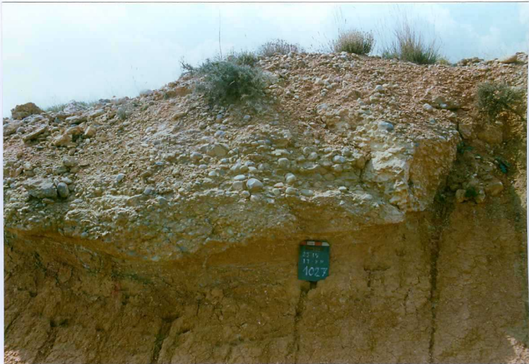
F. 1027.- Conglomerados canalizados de la u.c. 8 sobre arcillas rojas de la misma unidad, en las cercanías de Bliecos.