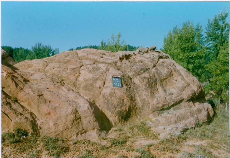
F. 1031.- Areniscas de Ribarroya (u.c. 1). La bioturbación enmascara las estructuras primarias aunque puede notarse alguna estratificación cruzada de surco.