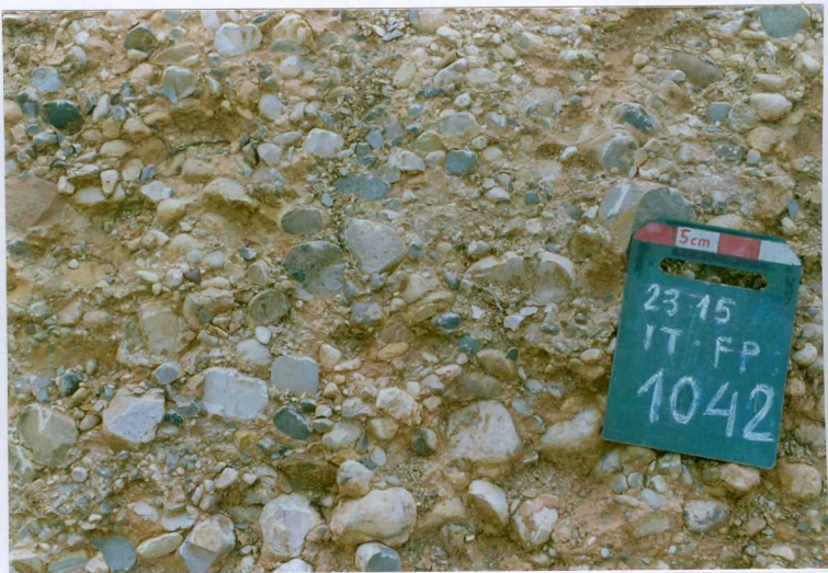
F. 1042.- Detalle de los conglomerados de la u.c. 6 en la carretera de Serón de Nágima a Ledesma de Soria.