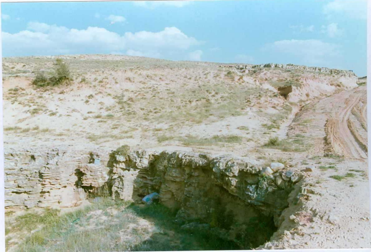
F. 1044.- Areniscas de la u.c. 1 cerca de Ituro. Las conexiones a la u.c. 7.