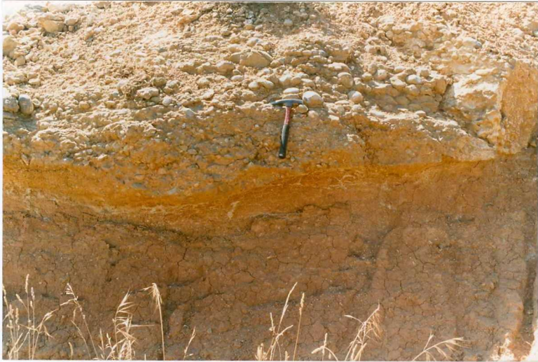
F. 1051.- Conglomerado de base de la u.c. 6 apoyado sobre arcillas de la u.c. 2.