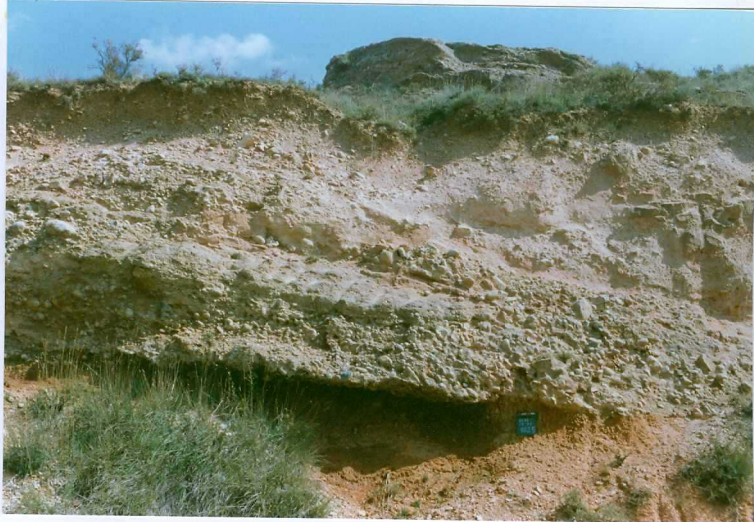
F. 1035.- Conglomerados de base de la u.c. 6 en las cercanías de Borjabad.