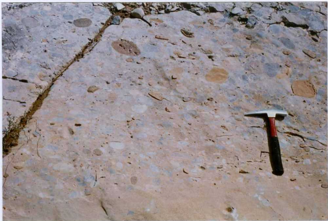
F. 1058.- Detalle de la foto 1056.

* SIN UBICACIÓN EN EL PLANO DE SITUACIÓN DE MUESTRAS, NO HAY FICHAS MCC1.