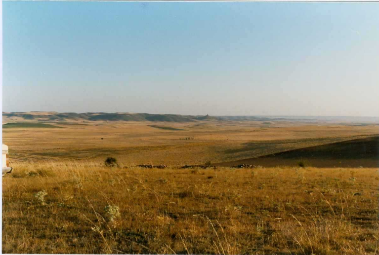
F. 1050.- Panorámica de los relieves tabulares de la u.c. 10 en el sur de la Hoja.