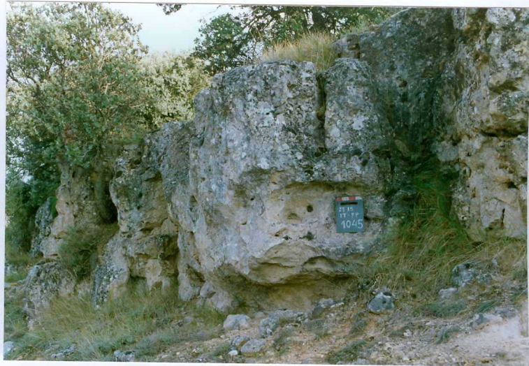
F. 1045.- Areniscas silíceas, masivas y bioturbadas, pertenecientes a la u.c. 7.