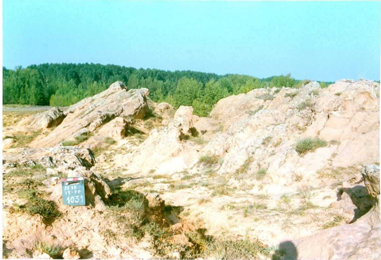
F. 1032.- Areniscas de Ribarroya (u.c. 1).