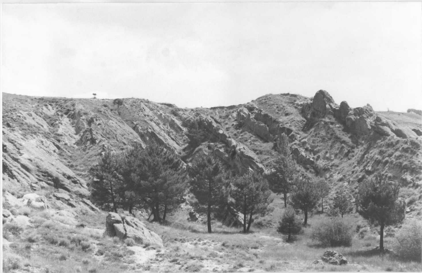
23-15-IT-AG-10 F.- Aspecto de conjunto de las areniscas de la unidad cartográfica 1 (Areniscas de Ribarroja).

*SIN UBICACIÓN EN EL PLANO DE SITUACIÓN DE MUESTRAS. NO HAY FICHAS MCC1.