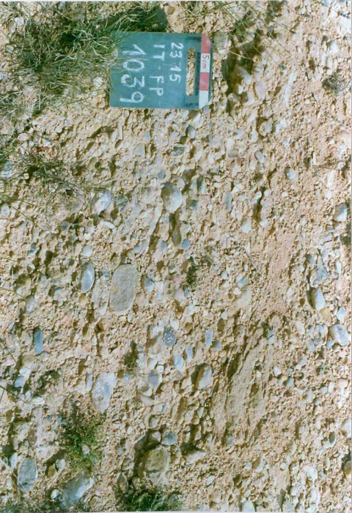
F. 1039.- Detalle del conglomerado de base de la u.c. 8.