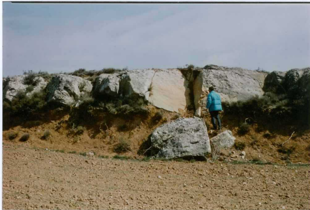
F. 1056.- Conglomerados de la u.c. 2, cerca de Ledesma de Soria.

* SIN UBICACIÓN EN EL PLANO DE SITUACIÓN DE MUESTRAS, NO HAY FICHAS MCC1.