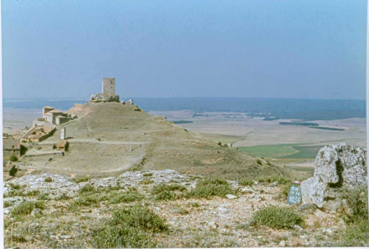
F. 1034.- Panorámica del afloramiento anterior (situado en la base de la atalaya).