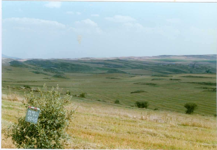
F. 1040.- Aspecto de conjunto de la u.c. 2 (arcillas con paquetes de conglomerados) cerca de Zárabes.