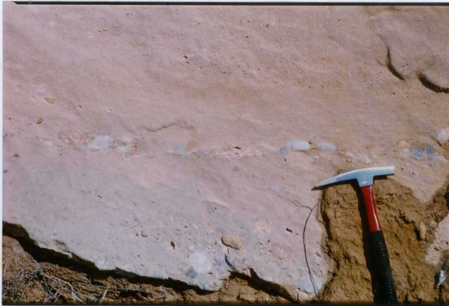
F. 1057.- Conglomerados y areniscas canalizados (base) y con lag de cantos (parte media) en la u.c. 2. (Detalle de la foto anterior).

* SIN UBICACIÓN EN EL PLANO DE SITUACIÓN DE MUESTRAS. NO HAY FICHAS MCC1.