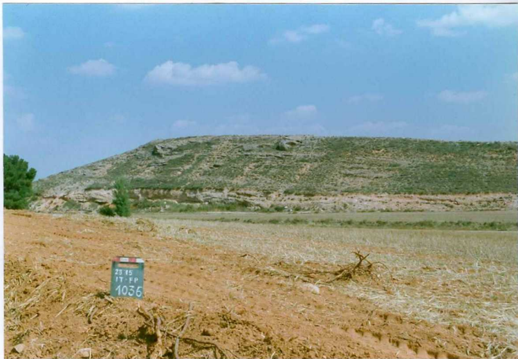
F. 1036.- Vista del conjunto del afloramiento anterior (u.c. 6).