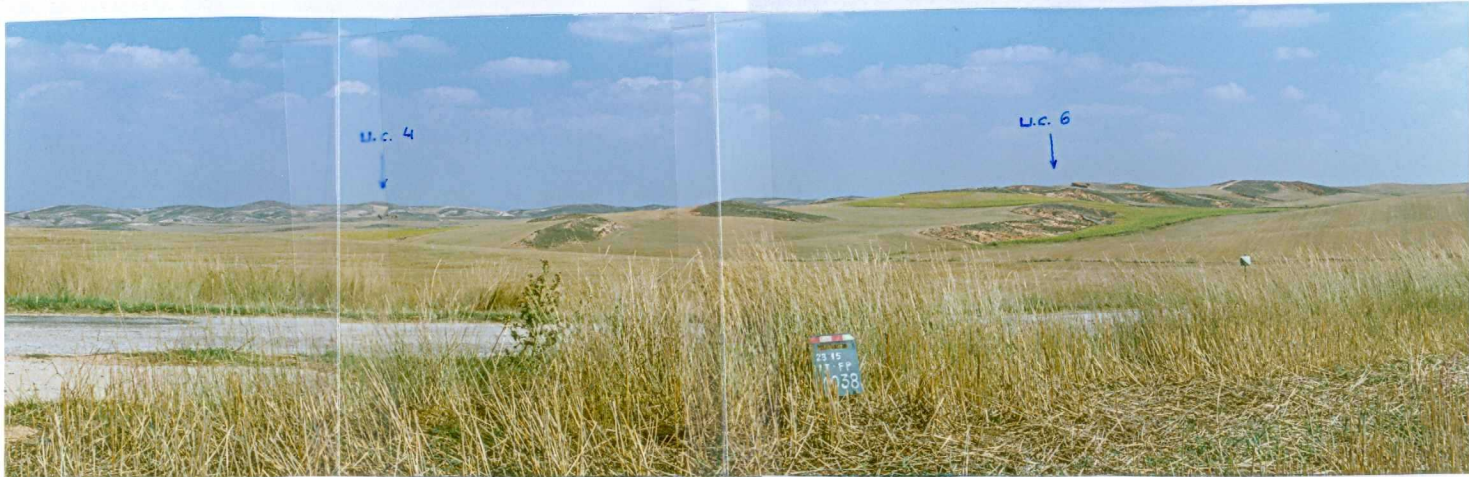
F. 1038.- Panorámica de la u.c. 6 dispuesta discordantemente sobre la 4.