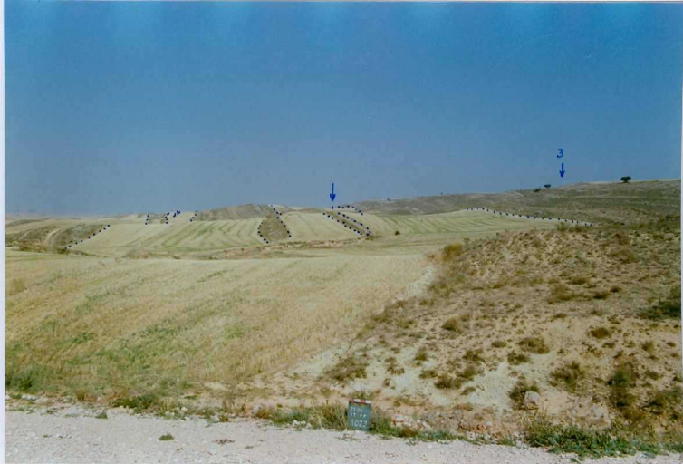
F. 1023.- Panorámica de la u.c. 2 (áreas sembradas) compuesta por arcillas con algunos canales de conglomerados y de la u.c. 3 (planicie y laderas de la derecha de la fotografía).