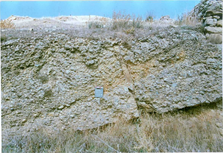
F. 1024.- Barras conglomeráticas en la u.c. 5 (Castil de Tierra).