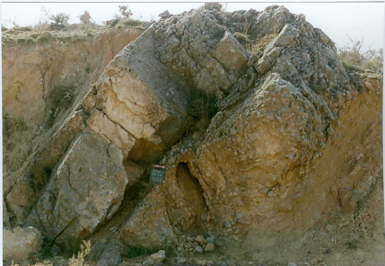
F. 1022.- Conglomerados de cantos calcáreos de la u.c. 3 cerca de Almenar de Soria.