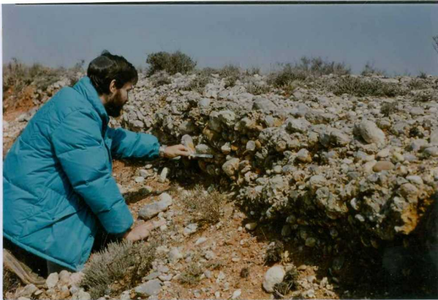
F. 1060.- Conglomerados de la u.c. 3.

*SIN UBICACIÓN EN EL PLANO DE SITUACIÓN DE MUESTRA NO HAY FICHAS MCC1.