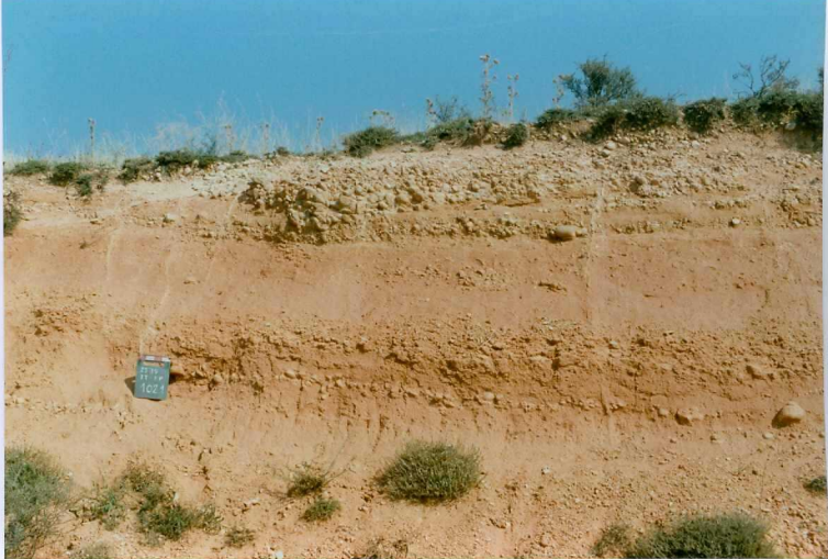
F. 1021.- Conglomerados, arenas y limos de la u.c. 8 cerca de Almenar de Soria.