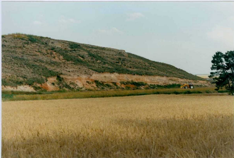
23-15-IT-AG-06 F.- Conglomerados de la base de la unidad cartográfica 6.

*SIN UBICACIÓN EN EL PLANO DE SITUACIÓN DE MUESTRAS, NO HAY FICHAS MCC1.