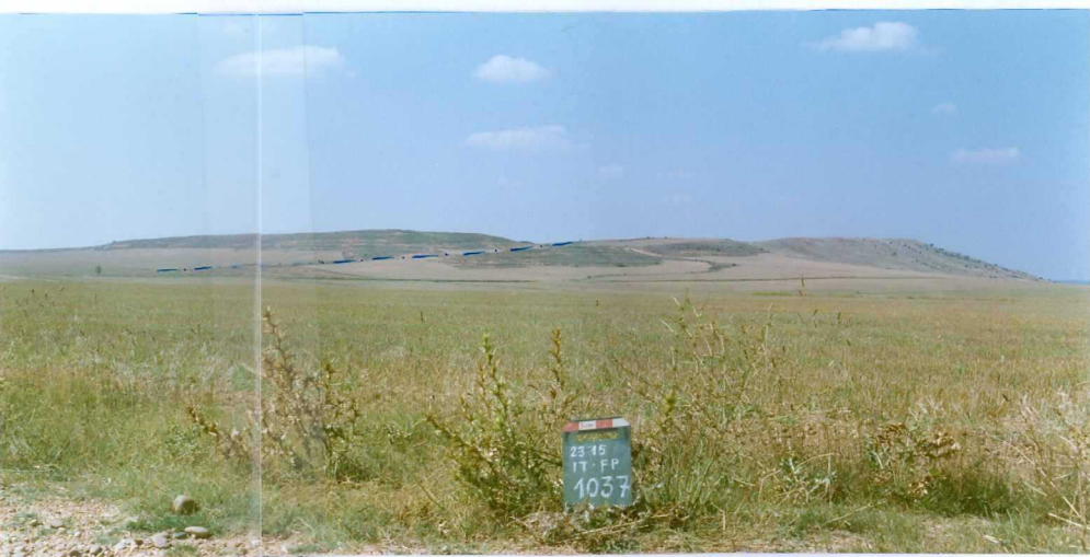
F. 1037.- Panorámica de la discordancia que separa las u.c. 6 y 8 en el cerro Torrejalba.