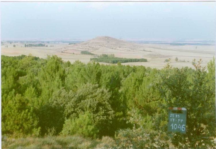
F. 1046.- Vista del Cerro de S. Blas en el que se superponen las u.c. 1 (areniscas silíceas) y 2 (conglomerados calcáreos).