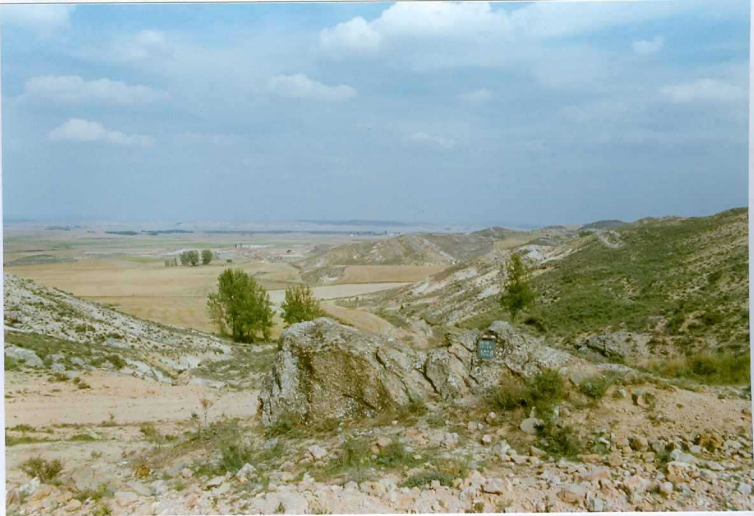
F. 1028.- Panorámica de las calizas, areniscas y arcillas de la u.c. 4, en Boñices.