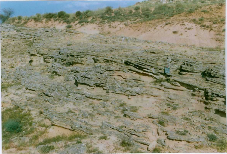
F. 1043.- Areniscas con estratificación cruzada planar de la u.c. 1. Proximidades de Ituero (Cerro Perales).