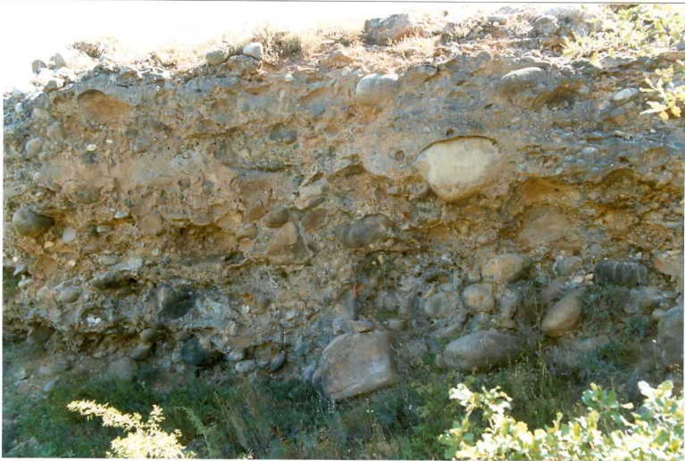
F. 1053.- Aspecto de los conglomerados con bolos de la u.c. 7.