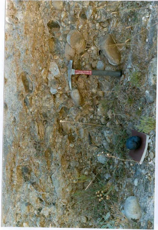
F. 1054.- Imbricación de cantos cuarcíticos en los conglomerados de la u.c.