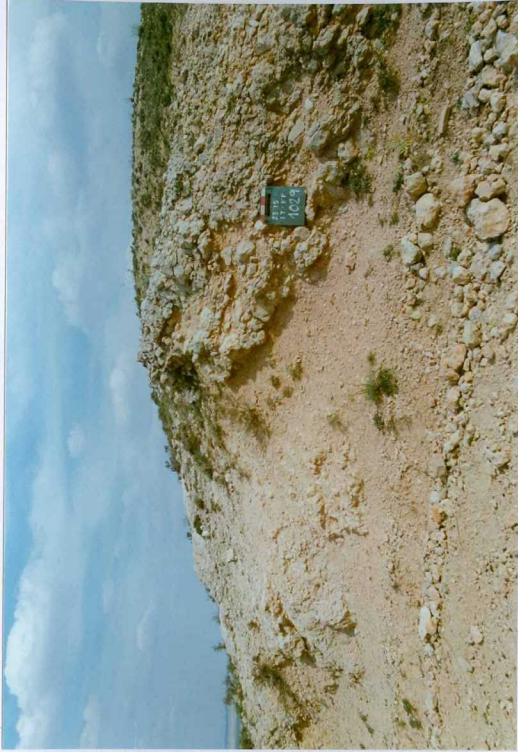
F. 1029.- Calizas de la u.c. 4.

*SIN UBICACIÓN EN EL PLANO DE SITUACIÓN DE MUESTRAS, NO HAY FICHAS MCC1.