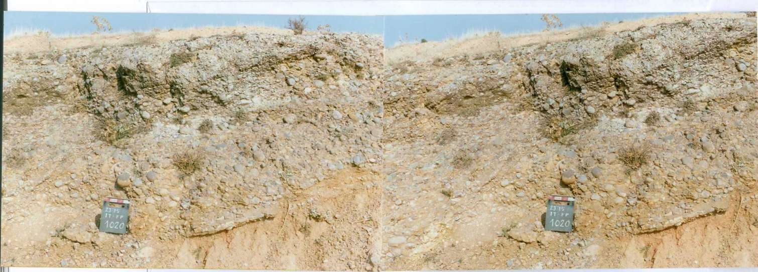
F. 1020 y 1020 bis.- Par estereoscópico de los conglomerados de cantos calcáreos (jurásicos en su mayoría) de la unidad cartográfica (u.c.) 3. Cercanías de Aliud.