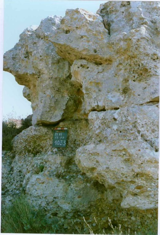
F. 1033.- Areniscas y conglomerados calcáreos de la u.c. 10 en las proximidades de Moñux.