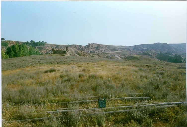
F. 1030.- Panorámica de las areniscas de Ribarroja (u.c. 1).