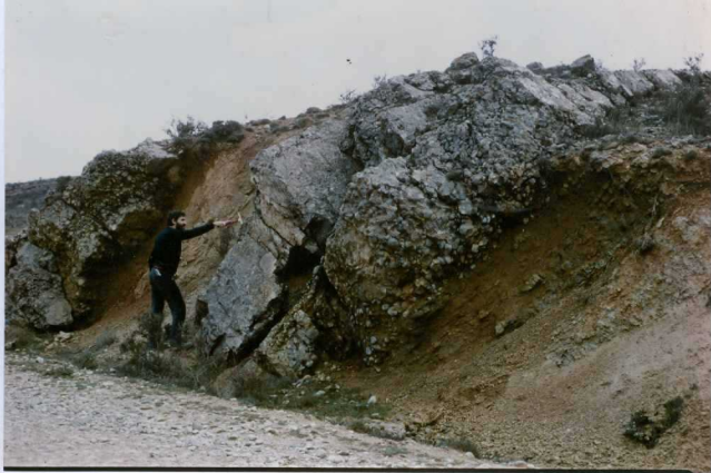
F. 1059.- Conglomerados y arcillas de la u.c. 3, cerca de Ledesma de Soria.

* SIN UBICACIÓN EN EL PLANO DE SITUACIÓN DE MUESTRAS NO HAY FICHAS MCC1.