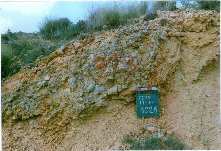
F. 1026.- Conglomerados de la base de la u.c. 6.