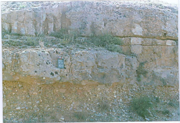
F. 1048.- Areniscas y conglomerados de la u.c. 10.