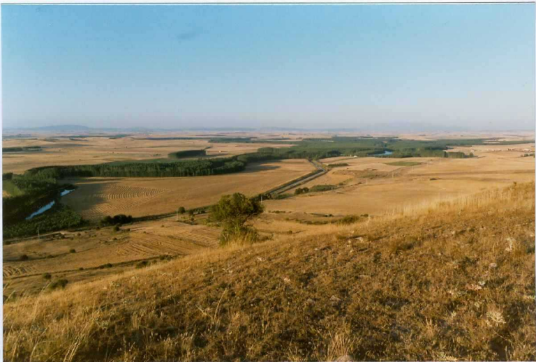
F. 1049.- Panorámica del valle del río Duero en las cercanías de Torrejalba, donde desarrolla un amplio sistema de terrazas.