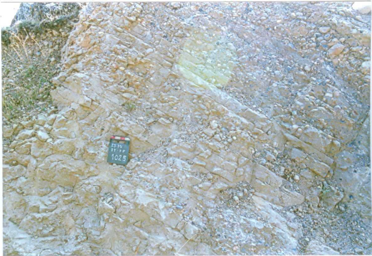
F. 1025.- Areniscas y conglomerados de la u.c. 5. (Castil de Tierra).