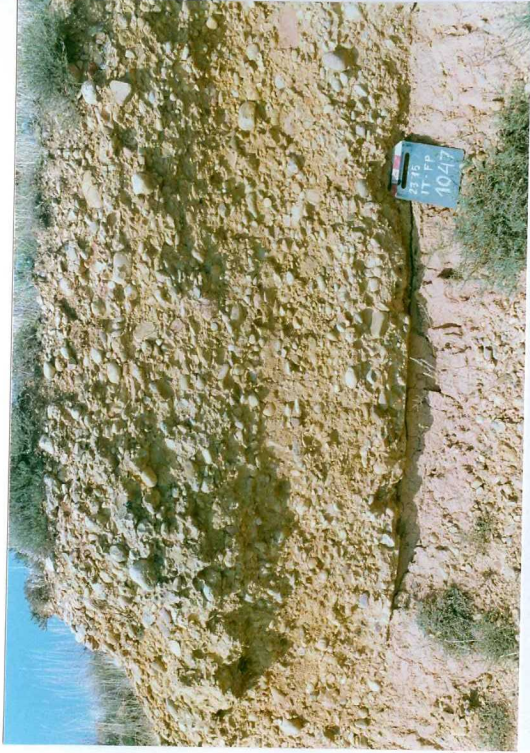
F. 1047.- Conglomerados de base débilmente erosiva de la u.c. 9.