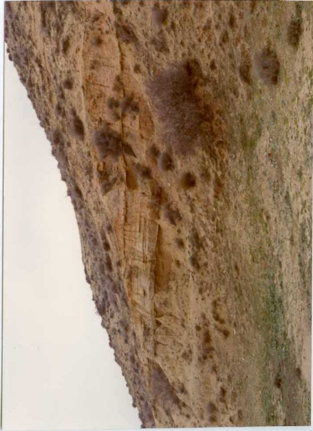
13-15 -GM-AC -513 .- Disconformidad entre las margas y limo- litas (T Ab ) y los ritmos detriticos su- riores (T Ab-Ac ) (T C.2 -2)