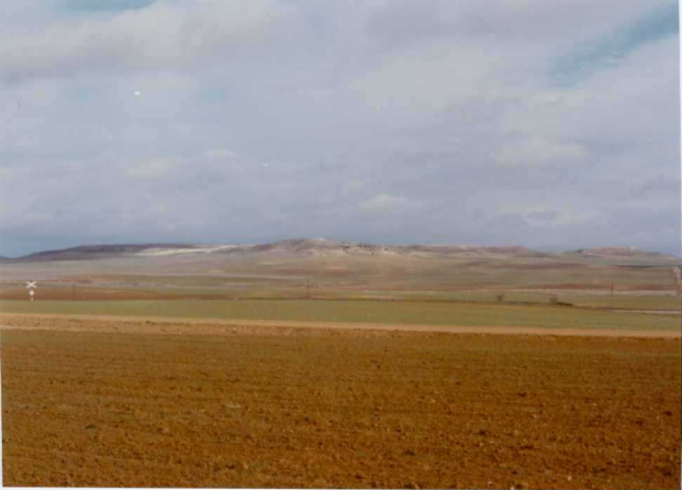
13-15 -GM-AC -509 .- Panorámica del Teso Tardemayas. Margas y limolitas ( T_{C.2}^{AB} ), con calizas en el techo ( T_{C.2}^{AB} ).