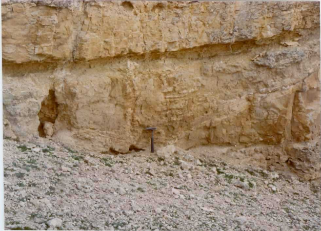
13-15 -GM-AC -511 .- Paleocauce en los ritmos areniscosos del Eoceno Medio-Superior ( T_{Ab-Ac} ) c.2-2