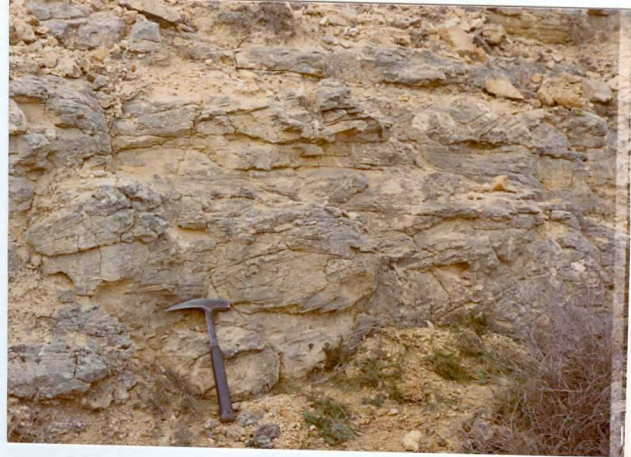
13-15 -GM-AC -515 Estratificación cruzada T^{Ab-Ac} C.2-2