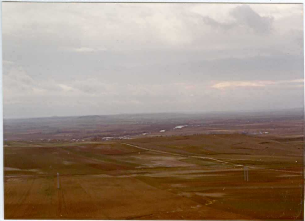
13-15 -GM-AC -519 .- Panorámica del valle del Duero