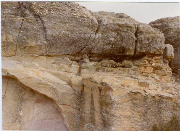
13-15 -GM-AC -507 .- Lentejon más arcilloso en los niveles de arenisca y conglomerados con cemento silíceo (Ts A-Aa C.1-2 )