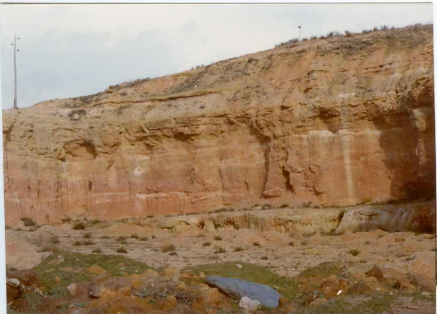
13-15 -GM-AC -501 .- Aspecto del tramo inferior del Terciario. Areniscas con niveles de gravas. T A-Aa T C.1-2