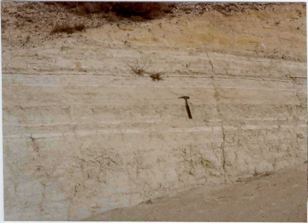
13-15 -GM-AC -510 .- Detalle de las margas y limolitas ( T_{C.2}^{AB} )