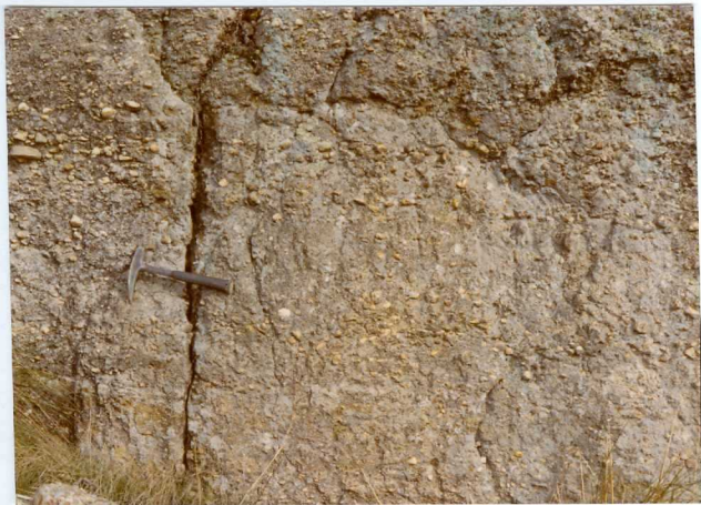
13-15 -GM-AC -506 .- Detalle de las areniscas y conglomerados con cemento siliceo (Ts A-Aa C.1-2)