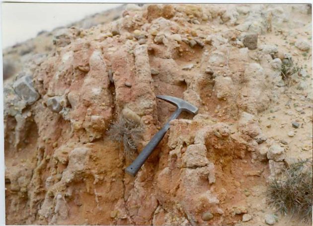
13-15 -GM-AC -520 .- Detalle de areniscas Post-eocenas ( Tc^B )