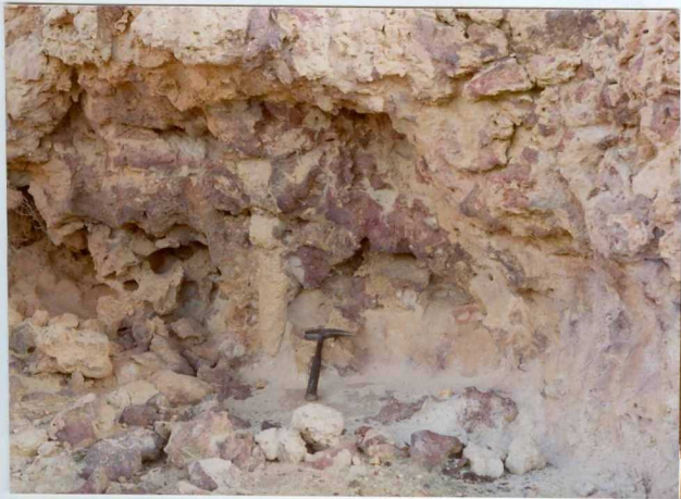
13-15 -GM-AC -502 ➔ Detalle de la costra ferralitica con la que comienza la serie Terciaria.