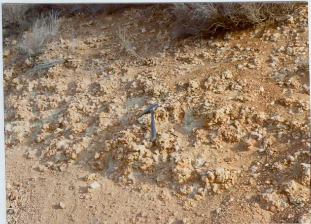
13-15 -GM-AC -508 .- Detalle del nivel calcáreo del Neogeno ( Tc_{c.}^B )