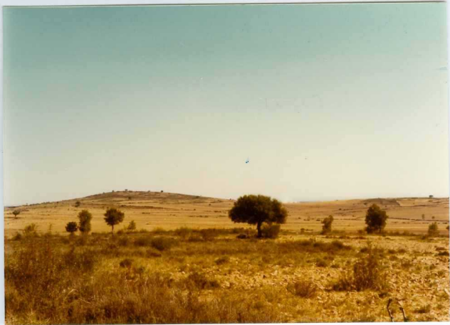
13-15 -GM-AC -525 .- Recubrimientos cuaternarios sobre cuar- citas y liditas.