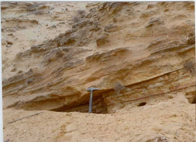
13-15 -GM-AC -514 .- Superficie erosiva y estratificación cruzada en la base de uno de los ritmos detríticos superiores ( T_{C.2-2}^{Ab-Ac} )