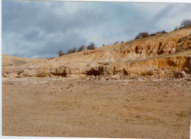
13-15 -GM-AC -503 .- Costra ferralitica y facies detritica superior en la zona de Montamarta . T A-Aa C.1-2