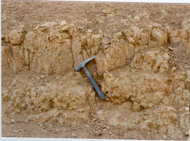
13-15 -GM-AC -516 .- Detalle de areniscas Post-eocenas( Tc^B )