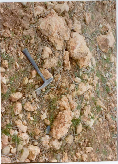
13-15 -GM-AC -521 .- Costra calcărea \text{Fe}^B \text{C}^B