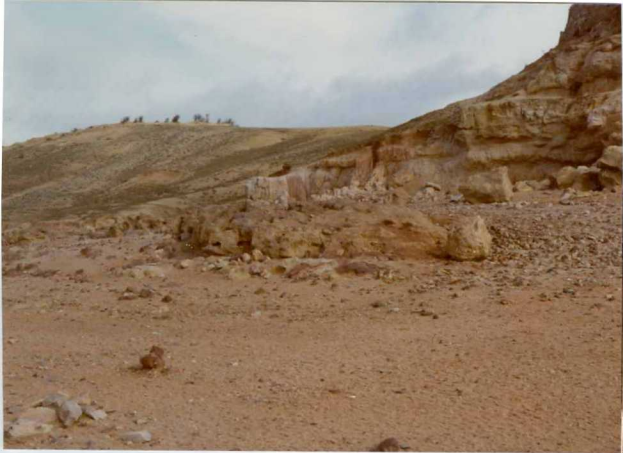
13-15 -GM-AC -504. Costra ferralitica y facies detritica superior en la zona de Montamarta. T A-Aa C.1-2