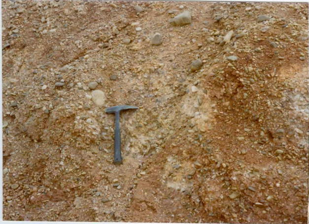
13-15 -GM-AC -517 .- Detalle de conglomerados Post-eocenos (Tc B )