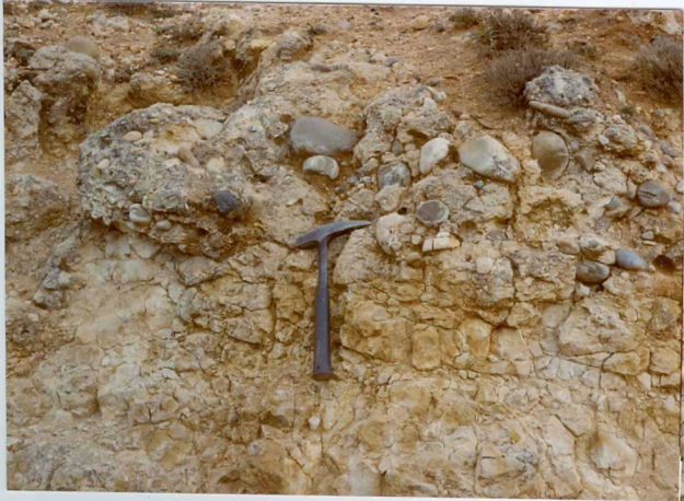
13-15 -GM-AC -518 .- Detalle de la base de uno de los ritmos detriticos areniscosos ( Tc_{2-2}^{Ab-Ac} )