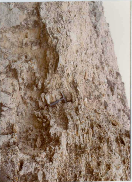
13-15 -GM-AC-512 .- Estructuras "Slump" en las margas y limolitas ( T_{c.2}^{Ab} )