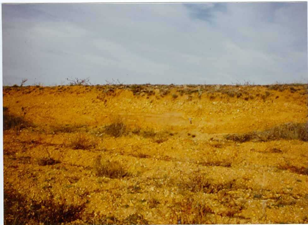
12.11-IM-VA-9050.- Terraza 5 al SO de Santa Elena de Jamuz (17).