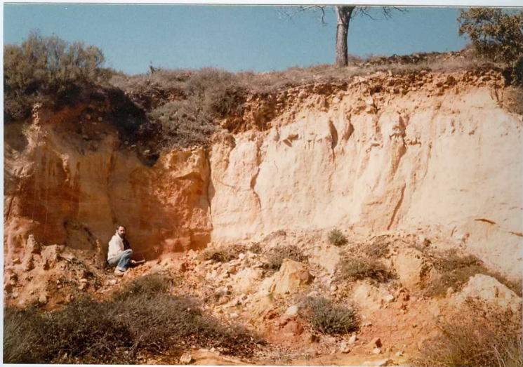
12.11-IM-AC-9754.- Depósitos de pendiente intercalados entre los sedimentos fluviales del Sistema de La Valduerna. Cercanías de Pobladura de Yuso. S. de La Valduerna. (9 y 10).