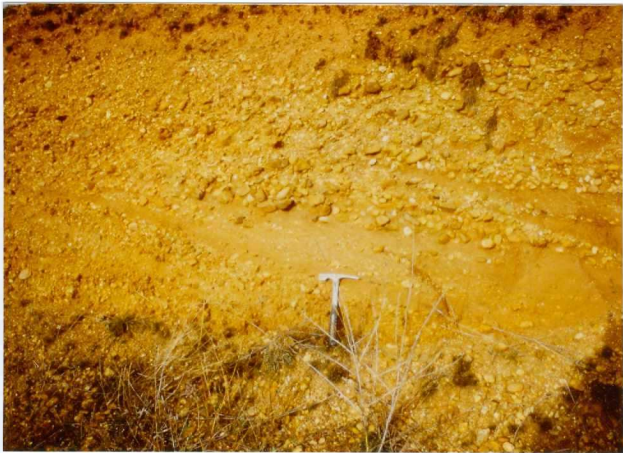
12.11-IM-VA-9051.- Detalle del depósito anterior (17).