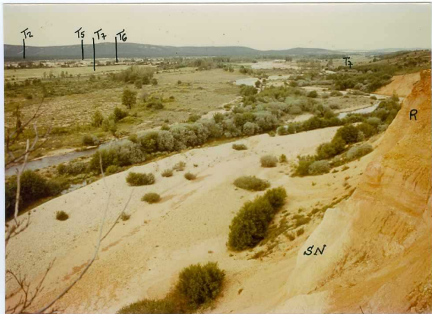
12.11-IM-VA-9065.- Valle del Río Eria al S de Nogarejas. Erosión lateral importante del Sistema de Nogarejas (SN) y de La Raña. (R). (12 y 8).