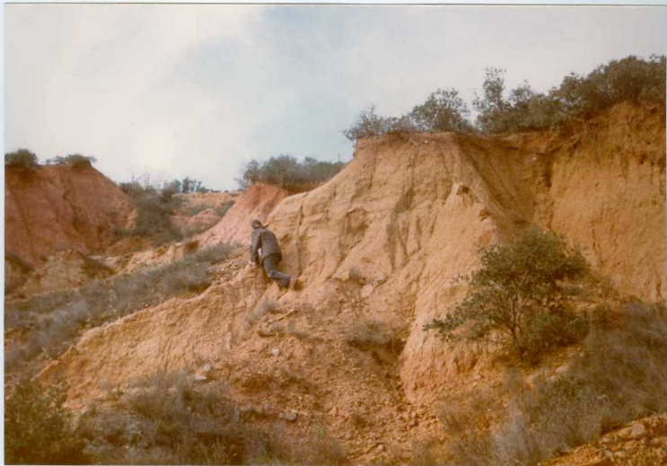
12.11-IM-AC-9757.- Canal del Sistema de La Valduerna relleno por arenas. Tramo 3 de la Serie de Herreros de Jamuz. S. de La Valduerna. (9 y 10).