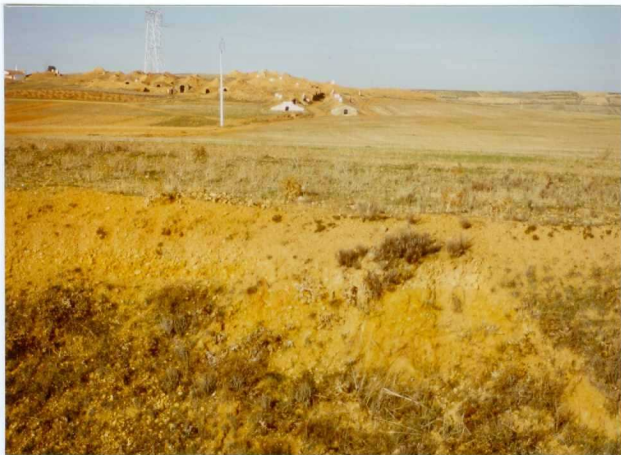
12.11-IM-VA-9037.- Depósitos de T_5 del Jamuz en trinchera del FF.CC. (17). S. de San Martín de Torres.