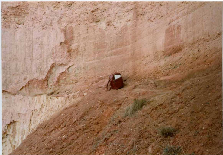
12.11.IM-AC-9752.- Detalle de la anterior. Superficie erosiva basal y estratificación cruzada en surco del tramo 8. S. de Nogarejas. (8 y 9).