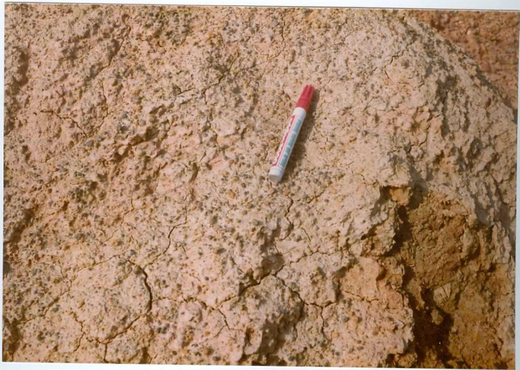
12.11-IM-AC-9756.- Facies de nódulos de manganeso en los depósitos de llanura de inundación del Sistema de La Valduerna. Tramo 2 de la Serie de Herreros de Jamuz. S. de La Valduerna. (10).