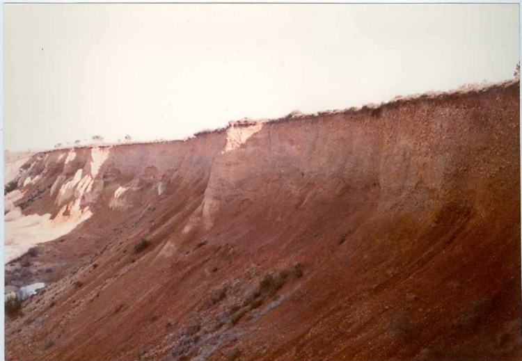
12.11-IM-AC-9751.- Panorámica de la Serie de Nogarejas bajo los depósitos de Raña al Sur de Nogarejas. S. de Nogarejas. (8, 9 y 12).