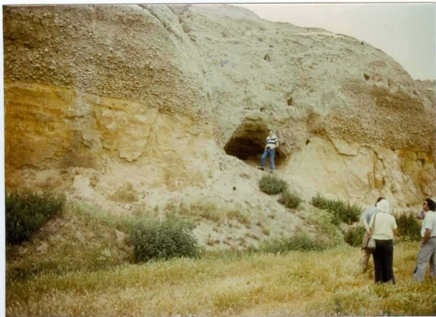
12.11-IM-VA-9076.- Depósitos de T_{12} (24) y depósitos antrópicos grisáceos (33) sobre limos y arcillas del S de Carrizo-Benavides. (7) en Hinojo.