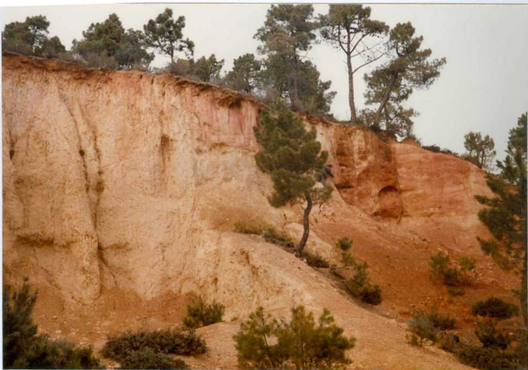
12.11-IM-AC-9762.- Canal relleno por arenas y gravas encajados en los fangos de llanura de inundación. Proximidades de Torneros. S. de La Valduerna (9 y 10).