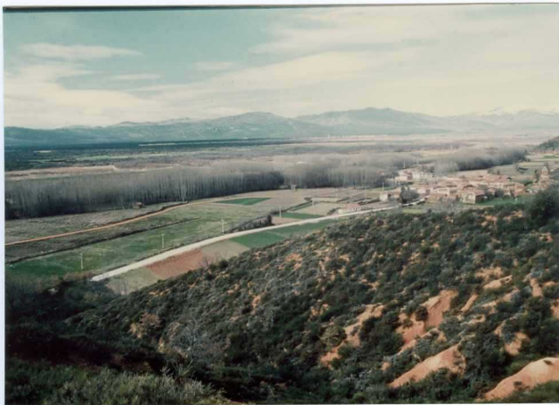
12.11-IM-VA-9075.- Valle del Río Duerna en Castrillo de La Valduerna. Los términos medios, con Tabuyo del Monte, son los niveles T_2 , T_5 , T_6 y T_7 con escaso salto entre ellos. Al fondo de la Sierra del Teleno (14, 17, 18 y 19).