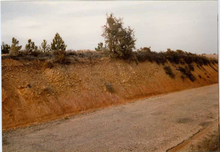
12.11-IM-AC-9763.- Aspecto de los canales rellenos por conglomerados del Sistema de La Valduerna.