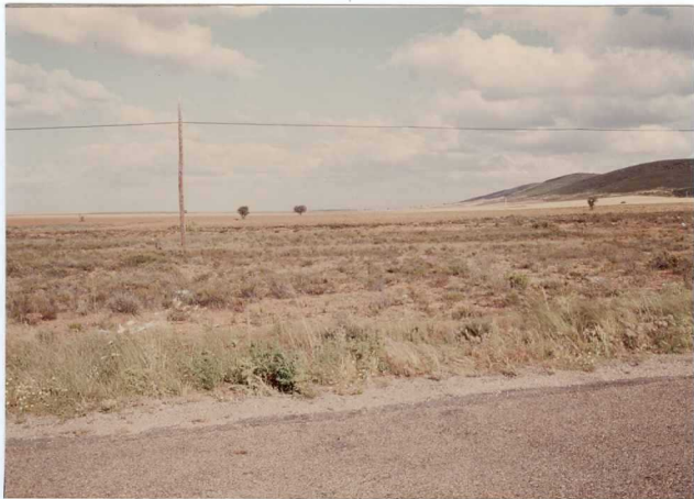
12.11-IM-VA-9007.- Enlace de la vertiente NE de la S a de Casas Viejas con la T 2 al SO de Jiménez de Jamuz.