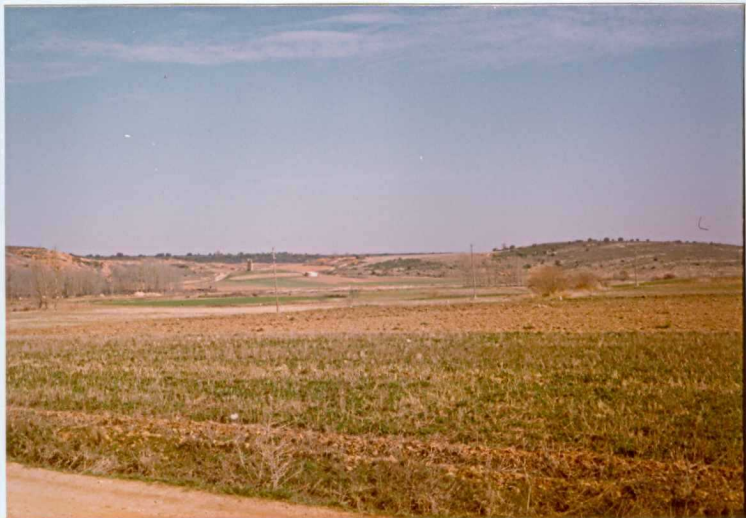
12.11-IM-AC-9761.- Contacto entre el Terciario del Sistema de La Valduerna y los relieves Paleozoicos exhumados. Cercanías de Quintana y Congosto. S. de la Valduerna. (9 y 10).