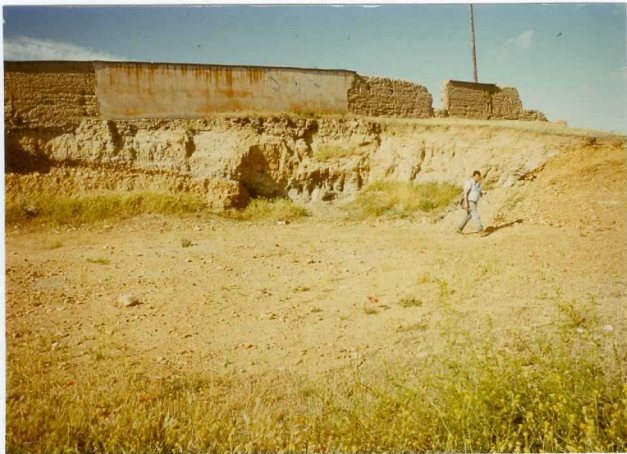
12.11-IM-VA-9077.- Similar a la anterior en la parte alta del depósito de la terraza.