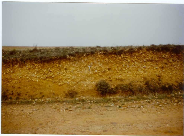
12.11-IM.VA.9023.- Depósito de T 5 al E de Tabuyuelo de Jamuz, con cantos verticalizados en la parte superior centro-izquierda, hacia el borde de la terraza. (17).