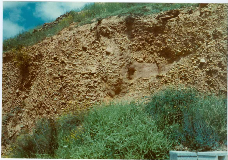
12.11-IM-AC-9766.- Detalle de los conglomerados de La Valduerna en Destriana. S. de La Valduerna. (9).