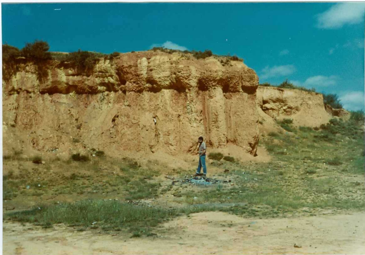
12.11-IM-AC-9765.- Fangos de llanura de inundación y canales rellenos por arena y gravas del Sistema de La Valduerna. Destriana. S. de La Valduerna. (9 y 10).