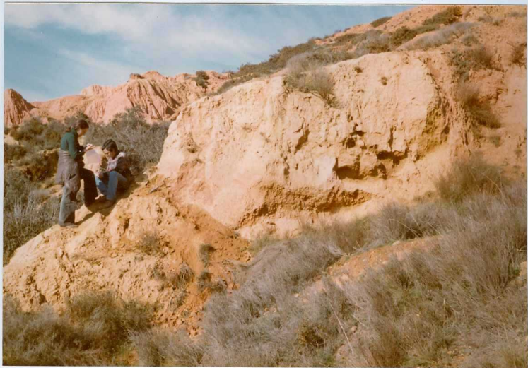
12.11-IM-AC-9759.- Canal del Sistema de La Valduerna. Tramo 6 de la Serie de Quintana y Congosto. S. de La Valduerna. (9 y 10).