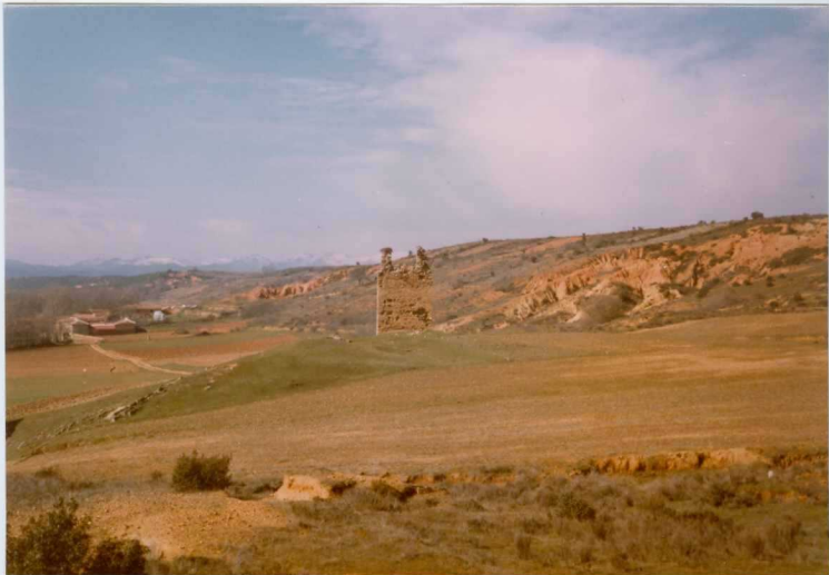
- 12.11-IM-AC-9760.- Panorámica de la Serie de Quintana y Congosto perteneciente al Sistema de La Valduerna. S. de La Valduerna. (10).