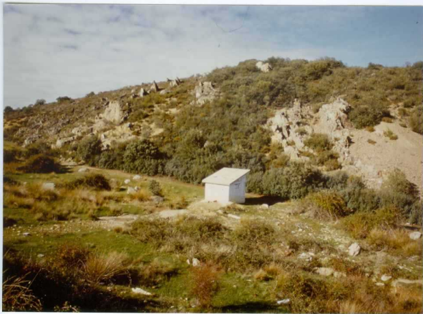
12.11-IM-VA-9073.- Cuarcitas y pizarras de la Serie de Los Cabos en La Canal. Carretera de La Bañeza a Castrocontigo. (3 y 4).