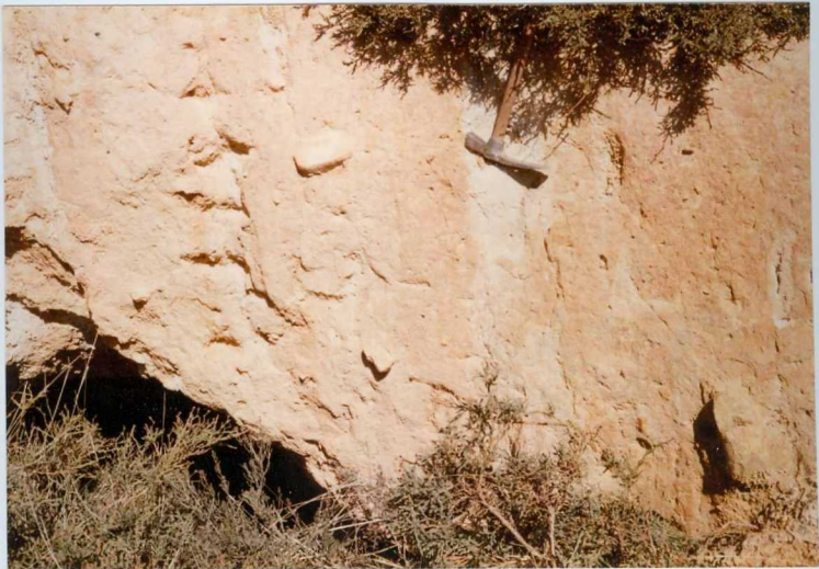
12.11-IM-AC-9053.- Detalle de la Serie de Pinilla correspondiente al Sistema de Nogarejas. Aspecto que presentan los depósitos de pendiente. S. de Nogarejas.(8 y 9).