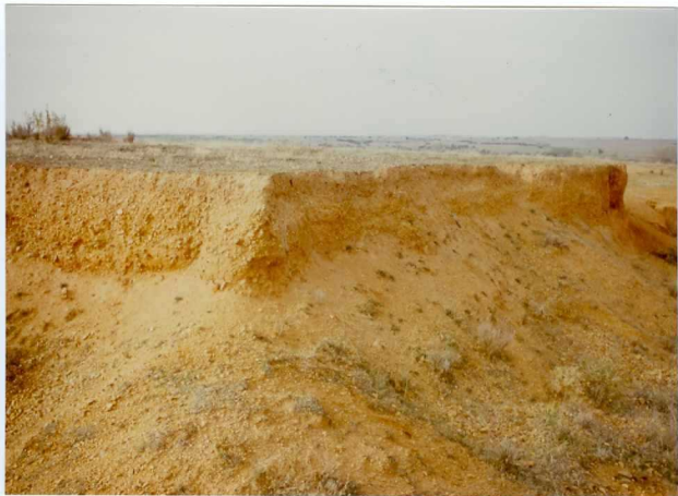
12.11-IM-VA-9054.- Nivel T_4 del Jamuz al O de Santa Elena de Jamuz (16).