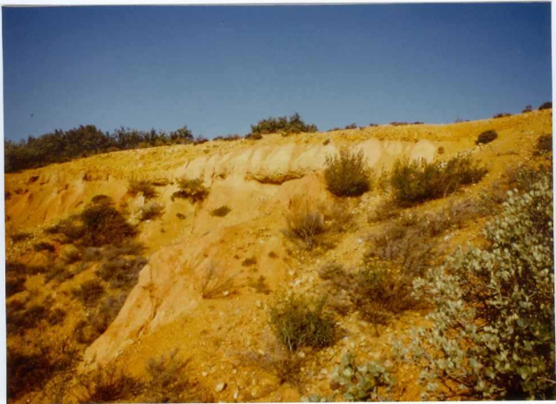
12.11-IM-VA-9064.- Conglomerados y arenas de T_2 sobre arenas y limos del S. de La Valduerna. (14). N. de Herreros de Jamuz.