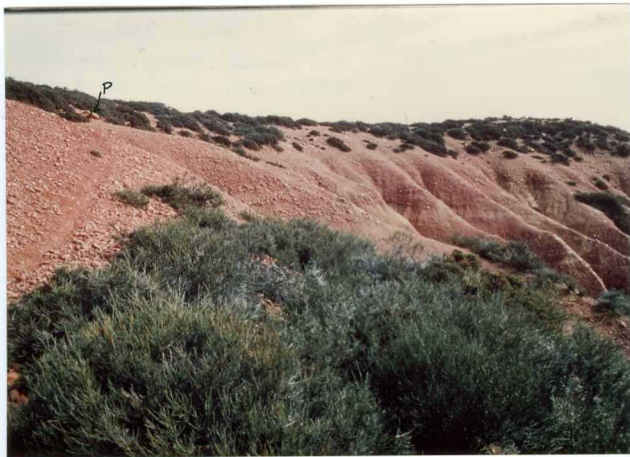
12.11-IM-VA-9074.- Sobre conglomerados y arenas del S. de La Valduerna, depósitos de T_1 y antrópicos por encima de "P" (13 y 33). N. de Castrillo de La Valduerna.