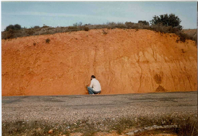
12.11-IM-AC-9764.- Aspecto de los canales rellenos por conglomerados del Sistema de La Valduerna.