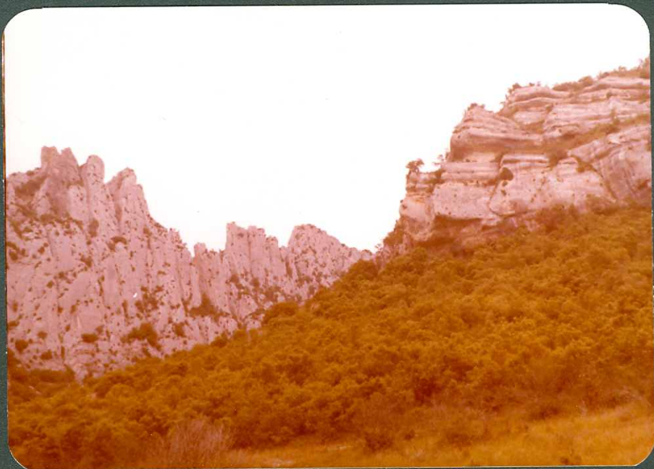
FOTO 9.- Falla inversa del flanco Sur de la estructura de Zamanzas.