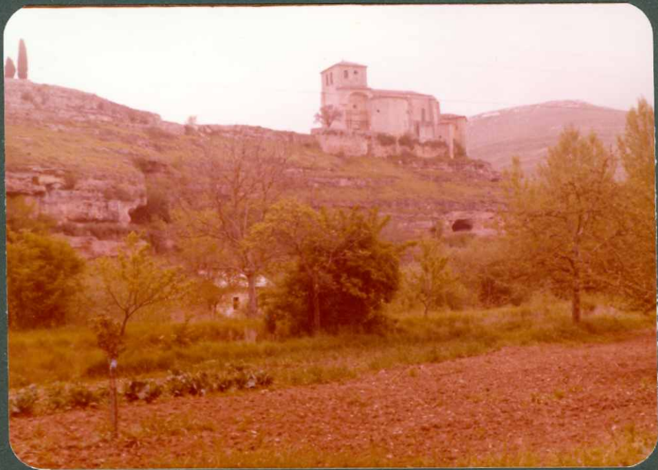
FOTO 15.- Dolomías con intercalaciones de areniscas del Santo niense superior - Campaniense C 3 24-25 . Sedano.