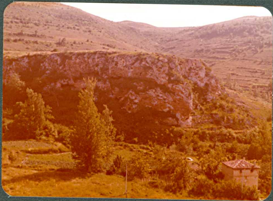
FOTO 19.- Travertinos de Tubilla del Agua.