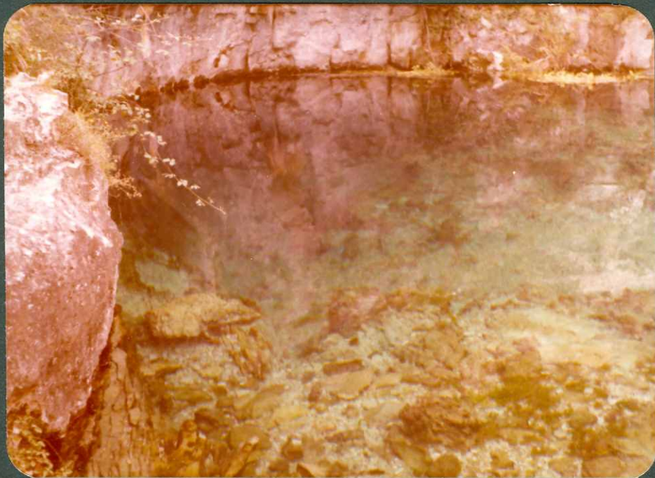
FOTO 13.- Manantial denominado "Pozo Azul" que drena el acuífero formado por las calizas del Santoniense medio superior. Covanera.