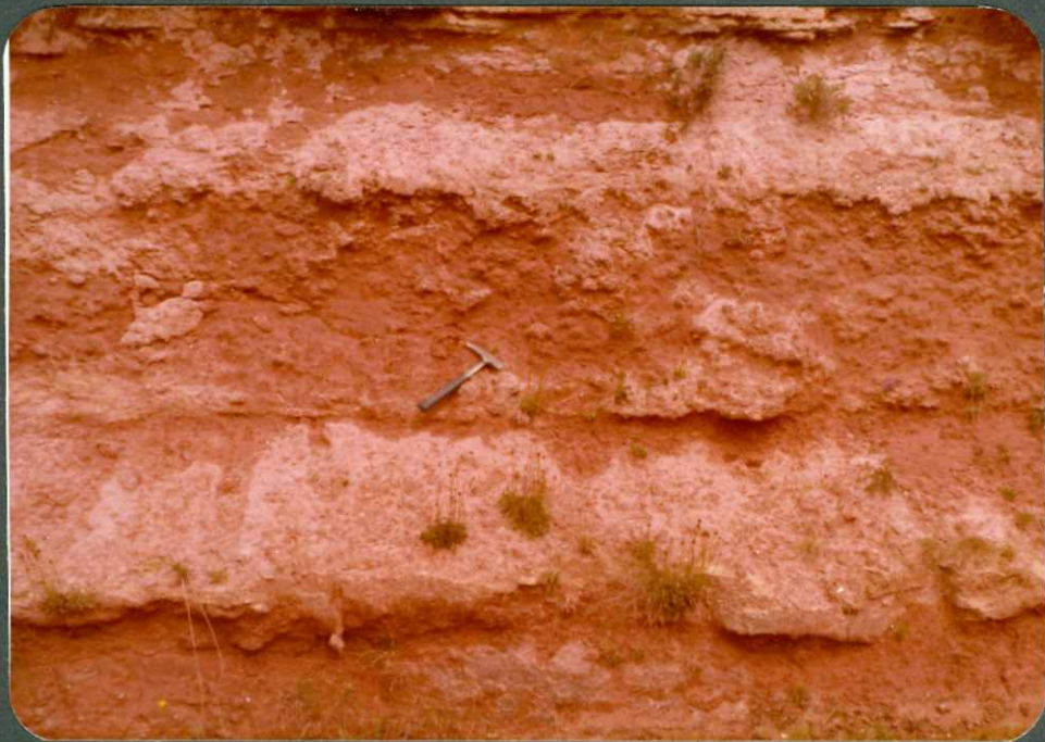
FOTO 16.- Arenas y areniscas rojas lenticulares, del Santonien se superior. Campaniense. Sedano.