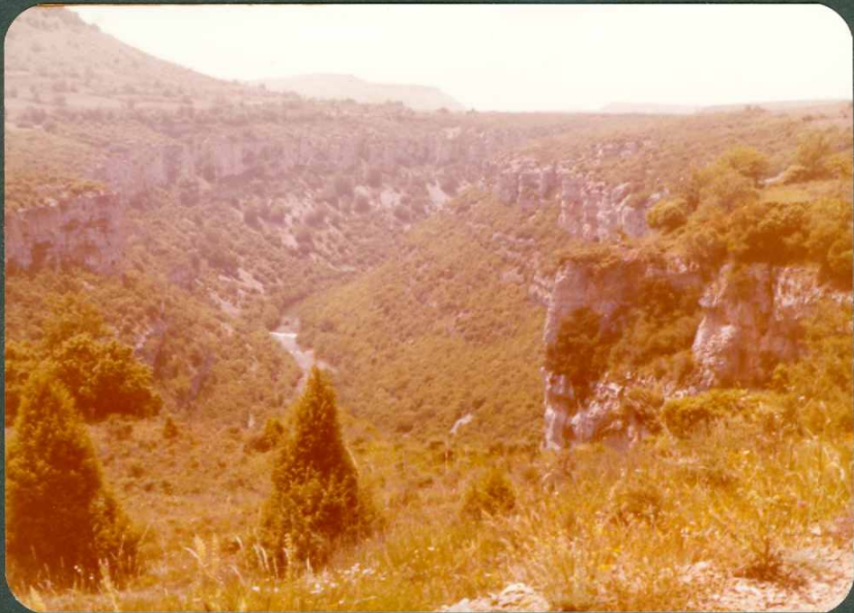
FOTO 6.- Calizas del Turoniense - Coniaciense, margas del Turoniense inf. C 22 1 bordeando el cauce del río Ebro. Pesquera de Ebro.