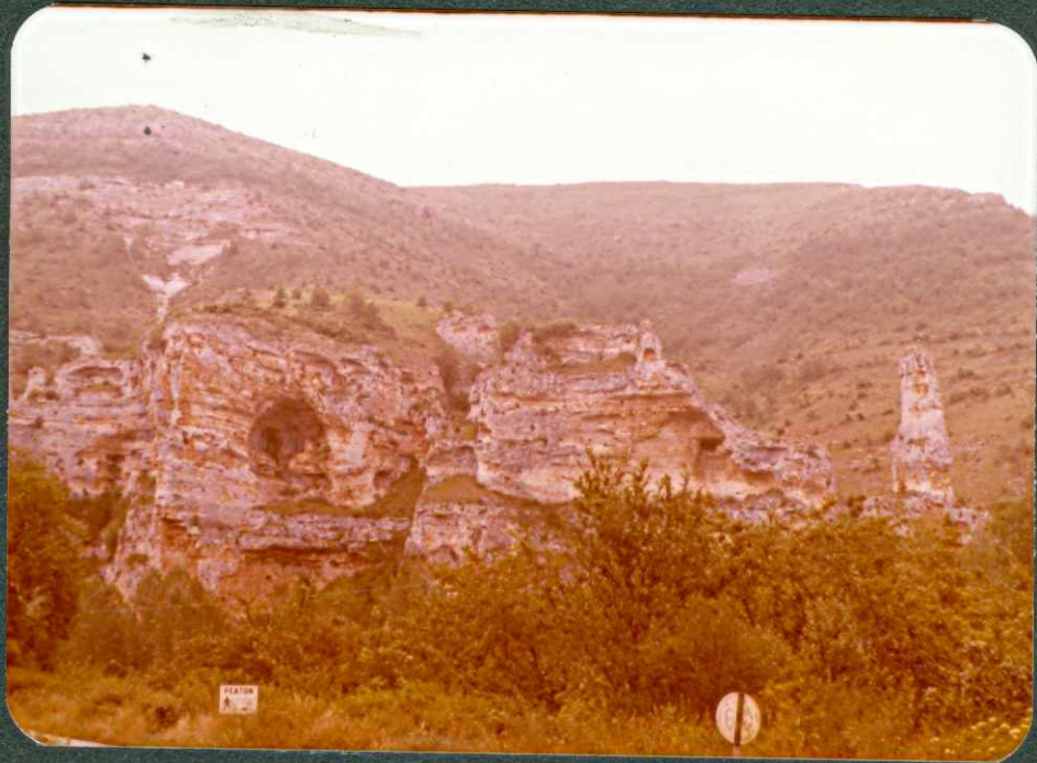
FOTO 12.- Calcarenitas bioclásticas con Lacazinas, karstificadas. Covanera.