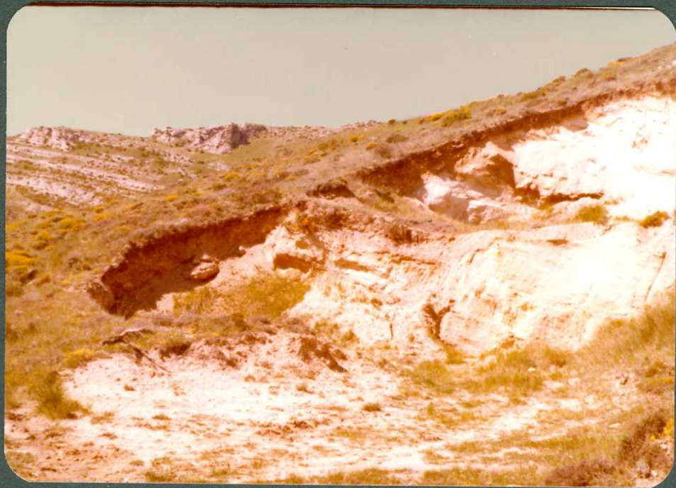
FOTO 5.- Arenas de "facies Utrillas". A la izquierda calizas del Turoniense - Coniaciense. Borde del Diapiro de - Poza de la Sal.