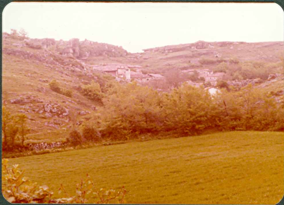
FOTO 11.- Calizas y calizas dolomíticas del Turoniense - Coniaciense. Nocedo.