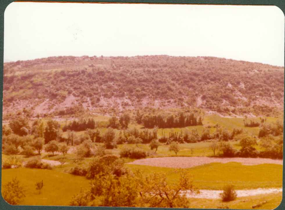
FOTO 17.- Facies garumniense - C 25-26 , el techo dolomías arenosas C 26 . Puerto de la Mazorra.