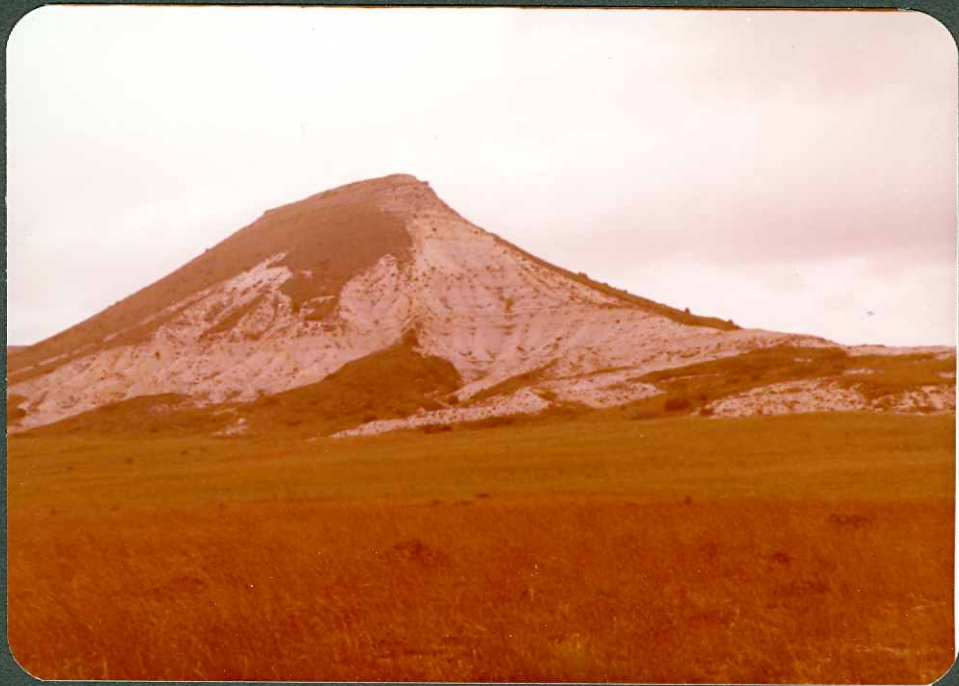
FOTO 10.- Margas del Santoniense inferior - medio C_{24}^{1-2} . Noce- do.