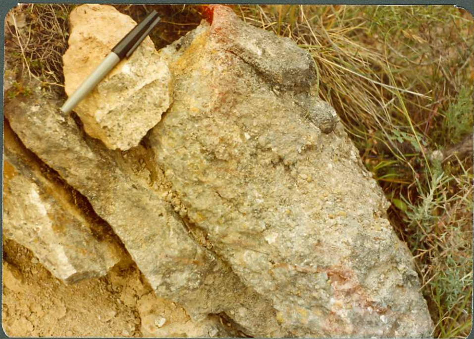
FOTO 2.- Conglomerado poligénico en "facies Purbeck". Zona de Rucandio.