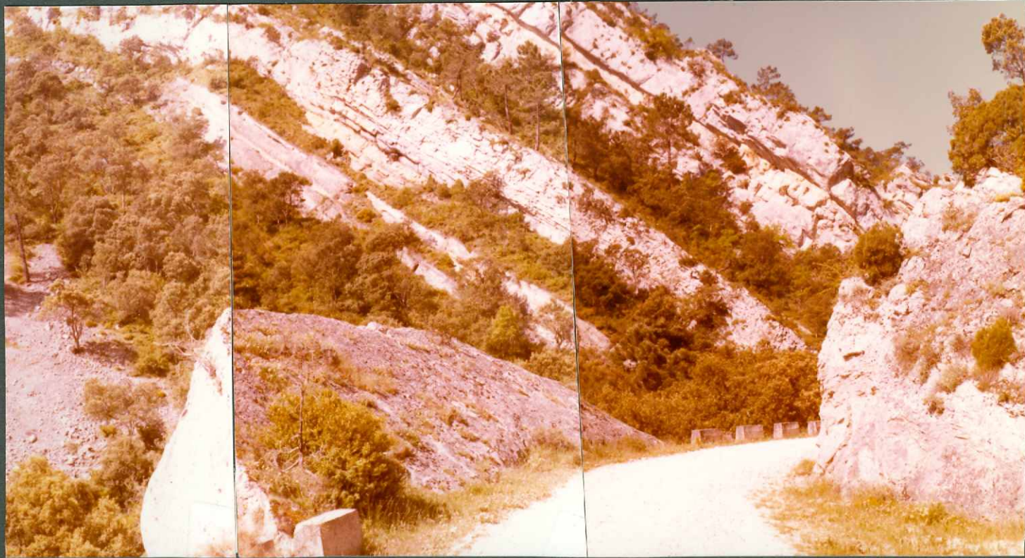
FOTO 4.- Calizas del Turoniense - Coniaciense C_{22-24}^{2-1} . Por debajo cubierto por coluviones, arenas de "facies Utrillas". Madrid de las Caderechas.