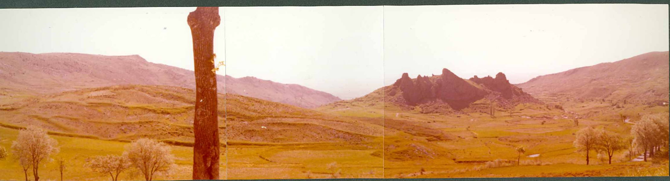
FOTO 1.- Diapiro de Poza de la Sal