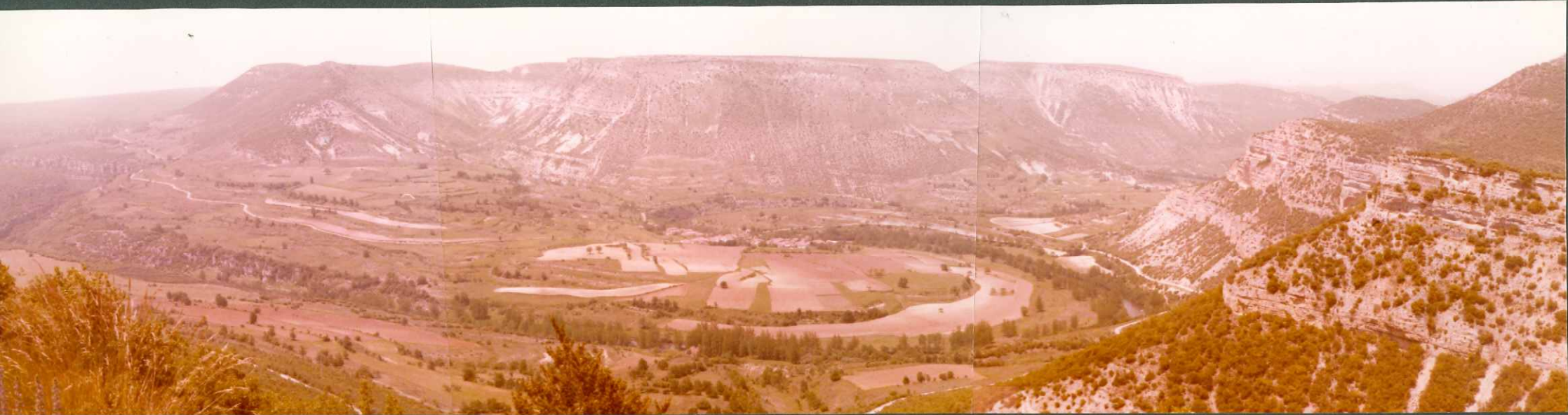
FOTO 8.- Panorámica del Cretácico superior. Extremo izquierdo calizas del Turoniense - Coniaciense. Extremo derecho, caliza de Lacazinas del Santoniense medio - superior C_{24}^{2-3} . Parte central formada por las margas - del Santoniense superior C_{24}^3 . Pesquera del Cbro.