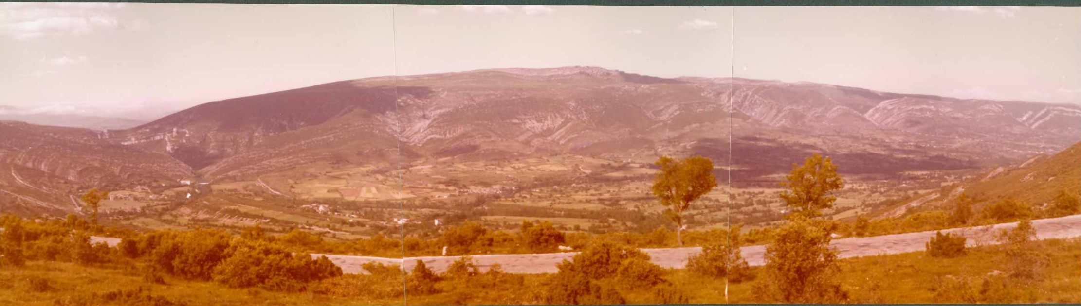
FOTO 18.- Valle de Valdivielso. Anticlinal de Tesla al fondo, limitando al Sur con el sinclinal de Valdivielso. En el centro sedimentos del Terciario Continental. Puerto de la Mazorra.