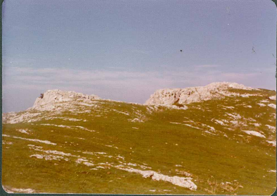
FOTO nº 20 y 21.- Calizas con Orbitoides del Campaniense en el Monte Oro.