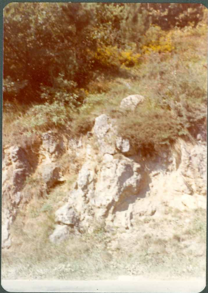
FOTO nº 3.- Dolomías jurásicas en el borde nororien tal del Diapiro de Murguía.