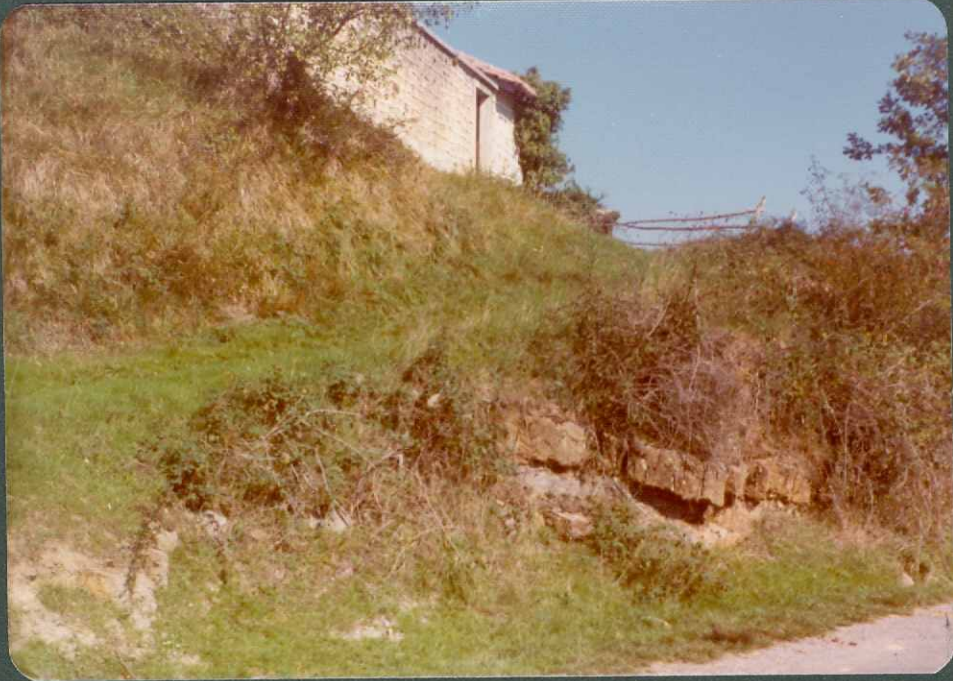
FOTO nº 10.- Calcarenitas con Orbitolinas en el paso del Cenomaniense inferior al Cenomaniense medio.