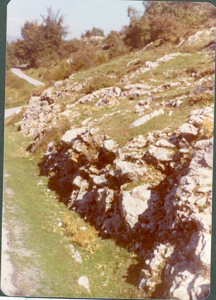
FOTO nº 20 y 21.- Calizas con Orbitoides del Campaniense en el Monte Oro.