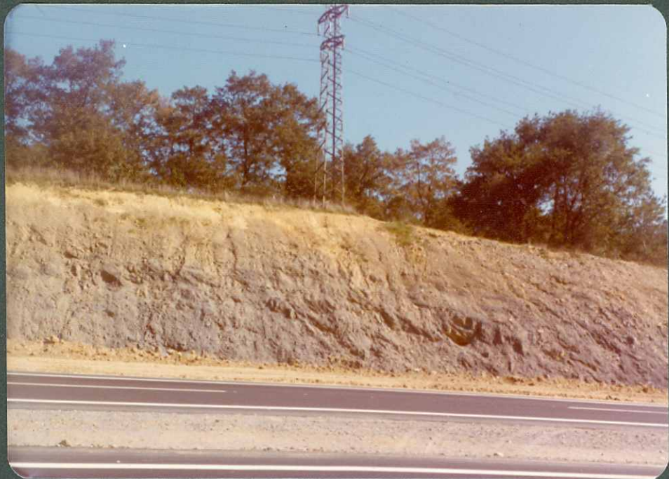
FOTO nº 8.- Areniscas y limolitas del Cenomaniense - inferior.