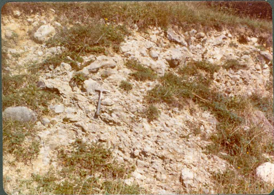
FOTO nº 22.- Conglomerados neógenos en las proximidades de Guillerna.