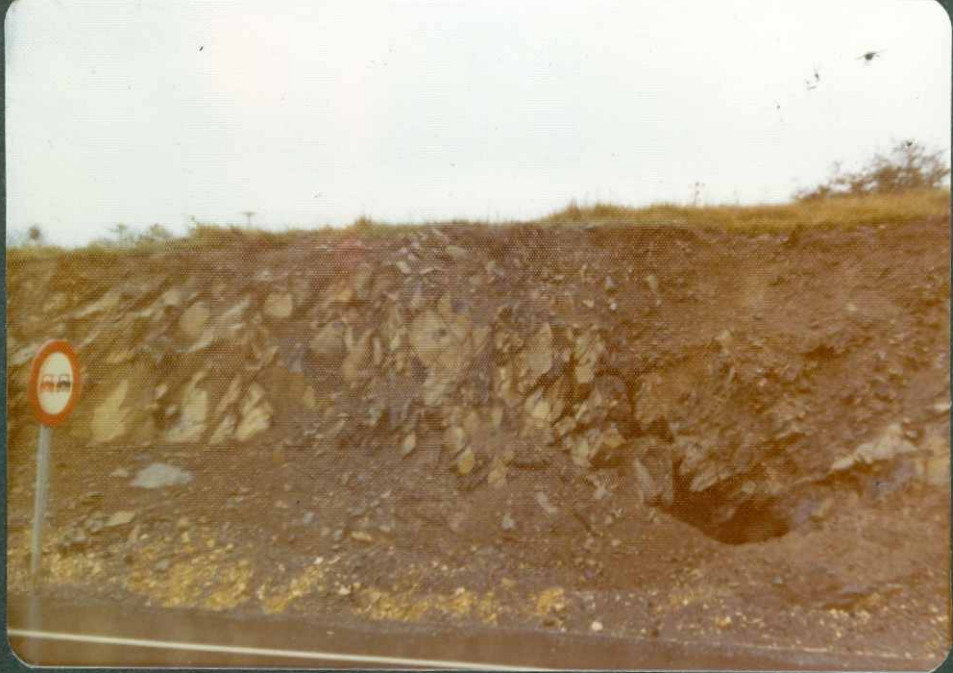
FOTO nº 17.- Margas y calizas arcillosas del Santonien se .