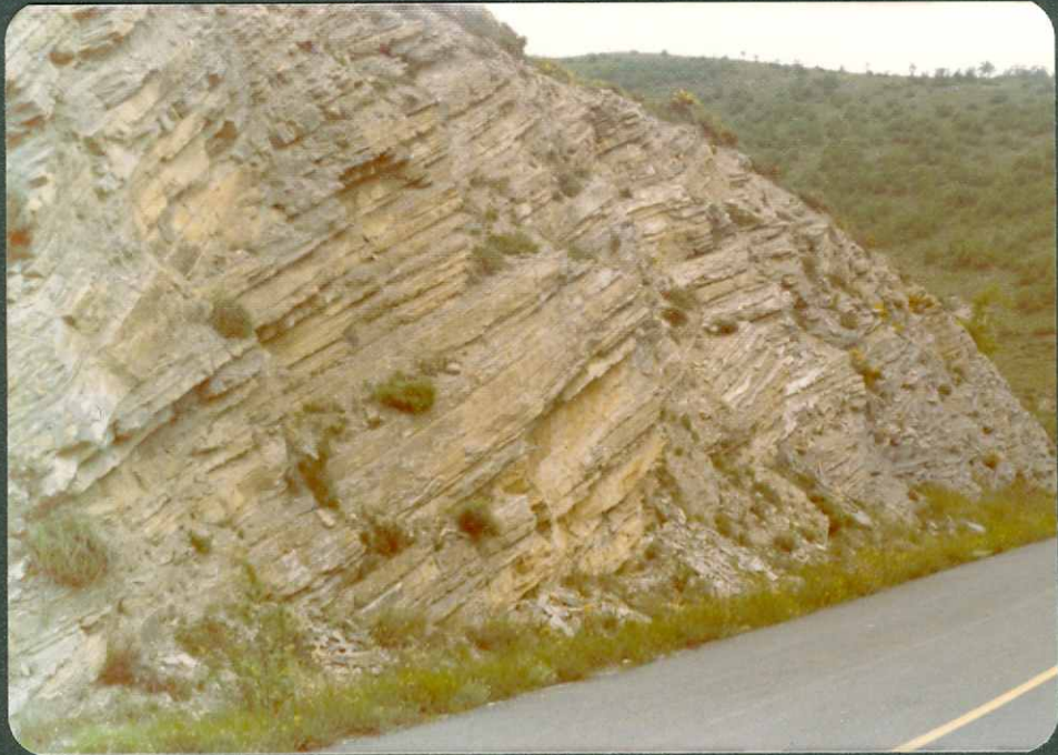
FOTO nº 18.- Margas del Coniaciense medio.