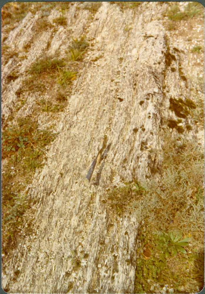
FOTO nº 13.- Margas y calizas arcillosas muy lajeadas de la unidad Turoniense superior-Coniaciense inferior.