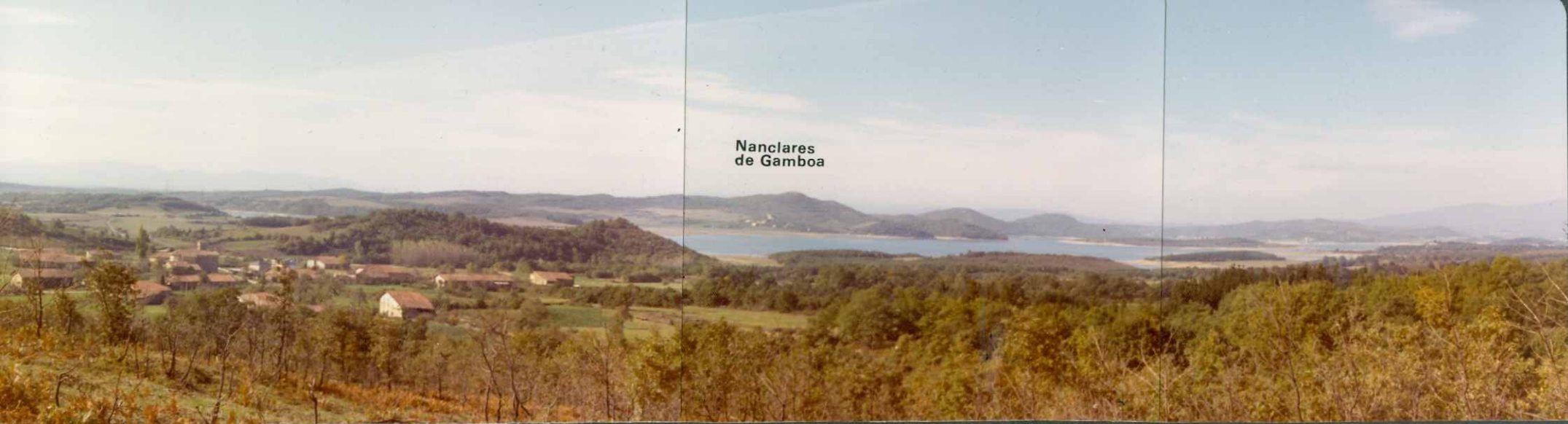
Nanclares de Gamboa