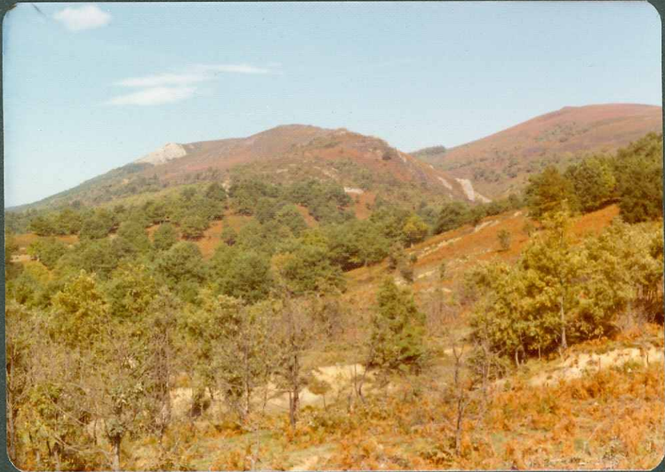
FOTO nº 5.- Areniscas del Albiense con intercalacio nes de calizas arrecifales.