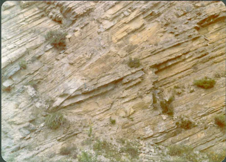
FOTO nº 14 y 15.- Paleocanales en las margas del Coniaciense inferior.