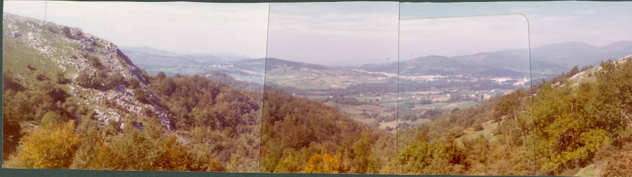
FOTO nº 1.- Panorámica de la zona diapírica de Mur guía desde la carretera de Vitoriana a la Ermita de Oro.