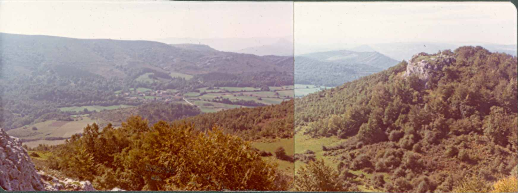
FOTO nº 2.- Panorámica del borde sur del Diapiro - de Murguía desde la Ermita de Oro.