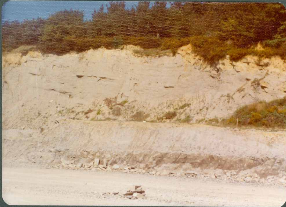
FOTO nº 23.- Arenas y arcillas arenosas neógenas en la localidad de Amezaga.