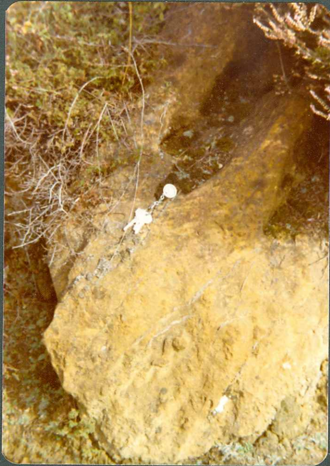
FOTO nº 7.- Calizas arenosas de la base del Cenomaniense inferior.