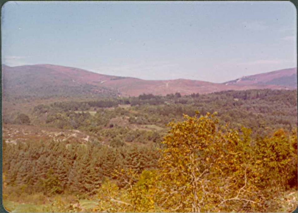
FOTO nº 4.- Al fondo areniscas del Albiense, en pri mer plano margas del Cenomaniense.