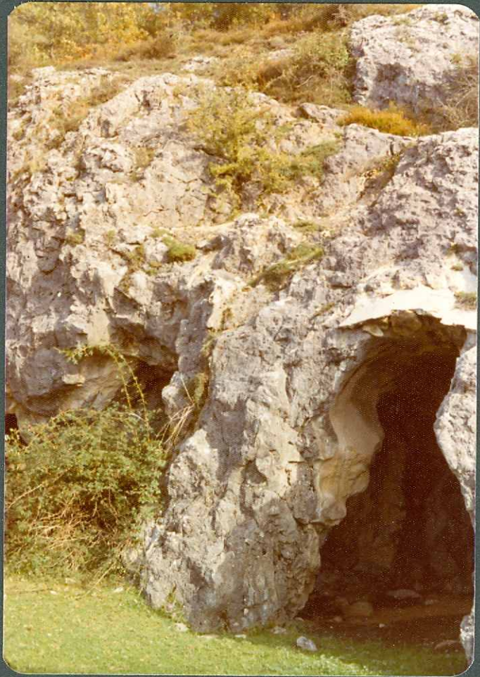
FOTO nº 6.- Calizas arrecifales del Albiense.