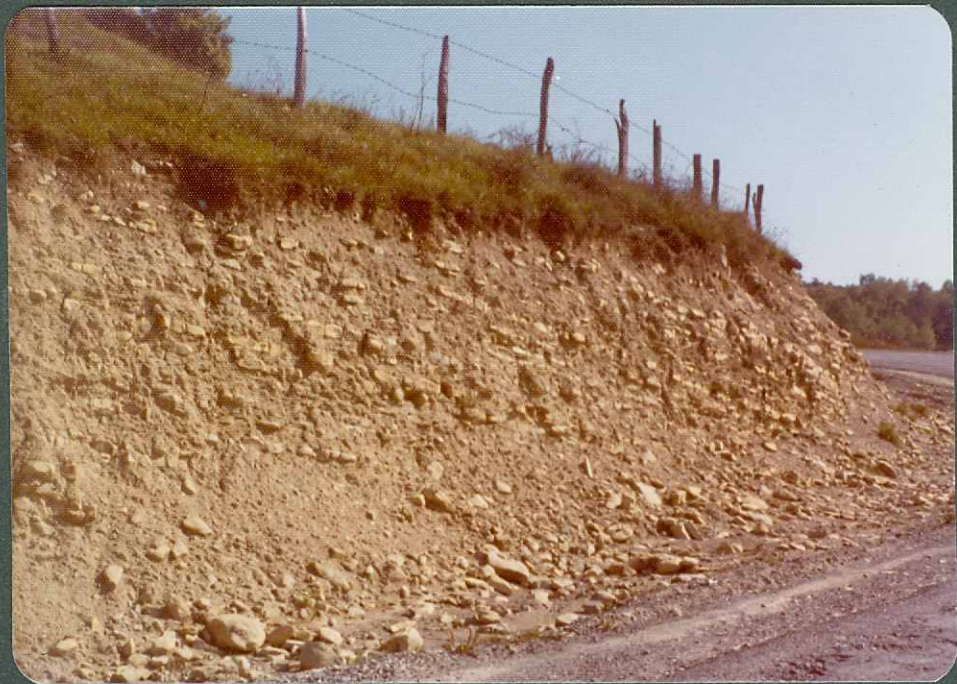
FOTO nº 11.- Margas y calizas arcillosas del Cenomaniense medio y superior (flysch de bolas)