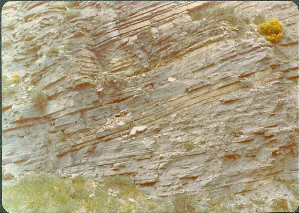
FOTO nº 14 y 15.- Paleocanales en las margas del Coniaciense inferior.