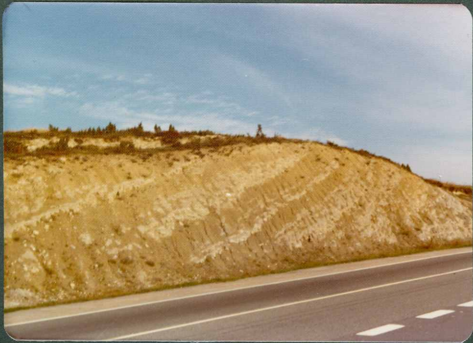
FOTO nº 19.- Margas y calizas arcillosas del Santonien se .