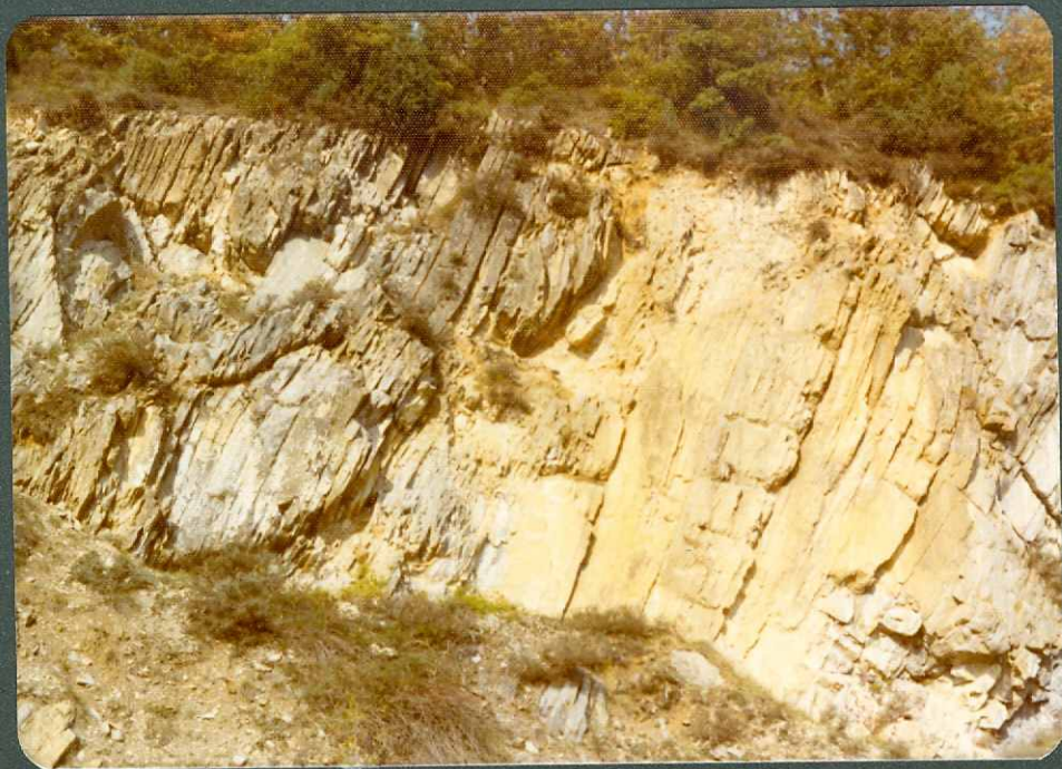
FOTO nº 12.- Calizas del Turoniense inferior.