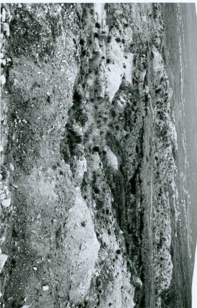
Explotación de turba. (Puerto de los Tornos).