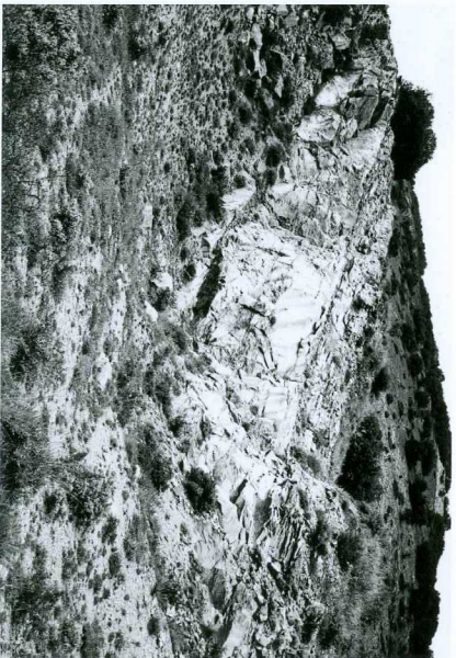
Cantera en las calizas coniacienses (El Egido)