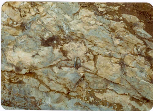
19.- (MR-1969).- Avenida de derrubios calcáreos intercalada en la serie turbidítica estefaniense de Cavandi. Carretera de Cavandi