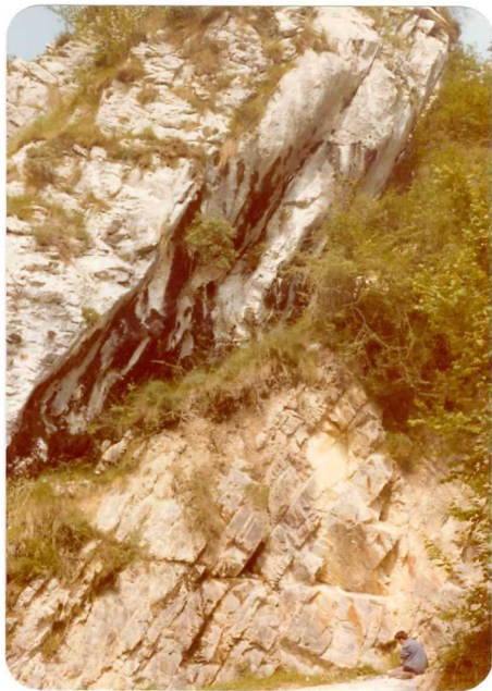
17.- (MR-1967).- Calizas y conglomerados calcáreos del Estefaniense. Carretera de Puente Mildón a Océño