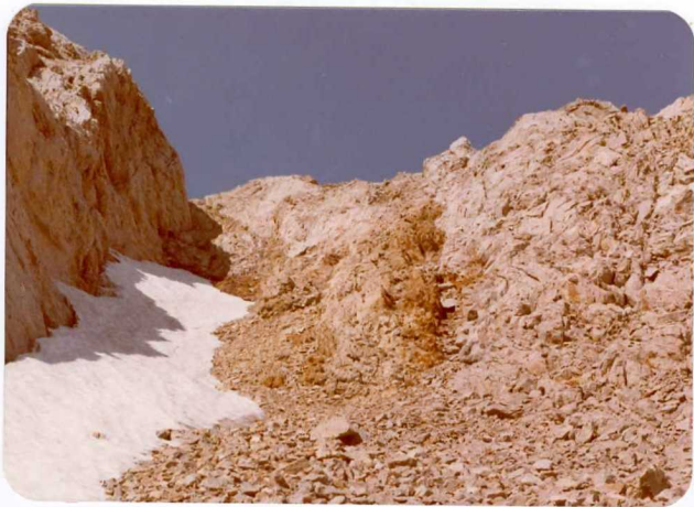
4.- (MR-1954).- Areniscas y calizas del Devónico superior por debajo de la caliza "griotte" carbonífera. Cabalgamiento del Jou de los Boches