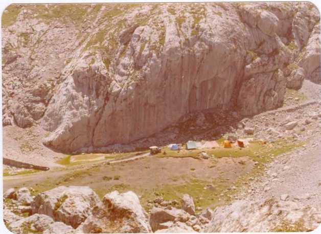
15.- (MR-1965).- Pizarras negras y calizas del Estefaniense de Andara. Pozo de Andara