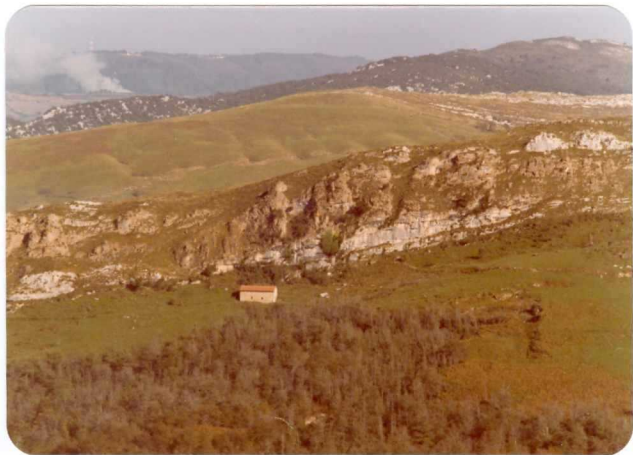
38.- (MR-1988).- Calizas y dolomías aptienses sobre los materiales permotriásicos en primer término. En el núcleo del Sinclinal de Merodio afloran las calizas y margas del Albiense y Cenomaniense inferior. Cº de Suarías a Merodio