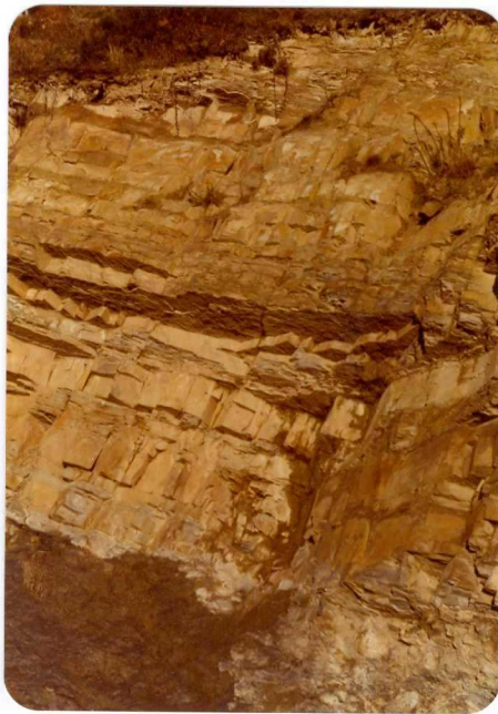
22.- (MR-1972).- Tramo arenoso de la secuencia turbidítica de Cavandí. Carretera de Cavandí