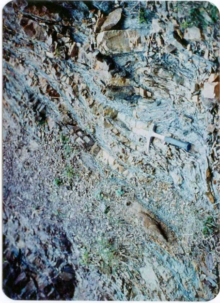
2.- (MR-1952).- Areniscas y pizarras verdes con glauconita del Cámbrico superior (Formación Oville). Sotres