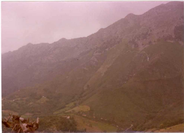
42.- (MR-1992).- Lengua de bloques de caliza de origen periglacial en la vertiente S de la Sierra del Cuera. Desde el alto de Cavandi