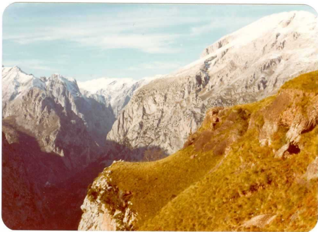
24.- (MR-1974).- Calizas, areniscas y margas p'ermicas discordantes sobre las calizas carboníferas. Mina de Hozarco, al S de Navedo