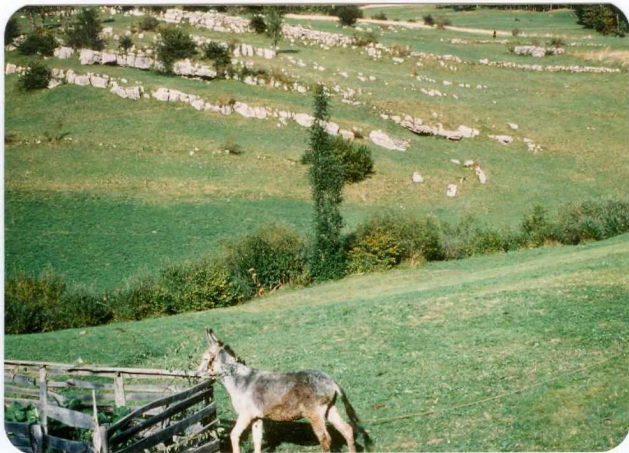
29.- (MR-1979).- Calizas del Pérmico subhorizontales, dicordantes sobre el Carbonífero. Sotres