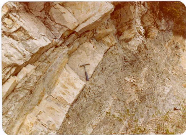
3.- (MR-1953).- Cuarcitas ordovícicas con intercalaciones pizarrosas de color verdoso. Pista de Rumenes a San Esteban