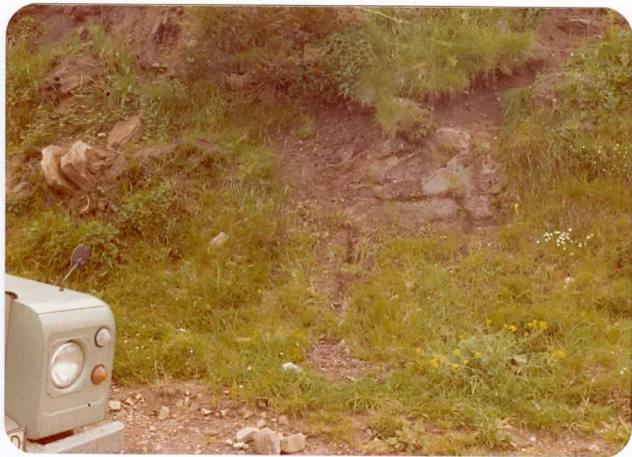
27.- (MR-1977).- Margas y areniscas rojas del Pérmico. Pista de Sotres al Alto de Pirué