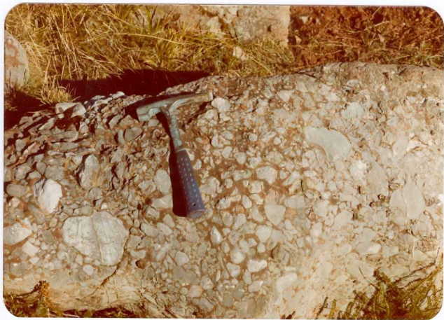
25.- (MR-1975).- Conglomerados pérmicos de matriz arcillosa roja. Cº de Piñeres a Lafuente