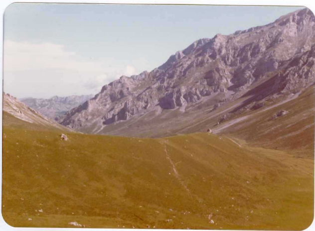
40.- (MR-1990).- Gran morrena lateral de Aliva. Pista de Aliva al Mirador del Cable