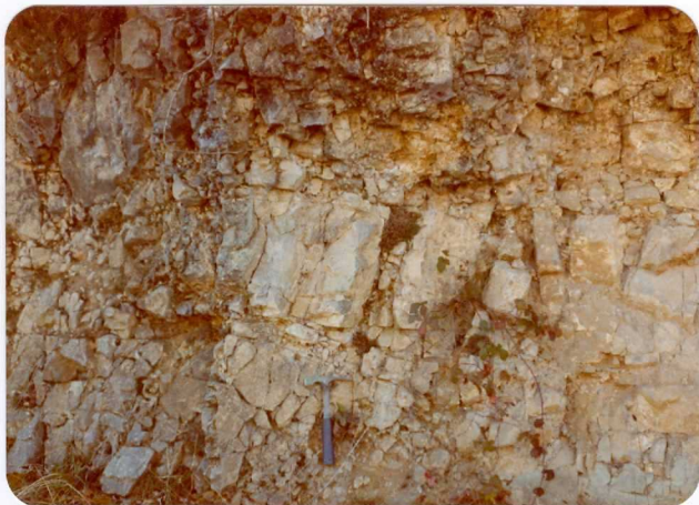
35.- (MR-1985).- Carniolas y dolomías del Jurásico inferior (Lias). Carretera de La Hermida a Puente deansa