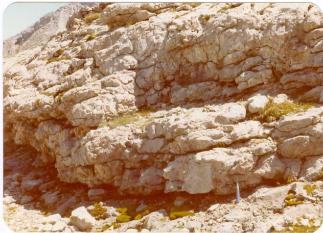
12.- (MR-1962).- Facies rosada brechoide de la Caliza de Picos de Europa. Minas de Mazarrasa