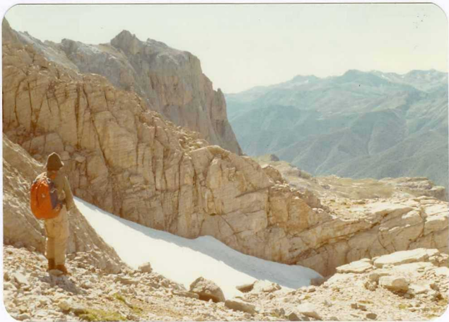
9.- (MR-1959).- Bandeado característico de la facies Barcaliente de la Caliza de Montaña. Camino de La Vueltona a Peña Vieja