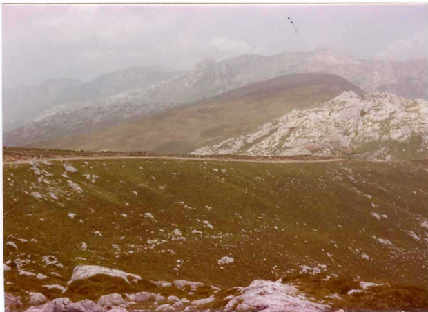
41.- (MR-1991).- En primer término morrena lateral del Alto de Pirué. En segundo término, materiales pérmicos discordantes sobre las calizas carboníferas