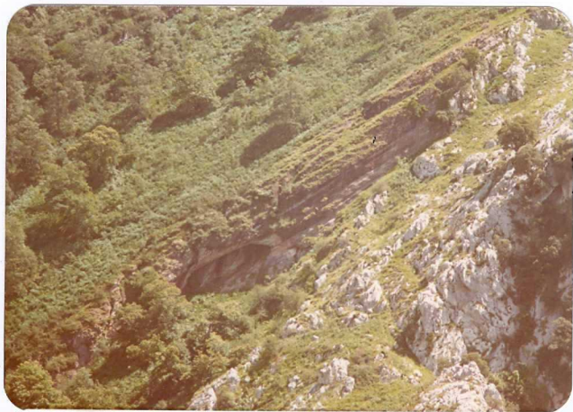
31.- (MR-1981).- Detalle de la discordancia del Permotrias sobre las calizas carboníferas al S de Navedo