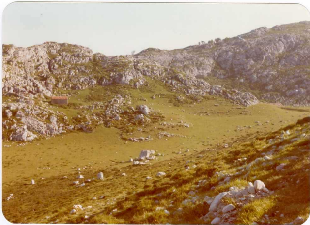
43.- (MR-1993).- Dolina rellena de arcillas de decalcificación. Majada Barrera