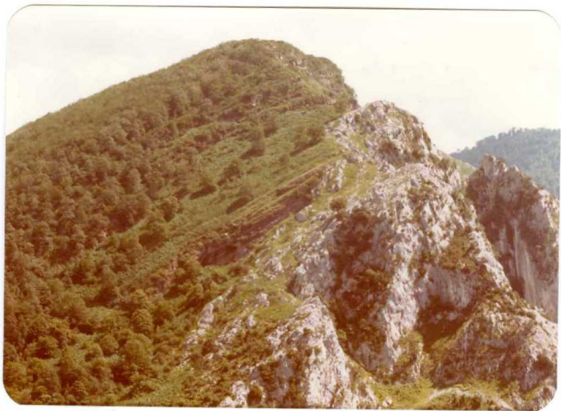
30.- (MR-1980).- Discordancia de los materiales permotriásicos sobre las calizas carboníferas al S de Navedo