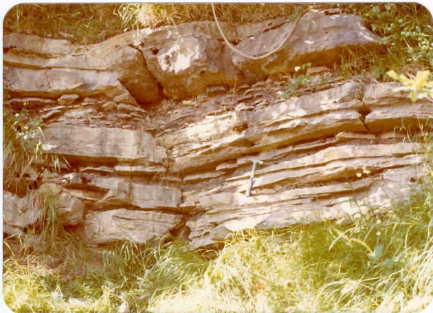
18.- (MR-1968).- Alternancia de calizas y margas del Estefaniense de Piñeres. Carretera de La Hermida a Puente deansa