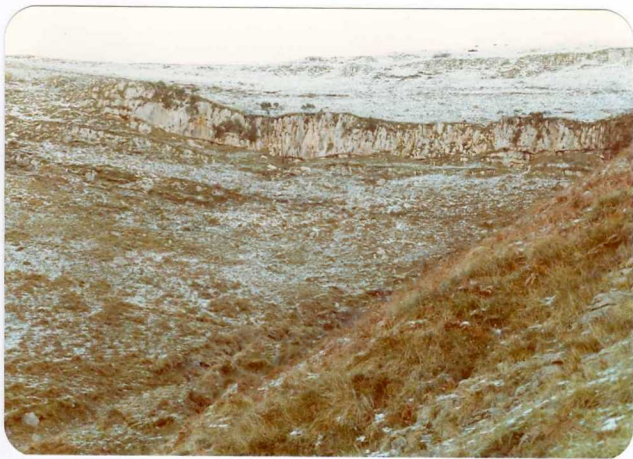
37.- (MR-1987).- Conglomerados calcáreos del Dogger. Barranco de Agua Seles