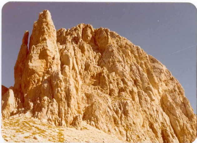
44.- (MR-1994).- Formas de erosión en el Macizo calcáreo de Picos de Europa. Aguja de La Canalona