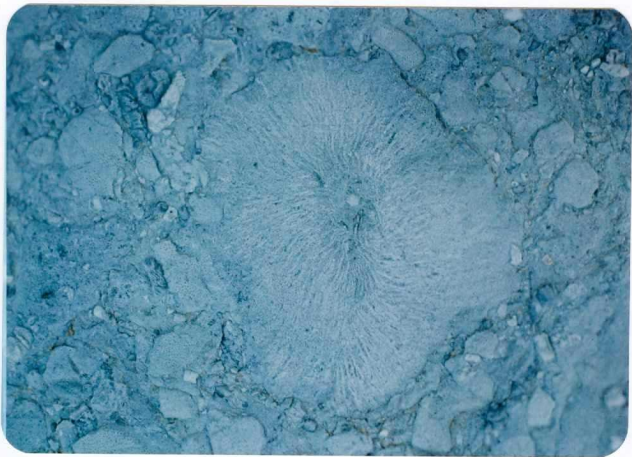
13.- (MR-1963).- Coral solitario en la facies biogénica de la Caliza de Picos de Europa. Minas de La Providencia