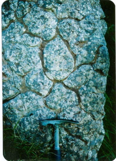
8.- (MR-1958).- Grietas de desecación en la caliza "griotte" del Carbonífero (Formación Genicera). Collado de Carraspión