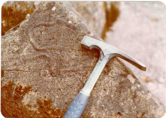
23.- (MR-1973).- Pistas en las areniscas estefanienses de Arenas de Cabrales. Canal aliviadero de la presa de Arenas, cerca de la Cantral Eléctrica