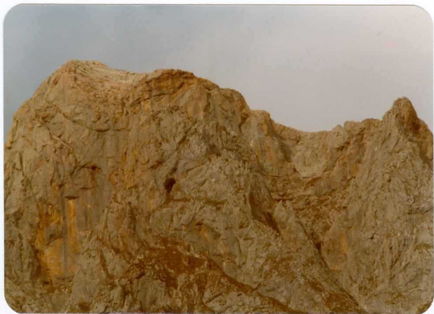
14.- (MR-1964).- Facies rojas nodulosas de la parte superior de la Caliza de Picos de Europa. Pico Inagotable