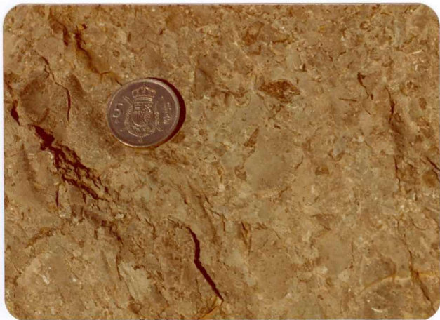
20.- (MR-1970).- Detalle de la avenida de derrubios calcáreos de Cavandi Carretera de Cavandi