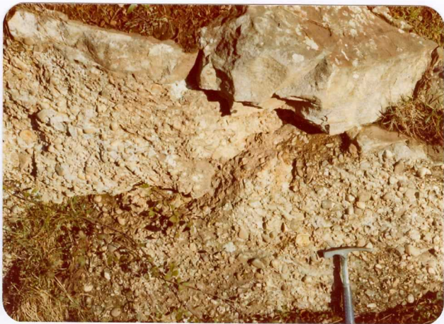
32.- (MR-1982).- Conglomerados de facies Bunt. Carretera de La Hermida a Puente de Nansa