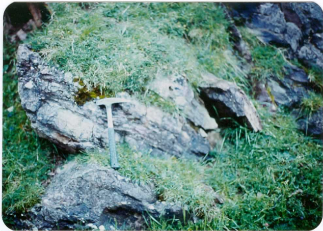
1.- (MR-1951).- Calizas en facies "griotte" del Cámbrico (Formación Láncara). Sotres