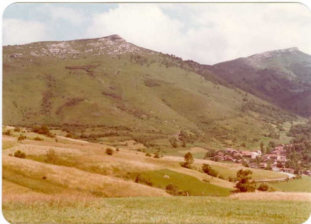
34.- (MR-1984).- Secuencia mesozóica al E de Cicera. En la parte superior afloran las calizas y conglomerados del Dogger. Carretera de La Hermida a Puente deansa