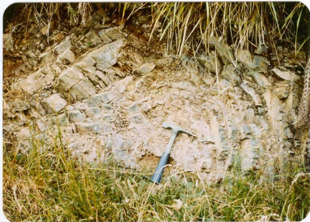
6.- (MR-1956).- Pizarras de Vegamián. Liditas negras tableadas y plegadas. Cº de San Esteban al Collado Garabín