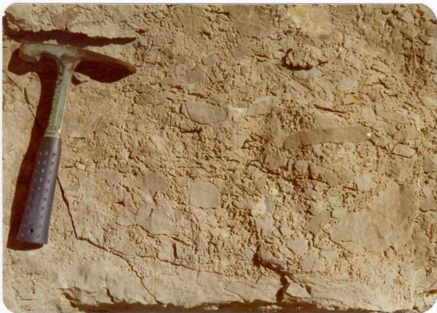
11.- (MR-1961).- Brecha singenética en la base de la Caliza de Montaña. Subida al Collado de La Canalona