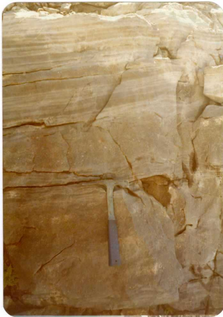
10.- (MR-1960).- Detalle del bandeo de la facies Barcaliente. Subida al Collado de la Canalonea