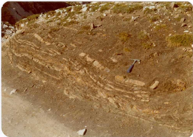
16.- (MR-1966).- Pizarras negras y areniscas de la secuencia turbidítica de Aliva. Horcada de Covarrobres