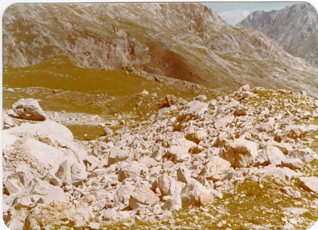
39.- (MR-1989).- Pequeña morrena frontal al Pié de Peña Vieja. Pista de Aliva al Mirador del Cable