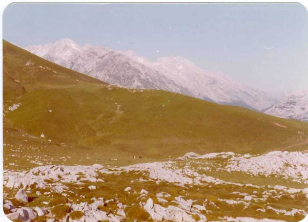
28.- (MR-1978).- Materiales del Pérmico discordantes sobre la Caliza carbonífera. Alto de Pirué