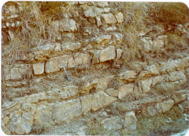
36.- (MR-1986).- Alternancia de calizas y margas del Lias. Carretera de La Hermida a Puenteansa