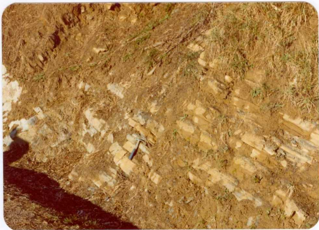
21.- (MR-1971).- Intercalaciones calcáreas en la secuencia turbidítica de Cavandi. Carretera de Cavandi