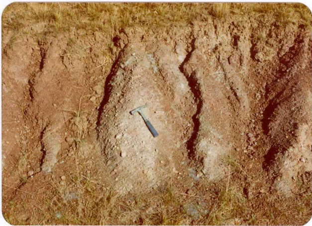
33.- (MR-1983).- Margas y arcillas abigarradas de facies Keuper. Carretera de Piñeres a Cicera