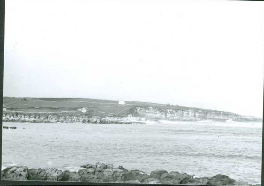
JP. 1513.- Calizas arenosas y areniscas calcáreas del Cui- siense. (Playa de la Maruca).