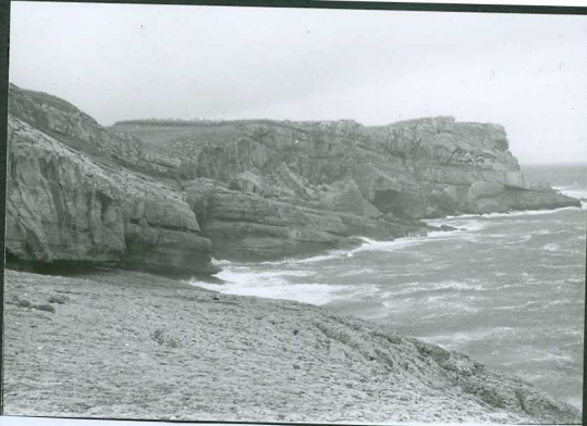
JP 1503.- Vista general de las Calizas del Aptiense medio Superior (Cabo de Ajo).