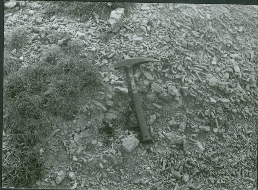
JP 1501.- Lumaquela de corales en Aptiense Superior (Cabo de Ajo).