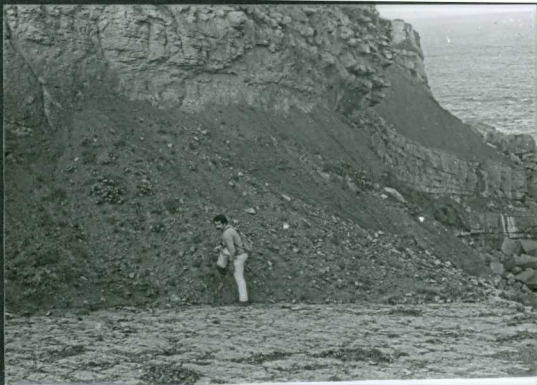
JP 1505.- Arcillas limolíticas del Albiense inferior (Cabo de Ajo).