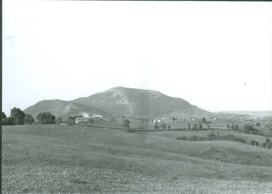
JP 1511.- Peña Cabarga. Tendencia a la inversión de las capas del Aptiense-Albiense inferior-medio.