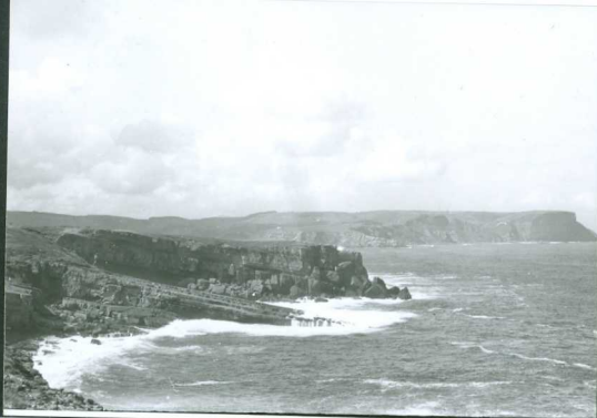
JP 1507.- Niveles superiores de areniscas, calcarenitas y arcillas limolíticas del Albiense inferior (Cabo de Ajo).