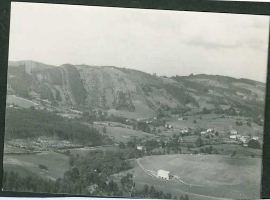
JP 1512.- Alternancia de calizas arrecifales y areniscas del Gargasiense (Solórzano).