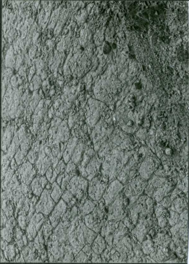
JP 1506.- Mud - crack al techo de un banco calcarenítico en el Albiense inferior (Cabo de Ajo).