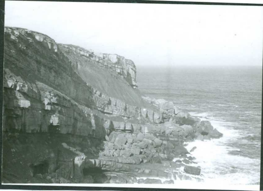
JP 1504.- Alternancia de arcillas limolíticas y calcarenitas del Albiense inferior. (Cabo de Ajo).