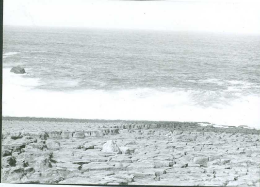
JP 1509.- Detalle del Mud - crack (Cabo de Ajo).