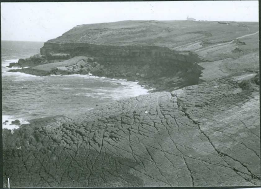
JP 1508.- Mud - crack en los niveles superiores del Albiense inferior terrígeno (Cabo de Ajo).