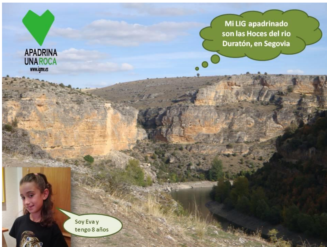
MEANDROS ENCAJADOS DEL RÍO DURATÓN EN LA ERMITA DE SAN FRUTOS (Segovia)