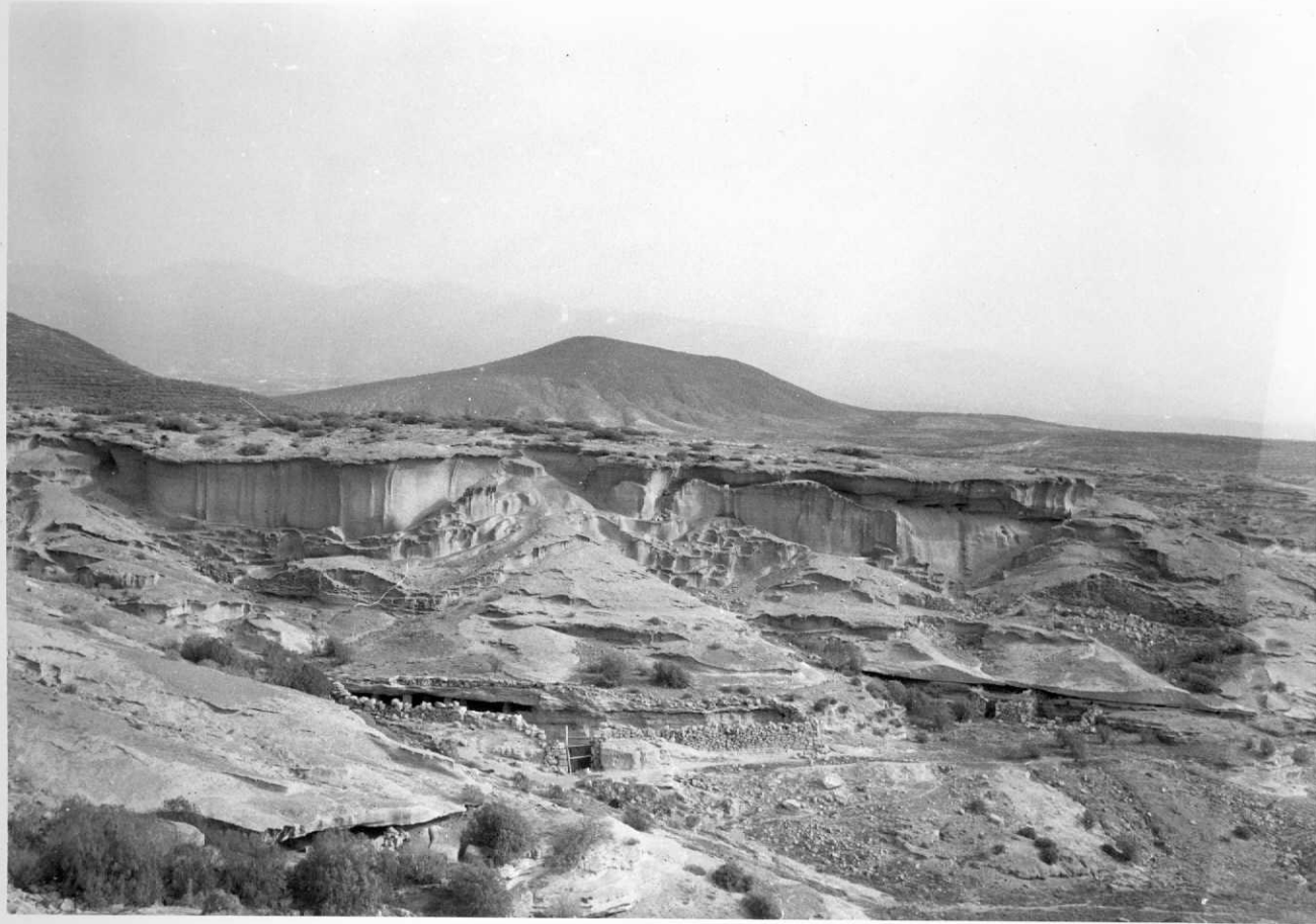
3941-AD-HP-353.- Depósitos pumíticos en las casas del Guirre. Al fondo la Montaña de Ifara, en el límite NW de la Hoja.