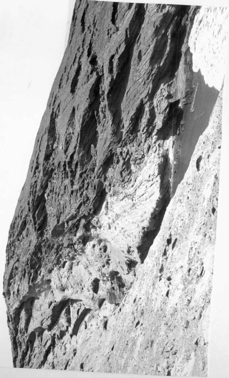
3941-AD-HP-352.- Discordancias en el edificio volcánico de Montaña Ensanchada.