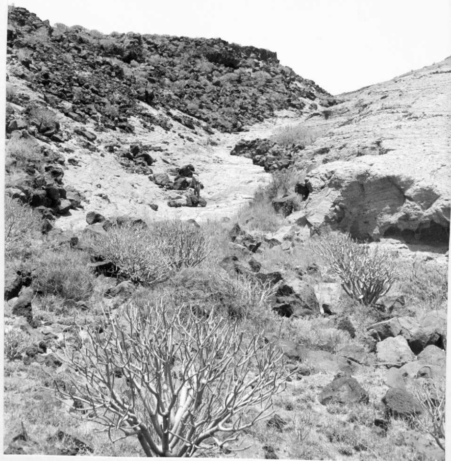
3941-AD-HP-350.- Colada basáltica sobre las hialoclastitas de Montaña Ensanchada.