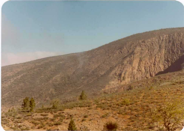
Foto 132.— Ventana de fonolitas, bajo coladas de traquibasaltos (serie Cañadas).