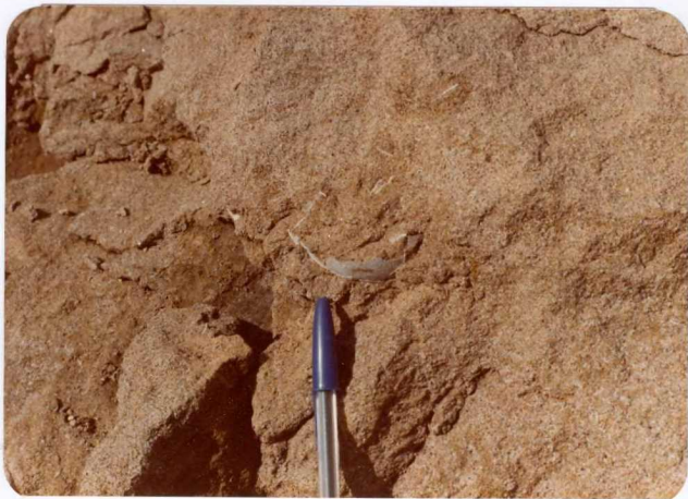
Foto 54.— Detalle de playa fósil con restos de conchas de lamelibranquios (junto al Barranco de la Punta Blanca).