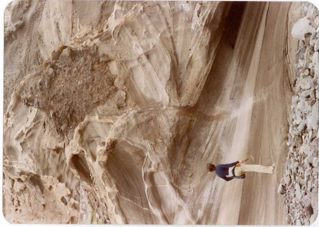
Foto 124. - Detalle de la estratificación cruzada de las dunas fósiles en la playa del Acantilado de los Gigantes.