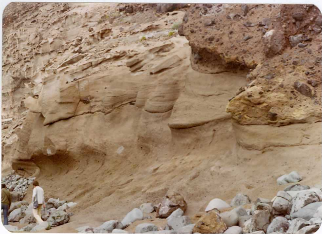
Foto 123.— Dunas fósiles enterradas bajo los derrubios anteriores. (Playa del Acantilado de los Gigantes).