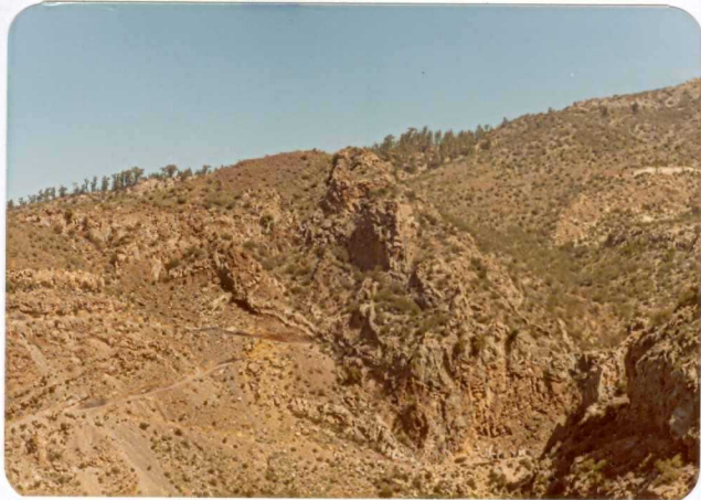
Foto 57.— Centro de emisión basáltico que atraviesa los traquibasaltos de la serie II (Barranco del Fraile).