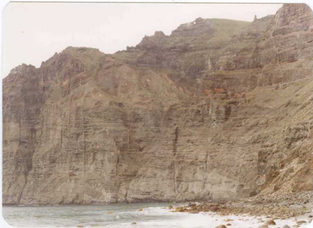
Foto 120.— Apilamiento de coladas de la serie I que presentan conos de cenizas enterradas. (Acantilado de los Gigantes).