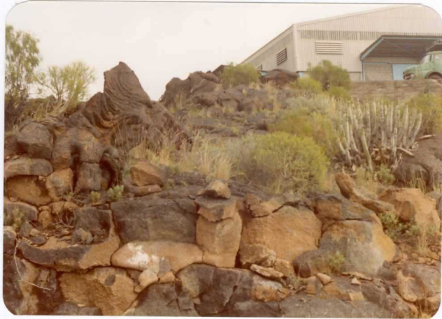
Foto 74.— Coladas de basaltos con fenocristales de plagioclasas que presentan estructura de lavas cordadas. Serie IV. (Puerto de Santiago).