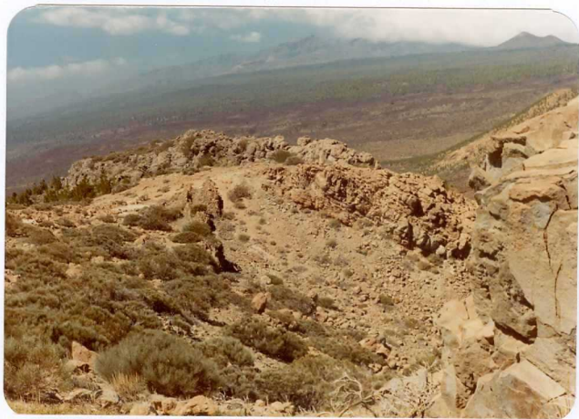
Foto 135.— Diques de traquibasaltos en los Roques del Cedro. Al fondo acusados relieves de la serie I.