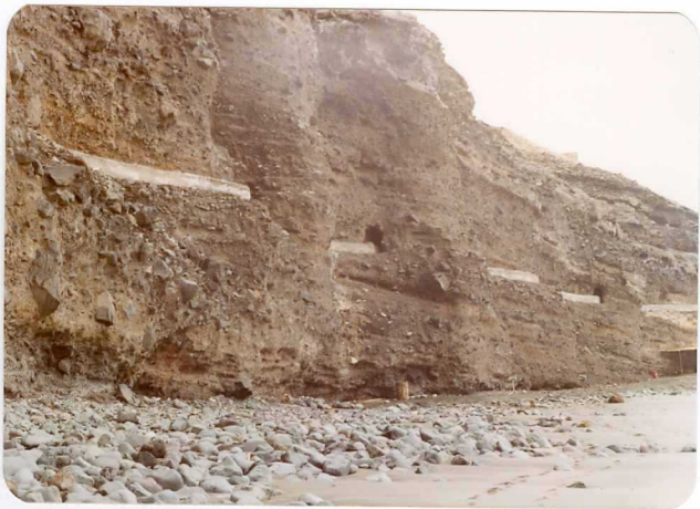
Foto 122.— Derrubios de ladera de la serie I, en donde se encuentra intercalada una playa fósil. (Playa del Acantilado de los Gigantes).