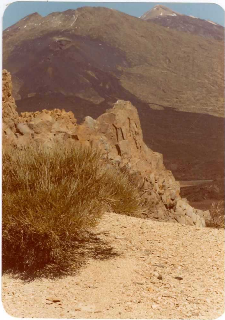
Foto 130.— En primer plano, diques traquibasálticos de los Roques del Cedro. En segundo plano volcán histórico (Narices del Teide), en la ladera del volcán de Pico Viejo. Al fondo el Teide.