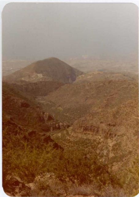
Foto 137.— Barranco del Niágara en el que se observa en la parte inferior del mismo (tono claro) fonolitas y sobre ellas la serie traquibasáltica. En segundo plano Montaña Tejina.