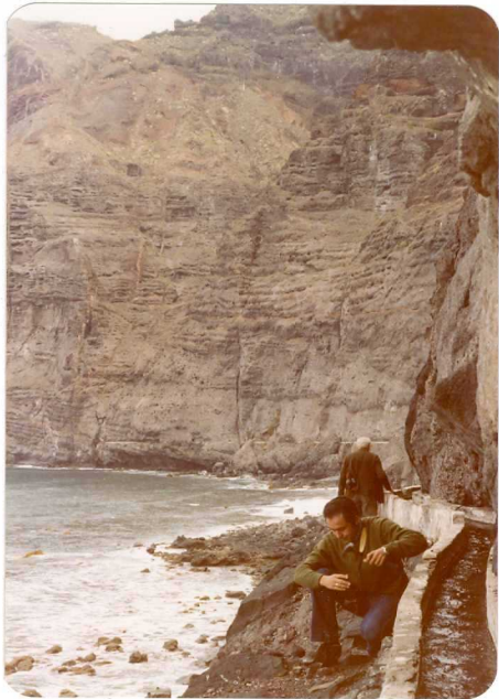
Foto 121.— Detalle de la foto anterior, con numerosos diques y el cono de cenizas.