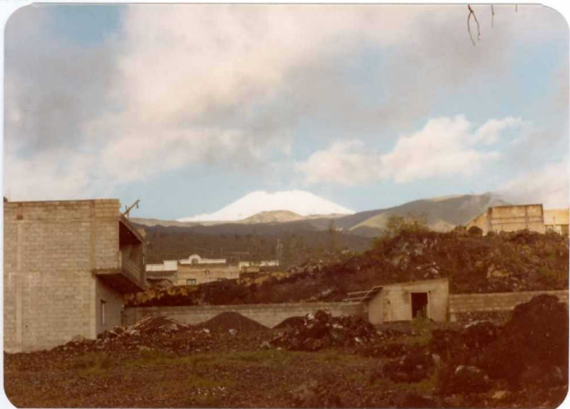
Foto 138.— En primer plano basaltos de la serie IV. Al fondo Montaña Chasogo que recorta su silueta contra la montaña de Pico Viejo nevado.