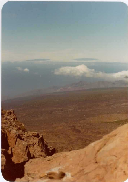
Foto 134.— Desde los Roques del Cedro vista de la Isla de la Palma.