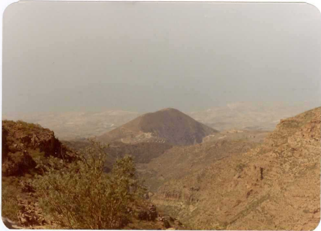
Foto 136.— En primer término Barranco del Niágara. Montaña Tejina en segundo plano y al fondo la plana de Puerto de Alcalá.