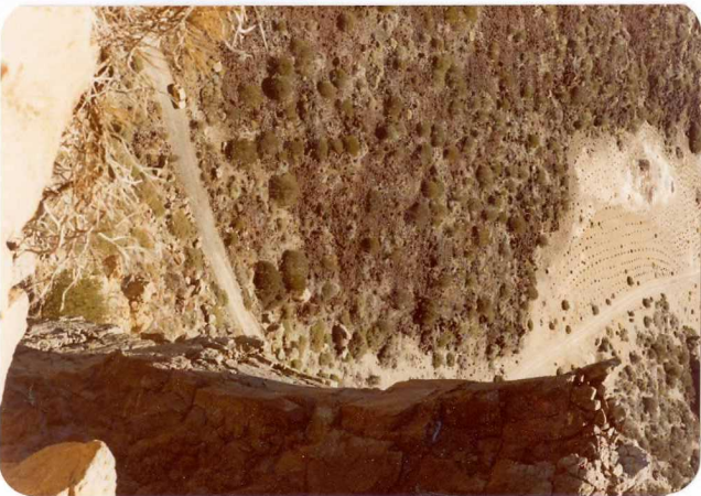
Foto 129.— Escarpe de la pared de las Cañadas desde los Roques del Cedro.