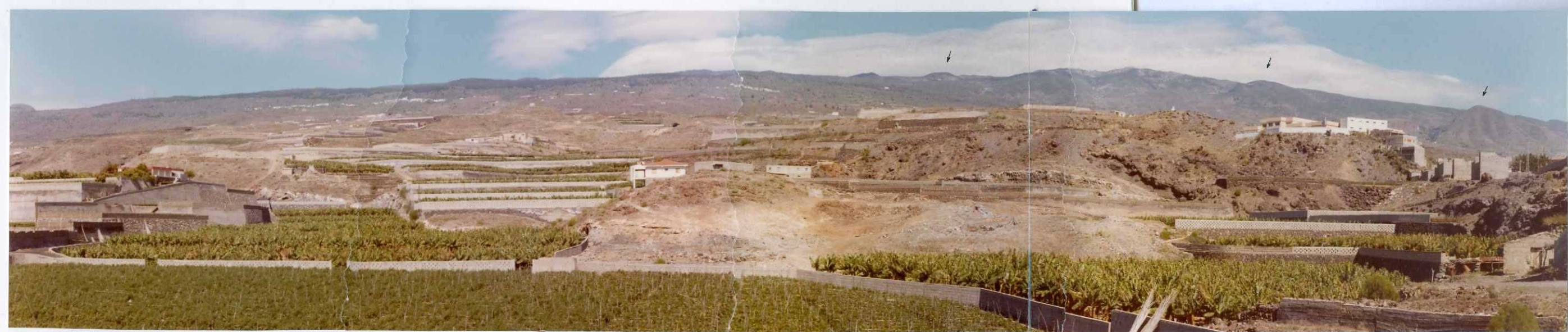
Foto 131.— Vista panorámica desde Puerto de Alcalá. En la parte central con pendiente uniforme las coladas de las series III y IV que permiten observar la serie Cañadas en alguna ventana o escarpe erosivo. Al fondo a la derecha el relieve constituído fundamentalmente por la serie Cañadas, en donde se distinguen de izquierda a derecha y marcados por flechas; Montaña Chasogo, Chifira y Tejina.