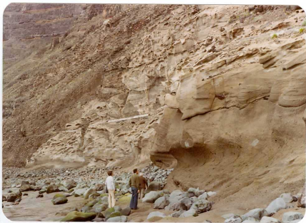
Foto 127.— Derrubios de ladera sobre dunas fósiles. (Playa del Acantilado de los Gigantes).