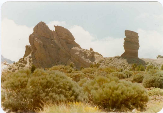
Foto 180 - Detalle de los Roques de García desde la zona del Parador de Turismo.