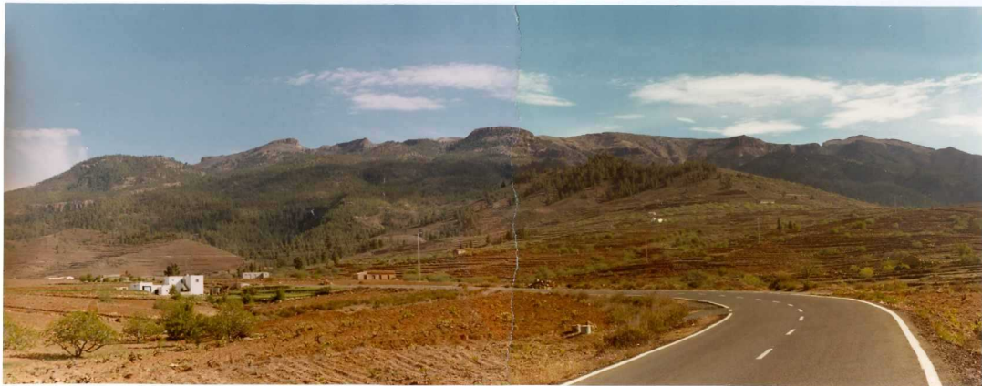
Foto 175 - Fotografía tomada desde una cota algo superior al pueblo de Vilaflor, en lo que se incluye la pared de Las Cañadas en su vertiente externa, con el Cerro de el Sombre-ro en el centro.