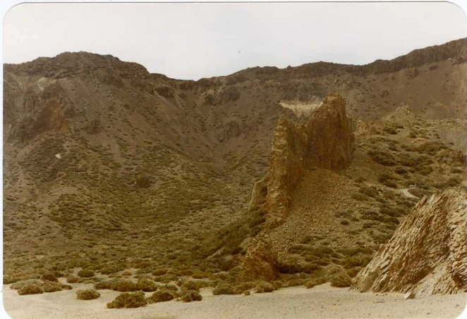
Foto 173 - Resalte correspondiente a un dique sálico. Al fondo la pared de Las Cañadas.