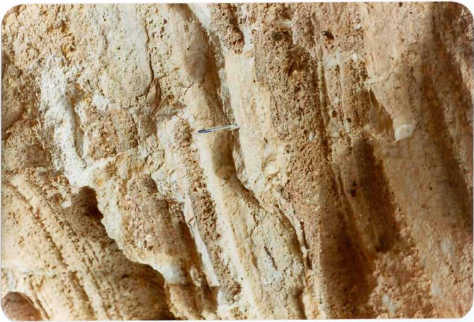
Foto 171 - Toba traquítica.