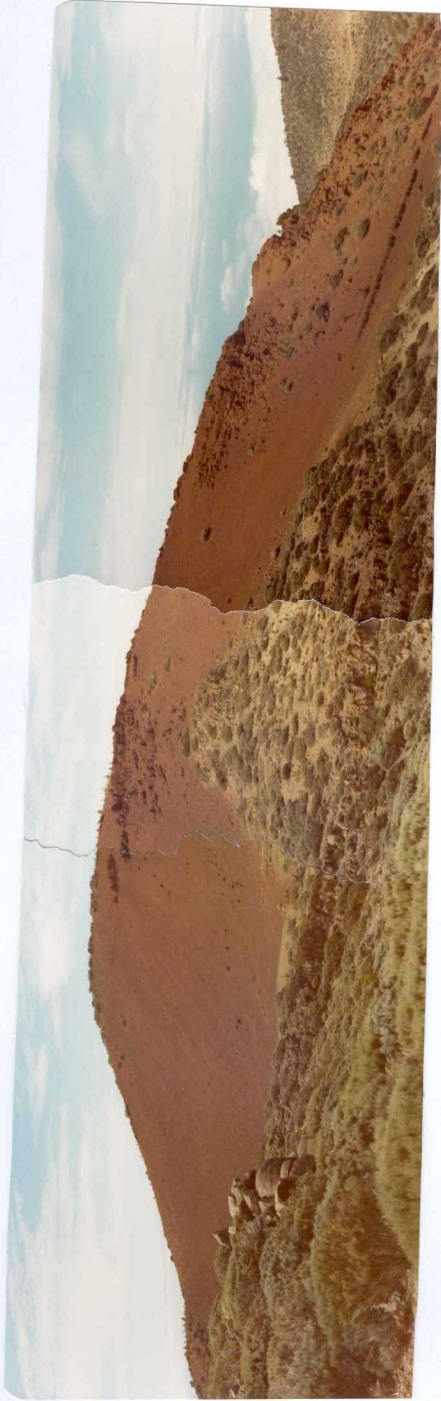
Foto 178 - Cono de piroclastos de M ña Cangarro que se apoyan sobre traquibasaltos.