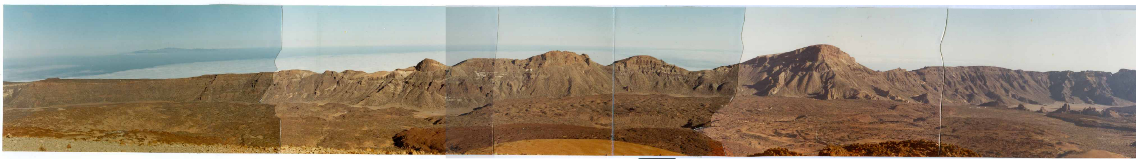
Foto 196 - Vista panorámica de la pared de Las Cañadas desde M ña Blanca. En primer término las coladas traquíticas de la Serie IV del edificio del Teide. A la derecha, en el fondo del Valle, los Roques de García.