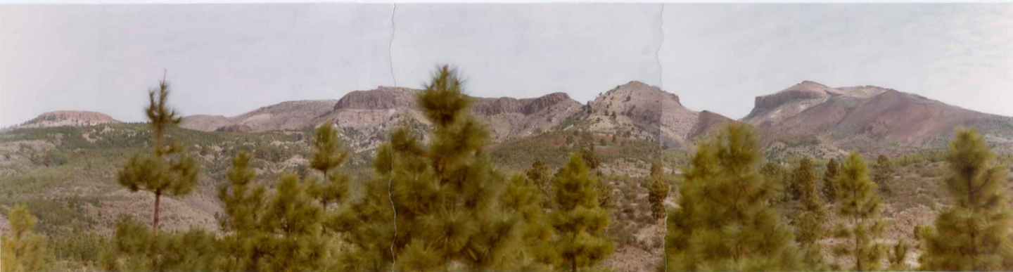
Foto 182 - Panorámica de la pared de Las Cañadas por su vertiente externa desde el paraje de M ña Colorada situado al Sur de la Hoja, y que comprende desde el Sombrero (a la izquierda de la foto) hasta M ña Guajara (a la derecha).