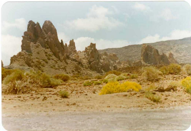
Foto 181 - Detalle de los Roques de García desde la zona del Parador de Turismo.