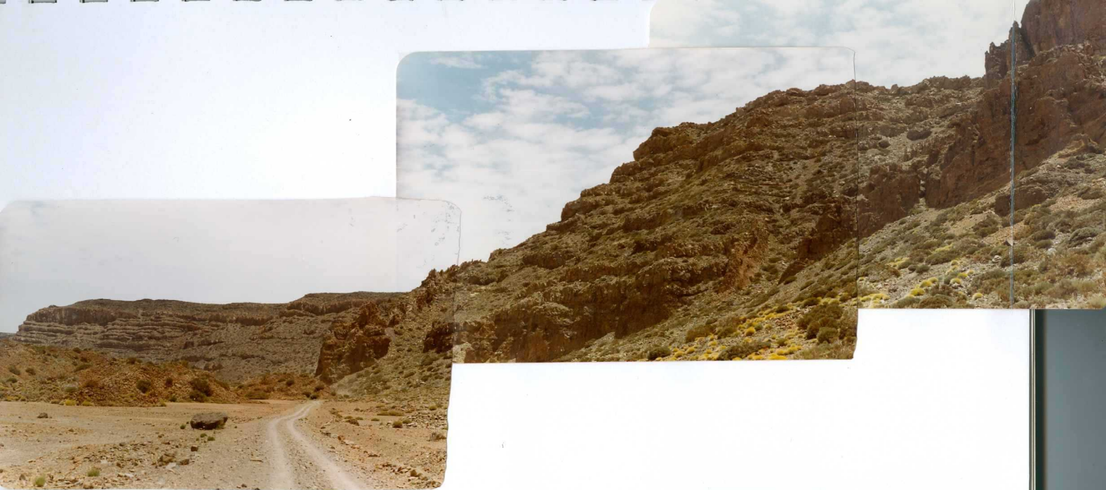
Foto 194 - En el sector más oriental de la pared de Las Cañadas se observa el gran desarrollo del apilamiento de coladas eminentemente traquibasálticas. Culminando, al fondo , sobre las fonolitas superiores se observan coladas más oscuras de traquibasaltos - atribuidos a la Serie III.