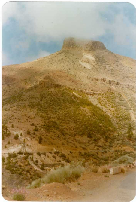
Foto 174 - Colada fonolítica en la parte superior de la pared de Las Cañadas, conocida con el nombre de el Sombrero.