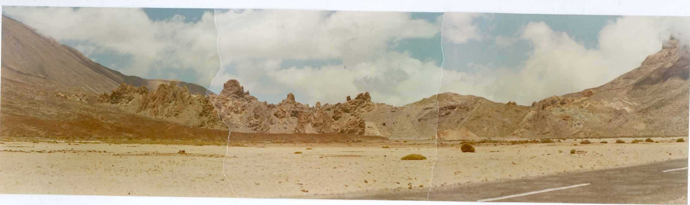
Foto 179 - Roques de García desde el Llano de Ucanca.