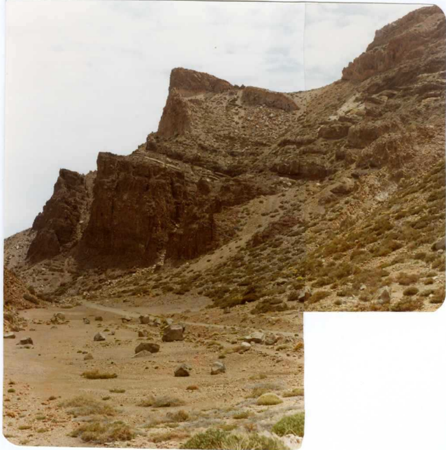
Foto 192 - Aspecto de la Serie II en Topo de la Grieta. En la parte inferior basaltos plagioclásicos sobre las to bas traquíticas. En la parte media alternancia de traquibasaltos predominantes con pumitas. Arriba - fonolitas y pumitas superiores.