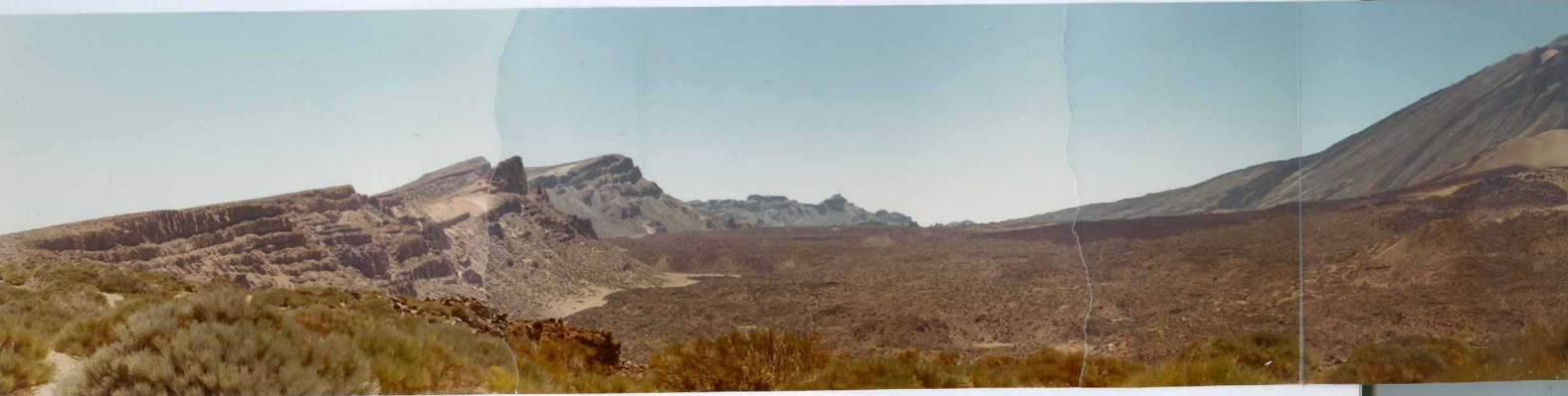
Foto 195 - Panorámica general del Valle de Las Cañadas. A la izquierda la pared; a la derecha el Teide y M ña Blanca.