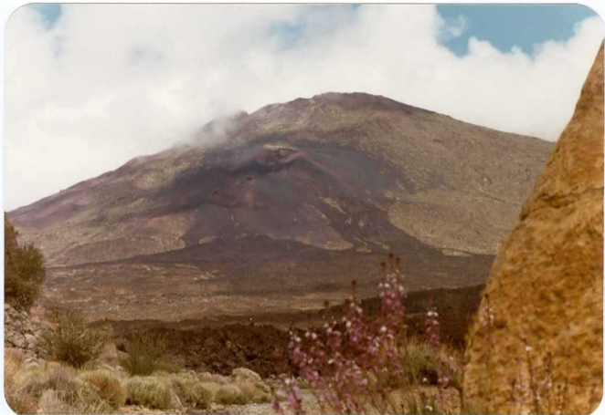
Foto 184 - Centro de emisión y coladas de la erupción histórica de 1798, en el paraje denominado "Narices del - Teide".