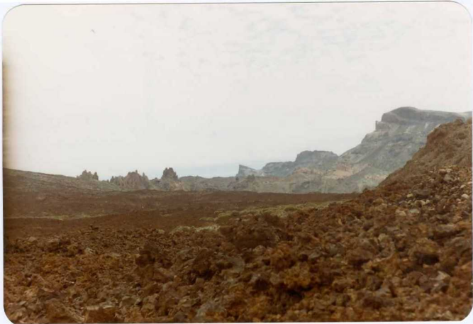
Foto 177 - Coladas recientes en el interior del Circo de Las Cañadas, con los Roques de García al fondo.