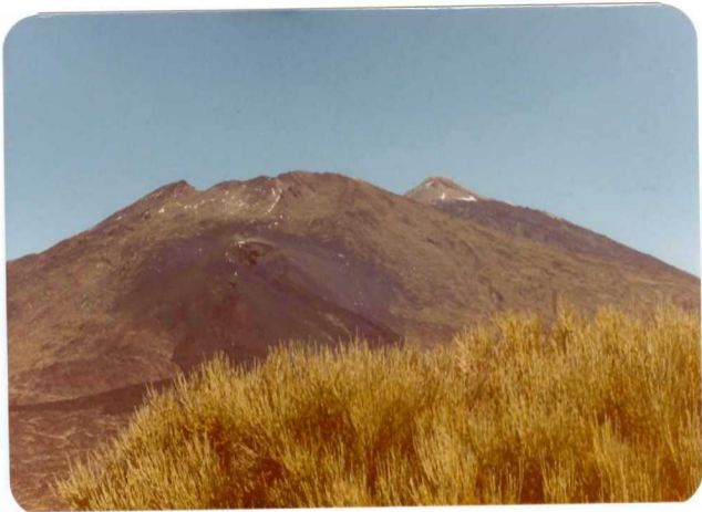
Foto 185 - Otra vista de la misma erupción. El pico Teide al fondo.