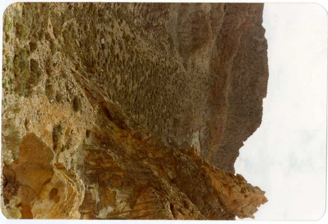
Foto 172 - Dique que atraviesa la toba traquítica.