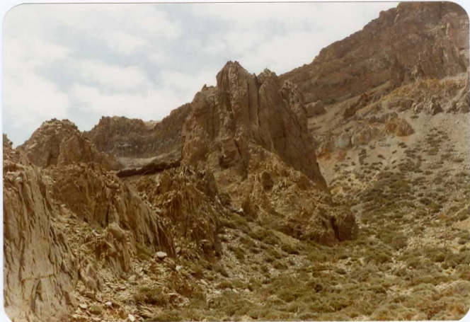
Foto 191 - Aspecto de un importante dique fonolítico en la ba se de M ña Guajara.