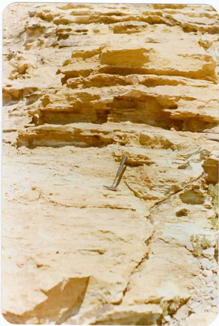
Foto-37 - Toba traquítica con estratificación.