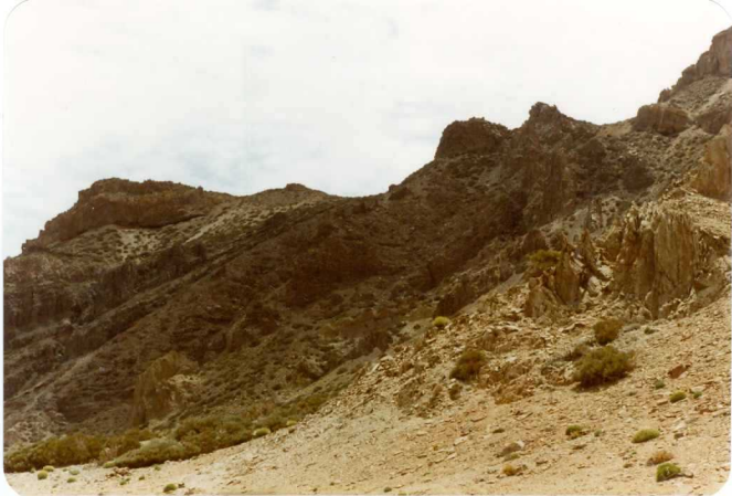
Foto 193 - Edificio basáltico en la Angostura atravesado por diques sálicos. Coronando el escarpe, las alternan cias de fonolitas y pumitas de la parte superior de la Serie Cañadas. Entre ambas se observa el acuña miento del tramo traquibasáltico que se desarrolla hacia el Este.