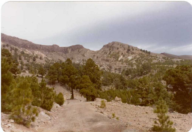
Foto 183 - Valle encajado en las fonolitas superiores entre el Llano de las Mesas (a la izquierda) y el Roque del Encaje (a la derecha).