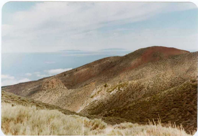
Foto 176 - Cono de piroclastos basálticos de M ña Cangarro, so bre el que se apoya una plancha de fonolitas.