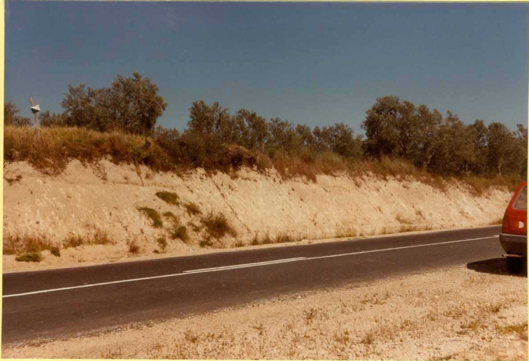
F.9179. Arcillas margosas del plioceno medio-superior. (Unidad 23).