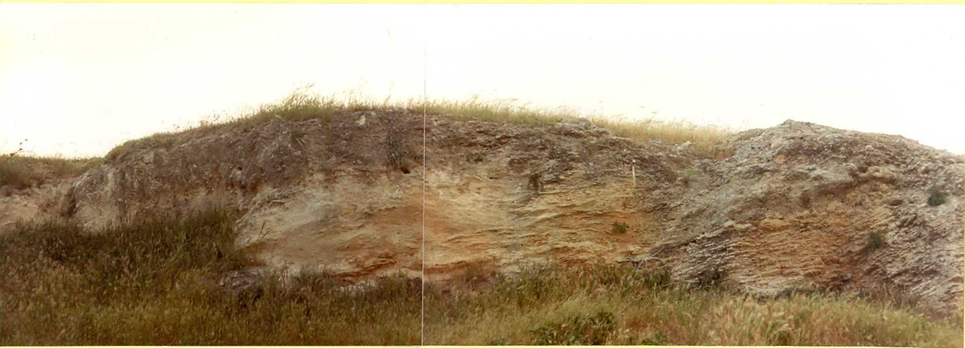
F.9176. Calizas lacustres (Unidad 24) sobre las que también se observa el desarrollo de un paleosuelo.