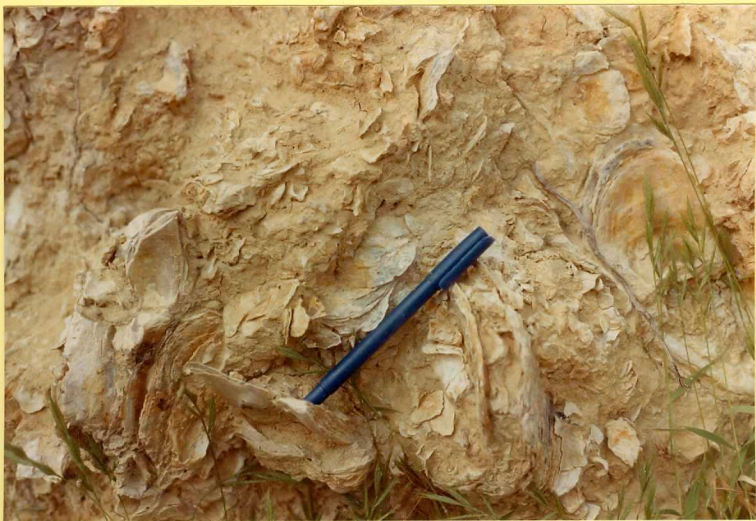
F.9173. Acumulación de ostreas y otros restos fósiles en las arenas amarillas pliocenas. Detalle de la fotografía anterior.