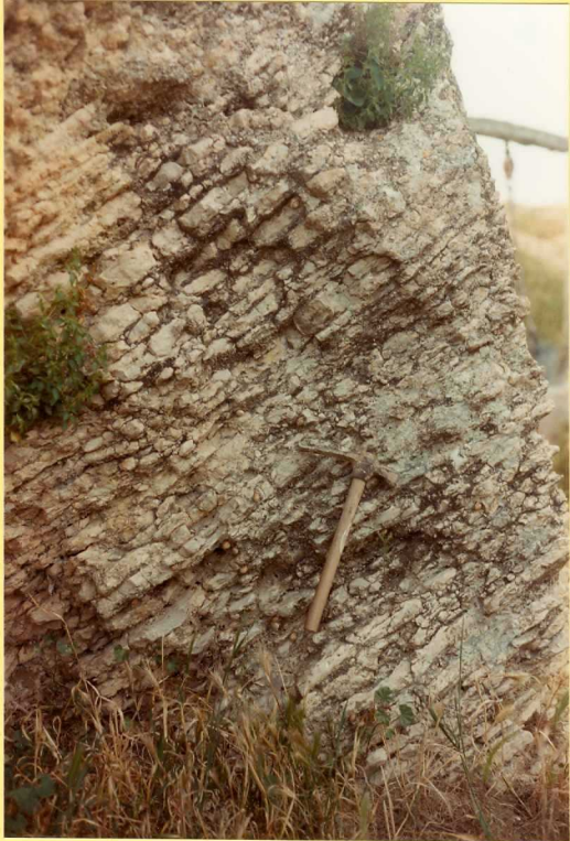
F.9177. Detalle de las calizas lacustres.