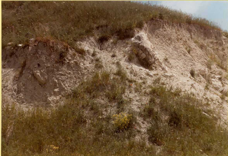
F. 9158. Aspecto general de las Moronitas, en este caso con una intercalación calcarenítica.