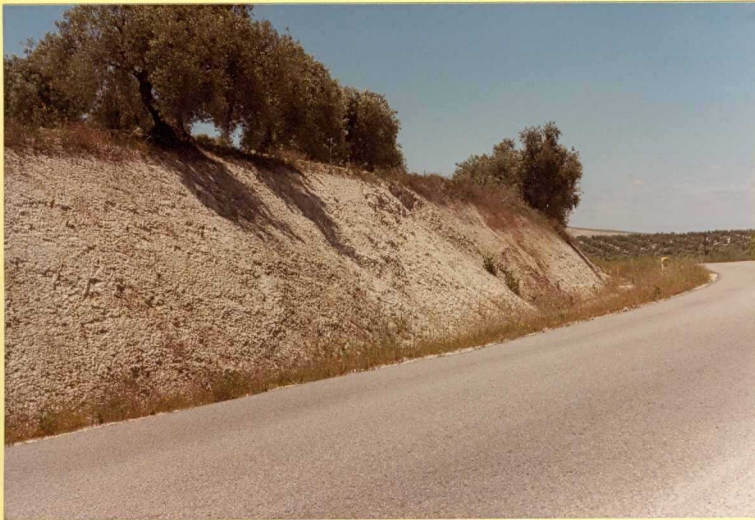
F.9156. Aspecto general de las Moronitas. (Unidad 14).