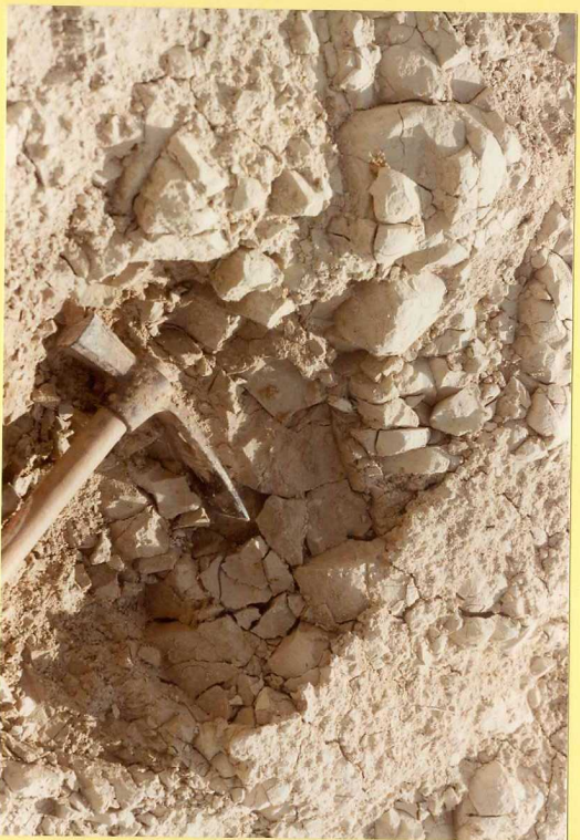
F.9159. Detalle de la fotografía anterior.