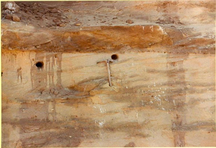
F.9168. Detalle de la mencionada barra pliocena.