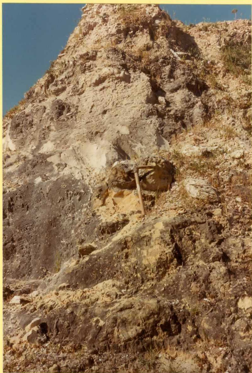
F. 9171. Detalle de la anterior.