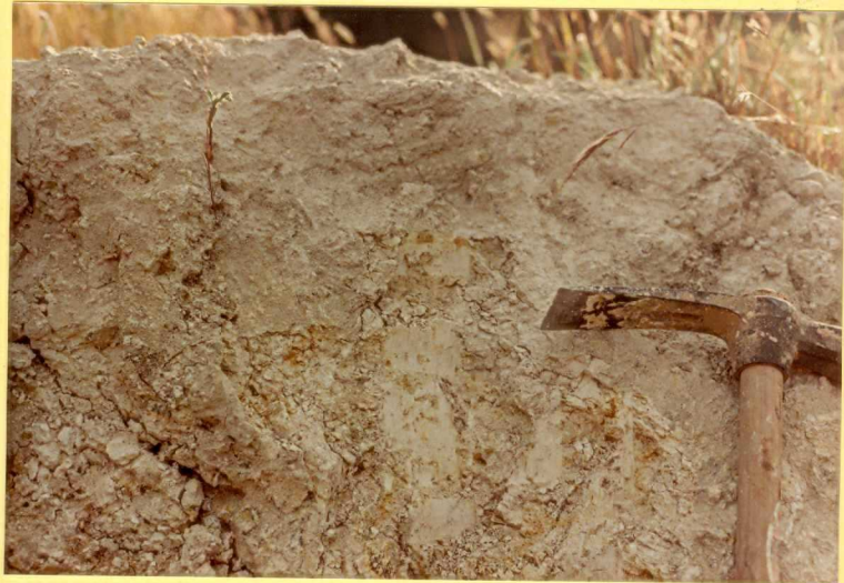
F.9175. Detalle de la fotografía anterior.