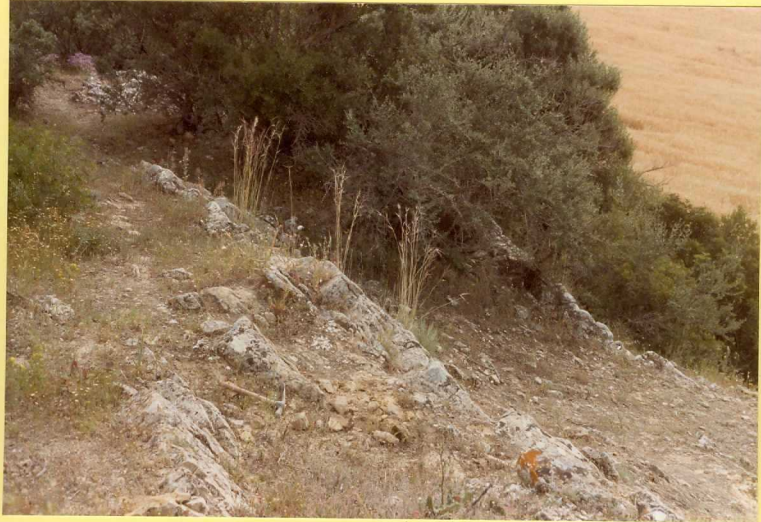
F.9160. Conjunto de niveles calcareníticos miocenos intercalados entre arenas amarillas (Unidad 16).