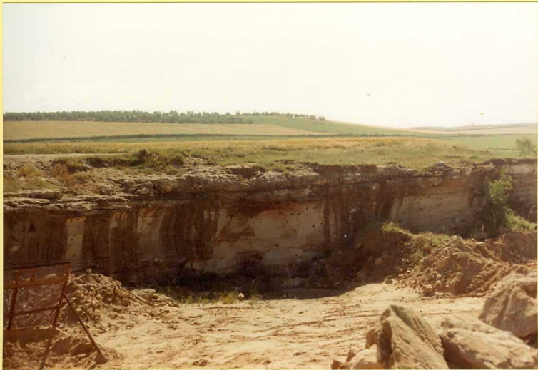
F.9166. Barra biocalcarenítica del Plioceno junto a El Coronil. (Unidad 22).