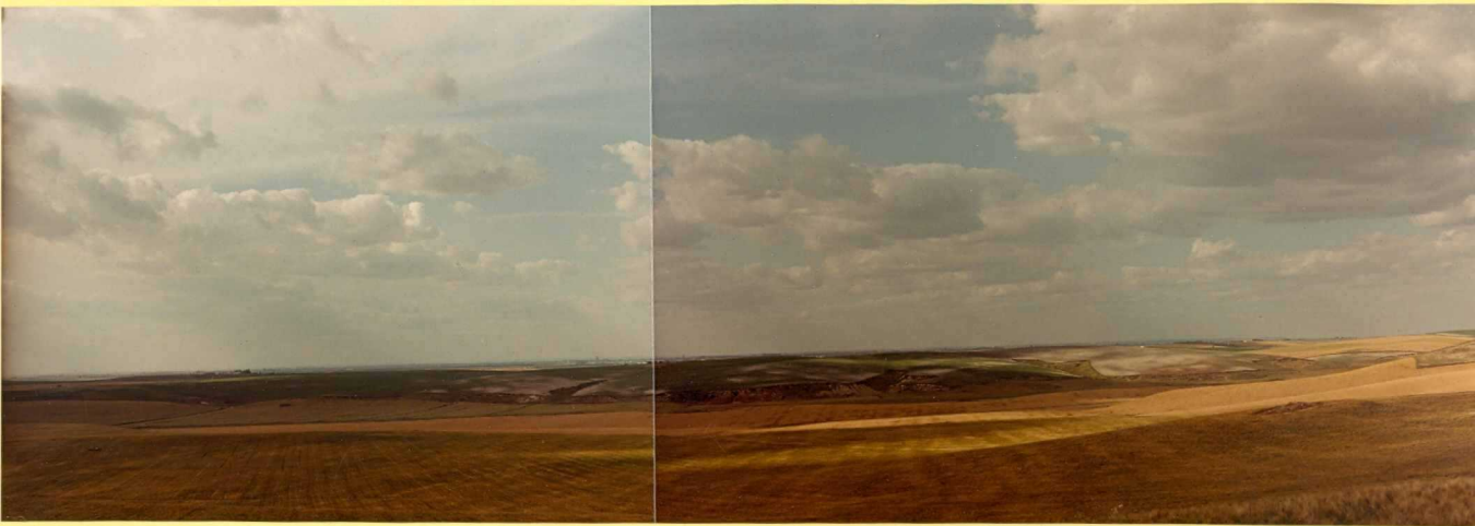
F.9183. Moronitas sobre arcillas y yesos del Triásico. Alrededores de las salinas de Valcargado.