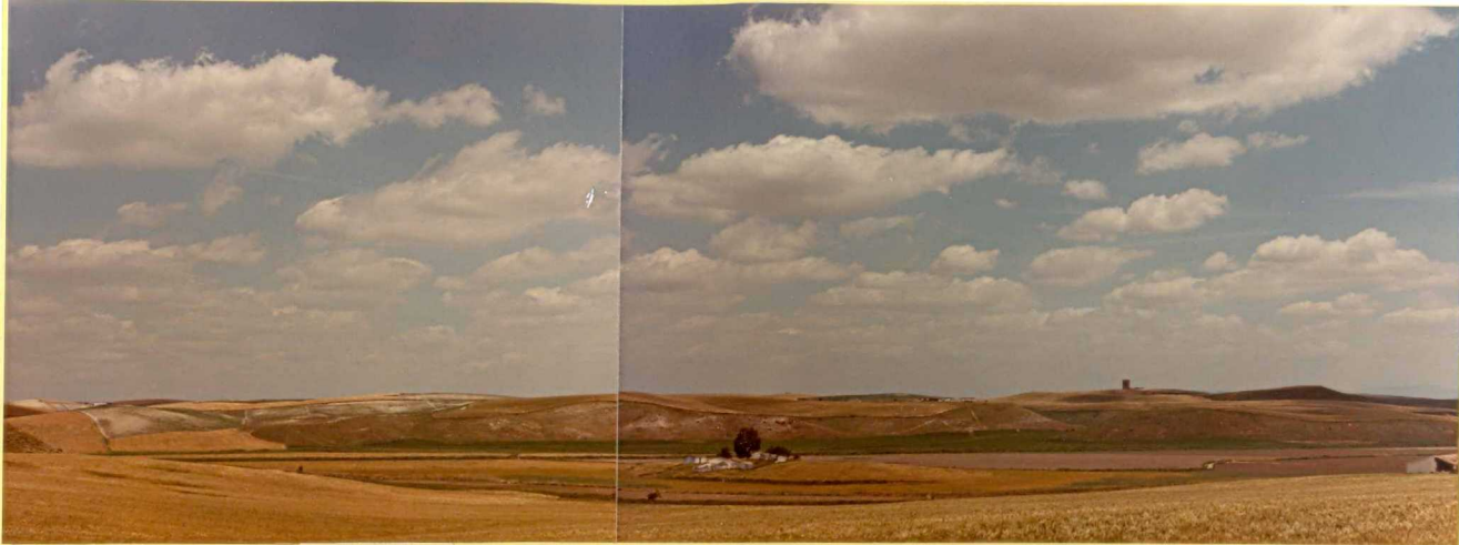
F.9182. Moronitas sobre arcillas y yesos del Triásico. Alredores del Embalse de la Torre del Aguila.