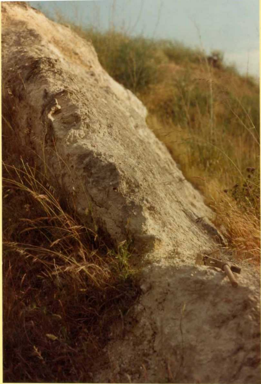
F.9174. Detalle del paleosuelo de la fotografía número 20.