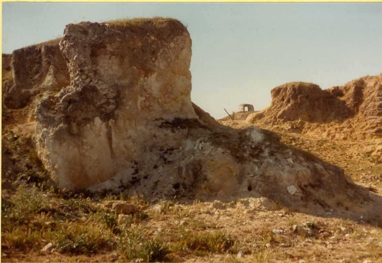
F.9170. Arenas amarillas pliocenas (Unidad 21) con desarrollo de un paleosuelo a techo.