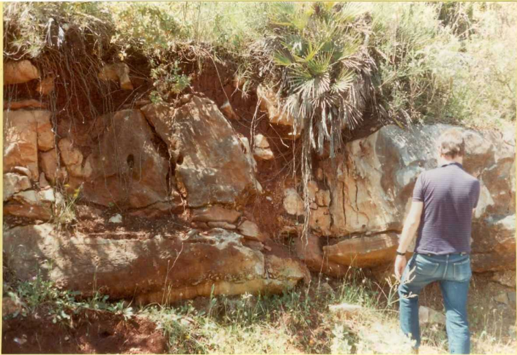
F. 9154. Calizas con silex del Dogger. (Unidad 6).