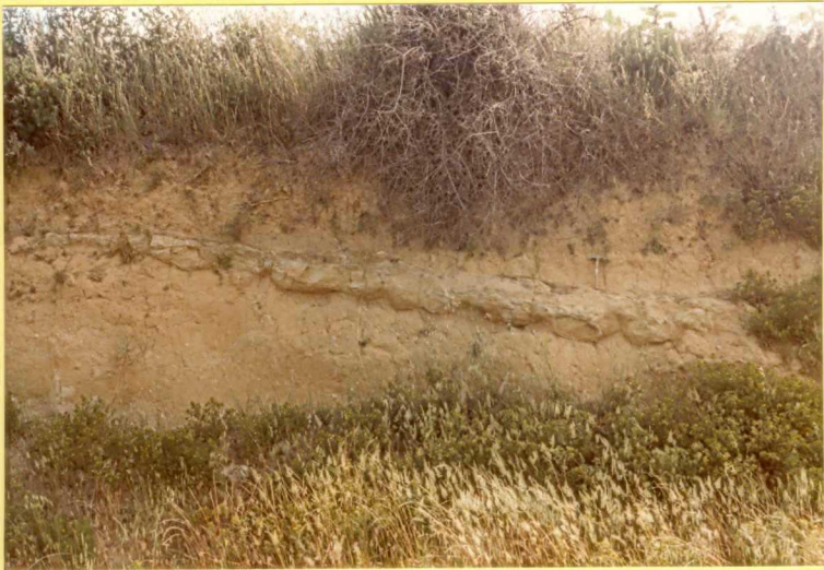
F.9162. Arenas del Mioceno superior con pequeña intercalación biocalcarenítica. (Unidad 18).