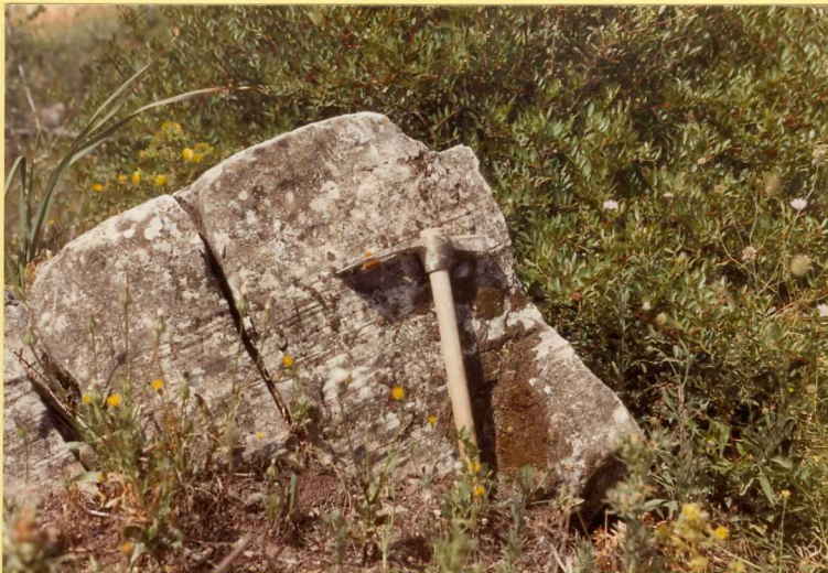
F.9161. Detalle de uno de los niveles calcareníticos, de la fotografía anterior.