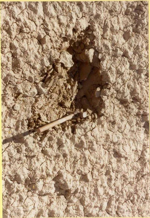
F.9157. Detalle de la fotografía anterior.