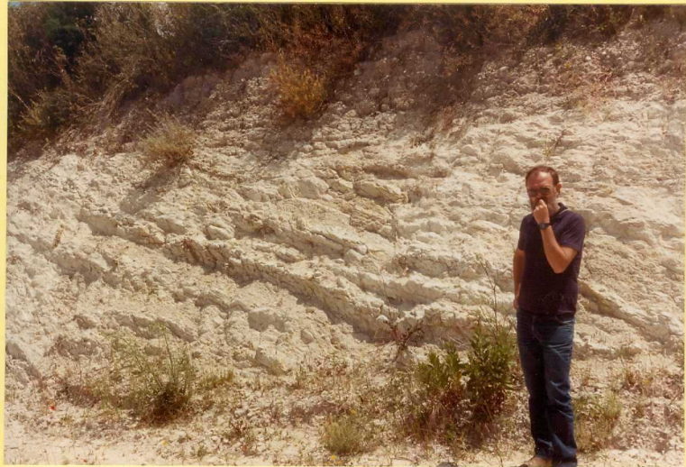
F. 9155. "Capas rojas" del Cretácico superior-Eoceno inferior, alteradas (Unidad 12).