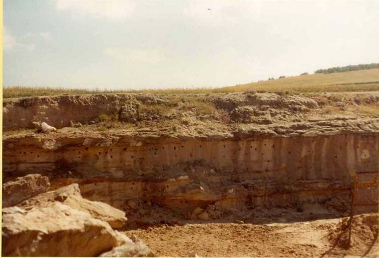
F.9167. Barra biocalcarenítica del Plioceno, junto a el Coronil. (Unidad 22).