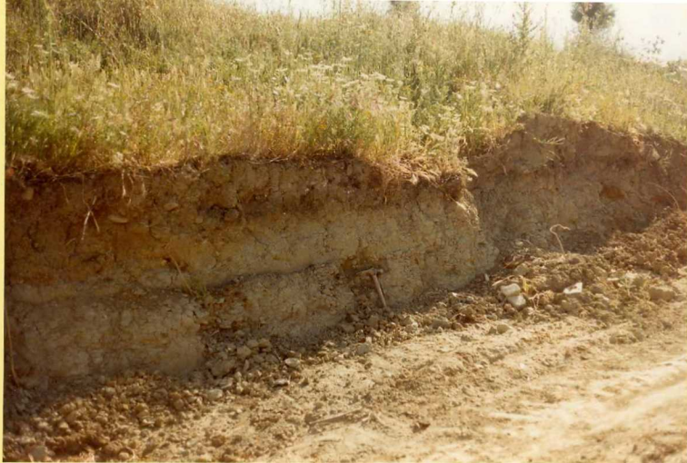
F.9163. Margas grises del Mioceno superior alto. (Unidad 20).