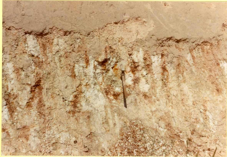
F.9180. Detalle de la fotografía anterior.