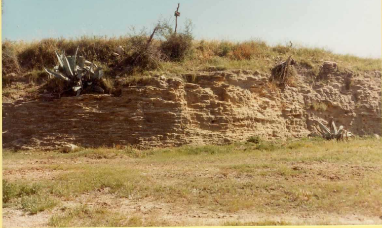
F.9165. Barra biocalcarenítica del Plioceno junto al Castillo de los Aguzaderos. (Unidad 22).