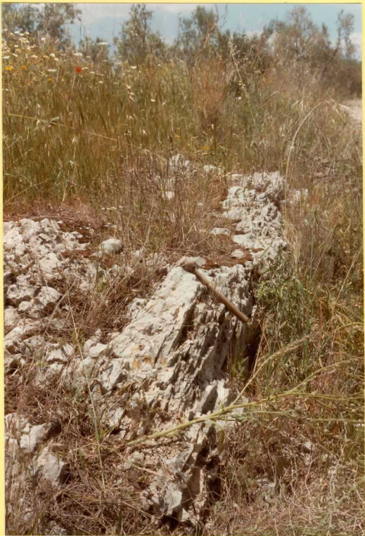
F.9178. Calizas lacustres del plioceno superior buzando fuertemente debido a procesos diapíricos de los materiales triásicos.