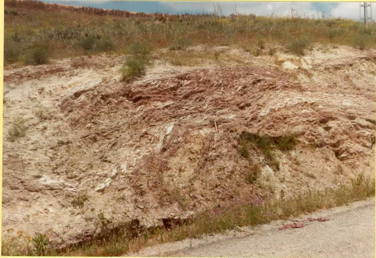
F. 9153. Arcillas y yesos del Trias. (Unidad 1).