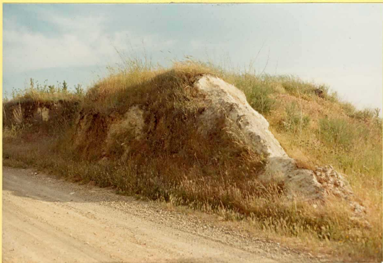
F.9172. De izquierda a derecha, arenas amarillas pliocenas (21), paleosuelo de escaso desarrollo y calizas lacustres (24), prácticamente cubiertas por la vegetación. Todo el conjunto aparece buzando hacia en No roeste debido a recientes movimientos diapíricos de los materiales triásicos.