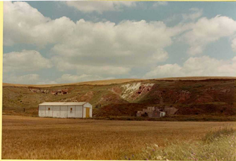
F.9181. Moronitas sobre arcillas y yesos del Triásico. Alrededores del embalse de la Torre del Aguila.