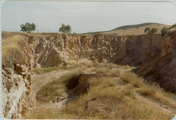
DR. 9.504 Cantera abandonada en Yesos del Trías ( T_{G1} ) T_{G3} ). Subbético Indiferenciado.