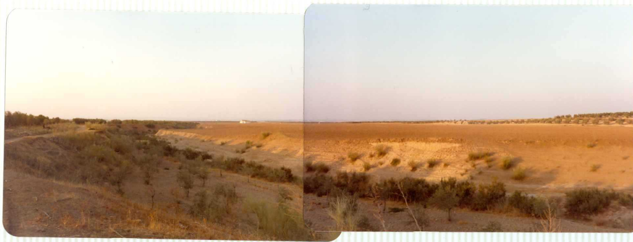
DR. 9.587 Panorámica cuaternario del Arrollo Peinado al E de OSUNA.