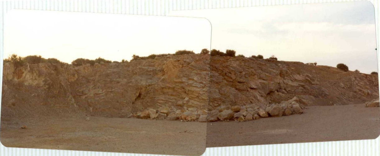
DR. 9.522 Cantera del acebuche, calizo-dolomías ta- - bleadas del Muschelkalk ( T_{G2} ).