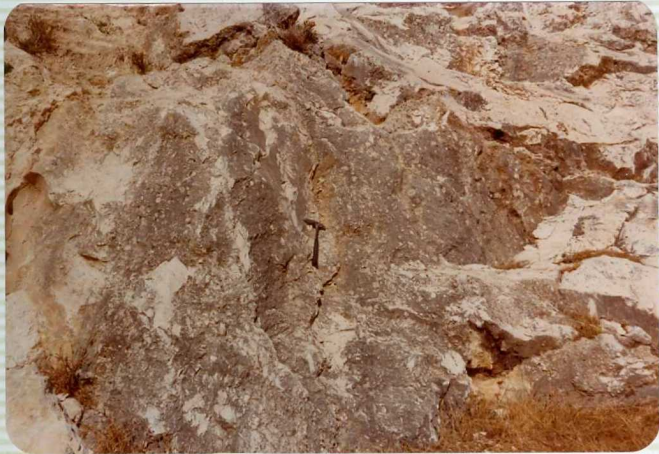
DR. 9.578A Caliza oolítica Jurásica subbético externo Sie rra de Estepa (detalle de la anterior).