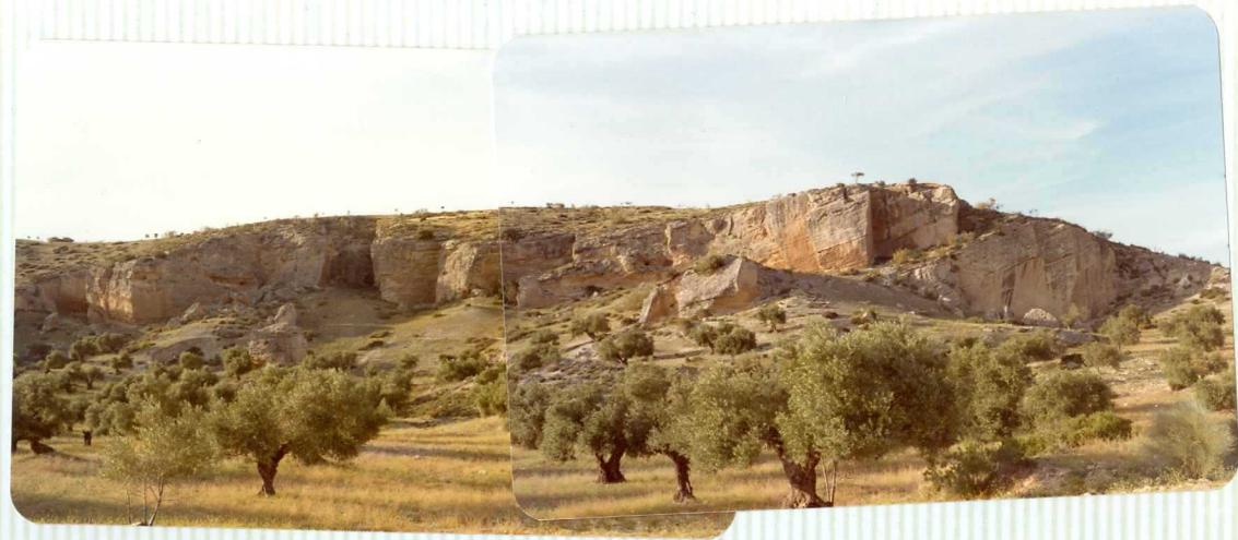
DR. 9. 501 Areniscas bioclásticas del Mioceno Superior (T 11 Bc - T 12 Bc ). Cerro de los Canterones.