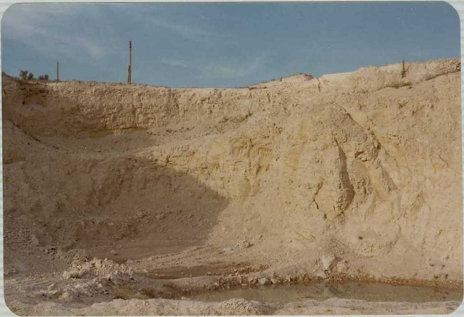
DR. 9.505 Margas calcáreas Blancas del Mioceno Inferior de Osuna ( T_{12}^{Bb} ). Cantera de Cerámica - de Pedrera.