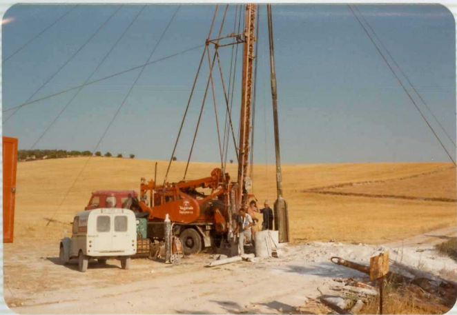
DR. 9.564 - F2 Dos fotografías. Sondeo a percusión, para abastecimiento de agua, en el conducto subbético externo Sierra de Estepa con las - - Margas Miocenas post-orogénicas. El acuífero lo constituyen las calizas Jurásicas de Estepa.