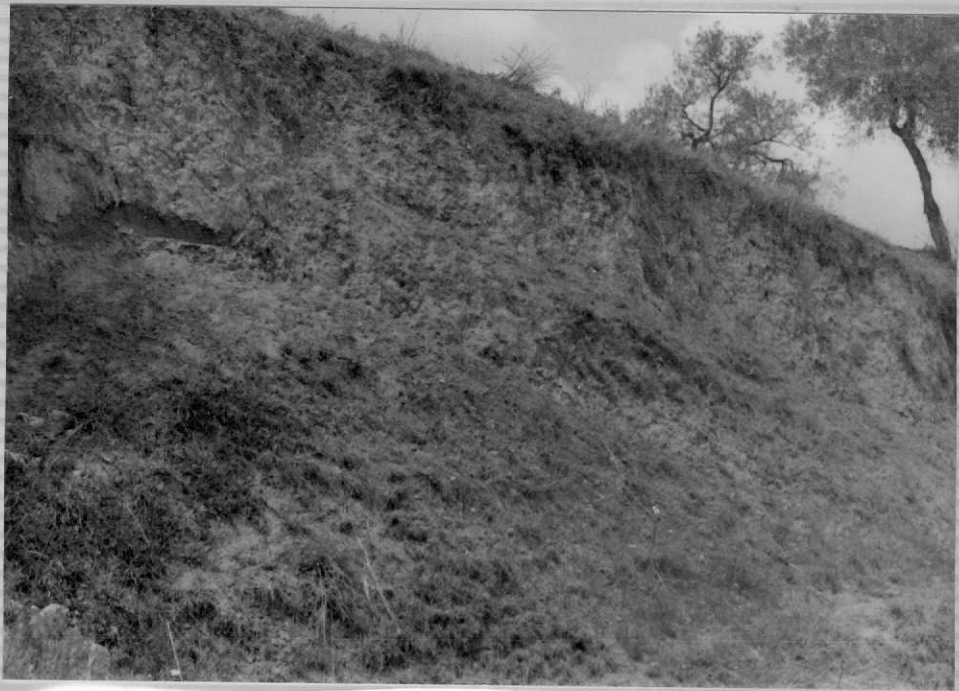
J.E. 9.836 Margas del Mioceno Inferior de Osuna ( T_{12}^{Bb} ). Talud de la Carretera al Puerto de la Encina.