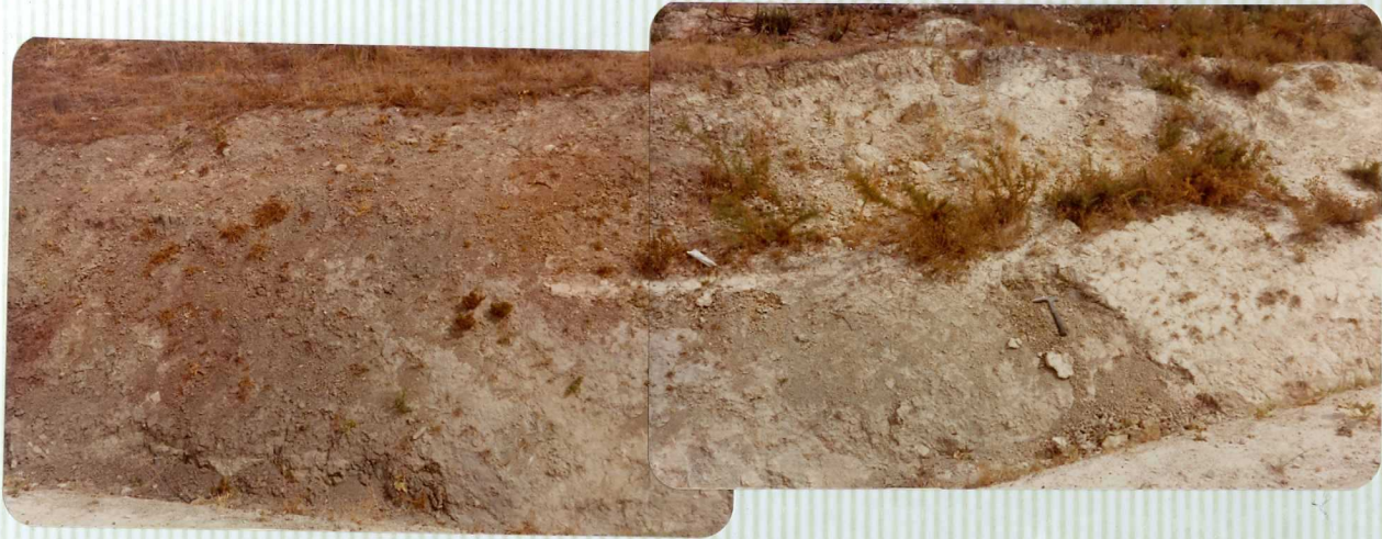
DR. 9.599 Contacto margas Eocenas sobre el triásico - arcilloso del subbético indiferenciado. Carre ra tera de Pedrera a Martín de la Jara.