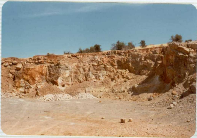
DR. 9.541 Cantera abandonada en el Cortijo de los Cabe- zuelos carretera OSUNA-ECIJA. Dolomías - Carniolares triásicas del Subbético Indiferen- ciado ( T_G 3).