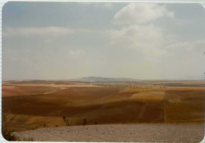
DR. 9.516 Panorámica de OSUNA desde el Cerro del - Caballo, Cretácico Inferior (C 11 -C 16 ) del - subbético Indiferenciado.