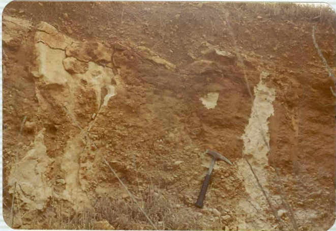
DR. 9.512 Depósitos cuaternarios aluviales ( Q_2 Al-T). - Se observan 60 cms. de costra calcárea - Pulverulenta.