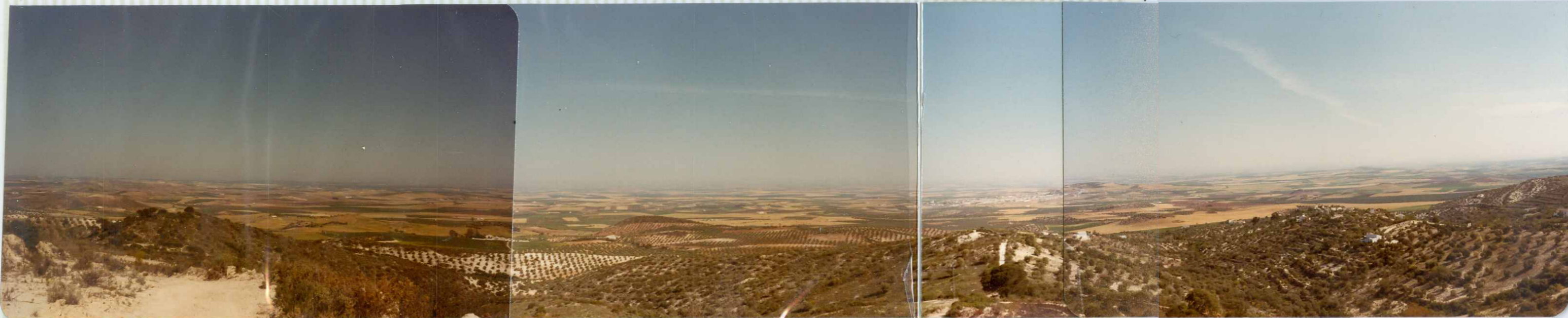
DR. 9.502 Panorámica de la Llanura de OSUNA desde - los relieves terciarios de las Viñas, al SW de la Hoja.