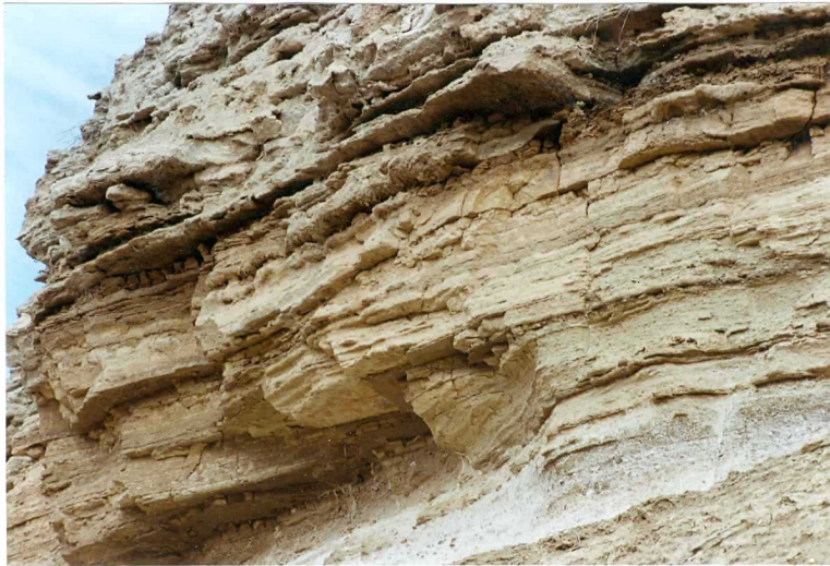
F-9339.- Secuencia de margas, margocalizas tableadas y yesos.