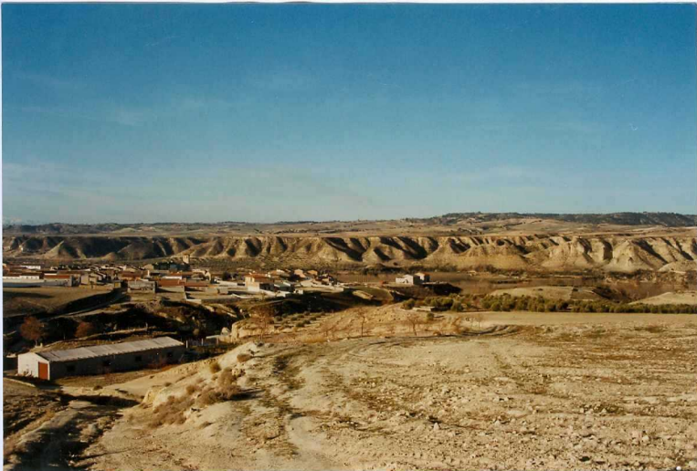
F-9351.- Cortes de Baza. Terrazas asociadas al río Castril y superficie de glacis por encima.