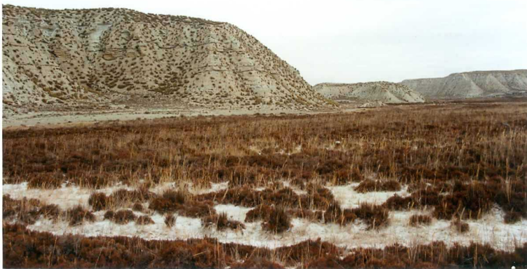
F-9343.- Secuencias monótonas de margas y yesos (F. Baza). Fondo de Valle.