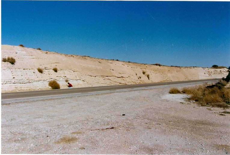
F-9331.- Canal fluvial sobre las margas y yesos de la F. Baza.