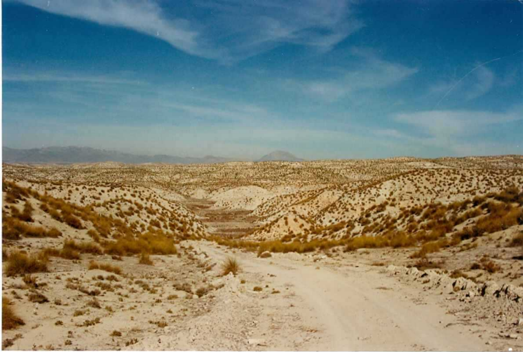
F-9340.- Margas y yesos (F. Baza). Fondos de valle asociados.