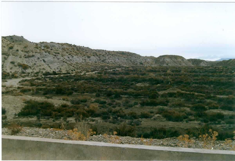
F-9311.- Fondos de valle contruidos sobre la F. Baza.