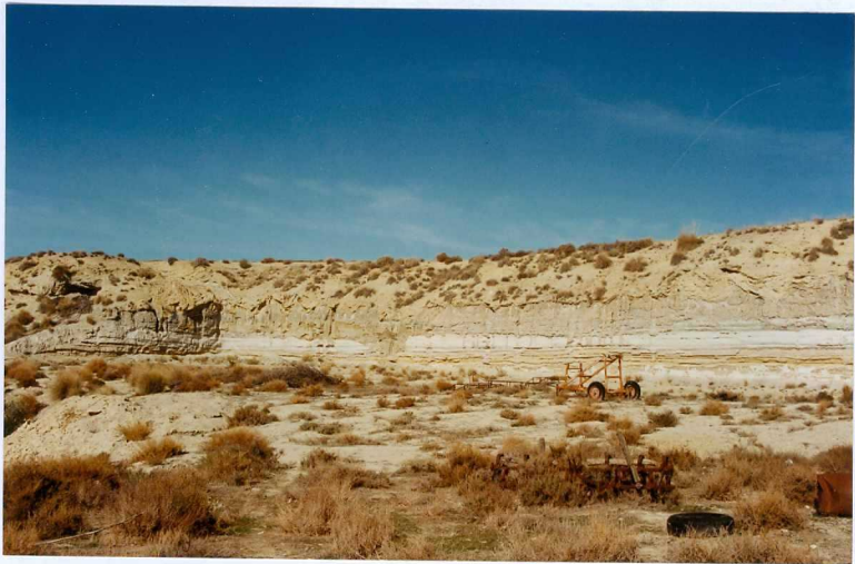
F-9338.- Intervalos de sedimentación fluvial intercalados en la sedimentación lacustre (F. Baza).