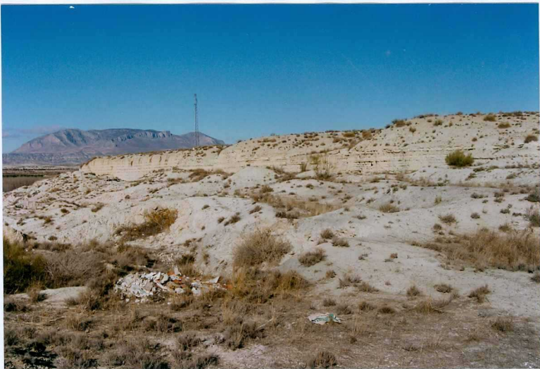
F-9314.- Secuencia de arenas, margas, margocalizas, limos y yesos, con gasterópodos y lamelibranquios, fauna lacustre (F. Baza).