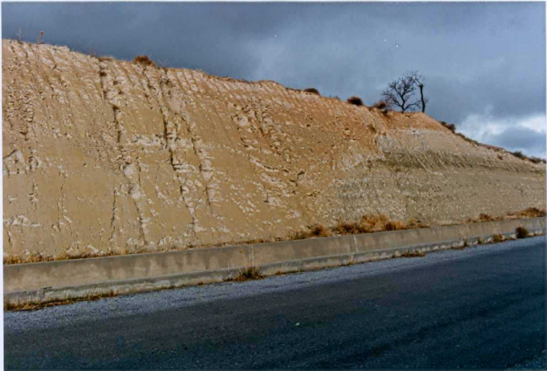
F-9310.- Cicatriz erosiva sobre las margas y margocalizas con yesos (F. Baza), el relleno corresponde a sedimentos aluviales o coluviales indiferenciados (19).