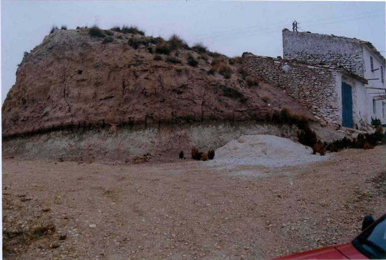
F-9302.- Margas y margocalizas blancas, arcillas lignitíferas y arenas y conglomerados. Secuencia del Plio-Pleistoceno.