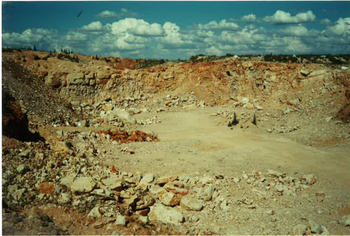
22-33-IN-FL-Fo5.- Canteras en Villahermosa (carretera comarcal de Villahermosa a Ossa de Montiel). Calizas y calizas dolomíticas gris azuladas, bien estratificadas del Lías Medio-Superior (19).