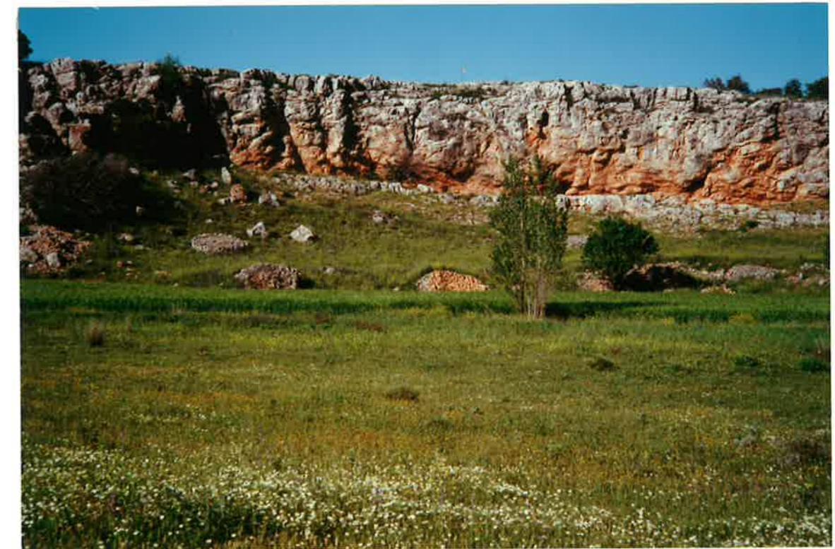
22-33-IN-FL-Fo4.- Dolomías masivas rojizas con estratificación difusa a techo del Lias Inferior (18) en la Casa de la Rivera en la carretera local de Villahermosa a La Carrizosa.