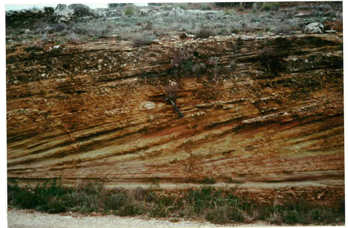
22-33-IN-FL-Fo3.- Areniscas de la unidad (16) límite entre las Facies Keuper siliciclásticas y las evaporíticas. Este punto de observación se encuentra en una curva de la carretera antigua de la comarcal de Villanueva de los Infantes a La Carrizosa, a su paso por el Arroyo del Tortillo. Obsérvese la estratificación cruzada sigmoidal con set de espesores decimétricos a métricos. Obsérvese un "ribs" de grava sobre las láminas del foreset situadas encima del martillo. Fluvial meandriforme.