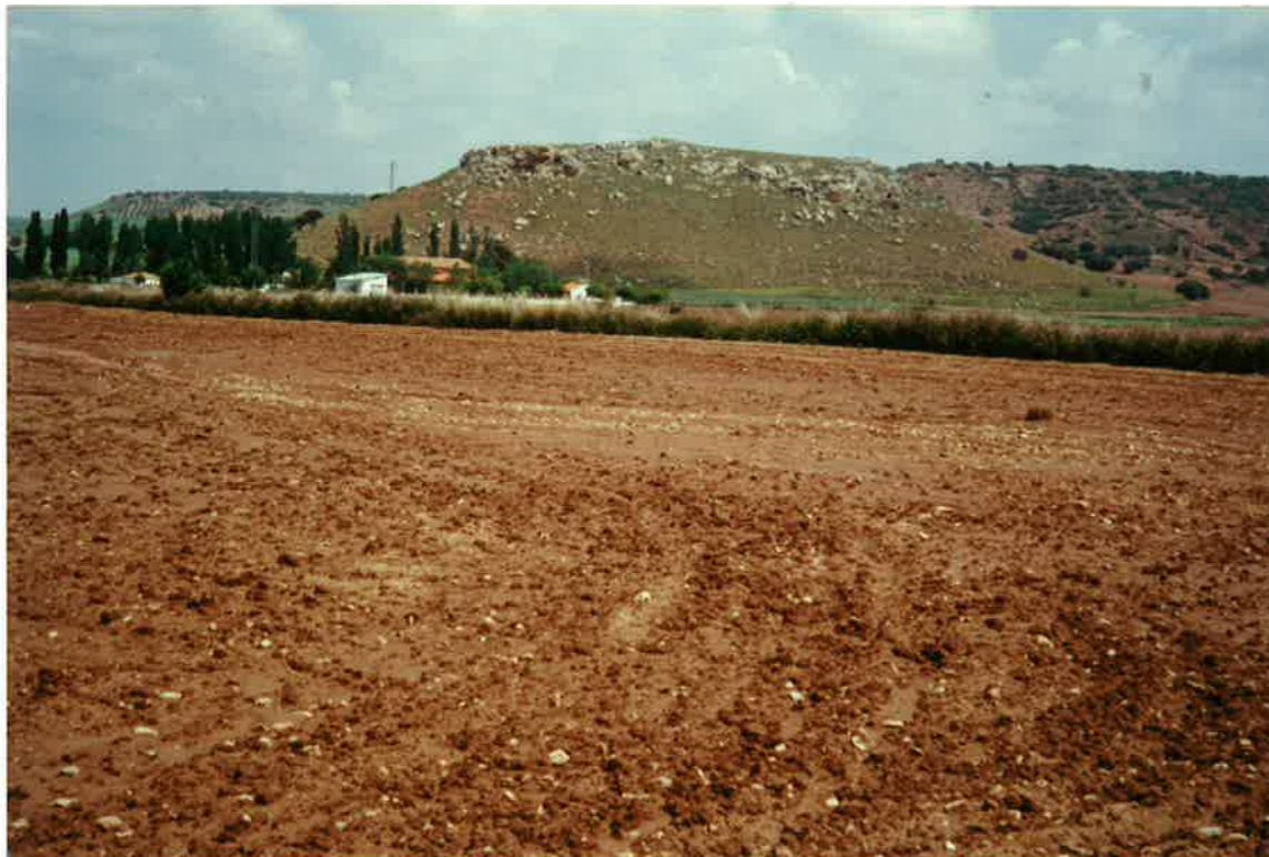
22-33-IN-FL-Fo6.- En la Ermita de Nuestra Sra. del Salido, al SE de La Carrizosa, y sobre las lutitas con yeso y carbonatos de las Facies Keuper (17), pueden encontrarse a cotas similares depósitos carbonatados y conglomeráticos del Mioceno Superior (20), como ocurre en el cerro de la Ermita o dolimas y calizas dolomíticas rojizas del Lías Inferior (18), tal como se dispone en el segundo horizonte de la fotografía.