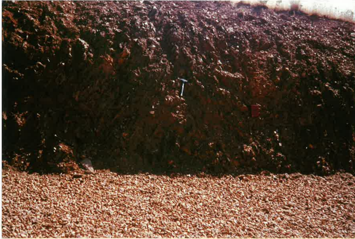
21-32-IN-FL-Fo1.- Alternancia de cuarcíticas y pizarras de los Bancos Mixtos (8) aflorantes en el Km 19,100 de la carretera comarcal de Cozar a Valdepeñas. Los pliegues que se observan tienen dirección N60°E.