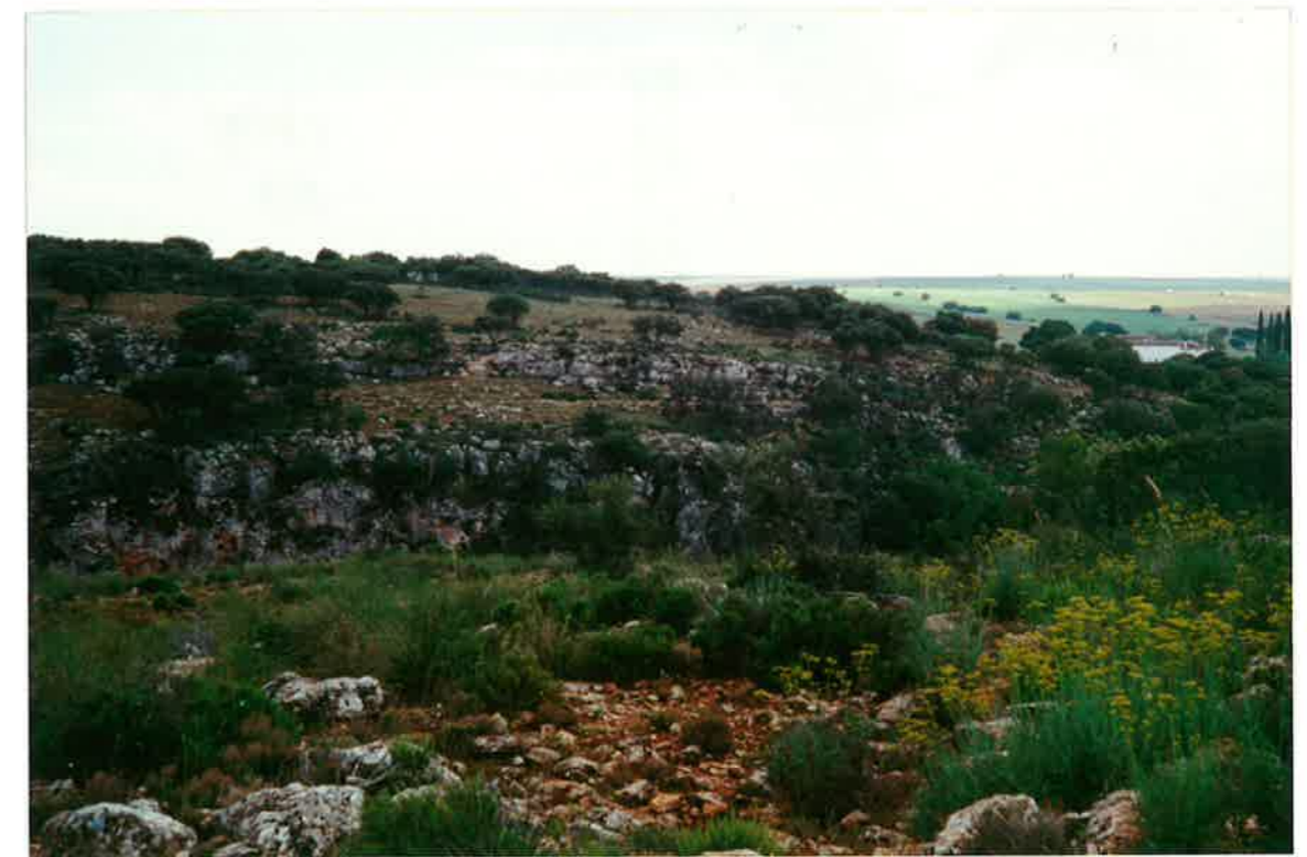
22-33-IN-FL-Fo8.- Conglomerados calcifícticos en la base, calizas bioclásticas y oncolíticas hacia techo en el Mioceno Superior (20), aflorante en el río Cañamares, aguas abajo del Molino de Huelma.