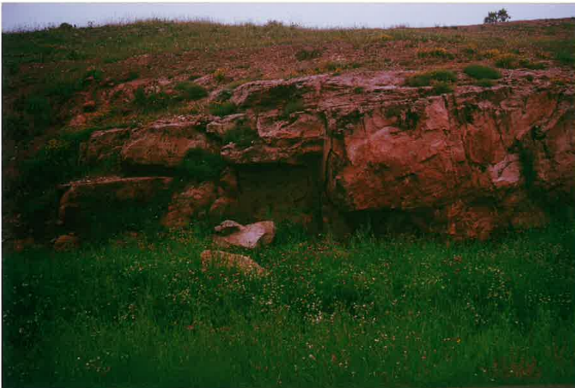
22-32-IN-FL-Fo2.- Relleno de canal con espesor métrico en las capas de areniscas de la unidad (15) de las Facies Keuper. Se observan unidades de acreción lateral y estratificación cruzada en surco de media escala ( Chanel fill cross-bedding ).