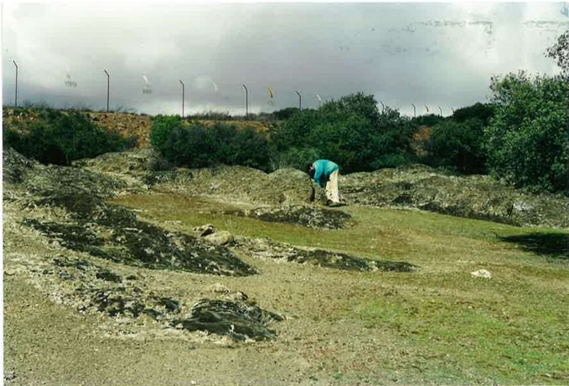
Foto 9. Formación de Pizarras Guindo al SE de la Hoja.