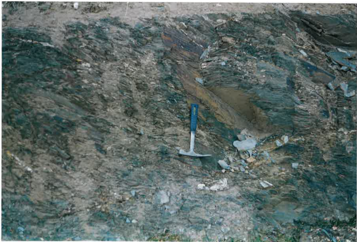
Foto 6. Formación Pizarras de Río, afectadas por la Fase 2, en el mismo afloramiento anterior y con mayor detalle.