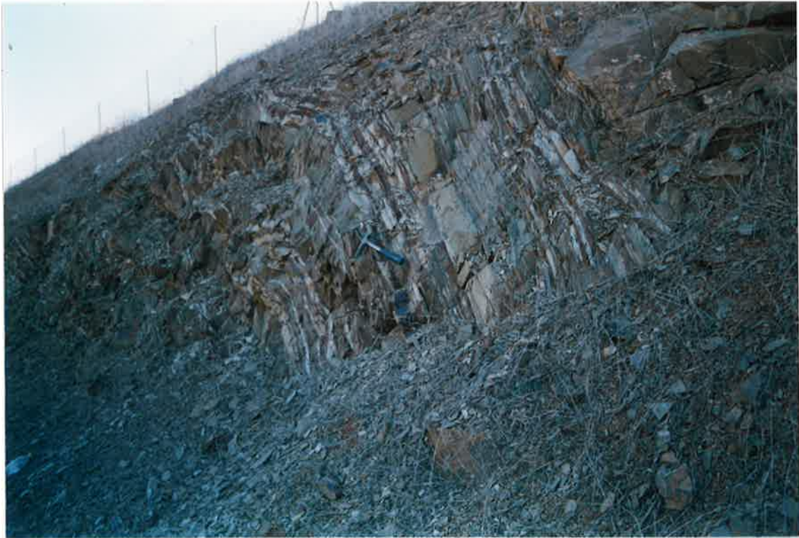
Foto 11. Techo de la Formación Pizarras Guindo, en la circunvalación de Valdepeñas (Flanco norte del Sinclinal de Madero-Boquilla-Marisanches).