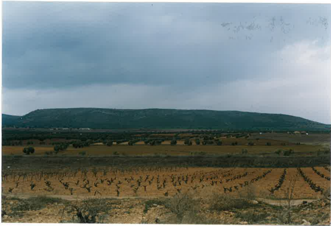
Foto 1. Panorámica de la C. Armoricana (Sierra Prieta) desde Casa de los Machos (centro-oeste de la Hoja).