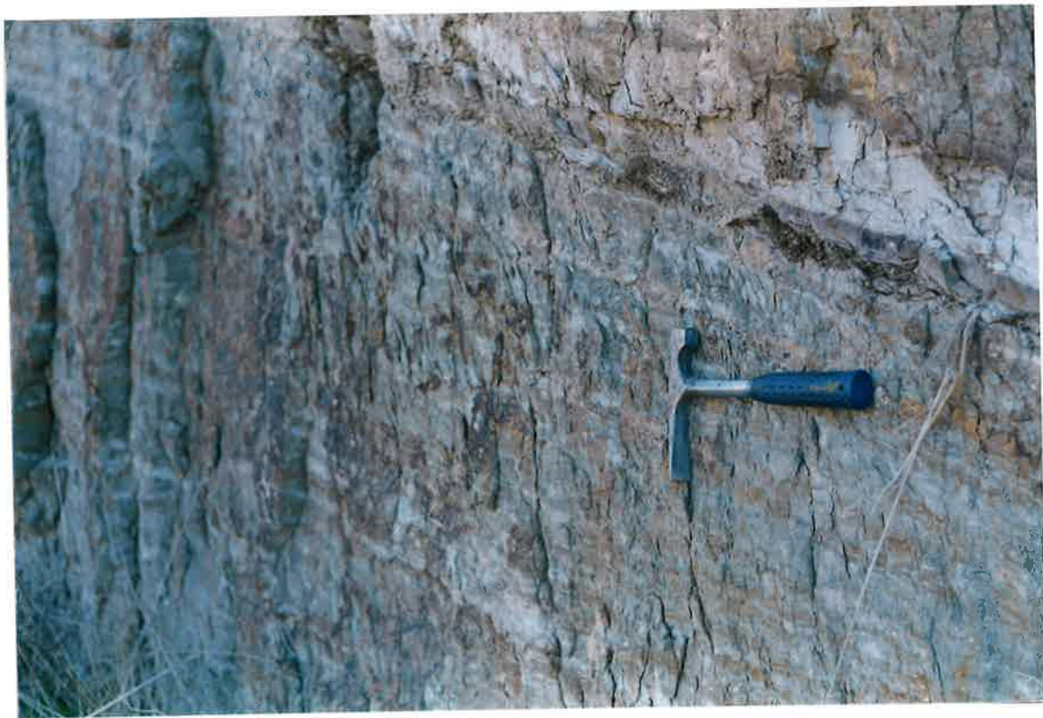
Foto 4. Formación Pizarras de Río, con bioturbación, 200 m. al norte del afloramiento anterior.