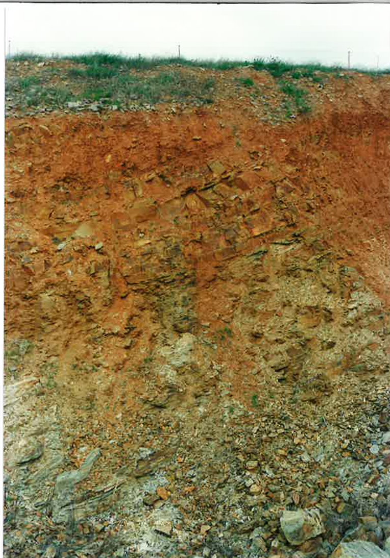
Foto 13. Tránsito entre la Formación de Pizarras Guindo y la Formación Cuarcitas Botella, en una cantera abandonada, próxima al Cerro Cabezas.