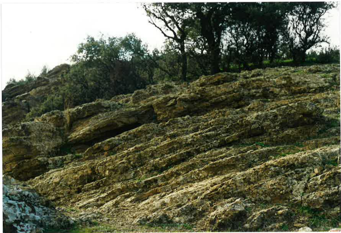
Foto 20. Formación de los Bancos Mixtos en el Sinforme de Cabezuela (Finca Cabezuela, SE de la Hoja).