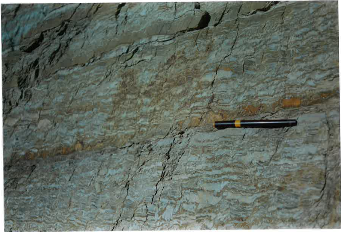
Foto 3. Formación Pizarras de Río en el mismo afloramiento anterior.