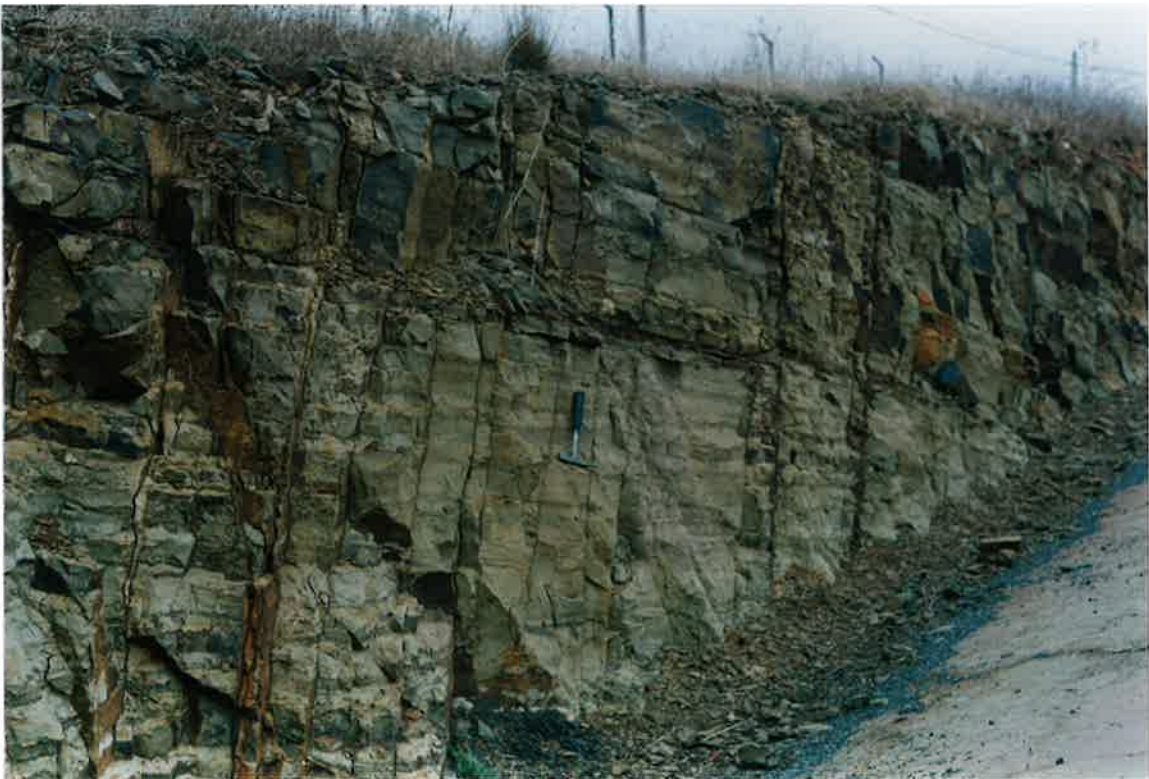
Foto 8. Formación Pizarras de Río, suavemente buzante, a la altura del km. 49 de la Ctera. de Valdepeñas a Moral de Calatrava.