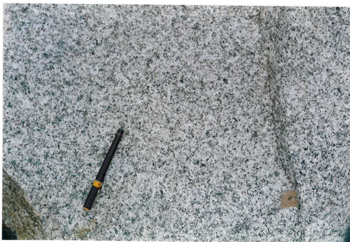
Foto 36. Mismo afloramiento anterior.