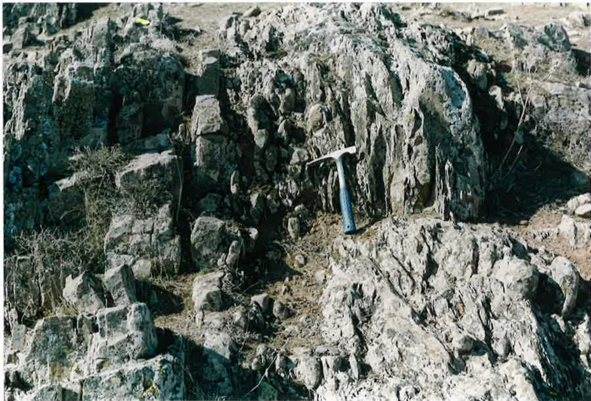
Foto 24. Capas desestructuradas y “bolos”, en otro punto próximo del afloramiento anterior.