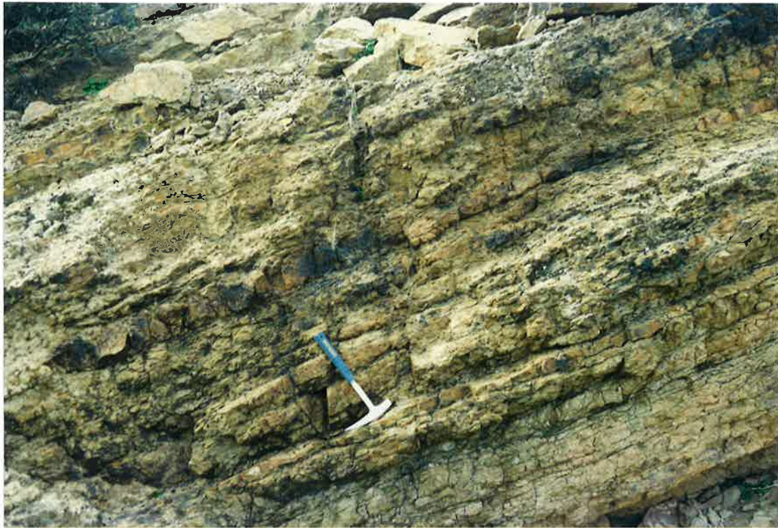
Foto 21. Mismo afloramiento anterior con mayor detalle.