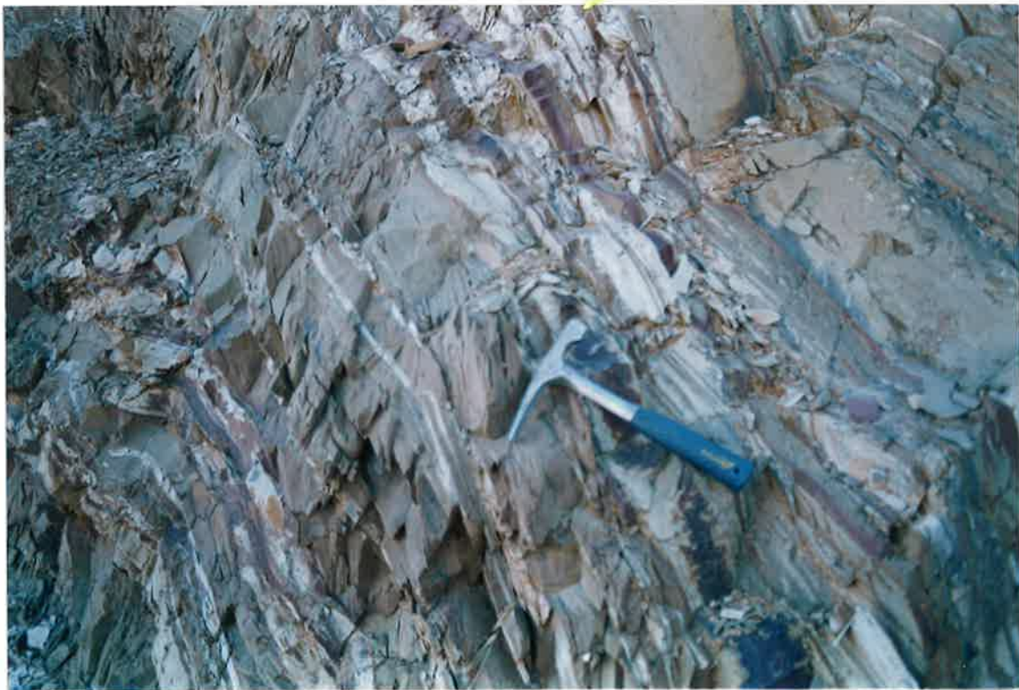
Foto 12. Mismo afloramiento anterior, con mayor detalle.