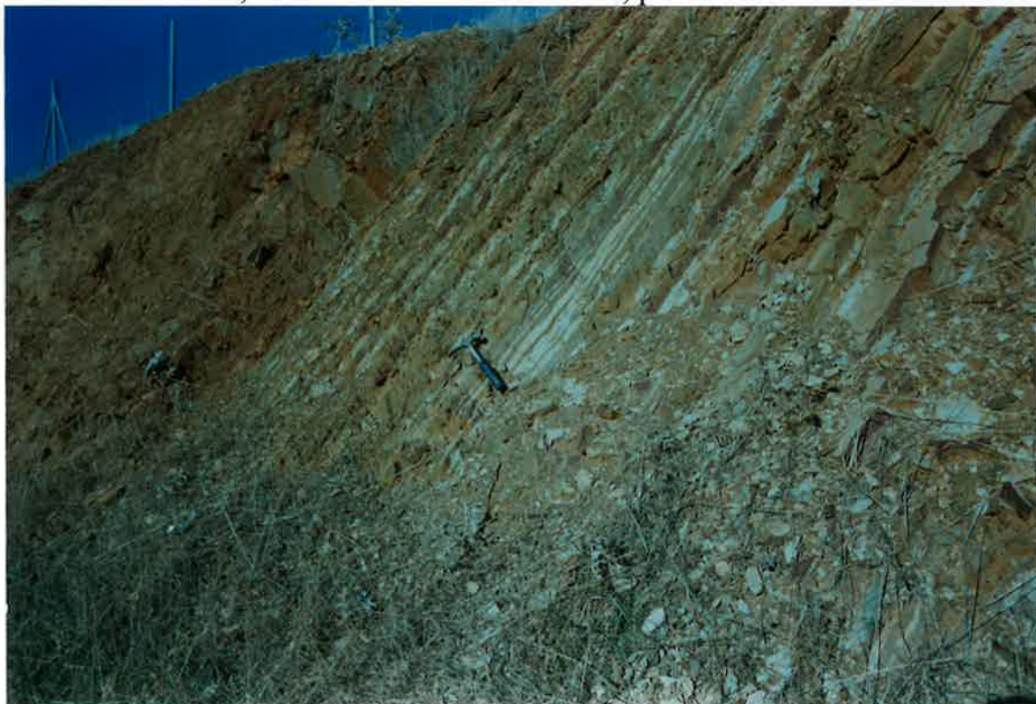
Foto 14. Tránsito entre la Formación de Pizarras Guindo y la Formación Cuarcitas Botella, en la circunvalación de Valdepeñas.