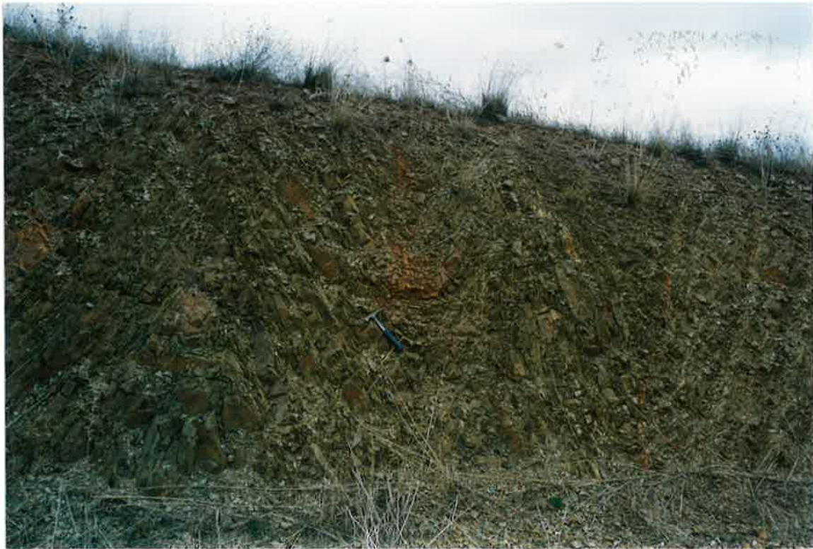
Foto 25. Pliegues de Fase 1 en los Bancos Mixtos, en el km. 18,5 de la Ctera. Valdepeñas-Cózar.