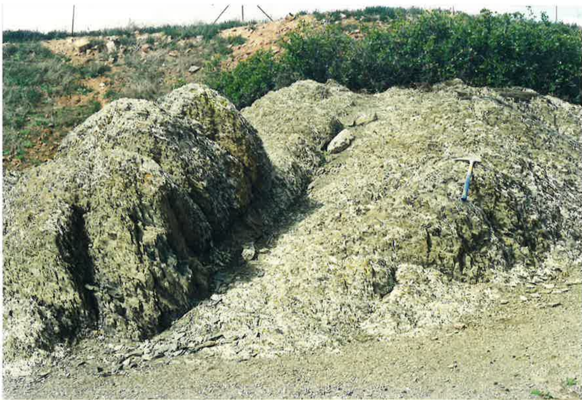
Foto 10. Mismo afloramiento anterior, con mayor detalle.