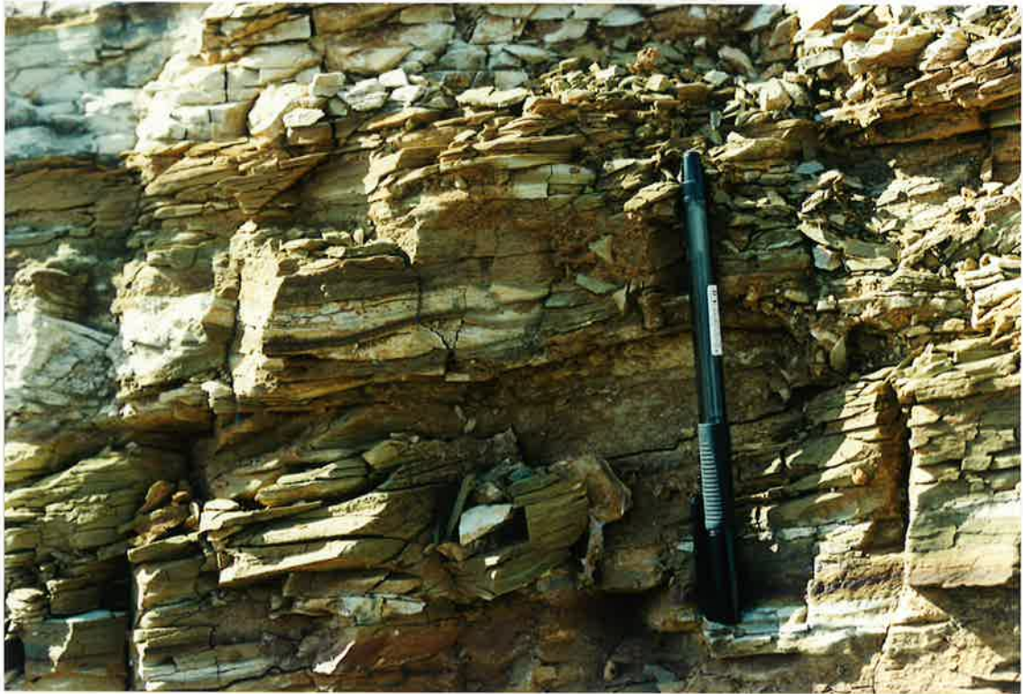
Foto 19. Estratificación “hummocky” de las Cuarcitas Botella, en el mismo afloramiento anterior.