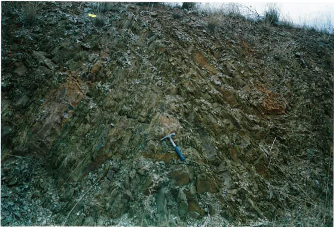
Foto 26. Anticlinal de Fase 1, con mayor detalle, en el mismo afloramiento anterior.