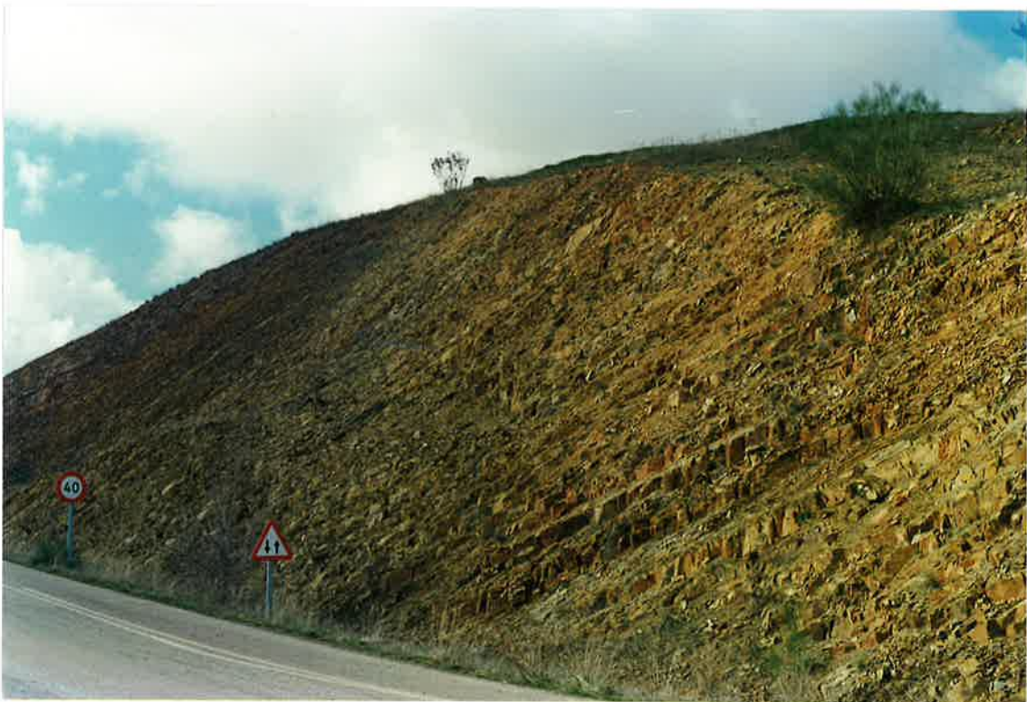
Foto 18. Cuarcitas Botella en el Flanco norte del Sinclinal de Madero-Boquilla-Marisanches, a la altura del km. 202,5 de la Nacional IV.