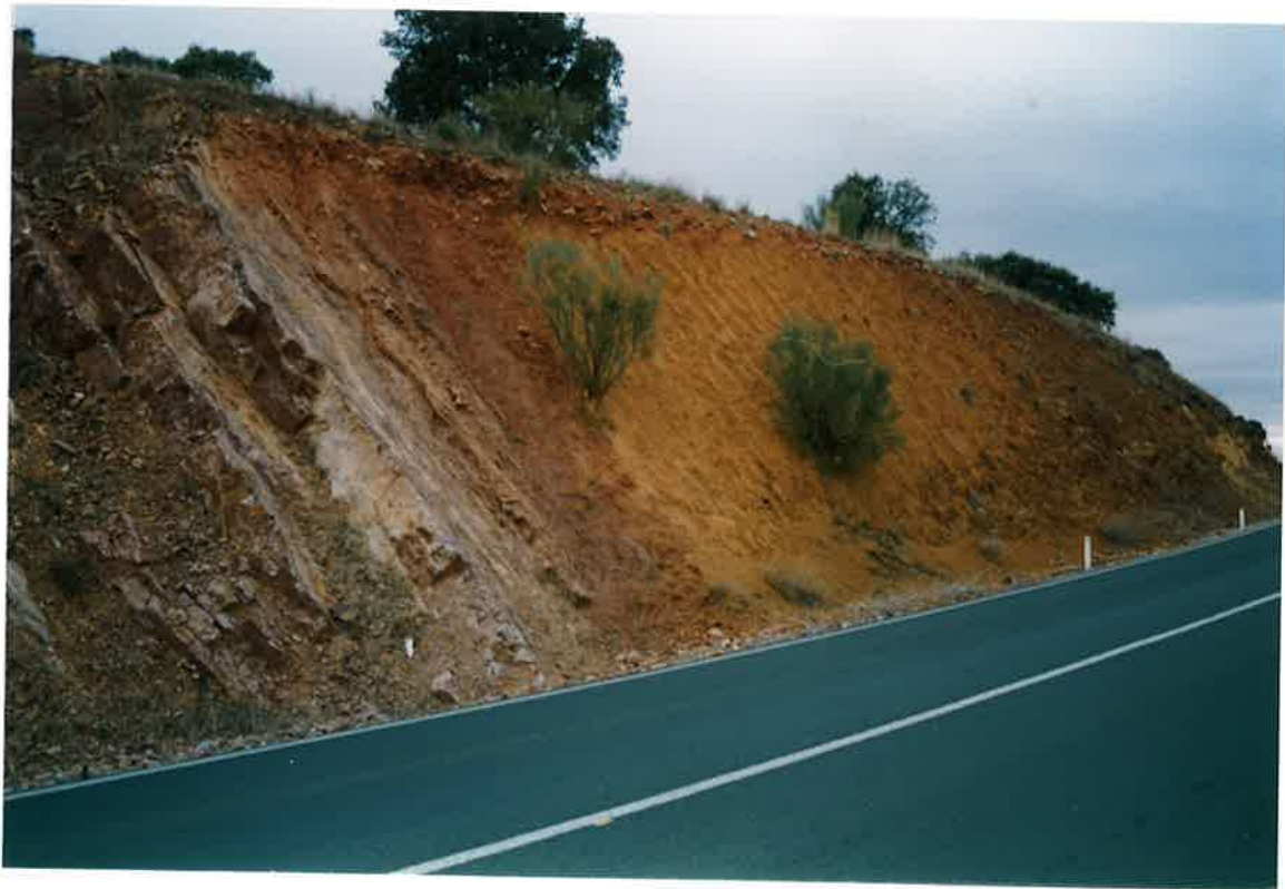
Foto 44. Contacto del dique de diabasa con los Bancos Mixtos en el mismo afloramiento anterior.