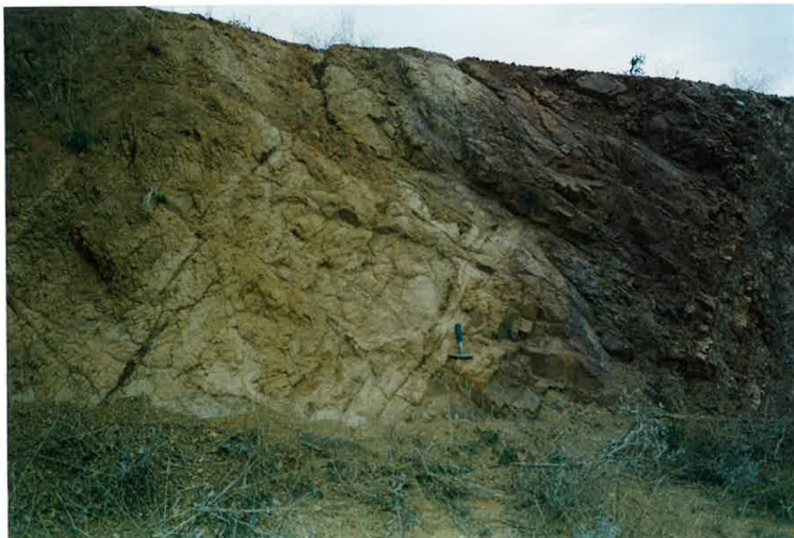
Foto 42. Dique de diabasa en el km. 18, 6 de la Ctera Valdepeñas-Cózar.