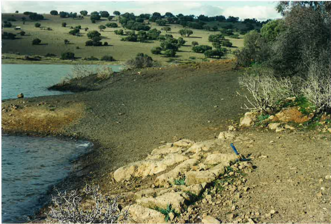
Foto 27. Contacto entre la Caliza de Urbana (con potencia decimétrica) y las Pizarras Chavera (a techo) en la Finca Cabezuela.