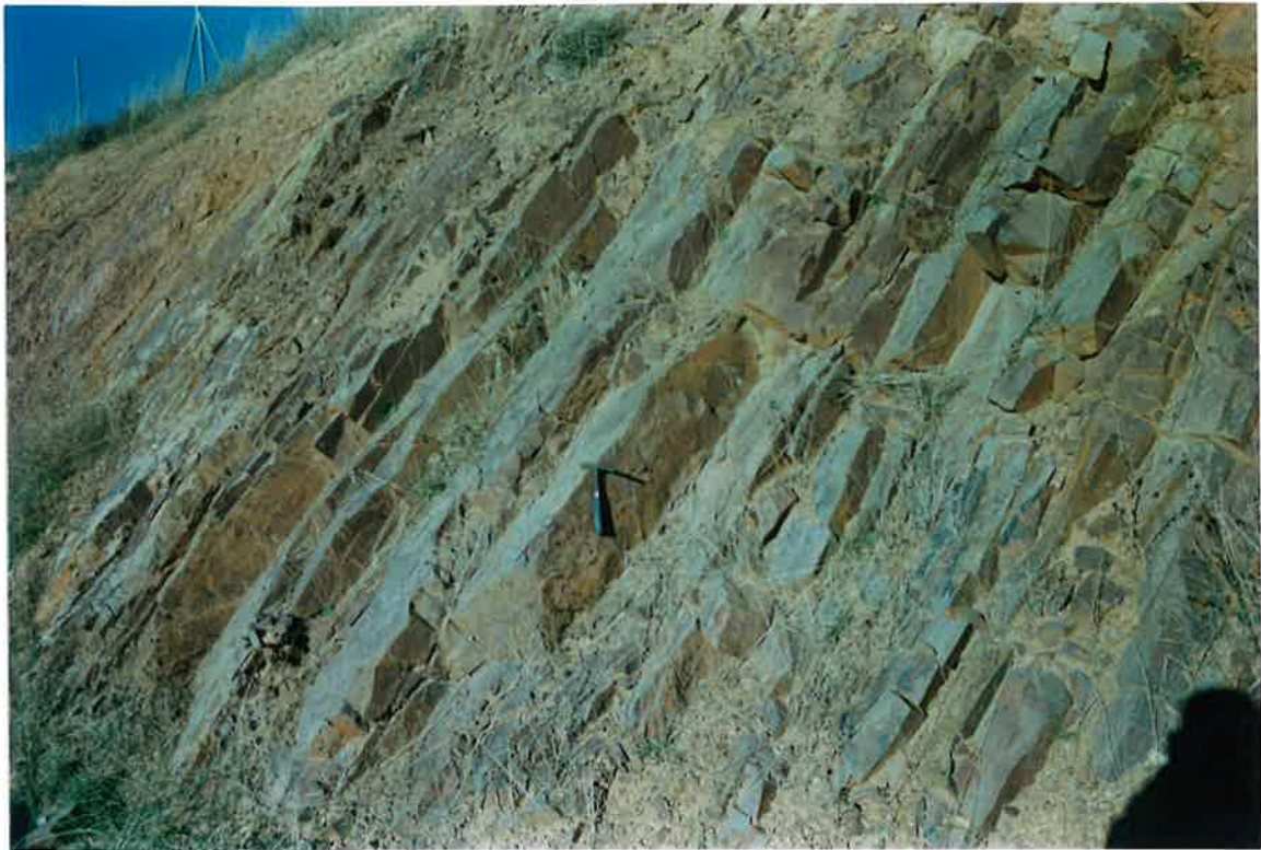
Foto 15. Aspecto de la Formación Cuarcitas Botella en la circunvalación de Valdepeñas (Flanco norte del Sinclinal de Madero-Boquilla-Marisanches).