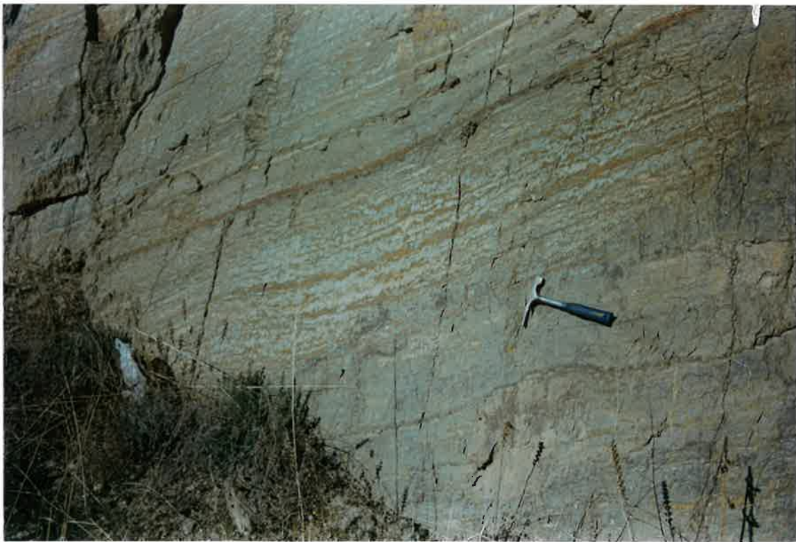
Foto 2. Formación Pizarras de Río, con bioturbación, en la Ctera. de circunvalación de Valdepeñas.