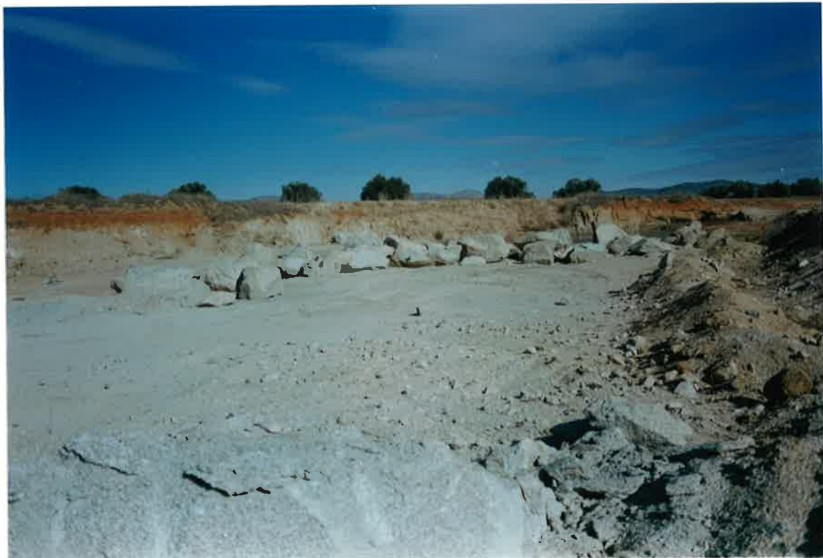
Foto 38. Plutón de Valdepeñas al norte de la Ctera 415 (Valdepeñas-Villanueva de los Infantes).