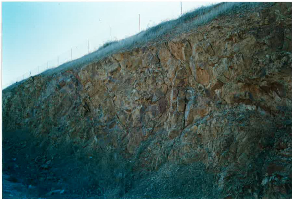
Foto 16. Pliegue de Fase 1 de las Cuarcitas Botella en el mismo aforamiento anterior.