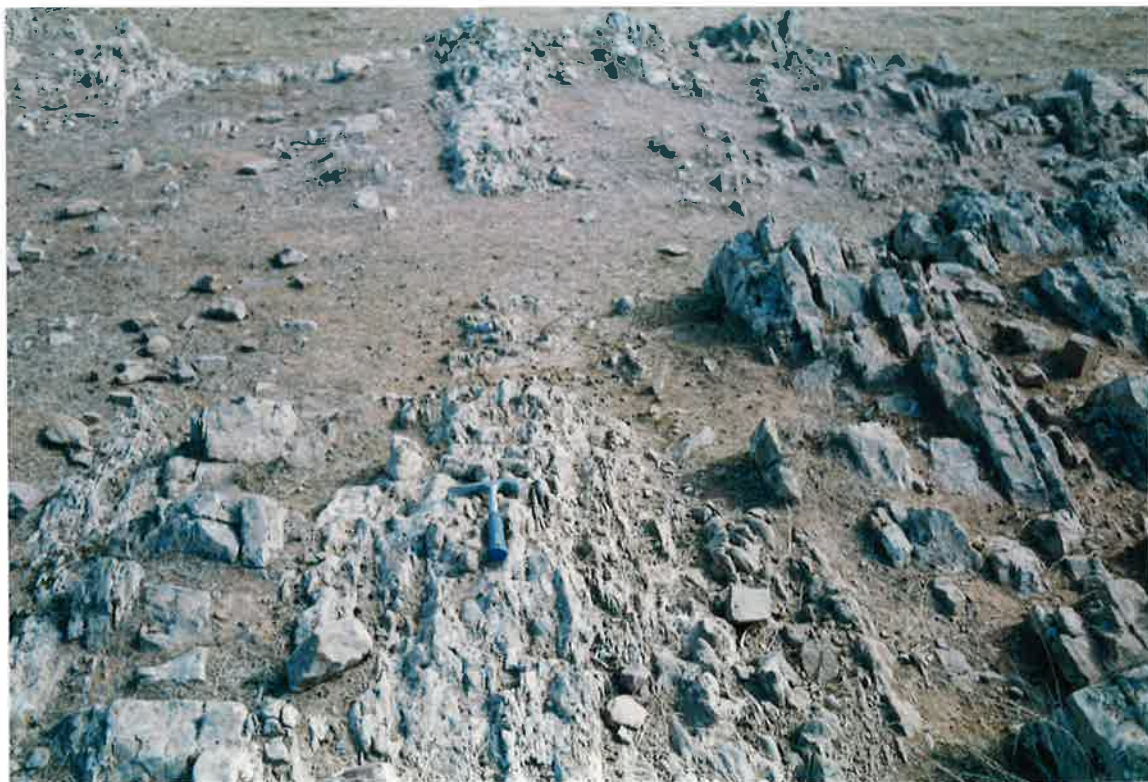
Foto 22. Formación de los Bancos Mixtos, con un tramo métrico de capas desestructuradas y "bolos", en el Sinclinal de Cerro del Águila-Cerro Mojón-La Jarilla (Finca La Jarilla, E de la Hoja).