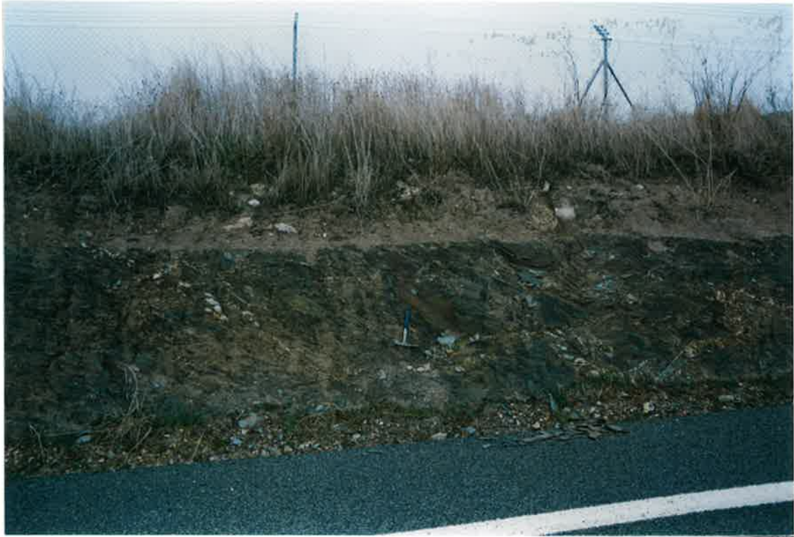
Foto 5. Formación Pizarras de Río, afectadas por la Fase 2, en El Peral, a la altura del km. 6,2 de la Ctera. de Valdepeñas a La Solana.