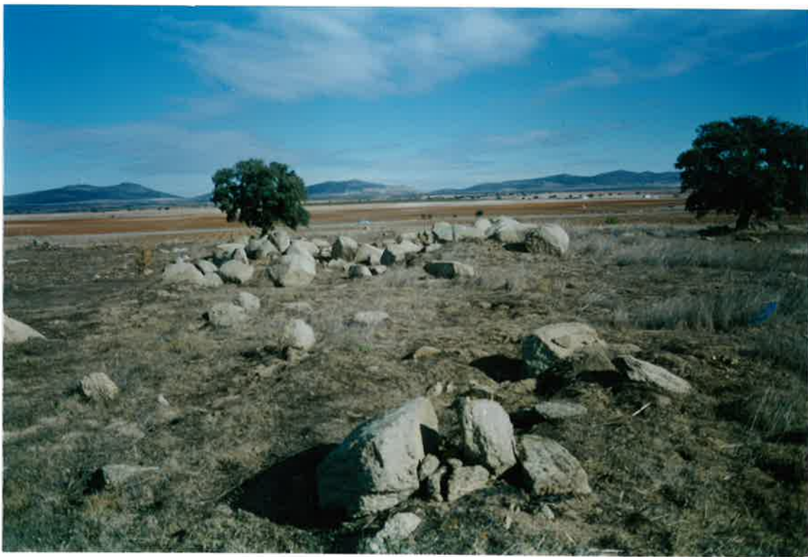
Foto 28. Panorámica del Plutón de Valdepeñas, al sur de la Ctera., en la Finca Casa del Marqués (km. 68,6 de la Ctera. 415 entre Valdepeñas y Villanueva de los Infantes).