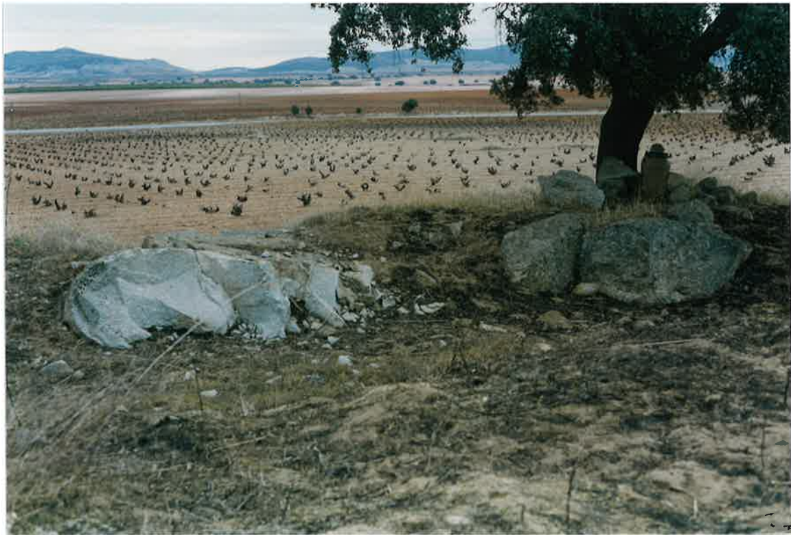
Foto 29. Monzogranidos biotíticos con cordierita y moscovita, porfídicos, (Plutón de Valdepeñas) en la Finca Casa del Marqués.