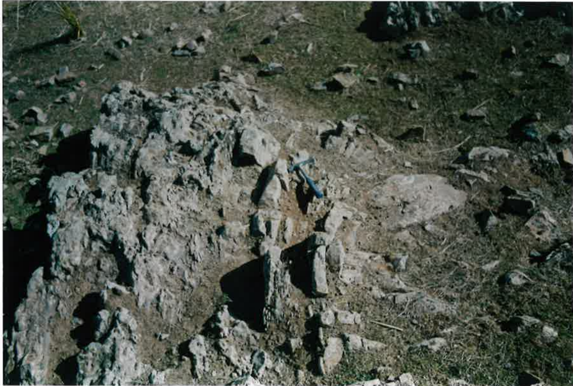
Foto 23. “Slump” de potencia métrica en los Bancos Mixtos (mismo afloramiento anterior).