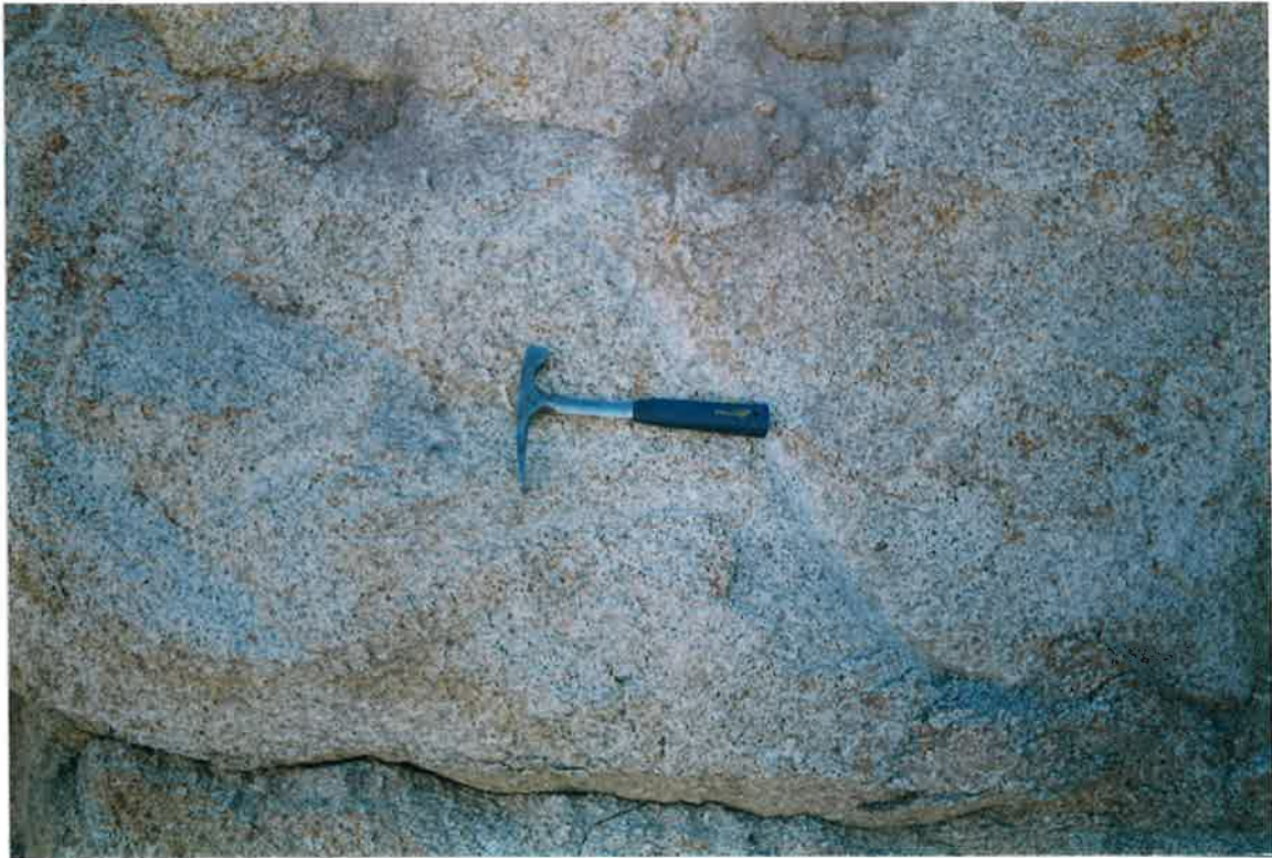
Foto 39. Monzogranitos biotíticos con cordierita y moscovita, porfídicos, en el mismo afloramiento anterior.