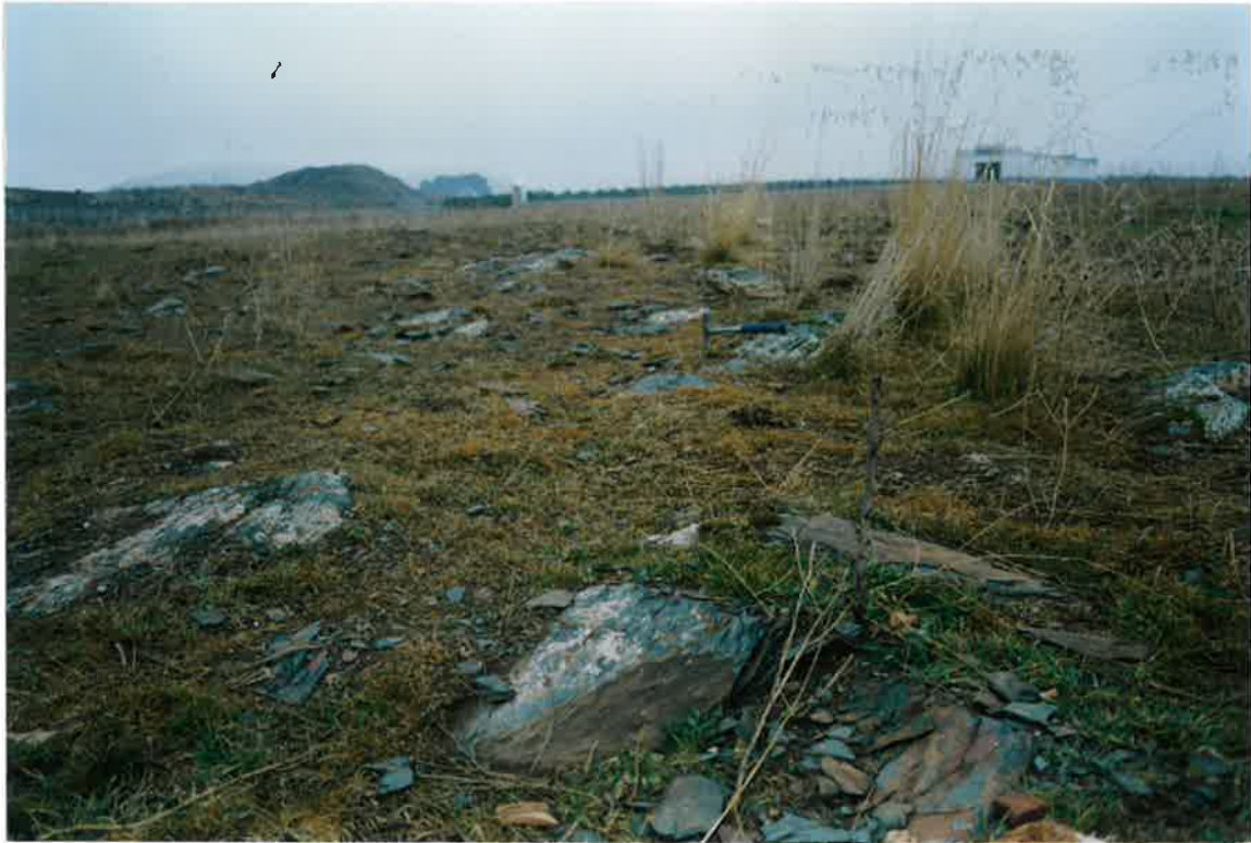
Foto 7. Afloramiento de la Formación Pizarras de Río, afectadas por la Fase 2, en el km. 3 de la Ctera. de Valdepeñas a S. Carlos del Valle.