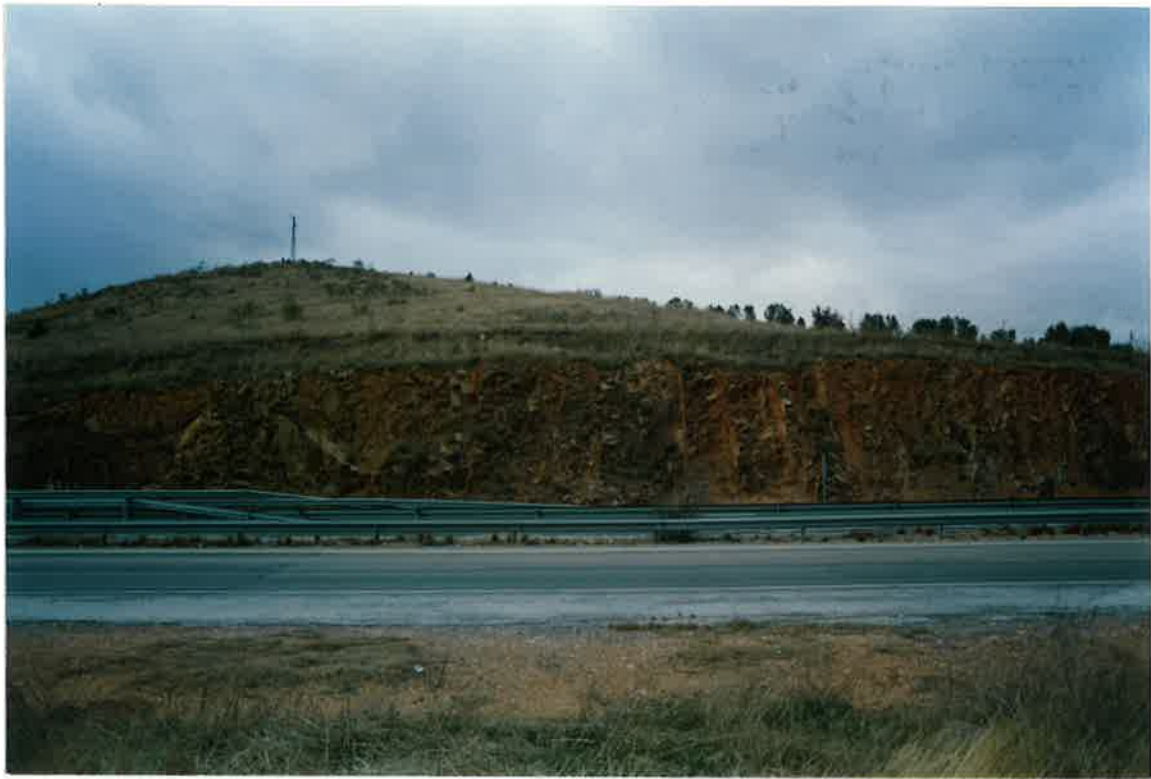
Foto 17. Formación de Cuarcitas Botella, en el Flanco sur del Sinclinal de Cerro Cabezas a la altura del km. 208 de la Nacional IV.