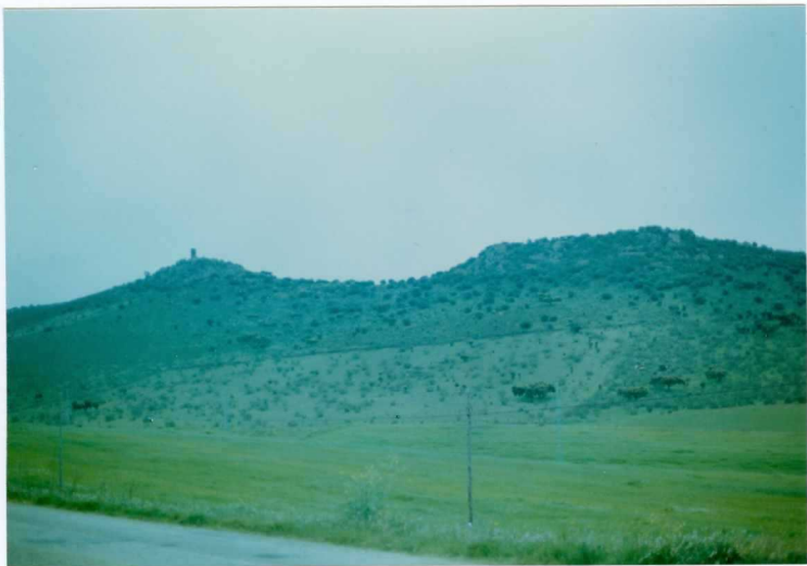
FOTO 14.- DOMINIO DE ARROYOMOLINOS. Resalte geomorfológico de los niveles de vol canitas ácidas intercaladas en la serie volcanosedimentaria del Cámbrico Medio. Cerro de San Amaro (Hoja de Alcauchel).