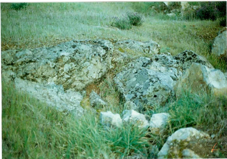
FOTO 28.- Afloramiento de gabros.