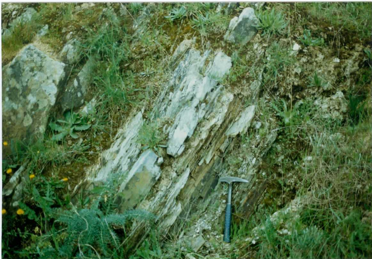
FOTO 13.- DOMINIO DE ARROYOMOLINOS. Niveles de tobas y lavas en la serie volcánica sedimentaria del Cámbrico Medio.