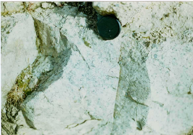
FOTO 30.- Detalle de un leucogranito biotítico con moscovita.