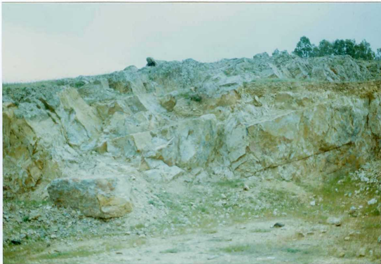
FOTO 18.- Niveles conglomeráticos intercalados en la sucesión volcánica del Carbonífero inferior.