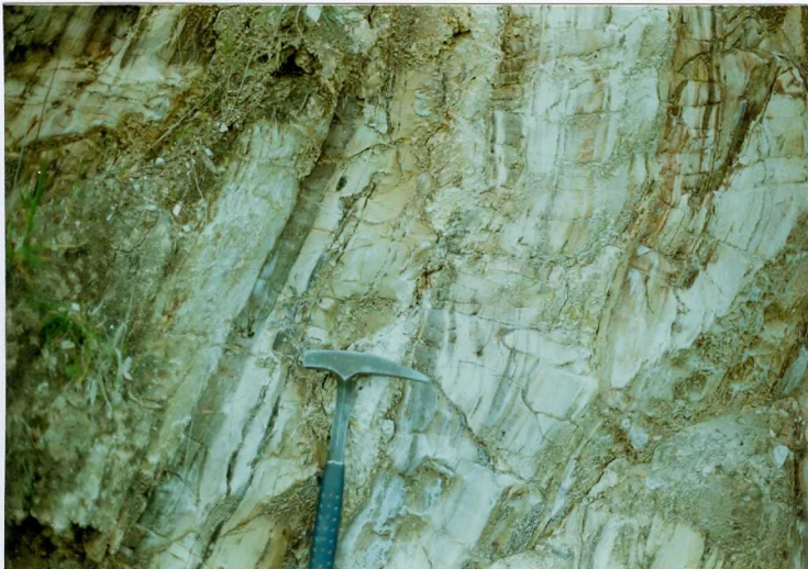
FOTO 12.- DOMINIO DE ARROYOMOLINOS. Detalle de la foto anterior. Niveles de tobas y lavas en la serie volcanosedimentaria del Cámbrico Medio.