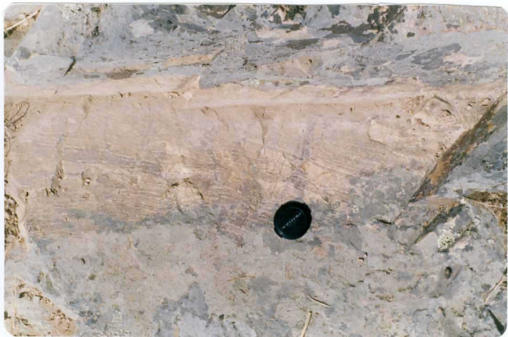
FOTO 22.- Riolitas fluidales en la sucesión volcánica del Carbonífero inferior.