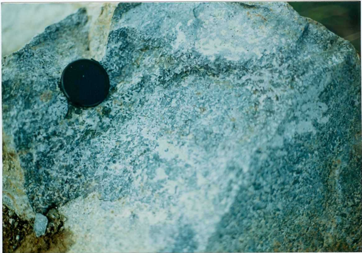
FOTO 29.- Detalle de los gabros.