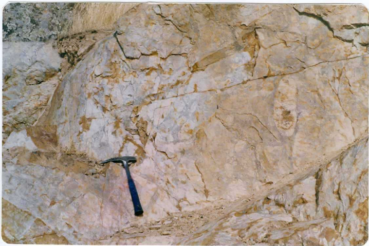
FOTO 19.- Aspecto de detalle de los conglomerados intercalados en la sucesión volcánica del Carbonífero inferior.