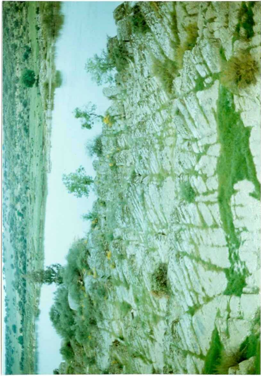
FOTO 10.- DOMINIO DE ARROYOMOLINOS. S de fractura y S_1 en las pizarras y grauwacas del Cámbrico Inferior.