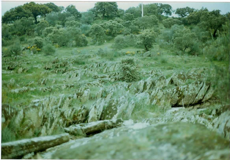
FOTO 9.- DOMINIO DE ARROYOMOLINOS. S_1 en las pizarras y grauvacas del Cámbrico Inferior.