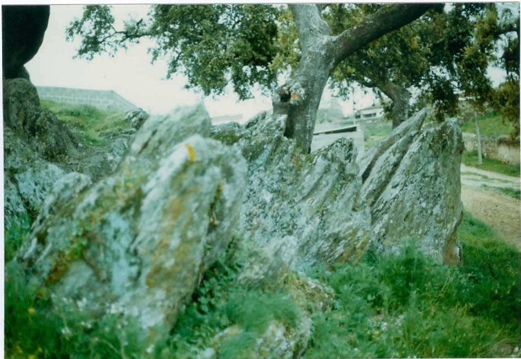
FOTO 15.- DOMINIO DE ARROYOMOLINOS. Afloramiento de esquistos y metarenitas con blastos de andalucita (Cámbrico Medio).