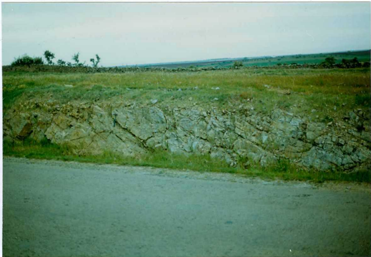
FOTO 3.- DOMINIO ZAFRA-MONESTERIO. Afloramiento de pizarras grises (Ovetiense).