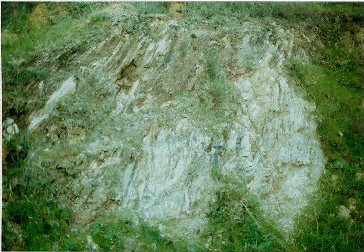
FOTO 11.- DOMINIO DE ARROYOMOLINOS. Aspecto de la serie volcanosedimentaria del Cámbrico Medio.