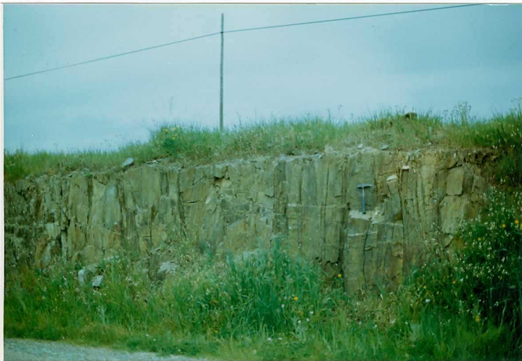
FOTO 2.- DOMINIO ZAFRA-MONESTERIO.- So en las pizarras y grauvacas del Proterozoico (Sucesión Tentudia).