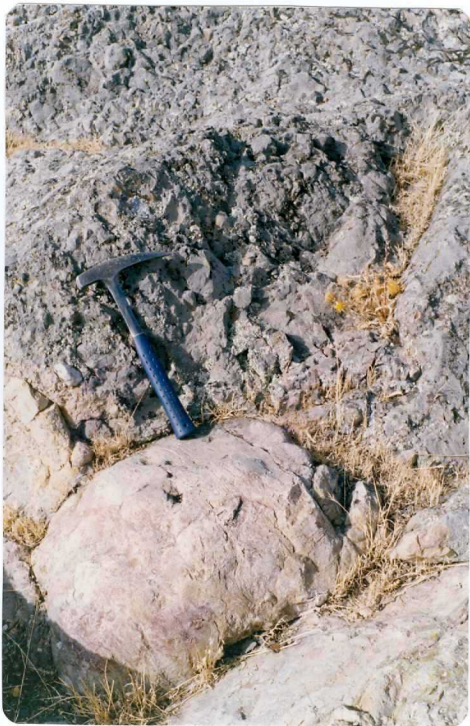
FOTO 20.- Ejemplo de un canto del conglomerado anterior.