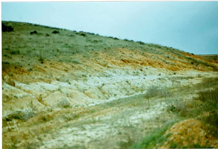
FOTO 24.- Arcillas, limos y arenas de la Facies Badajoz (Mioceno).