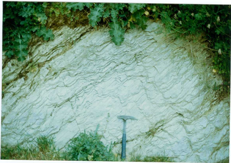
FOTO 16.- DOMINIO DE ARROYOMOLINOS. S_1 en los esquistos y metarenitas con blastos de andalucita (Cámbrico Medio).