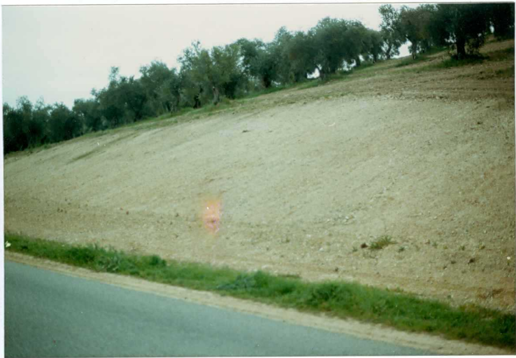
FOTO 23.- Facies Badajoz (Miocena). Aspecto que presentan los niveles basales: arcillas con cantos.