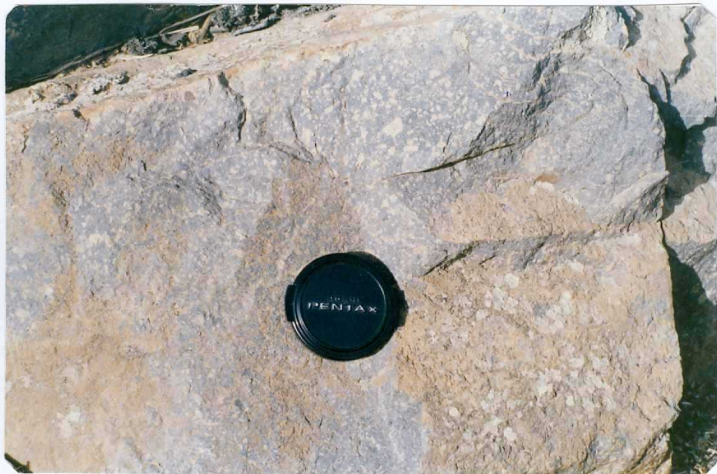
FOTO 21.- Tobs intermedias en la sucesión volcánica del Carbonífero inferior.