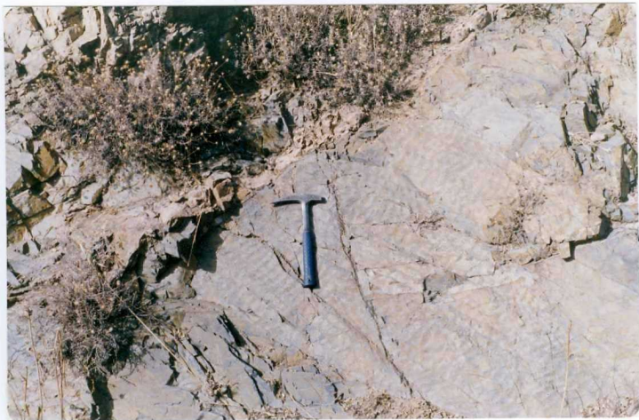
FOTO 5.- DOMINIO ZAFRA-MONESTERIO. Ripples en pizarras del Ovetiense, atravesadas por un dique decimétrico de volcanitas.