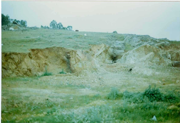
FOTO 17.- Rocas volcánicas ácidas con intercalaciones conglomeráticas (Carboní f ero inferior).