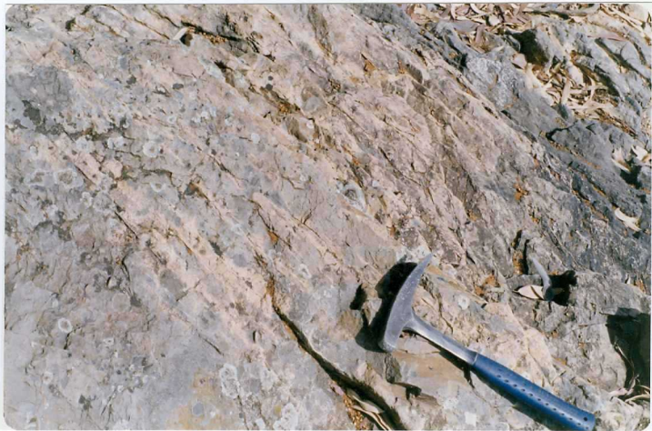
FOTO 6.- DOMINIO ZAFRA-MONESTERIO. Pizarras del Ovetiense atravesadas por una red de diques.