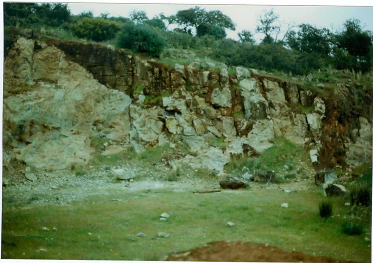
FOTO 7.- DOMINIO ZAFRA-MONESTERIO. Cantera para aprovechamiento de las calizas mar-móreas del Marianense. Obsérvese la So vertical.