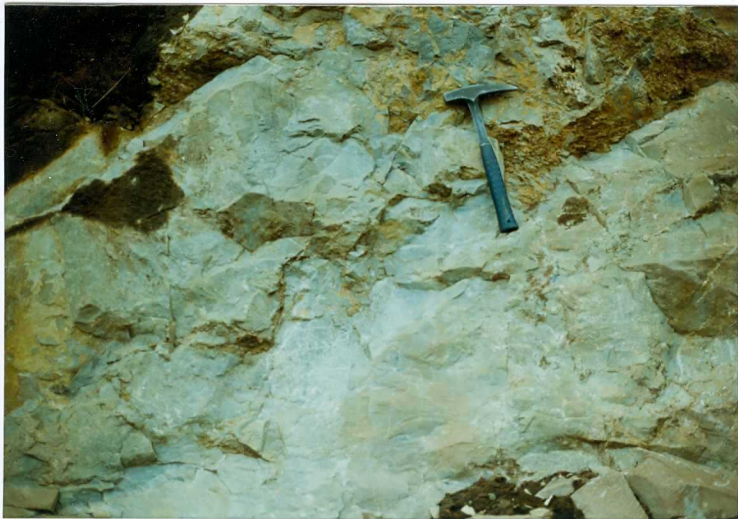
FOTO 8.- DOMINIO ZAFRA-MONESTERIO. Detalle de un banco de caliza marmórea de la foto anterior.