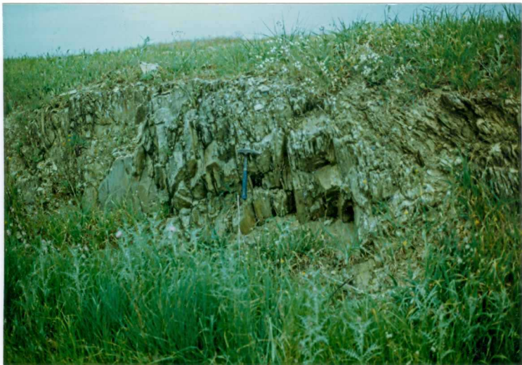
FOTO 1.- DOMINIO ZAFRA-MONESTERIO. Pizarras y grauwacas del Proterozoico (Sucesión Tentudia).