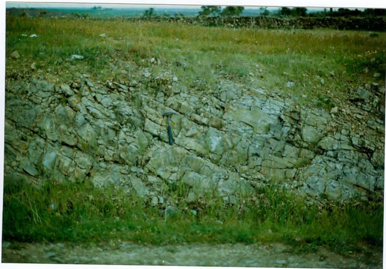
FOTO 4.- DOMINIO ZAFRA-MONESTERIO. Detalle de la foto anterior. So en las pizarras grises del Ovetiense.