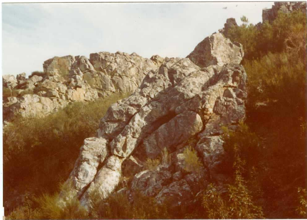
Foto nº 80.- Pliegue métrico en las cuarcitas del Arenigiense ( O_{12} ). Zona de Peña Encina.