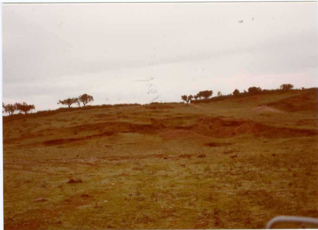
Foto n° 92.- Labores existentes en las calizas de Fontanar - (D 13-21 ).