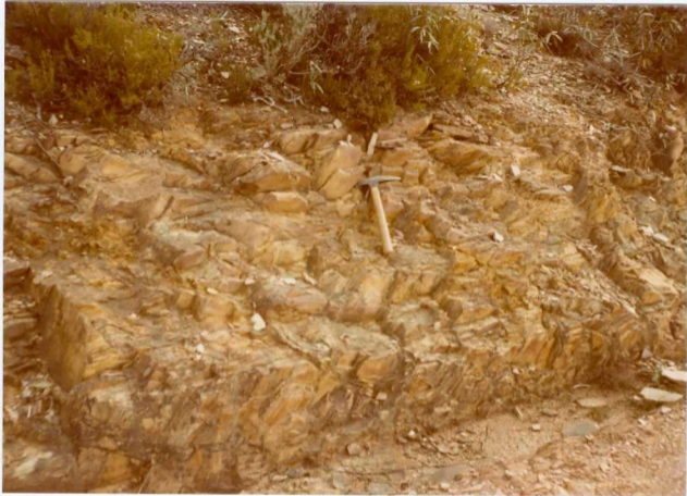
Foto n° 83.- Aspecto de las filitas Ordovícico-Silúricas -- (O 2 -S B ). Se observa claramente la esquistosidad (S 1 ) de la primera fase.