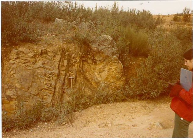
Foto nº 82.- Anticlinal cuyo flanco norte presenta ligero - "boudinage". Cuarcitas Silúrico-Devónicas ( S^B-D_{11} )