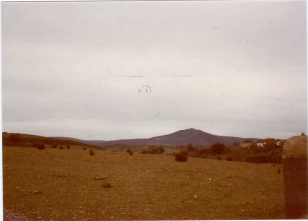
Foto nº 95.- Cerro de La Lamparona ( D_{12-13} ) desde la facies - Gévora ( D_{13-2} ).