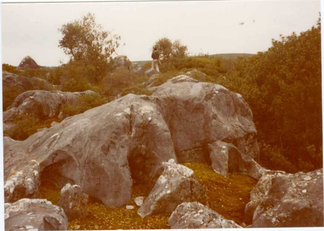
Foto nº 94.- Aspecto de un afloramiento de calizas del Cobleciense superior-Eifeliense ( D_{13-21} ), con efectos de disolución.