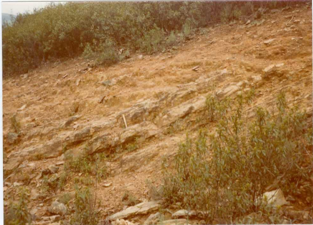
Foto nº 90.- Alternancia de cuarcitas y filitas del Siegeniense-Emsiense ( D_{12-13} ), en la ladera S. de la Sierra de La Calera.