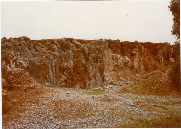
Foto nº 93.- Vista parcial de la cantera principal de Fontanar.