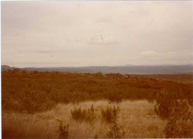
Foto n° 85.- Barra de cuarcitas Silúrico-Devónico ( S^B-D_{11} ).