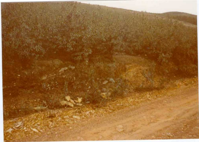
Foto nº 88.- Filitas del Siegeniense ( D_{12} ) en la ladera N. de la Sierra de La Calera.