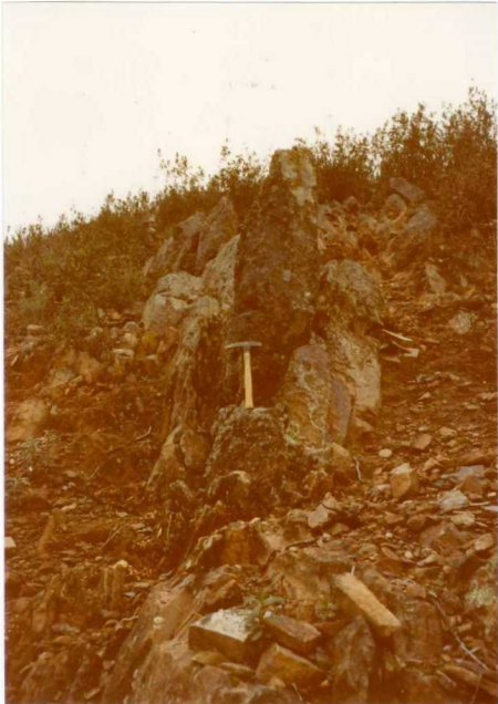
Foto nº 91.- Conglomerado de cantos de cuarcita, que indica el límite Siegeniense-Emsiense ( D_{12-13} ), con las filitas del Gévora ( D_{13-2} ).