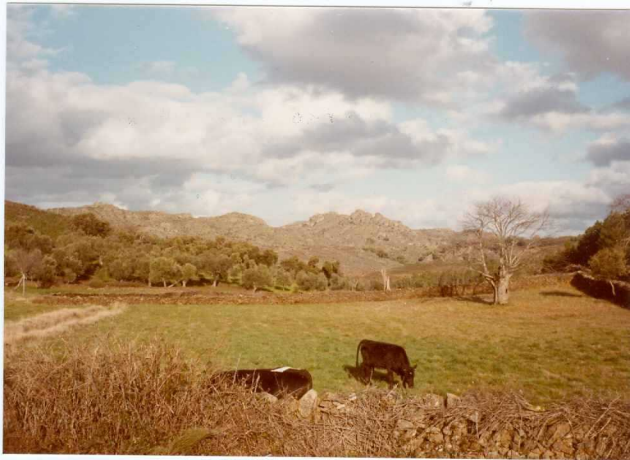
Foto nº 86.- Aspecto del afloramiento granítico.