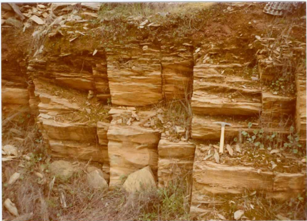
Foto nº 96.- Filitas del Gévora (D 13-2 ). Se observa claramente la (S 1 ) y una serie de diaclasas transversales -- (cross-joint).