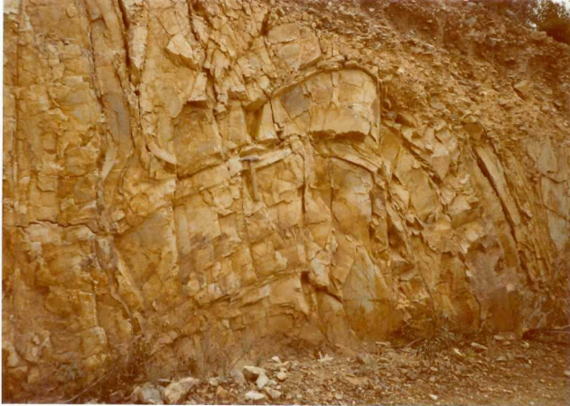
Foto nº 81.- Pliegues de tipo intermedio en las cuarcitas Silúrico-Devónicas ( S^B-D_{11} ).