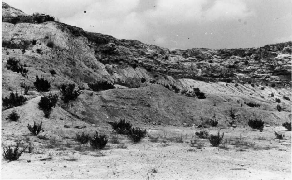
2003.- Corte de Burjasot. Aspecto general del Mioceno. En la base, nivel de arcillas rojas.