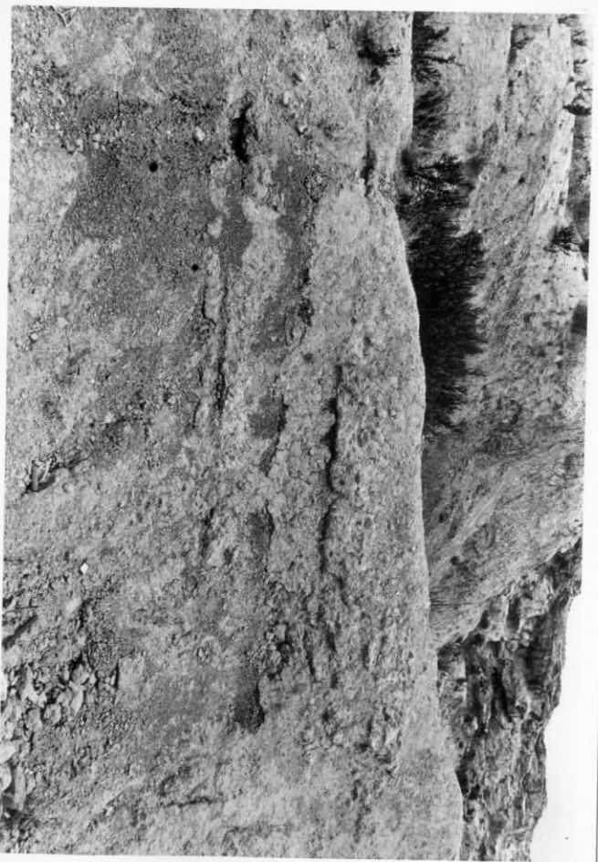
2003.- Corte de Burjasot. Detalle de las arcillas rojas.