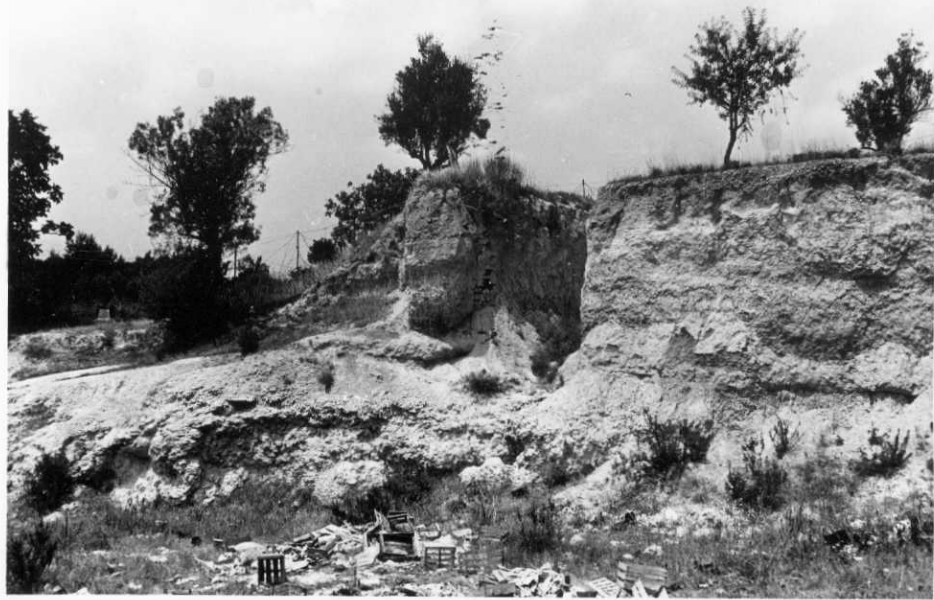
2001.- Corte de Burjasot. Micrita arcillosa basal, de aspecto modulado.