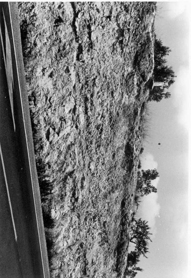
2023.- Corte de Paterna. Calizas recriticalizadas superiores (Carretera a Liria).