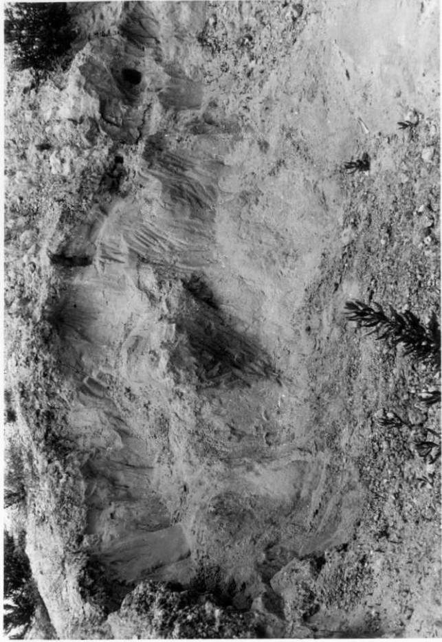
2004.- Corte de Burjasot. Nivel de areniscas arcóscas amarillas.