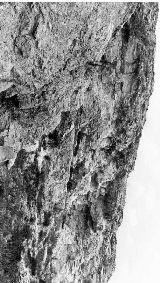
2008.- Corte de Burjasot. Pelmicrita recrystalizada, parcialmente dolomitizada.