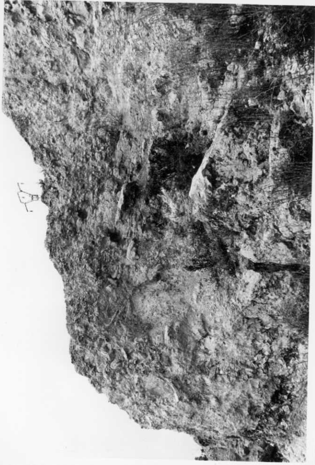
2007.- Corte de Burjasot. Intrabiomicrita con pellets, de aspecto noduloso.