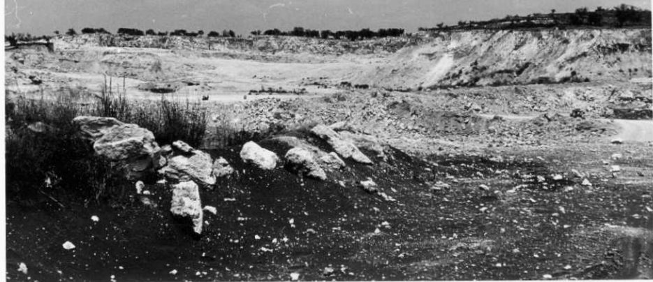
2009.- Corte de Burjasot. Micrita arcillosa en la cantera. (Carretera a Liria).