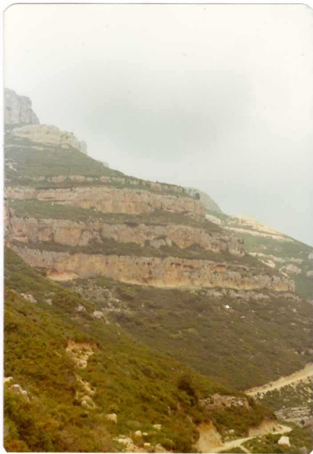
FOTO 492 . - Impresionante panorámica tomada desde el camino= que vá a la Fuente del Enebro, en el Suroeste de la Hoja. Los niveles calcáreos de la parte infe= rior y el tramo detrítico pertenecen al Kimmerid= giense Medio; el primer resalte lo forman cali= zas con Orbitolinas del Albiense Superior y los= resaltes constituyen la formación dolomítica del Cretácico Superior.