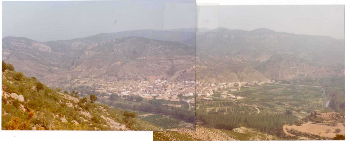
FOTO 477 . - Panorámica general de las alineaciones montañosas de Gestalgar. En primer plano, valle aluvial del Turia. El pueblo se asienta sobre Keuper. Los == montes al NO del pueblo son Jurásicos, mientras que las alturas del NE == pertenecen al Cretácico (La Lobera). El fondo montañoso pertenece a la == alineación de Serretilla con edad Kimmeridgiense Medio.