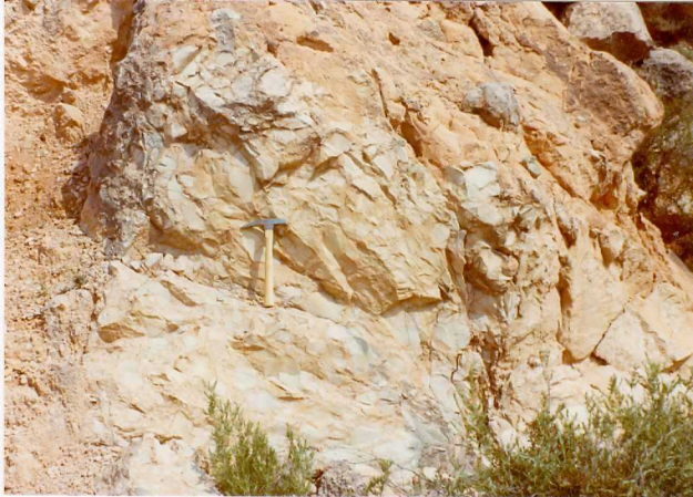
FOTO 476. .- Detalle de los conglomerados miocénicos.