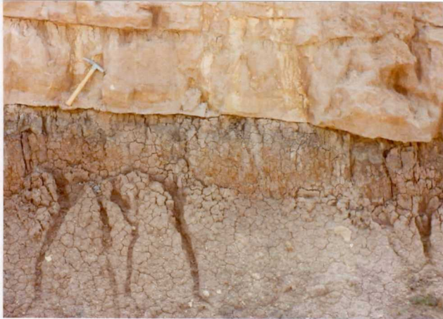
FOTO 486 . - Margas y calizas Terciarias al Norte de Pedralba.