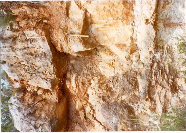
FOTO 487. - Calizas miocénicas lacustres.