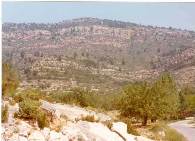
FOTO 483 .- Panorámica de la alineación de Serretilla (NE de Gestalgar). La primera elevación es de calizas = Aptienses, el resto es Albiense-Cenomaniense. La carretera se apoya en Kimmeridgiense detrítico.