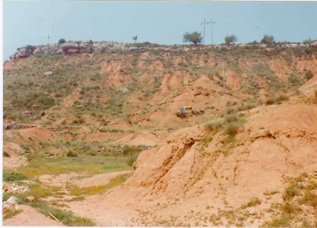
FOTO 485. - Formación Roja de Pedralba.