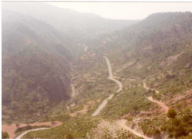
FOTO 478. - Panorámica de una parte del Eje de Bugarra. Al = Oeste de la foto se tiene el contacto de una barra Muschelkalk con el Keuper. La ladera del Este está ocupada por Keuper. La carretera conduce de Liria a Gestalgar.