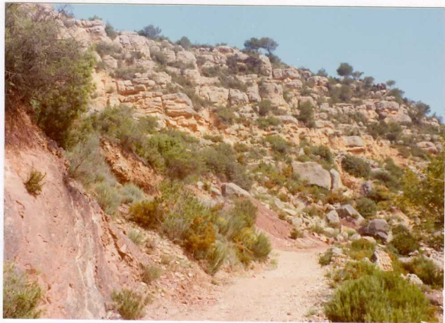
FOTO 475 .- Conglomerados miocénicos. En primer plano areniscas rojas del Keuper.