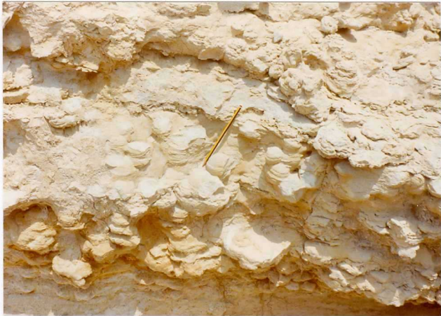
FOTO 482. - Módulos areniscosos sobre una cantera de arenas= Albienses.