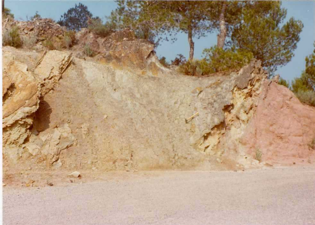
FOTO 474 . - Detalle del contacto entre areniscas y arcillas= con yeso del Keuper.