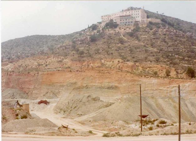
FOTO 481 .- Explotación de arenas Albienses en Benaguacil == (Ermita de Montiel).