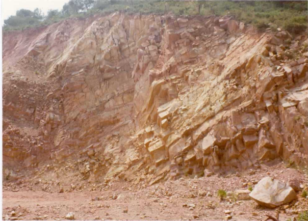
FOTO 479 . - Explotación de areniscas Buntsandstein en la Sie rra de Rodana.