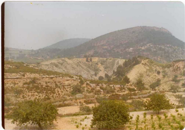
FOTO 490. - El Trías del ámbito Suroeste de la Hoja. Al fondo se observa una barra rígida de las dolomías = negras del Muschelkalk envuelta en las facies == abigarradas del Keuper.