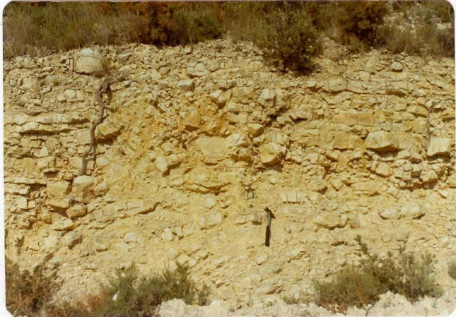
FOTO 489 .- Aspecto típico del tramo de margocalizas con braquiópodos del Toarciense. Foto tomada a la altura del kilómetro 3 de la carretera que comunica a Ribarroja del Turia con la Nacional III.