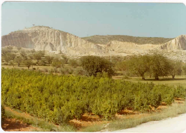
FOTO 488 . - Frente de cantera abierto en las calizas del = = Dogger, cerca de la carretera que vá desde Riba- rroja del Turia a Loriguilla y a la carretera na- cional III.