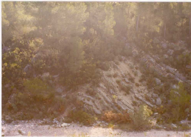
FOTO 484. .- Detalle de un pliegue suave en calizas del Dogger.