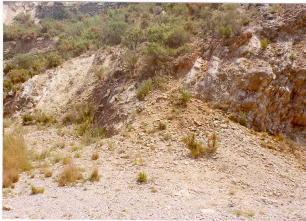
FOTO 480 .- Alternancia de calizas dolomitizadas y margas fosilíferas dentro de una barra de Muschelkalk al Este de Bugarra.