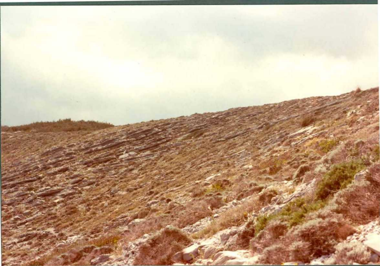
FOTO 13.- Tramo 12 de la sección del Cretácico inferior de Cala Mesquida