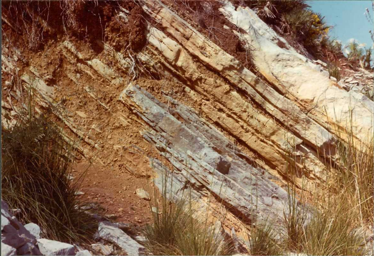
FOTO 8.- Tramo 18 de la sección Cutri II. Calizas tableadas con niveles de sílex