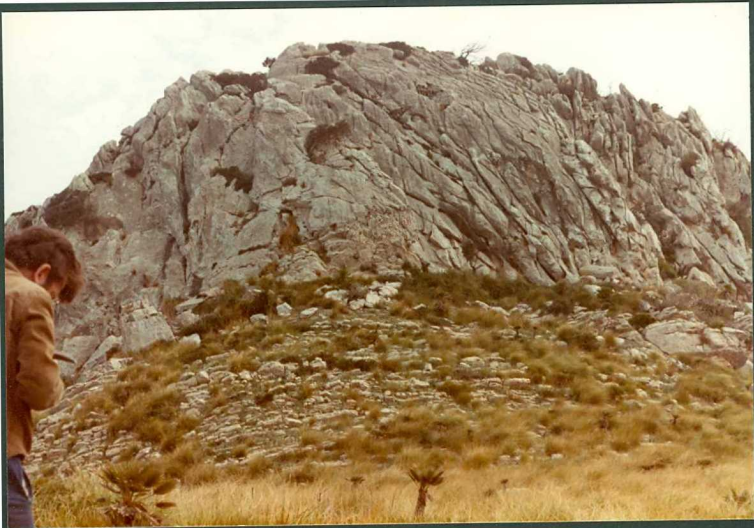
FOTO 3.- Calcarenitas oolíticas del Puig Cutri sobre micritas con sílex. Techo - de la sección Cutri I