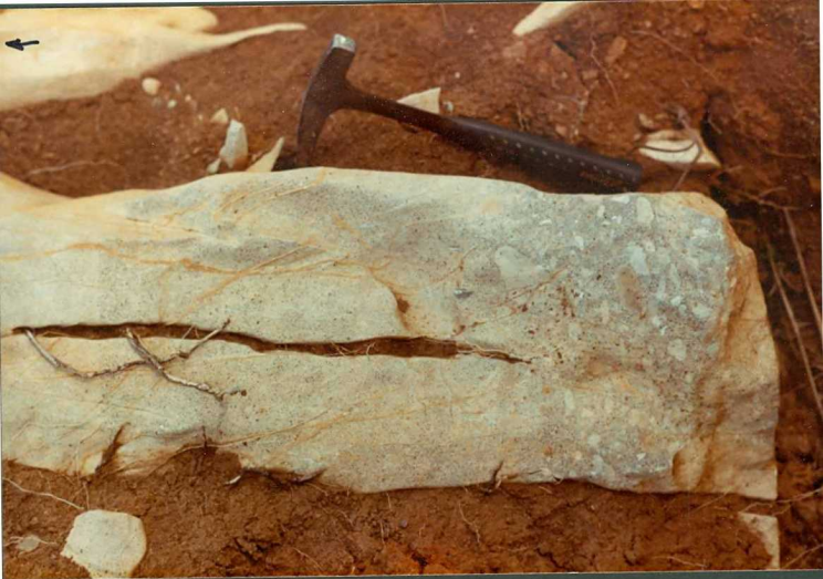
FOTO 7.- Turbiditas del Dogger. Tramo 10 de la sección Cutri II