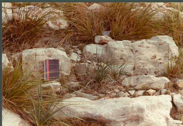
FOTO 2.- Micritas con sílex del Dogger. Tramo 17 de la sección Cutri I