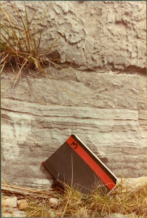
Lías medio dolomitizado. Laminación estromatolítica, a techo de secuencias intermareales. Sección Cutri I.