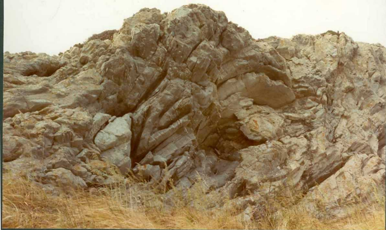
FOTO 12.- Cretácico inferior con slumps en la sección de Cala Mesquida. Tramo 11