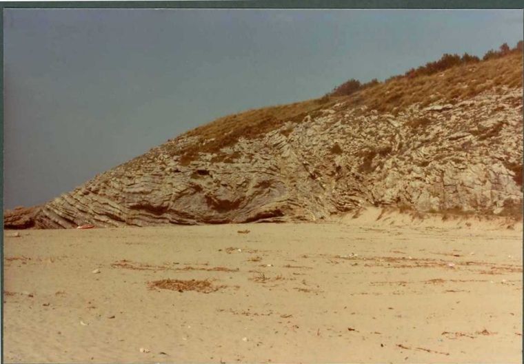
FOTO 11.- Cretácico inferior con slumps en Cala Mitjana