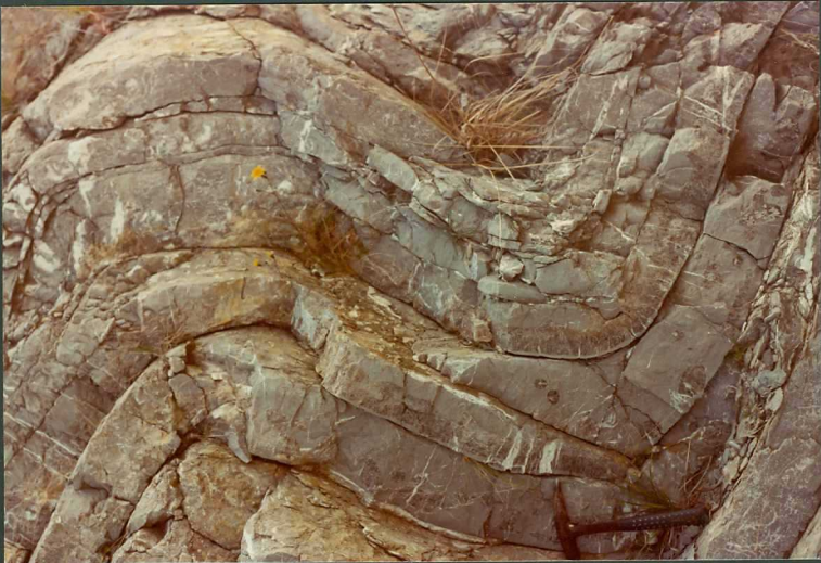
FOTO 9.- Calizas con sílex del Jurásico superior. Pliegues concéntricos con cuñas tectónicas en las charnelas. Carretera de Artá a Cala Mitjana.