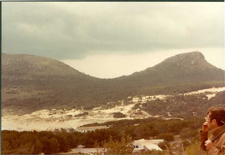
FOTO 14.- Arenas eólicas de Cala Mesquida. Al fondo Lias cabalgando al Cretácico inferior