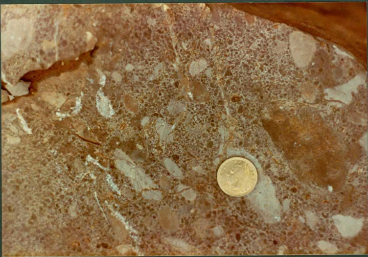
FOTO 5.- Conglomerados poligénicos de caliza. Base de las barras oolíticas de la sección Cutri II