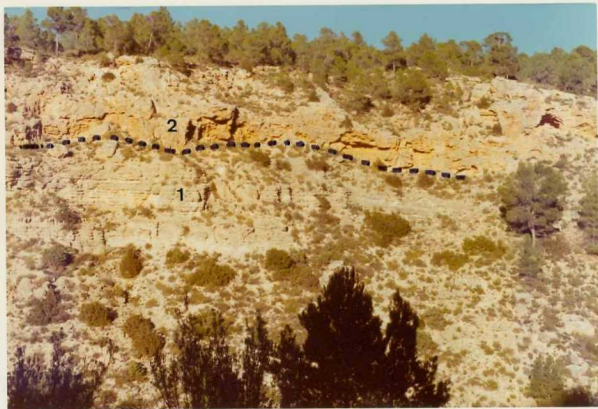
25-26/TH/0D/307.- Travertinos pliocuaternarios (tramo 2) discordantes sobre el Oxfordiense (tramo 1).