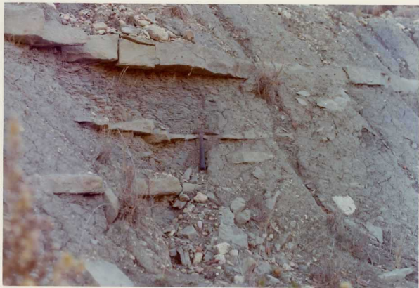
25-26/TH/0D/309.- Detalle de las arcillas grises con intercalaciones calcáreas del Kimme r ridgiense Inferior.