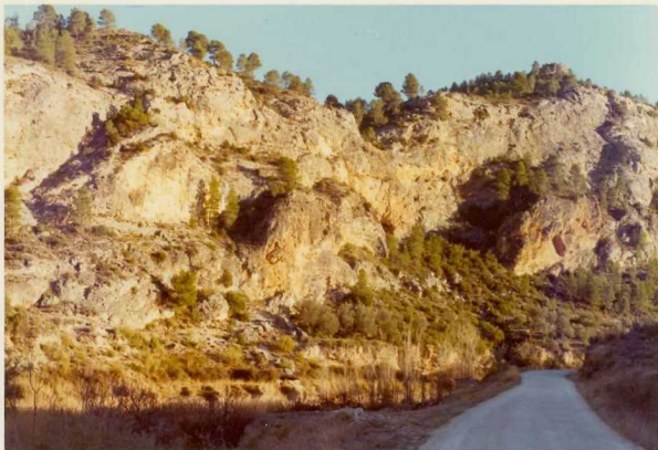
25-26/TH/0D/318.- Travertinos del Pliocuaternario, de gran potencia, situados al N de Enguñdanos.