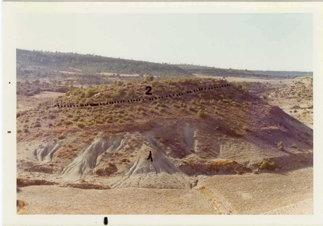
25-26/TH/OD/313.- Cenomaniense del Sur de Paracuellos. Tramo 1: arcillas verdes; tramo 2: dolomías.