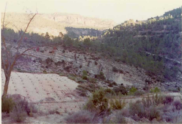
25-26/TH/OD/308.- Aspecto del Oxfordiense en el barranco del río Cabriel.