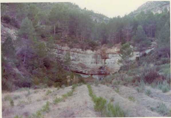
25-26/TH/0D/310.- Calizas fosilíferas del Barremien- se-Aptiense.