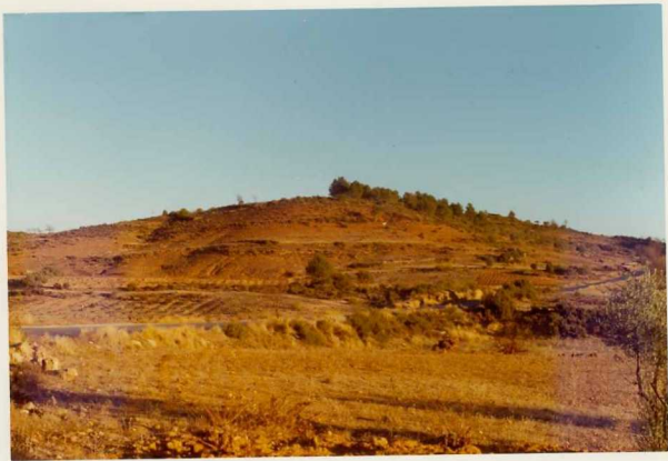
25-26/TH/OD/316.- Aspecto general del Terciario (Vindoboniense).