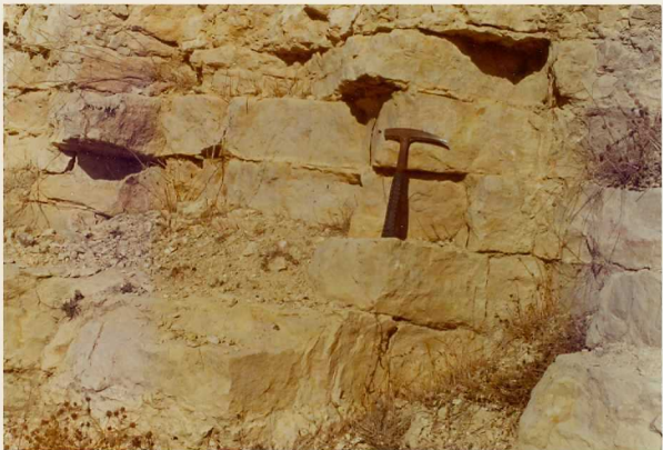
25-26/TH/OD/315.- Detalle de las dolomías amarillentas tableadas del Cenomaniense.