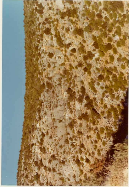
25-26/TH/0D/303.- Dolomías del tramo alto del Dogger.