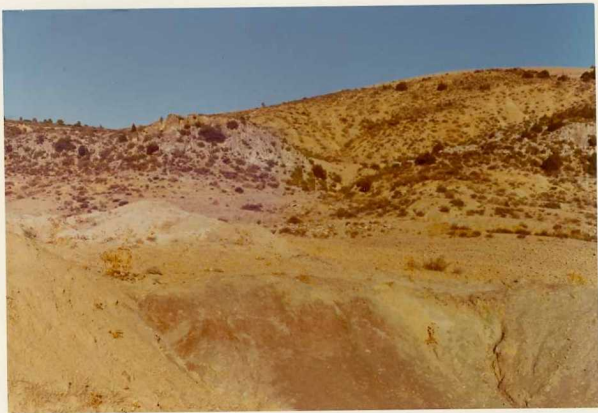
25-26/TH/0D/302.- Keuper con niveles areniscosos en el núcleo del anticlinal de Yémeda.