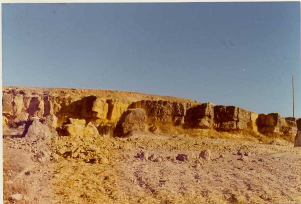
25-26/TH/00/311.- Aspecto de las calcarenitas con Ostreidos del Cenomaniense Inferior, al N de Cardenete.