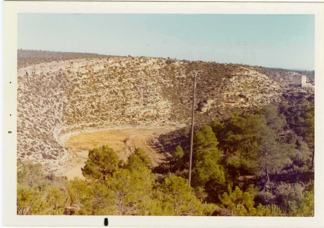
25-26/TH/0D/314.- Aspecto general del Cenomaniense.