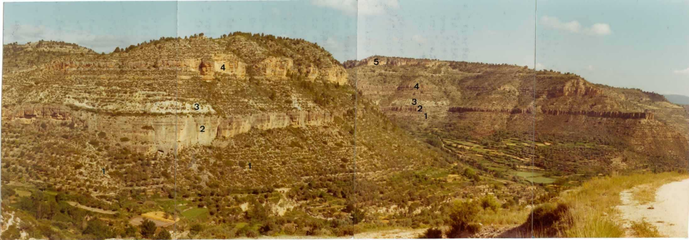
25-26/TH/OD/301.- Panorámica del Cretácico en las proximidades de Enguñados. En la foto: Tramo 1: Albiense (Arenas de Utrillas); tramo 2: Cenomaniense Inferior (Calcarenitas con Ostreidos); tramo 3,4: Cenomaniense Medio-Superior (3, arcillas verdes; 4, dolomías y margas); tramo 5: Dolomías masivas del Turoniense.