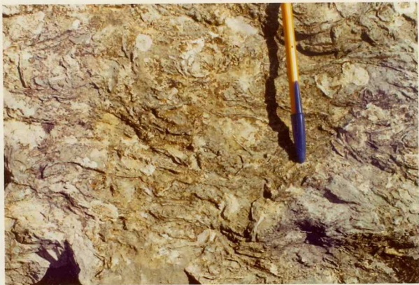
25-26/TH/0D/312.- Detalle de las calcarenitas con Ostreidos del Cenomaniense Inferior.