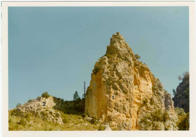
25-26/TH/OD/306.- Jurásico Superior muy tectonizado; Tramo 1: techo del Dogger, tramo 2: Oxfordiense.