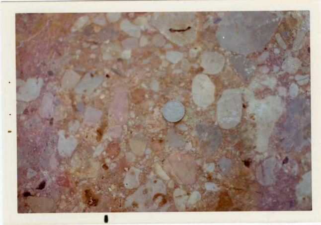
25-26/TH/OD/317.- Detalle de los conglomerados polimícticos del Vindoboniense.