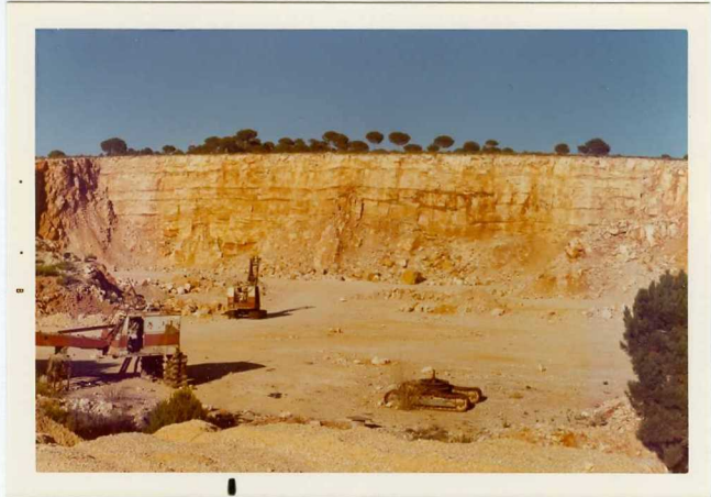
25-26/TH/0D/304.- Dolomías del tramo alto del Dogger.